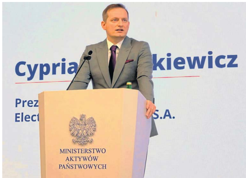
– Pierwszy samochód zjedzie z linii produkcyjnej w Jaworznie w 2029 roku – powiedział na konferencji prezes EMP