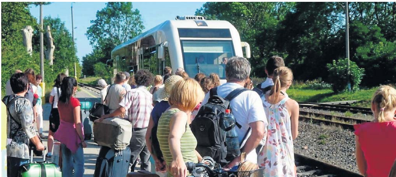
Szynobus na trasie Sławno - Darłowo - Sławno kursuje przez cały rok

I otrzymał w tej sprawie odpowiedź z Ministerstwa Infra-