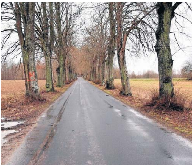
Aleję klonowo - lipową przy drodze pomiędzy miejscowościami Kołczygłowy, Cetyń i Poborowo

Sprawa ochrony alei pojawiła się na początku 2025 roku wraz z planami remontu tej drogi, bowiem w projekcie zamierzano drzewa wyciąć. Pod topór miało pójść około 800 ponad stuletnich lip. Do sprawy włączyli się ekolodzy. Rozpoczęły się głośne protesty. Bytowskie Stowarzyszenie „Nenufar” wystosowało specjalną petycję, pod nią w obronie kaszubskiej alei podpisało się kilka tysięcy osób z całej Polski.