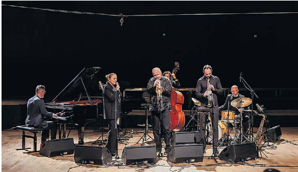
Anna Maria Jopek w towarzystwie wyjątkowych muzyków oczaruje publiczność dziś w Filharmonii Szczecińskiej o godz. 19.

Anna Maria Jopek czaruje publiczność swoim niepowtarzalnym stylem, w którym jazz splata się z muzyką świata, polskim folklorem i współczesną improwizacją. Jej głos: delikatny, a zarazem niezwykle ekspresyjny, potrafi stworzyć intymną atmosferę i przeniesie słuchaczy w przestrzeń pełną emocji. Artystka współpracowała z takimi legendami jak Pat Metheny, Branford Marsalis czy Richard Bona, a każdy jej koncert to wyjątkowe spotkanie z muzyką powstającą tu i teraz.