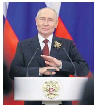
Putin „straszy” Armenię losem Ukrainy

Prezydent Rosji dał do zrozumienia, że wybór na korzyść Brukseli nieuchronnie doprowadzi do rewizji stosunków z Mo-