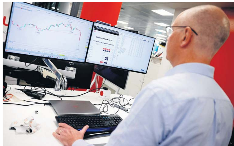
Rynki zareagowały na odrzucenie przez Trumpa odpowiedzi Iranu

„Właśnie przeczytałem odpowiedź od tak zwanych »przedstawicieli« Iranu. Nie podoba mi się to - CAŁKOWICIE NIE DO PRZYJĘCIA! Dziękuję za uwagę poświęconą tej