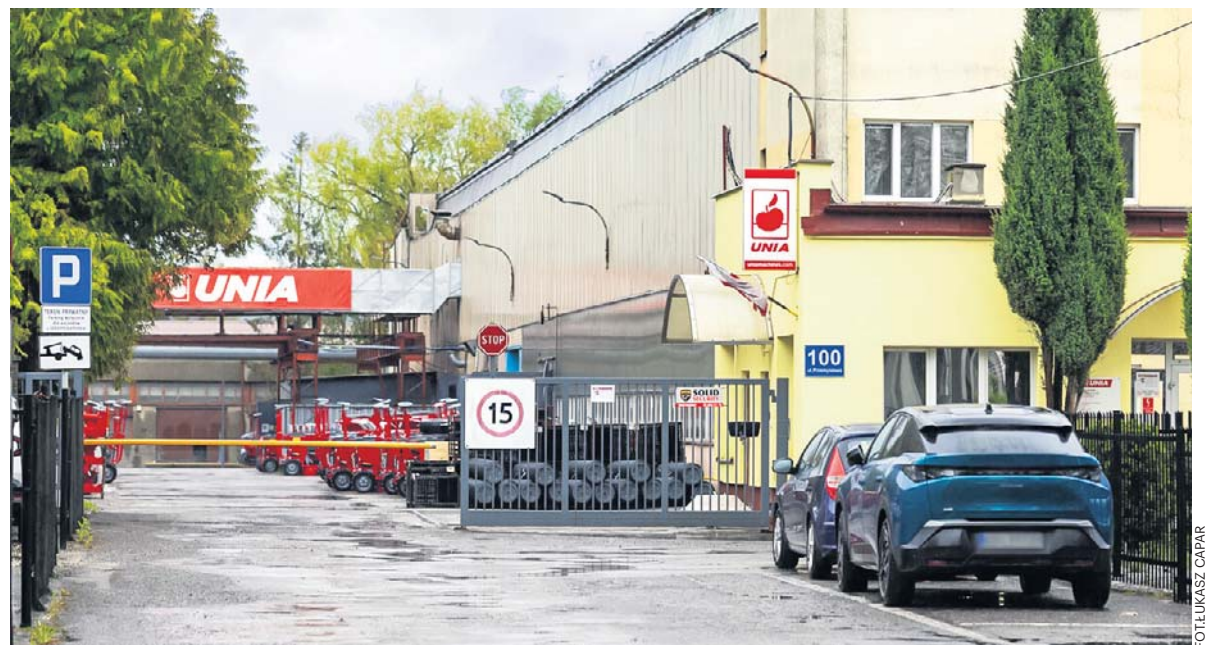
W zakładzie maszyn rolniczych Famarol w Słupsku, należącym do Grupy Unia, pracę może stracić 170 osób

Świat. Donald Trump odrzuca ofertę pokoju Iranu na ofertę pokoju str. 7