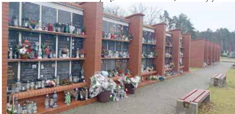
Kolumbarium na cmentarzu w Goleniowie