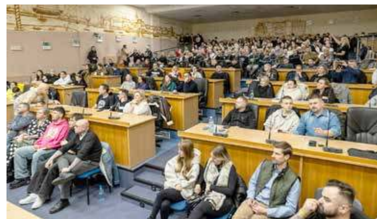
Sala była wypełniona po brzegi