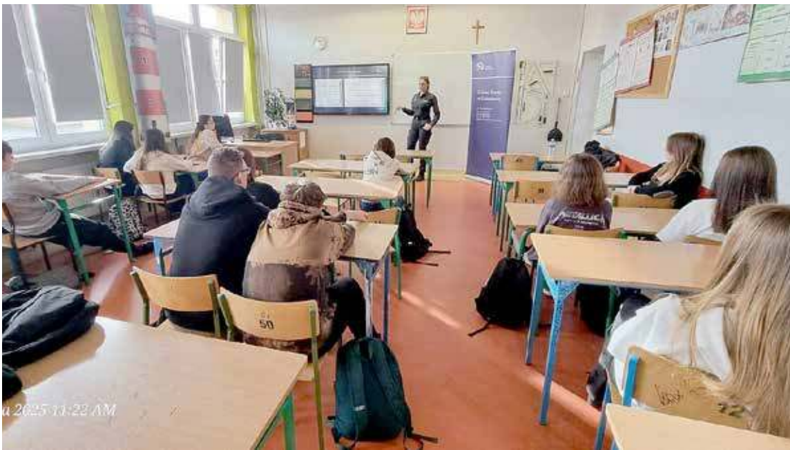
Spotkanie odbyło się w jednej z goleniowskich szkół podstawowych