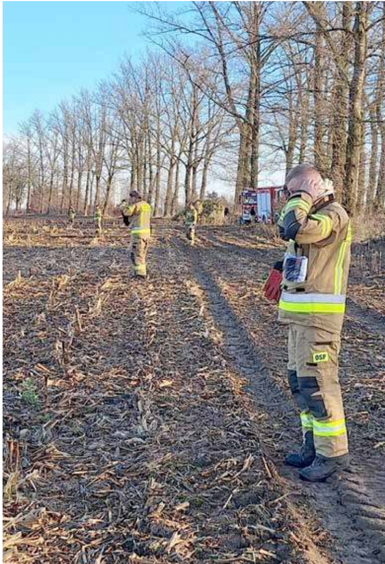
Akcja prowadzona była przez kilka jednostek Straży Pożarnej