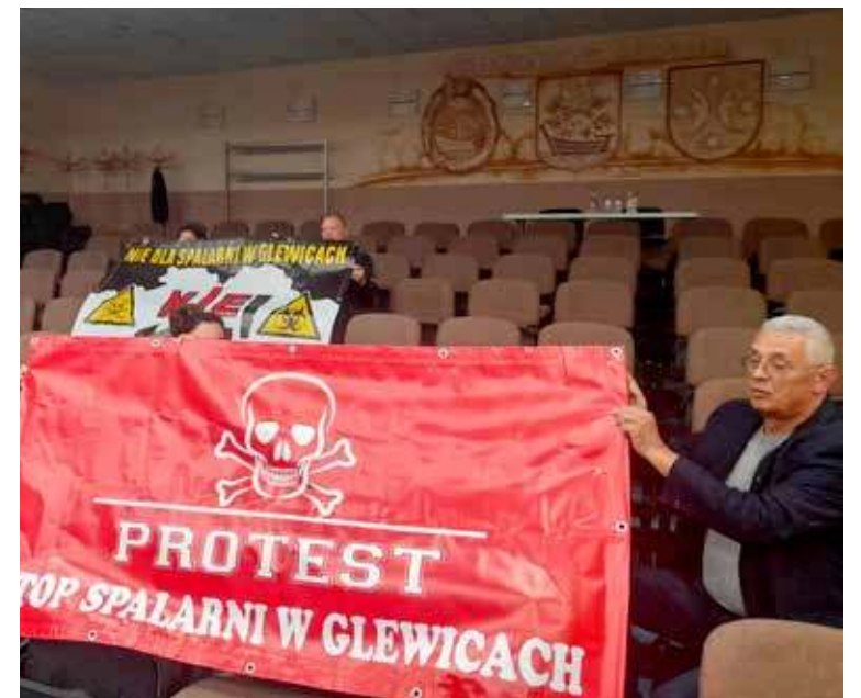
Mieszkańcy przez długi czas protestowali przeciwko budowie spalarni

Sprawa spalarni odpadów medycznych, która miałyby powstać przy lotnisku już od dłuższego czasu wywoływała ostry sprzeciw okolicznych mieszkańców. Obawiali się oni o wpływ tego obiektu na stan powietrza w ich okolicy, a więc i o poziom życia. Jak się okazuje nie muszą już się oni obawiać.