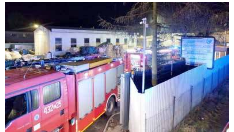
Do zdarzenia doszło w godzinach wieczornych