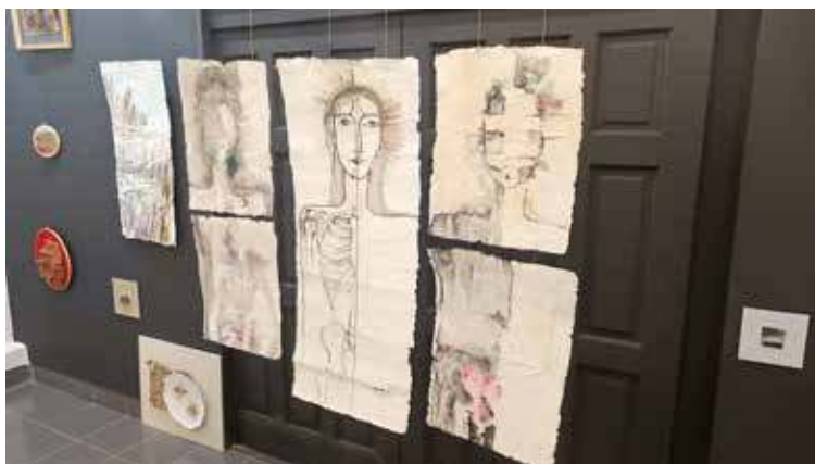
Prace skłaniały do refleksji