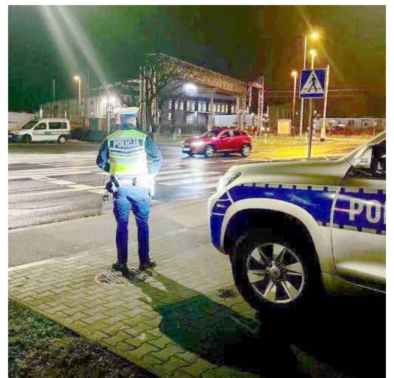
Działania były prowadzone w Goleniowie