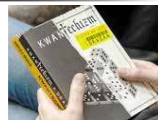
Był też czas na kupno oraz podpisanie książki