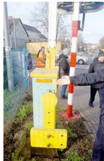
Żółta naklejka znajdować się może z tyłu rogatki lub na krzyżu św. Andrzeja