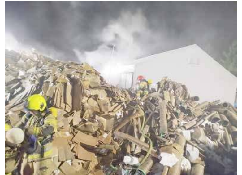
Płonęła hałda papieru