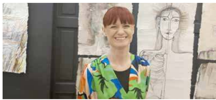
Autorka Agnieszka Chrzanowska-Małys