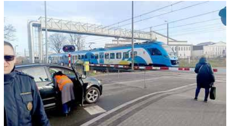
Akcja odbywała się m.in. na przejeździe na ulicy Maszewskiej

Życie pisze jednak różne scenariusze i może się zdarzyć, że samochód znajdzie się na torach, uwięziony przez opuszczone ro-