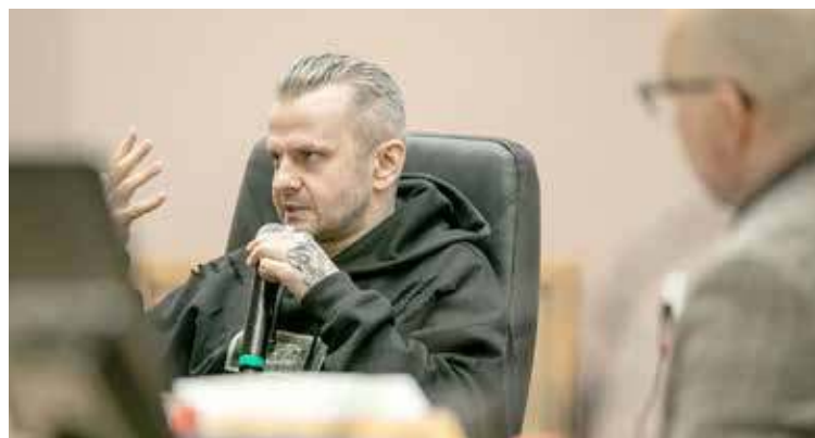
Profesor Andrzej Dragan poruszał zagadnienia naukowe i nie tylko

A kim właściwie był gość? Profesor Andrzej Dragan to istny człowiek renesansu. Jest to wybitny fizyk teoretyk, a zarazem artysta fotograf, kompozytor i twórca filmowy. Na co dzień pracuje na Wydziale Fizyki Uniwersytetu Warszawskiego oraz jako profesor wizytujący na Narodowym Uniwersytecie w Singapurze. Jest także laureatem licznych nagród krajowych i międzynarodowych.