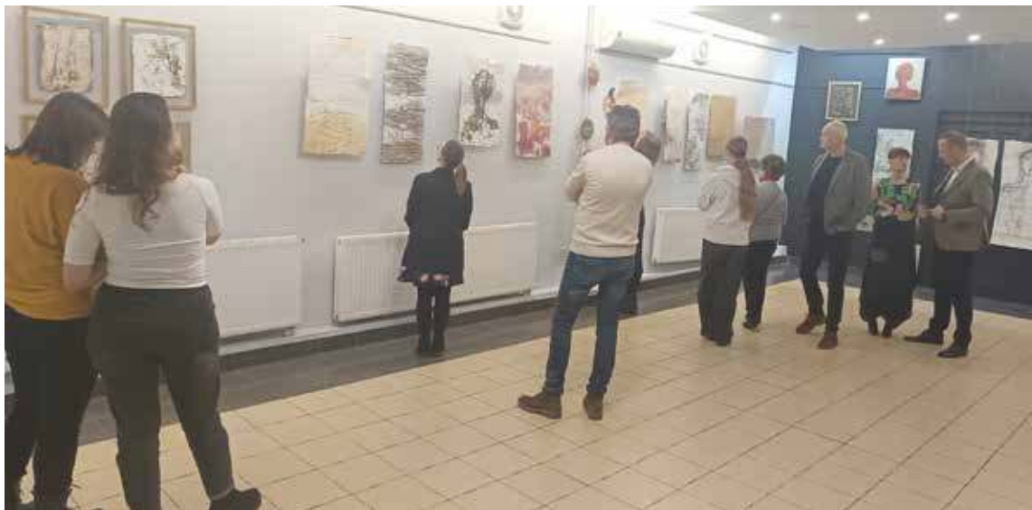
Wernisaz zgromadził pasjonatów sztuki