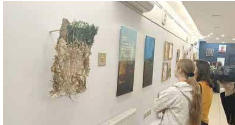
Blizsze obserwacje prac pozwoliły na docenienie ich szczegółów