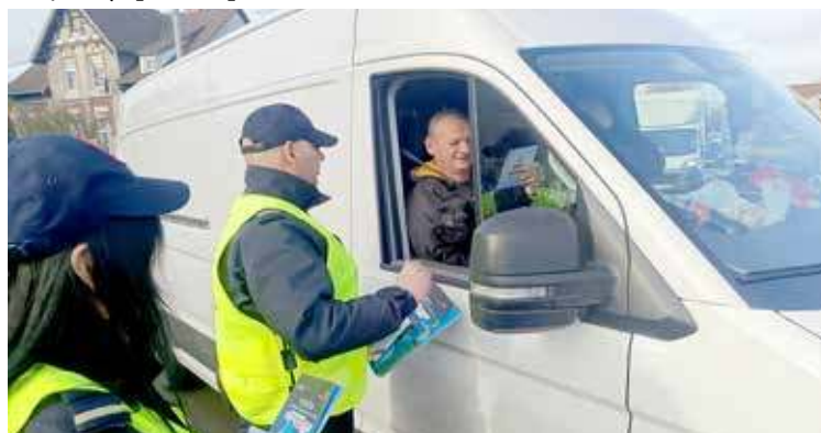
W trakcie akcji przekazywane były informacje i rozdawane były ulotki

gatki. Co wtedy? Priorytetem jest oczywiście zdrowie i życie. Należy jak najszybciej usunąć pojazd, na przykład poprzez zjechać w bok. Jeżeli nie ma innego wyjścia konieczne jest wjechać wprost w szlaban. Są one konstruowane w taki sposób, że ich wyłamanie nie jest problemem dla samochodu. Zaś późniejsza ich naprawa jest łatwa i względnie tania.