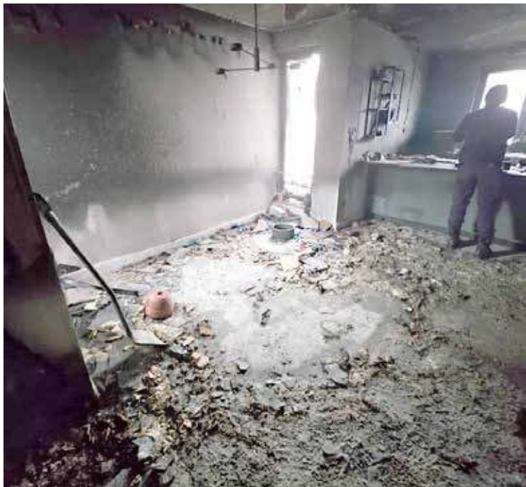
Zniszczenia są znaczne

W ubiegłym tygodniu miał miejsce pożar domu w Kliniskach Wielkich. Teraz zaś stwierdzona została zbiórka w celu pomocy pogorzalcem. Zebrane środki posłużą odbudowie domu.