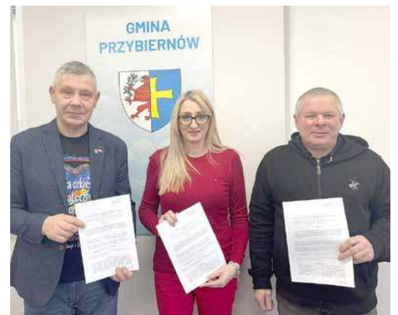
Umowy na realizację zadań sportowych zostały podpisane