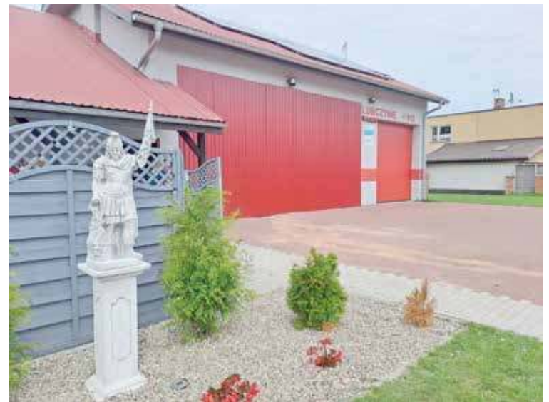
Budynek remizy został naprawiony