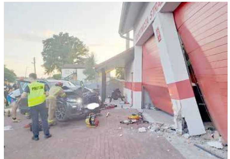
Do zdarzenia doszło w lipcu