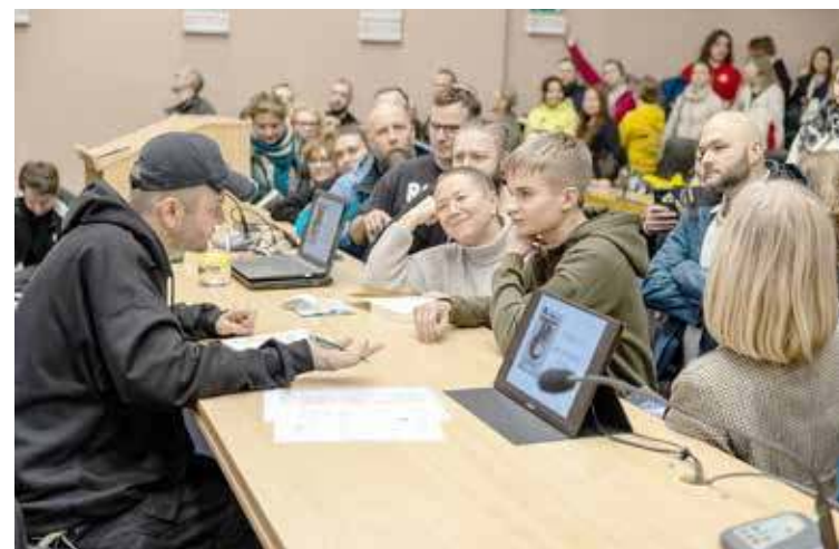
Na koniec był czas na chwilę rozmowy