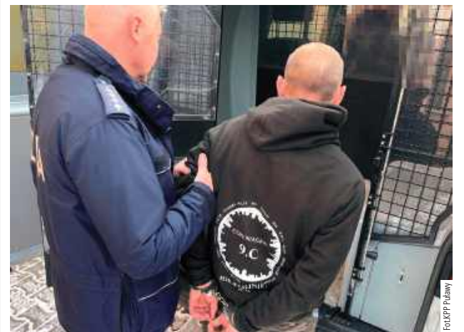
33-latek z gminy Kurów już ma na swoim koncie podobne przestępstwo, dlatego będzie odpowiadał w warunkach recydywy

Trzy najbliższe miesiące w areszcie spędzi 33-latek z gminy Kurów, który jest podejrzany o psychiczne i fizyczne znęcanie się nad matką. Miał wyzywać i szarpać 73-latkę oraz rzucać naczyniami z jedzeniem.