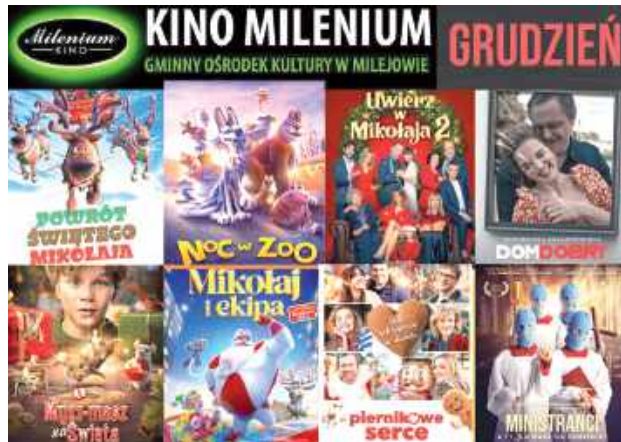
Repertuar kina Milenium w Milejowie

Gminny Ośrodek Kultury w Milejowie opublikował grudniowy repertuar kina Milenium. Elfy - jak żartobliwie pisze GOK - ułożyły listę filmów, które będzie można obejrzeć 6, 7, 13 i 14 grudnia. Wśród propozycji dominują produkcje świąteczne, rodzinne oraz uznane polskie tytuły.