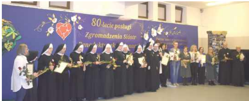
Uroczystość była również okazją do podziękowania Siostrze, księżom i osobom świeckim, dzięki którym Siostry mogą realizować swoje piękne dzieło w Puławach

Z biegiem czasu i w domu przy Czartoryskich zrobiło się ciasno. Siostry stanęły przed trudną decyzją - albo szukać dla siebie i swoich podopiecznych miejsca w innym mieście, albo budować nowy dom tu w Puławach. Dzięki uporowi, Bożej pomocy i ludziom dobrej woli - kapłanom i samorządowcom, którzy wiedzieli, ile dobra niesie działalność Benedyktynki - udało się ruszyć z budową na działce przy ul. Kowalskiego 3a, przekazanej na ten szczytny cel przez Skarb Państwa. Dzięki pozyskanym dotacjom znalazły się również środki na tę ważną inwestycję. Siostry wraz ze swoimi podopiecznymi wprowadziły się tam we wrześniu 2014 r. Od tamtej pory mają do dyspozycji spory obiekt, spełniający wszystkie standardy i dostosowany do potrzeb ich niepełnosprawnych wychowanków. Dzięki wielu akcjom charytatywnym i darczyńcom udało