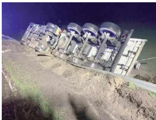
Gdy kierowca zjechał na rozmoczone pobocze, stracił panowanie nad ciężarówką, która przewróciła się na bok i wylądowała w rowie

- Kierowca, chcąc uniknąć zderzenia z samochodem osobowym, którym kierująca jechała zbyt blisko osi jezdni, zjechał z drogi na miękkie pobocze i stracił panowanie nad pojazdem - informuje nadkom. Ewa Rejn-Kozak, rzecznik prasowy