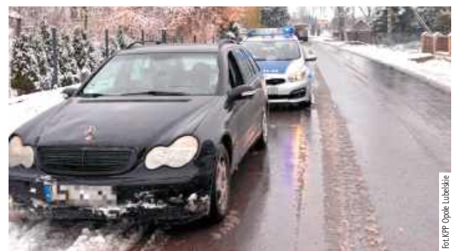
19-letni mieszkaniec gminy Poniatowa został ukarany mandatem w wysokości 200 zł oraz otrzymał 15 punktów karnych

Do niebezpiecznych manewrów doszło na drodze gminnej, gdzie poruszają się również inni uczestnicy ruchu. Policjanci natychmiast podjęli interwencję. 19-letni mieszkaniec gminy Poniatowa został ukarany mandatem w wysokości 200 zł oraz otrzymał 15 punktów karnych.