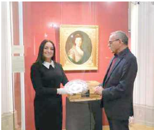
To już kolejny eksponat, przekazany puławskiemu muzeum przez Fundację Rodzinna Blochów w Nowym Jorku. Niebawem będzie można go oglądać w puławskiej placówce