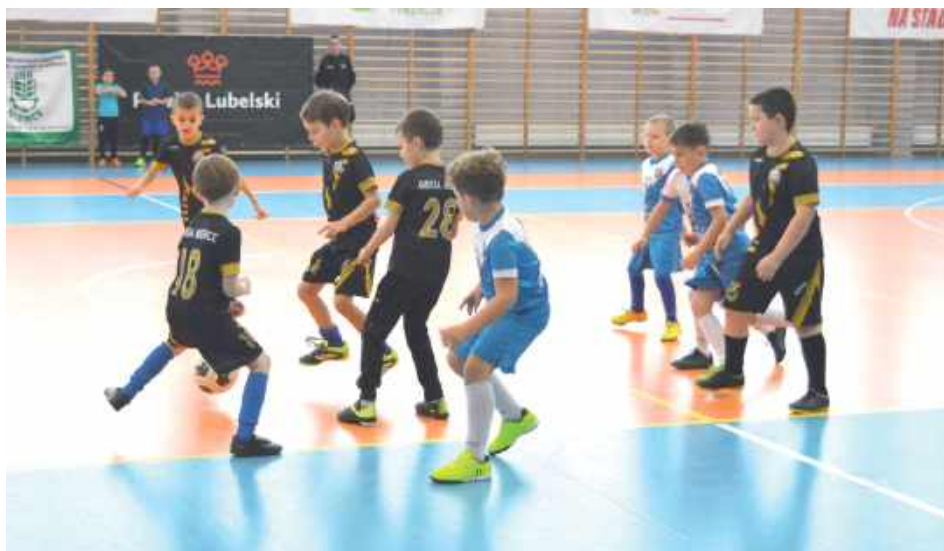
Sportowa rywalizacja najmłodszych piłkarzy jeszcze bez presji wyniku

- Nasze turnieje to już tradycja. Jak co roku część środków finansowych na organi-