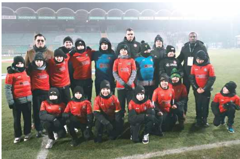
Akademie Górnika Łęczna i Wiary Łęczna nawiązały współpracę. Na zdjęciu adepci szkółki KKS-u wraz z przedstawicielami obydwu klubów

Obecny sezon wydaje się przełomowym. Nie tylko wyniki ekipy seniorskiej mogą budzić zadowolenie, ale przede wszystkim Wiara staje się coraz częstszym kierunkiem dla dzieci z powiatu łęczyńskiego, które nie trenują w strukturach Górnika Łęczna czy innych klubów ościennych. Śmiało można powiedzieć, że w Wierze po-