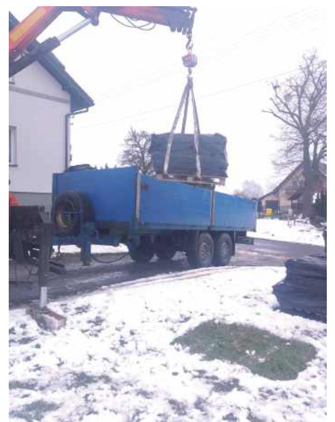
Usuwanie Azbestu z terenu gminy Spiczyn

Usuwanie azbestu to kluczowy element poprawy jakości życia mieszkańców. Materiał ten, powszechnie stosowany w budownictwie w ubiegłych dekadach, jest dziś uznawany