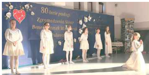
Z okazji jubileuszu specjalny program artystyczny przygotowali wychowankowie Sióstr. Warto zwrócić uwagę na fakt, że są to dzieci i młodzież z niepełnosprawnościami