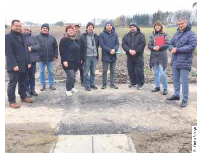
Władze i użytkownicy sieci kanalizacyjnej w gminie Spiczyn

Gmina Spiczyn zakończyła jeden z kluczowych projektów komunalnych.