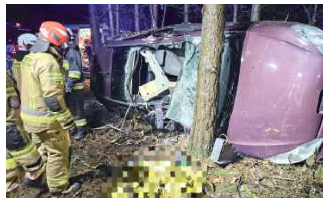
Zginął 32-letni mieszkaniec gminy Michów

Do śmiertelnego wypadku doszło 26 listopada przed godz. 22.