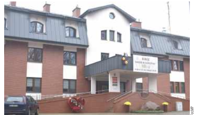
w 2014 r. Siostry Benedyktynki przeprowadziły się do budynku przy ul. Kowalskiego, tu prowadzą swój ośrodek i szkoły