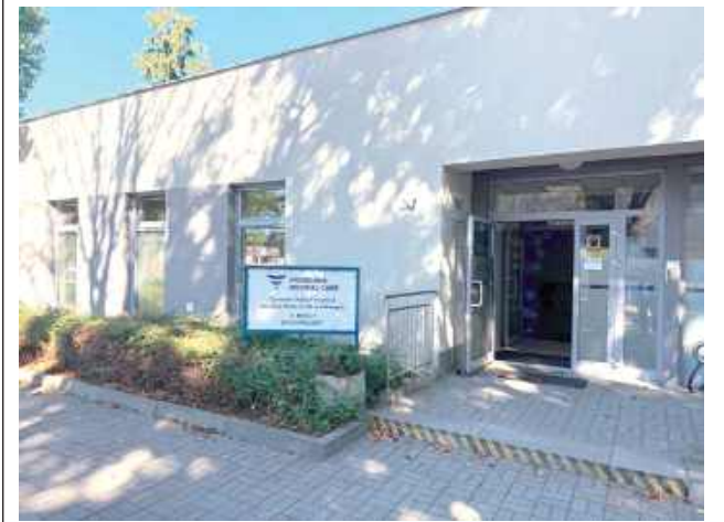
Stacja dializ Fresenius Care znajduje się na terenie puławskiego szpitala

Puławska Stacja Dializ rozpoczęła działalność w ramach sieci Fresenius Nephrocare Polska w 2005 roku. Od tego czasu stała się kluczowym elementem lokalnego systemu ochrony zdrowia, oferując mieszkańcom regionu skuteczne i bezpieczne leczenie przewlekłej choroby nerek (PChN). Dziś ma pod opieką ponad 100 pacjentów.