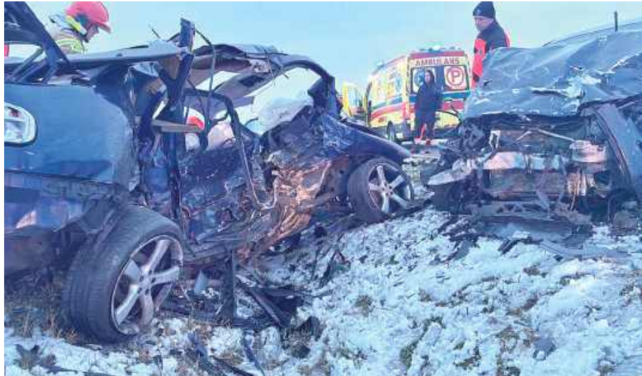
34-letni kierowca Seata Toledo, wyprzedzając inny pojazd na łuku, zderzył się czołowo z jadącym z naprzeciwka BMW

Ze wstępnych ustaleń funkcjonariuszy wynika, że