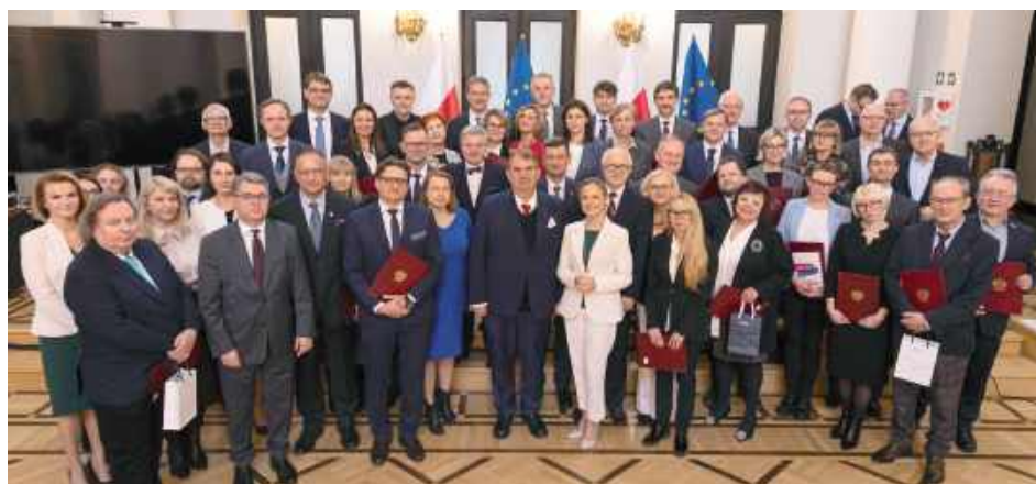
Laureaci Nagród Ministra Zdrowia

- Pracownicy Uniwersytetu Medycznego w Lublinie znaleźli się w gronie tegorocznych laureatów Nagród Ministra Zdrowia przyznawanych za wybitne osiągnięcia naukowe, dydaktyczne oraz za całokształt dorobku.