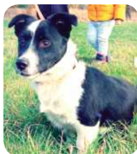
Odi, Leoś, Krasienin Kolonia