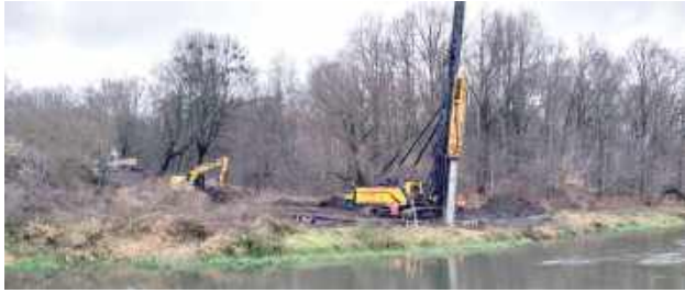
Praca palownicy nad brzegiem rzeki Wieprz

W ramach projektu „Wdrożenie elementów zielonej sieci dla Miasta Łęczna” zakończono pierwszy techniczny etap budowy kładek nad rzekami Wieprz i Świnka. W dolinie rzek palownica wbiła 43 prefabrykowane pale żelbetowe