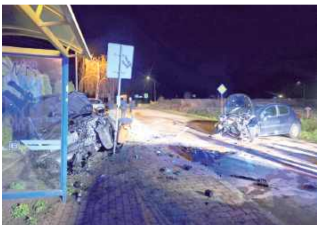
Choć wygląd aut po zdarzeniu może świadczyć o tym, że osoby nimi podróżujące odniosły poważne obrażenia, tym razem skończyło się tylko na ogólnych potłuczeniach

- 54-letnia mieszkanka gm. Żyrzyn kierująca Peugeotem, skręcając w lewo, nie ustąpiła pierwszeństwa przejazdu jadą-