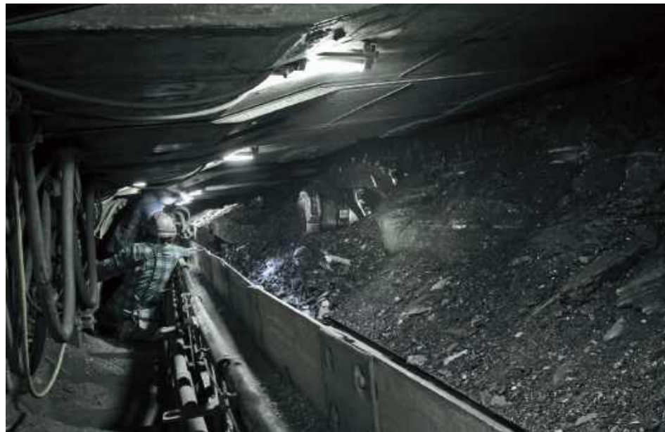
Badanie ma pokazać, jak górnicy widzą przyszłość