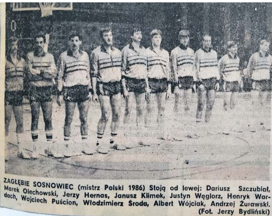
Mistrzowie Polski 1986

Wielu twierdzi, że Amerykanie w kadrze „wygrzają”