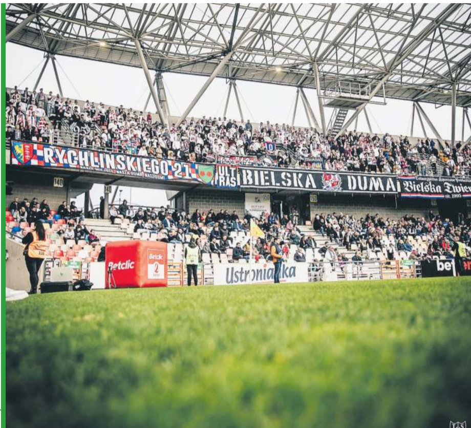
Czy w tej grupie znajdowali się inicjatorzy zadymienia stadionu na ostatnich derbach Bielska-Białej?