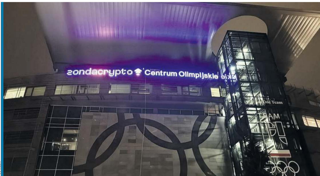
Zondacrypto im. Jana Pawła II. Diabeł by tego nie wymyślił...

Zondzi w Szczecinie, zondzi w... Tu i ówdzie jeszcze rządzi, ale... już nie wypląca. Tak chytrze i niby zabawnie reklamowano się od pewnego czasu na bandach stadionów. I mało kto zwracał uwagę, że akurat na bandach. A od bandy dość blisko przecież do... gangu. I takich samych metod. Zabawa z ortografią? Niestety, także zabawa z logiką łatwowiernych i zabawa z polskim sportem. A ten od lat 50. ubiegłego wieku kojarzy się u nas z pewną grą losową. To Totalizator Sportowy, zwany potocznie totolotkiem. On pierwszy podpiął się pod sport. Reklamował się, przekonywał, że wspiera 49 dyscyplin, przy okazji trochę zarabiał, a z odsetek budował nam obiekty. Nęcił wygranymi, kusił Polaka szaraka, bo obiecywał mu milion co tydzień. I miał te miliony! Biednych, którym po cichu trzepał kieszenie, bo trudno napisać, że drenował, skoro wtedy przeciętny obywatel ledwie „wiązał koniec z końcem za te polskie dwa tysiące”. „To jest gra, jednemu zabierze, drugiemu da”. Zapomniane już hasło cwaniaków, nie tylko z bazaru Różyckiego na warszawskiej Pradze. Byli prawie na każdym targu, w co drugim miasteczku. Proponowali zabawę z kośćmi i trzema kubkami albo ze znaczone kartami. Zawsze zatrzymywali się przy nich biedni i łatwowierni, bo prosty człowiek zawsze szuka łatwego zarobku. Bawiono się z nimi często za ich ostatni grosz... W ogłoszeniach prasowych w nieodległym wciąż jeszcze PRL roito się