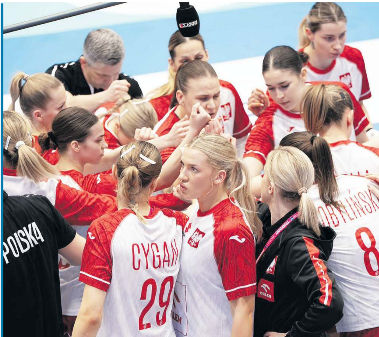
Do grudnia zostało sporo czasu, ale Biało-czerwone już muszą myśleć, co zrobić, aby przed własną publicznością wypaść jak najlepiej.

Biało-czerwone ruszą do boju 5 grudnia i faktycznie rozpoczną od meczu z Francuzkami. Dwa dni później podejmą Ukrainki, a 9 grudnia Wyspy Owcze. Wszystkie spotkania rozpoczynają się będą o 18.00, a ich areną zmagani grupy E będzie katowicki Spodek. I właśnie ta legendarna hala stanie się kluczowym miejscem turnieju, bo poza sześcioma meczami grupowymi 11, 13, 15 i 16 grudnia odbędą się w niej mecze fazy głównej (awansują do niej po dwa zespoły z każdej z sześciu grup), półfinały (18 grudnia, 17.45 i 20.30), a także mecze o brązowy i złoty medal (20 grudnia, 15.15 i 18.00). W sumie w Spodku rozegrane zostaną 23 mecze, a poza nim i Antalya Sports Hall halami Euro będą: Arena Brno, Tivoli Arena (Bratysława), BT