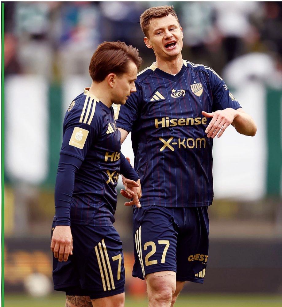
Na mecz z Lechią w Częstochowie na szybko musieli szukać kompletu strojów bez nazwy Zondacrypto.

Na Górnym Śląsku wielkim marzeniem było, aby w finale Górnik spotkał się z GieKSą. Raków te plany zniweczył, co tylko spotęgowało wyczekiwanie na sukces 14-krotnego mistrza Polski na pierwsze od dekad