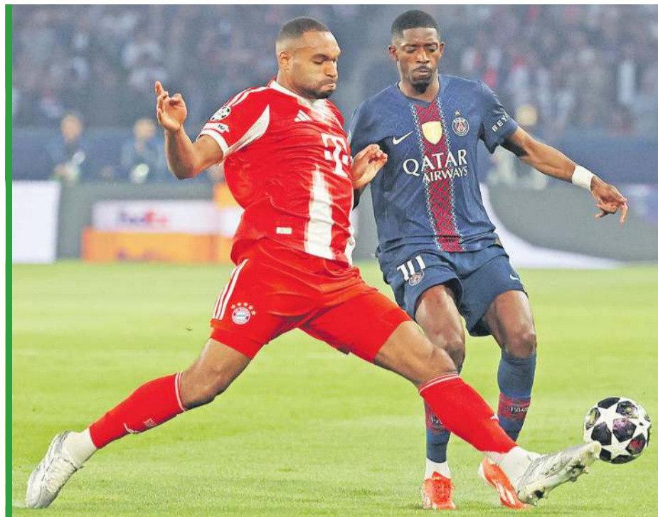
Ousmane Dembele (z prawej) ustrzelił dublet, pomagając PSG w wygranej.

I choć Belga brakowało w pobliżu linii bocznej, obolały po pięciu ciosach Bayern zareagował odpowiednio. Sprawił, że druga połowa poziomem dorów-