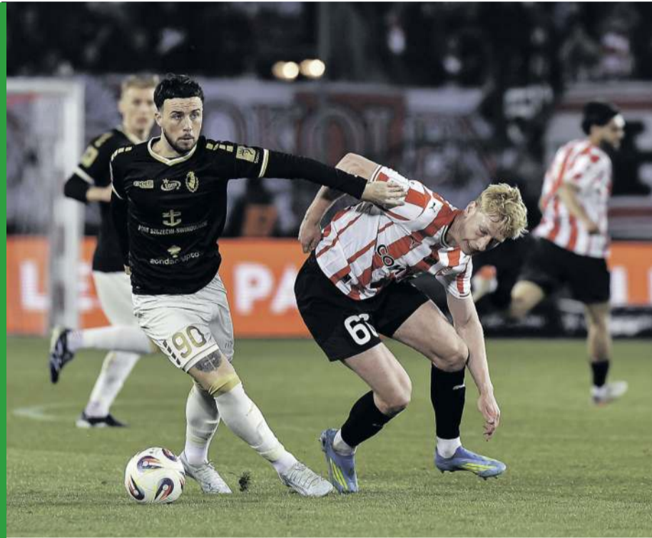
Pogoń i Cracovia nie mogą czuć się bezpiecznie.

Przedostatnia w tabeli jest Arka i wiele wskazuje, że pozostanie na tym miejscu. Do bezpiecznej strefy