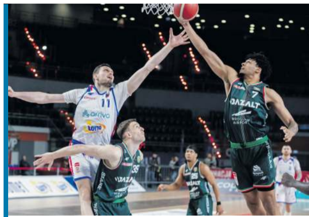
W Toruniu w Kujawsko-Pomorskiej Arenie kibice niespodziewanie obejrzeni szalenie zacięty mecz.

TORUŃ: Cousins 15, Persons 30 (6x3), Szlachetka 20 (3x3), Langović 17 (1x3),