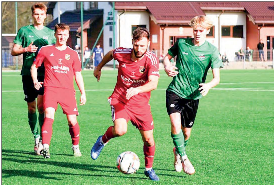
Wilga Garwolin pokonała u siebie Józefówię Józefów 3:1

- W Dniu Kobiet zwycięstwo dedykujemy naszym żonom,