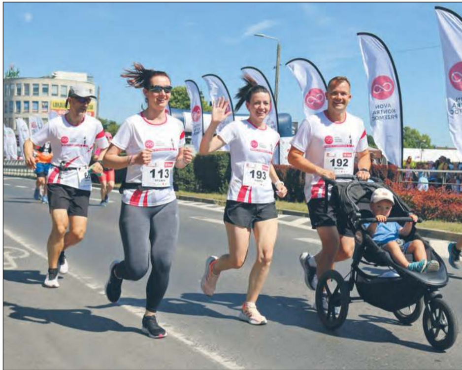
15 czerwca wystartuje 16. edycja biegu „Avon Kontra Przemoc - biegnij w Garwolinie”. To nie tylko okazja do sportowej rywalizacji, ale też sposób na wsparcie osób dotkniętych przemocą

Tegoroczna impreza oferuje trzy trasy: 2 km dla rodzin i początkujących, 5 km dla bardziej ambitnych oraz 10 km dla doświadczonych biegaczy. Start zaplanowano na moście na rzece Wildze, a trasa poprowadzi głównymi ulicami miasta. Bieg Rodzinny ruszy o 9:45, 5 km o 10:00, a 10 km o 10:10. - Za nami piętnaście edycji biegu, który daje dużo satysfakcji i radości zarówno