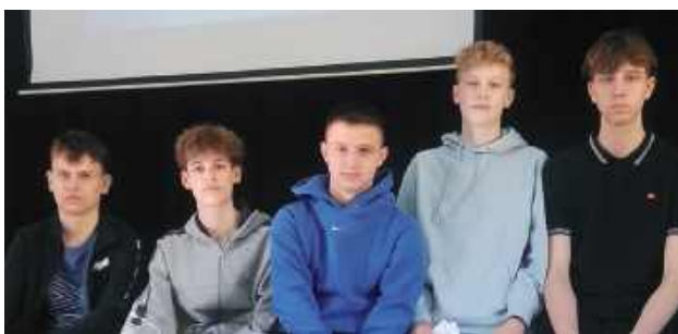
Jeden z zespołów tworzących projekty

Olimpiada „Zwolnieni z teorii” to ogólnopolska inicjatywa, która zachęca młodzież do podejmowania działań społecznych mających na celu rozwiązywanie rzeczywistych problemów.