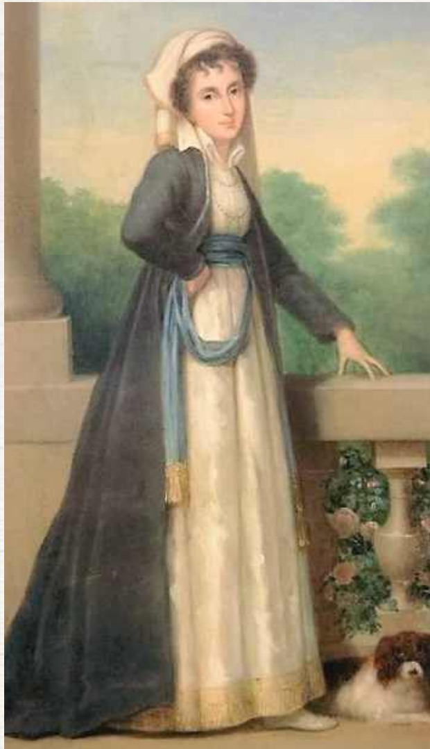
Portret Izabeli z około 1790 roku, czyli na kilka lat przed ukończeniem Świątyni Sybilli i skompletowaniem jej wyposażenia. Powstał prawdopodobnie w Londynie, skąd księżna przywiozła do Puław wiele cennych, przynajmniej jej zdaniem, zabytków