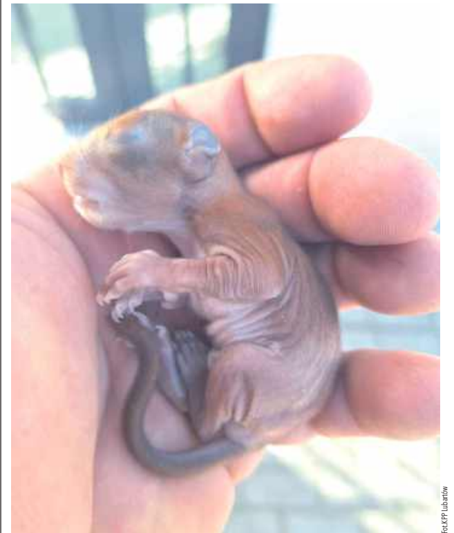
Wiewiórka, którą uratowali lubartowski policjanci

Dyżurny KPP w Lubartowie otrzymał 4 kwietnia zgłoszenie, że na ul. Lipowej w Lubartowie pod drzewem leży małe zwierzę, które jest całkowicie bezradne. Policjanci, którzy przybyli na miejsce, zauważyli małą wiewiórkę, która prawdopodobnie wypadła z dziupli. Stworzenie było zbyt małe, żeby samodzielnie się poruszać. - Funkcjonariusze ostrożnie zabezpieczyli wiewiórkę, aby zapewnić jej cie-