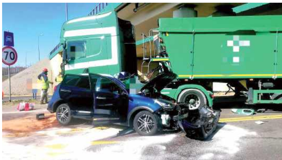
Dwie osoby poszkodowane w zderzeniu zostały przetransportowane do szpitala