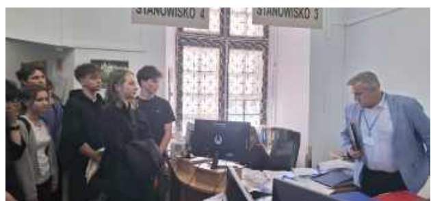
Licealiści poznali pracę niektórych wydziałów starostwa

- W ramach wiedzy o społeczeństwie uczniowie udali się do Starostwa Powiatowego. Młodzież miała okazję bliżej przyrzeć się pracy w wydziale Komunikacji, Transportu i Drogownictwa oraz w wydziale Geodezji, Kartografii, Katastru i Nieruchomości. Uczniowie porozmawiali z sekretarzem po-