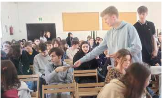
Autorzy projektów wymieniali się doświadczeniami z kolegami