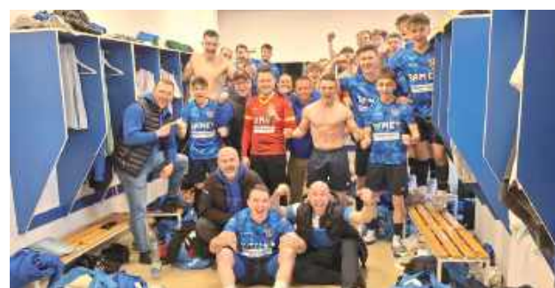
Gracze Opolanina wygrali ze Startem. Niestety w weekend doznali wysokiej porażki z Janowianką