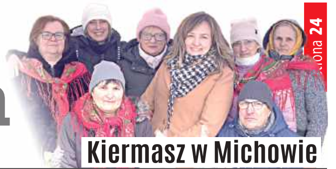
Kiermasz w Michowie

LUBARTÓW ■ KOCK ■ OSTRÓW ■ ABRAMÓW ■ FIRLEJ ■ JEZIORZANY ■ KAMIONKA ■ MICHÓW ■ NIEDŹWIADA ■ OSTRÓWEK ■ SERNIKI ■ UŚCIMÓW ■ NIEMCE