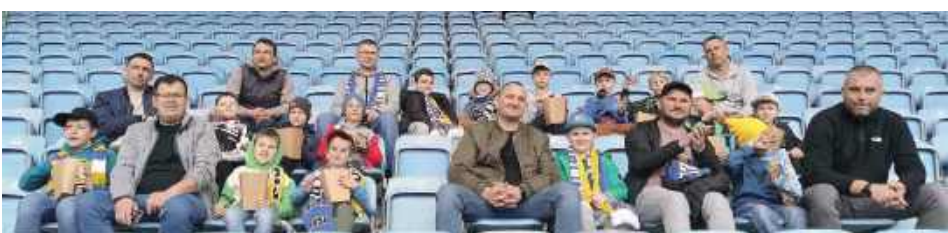
Wydarzenie stanowiło nie tylko sportowe przeżycie, ale także doskonałą okazję do integracji zawodników, trenerów i rodziców

Rocznik 2017 grupy białe i niebieskie z Akademii Piłkarskiej MOSiR Lubartów miał niepowtarzalną okazję uczestniczyć w meczu Ekstraklasy pomiędzy Motor Lublin a Stalą Mielec.