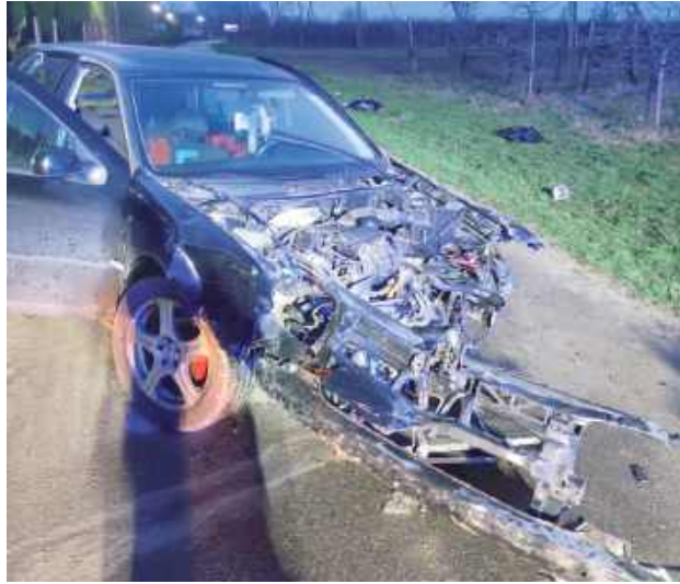
Zarówno kierowca, jak i pasażer ze zdarzenia wyszli bez szwanku

Na miejscu policjanci zastali jednak 21-letniego pasażera