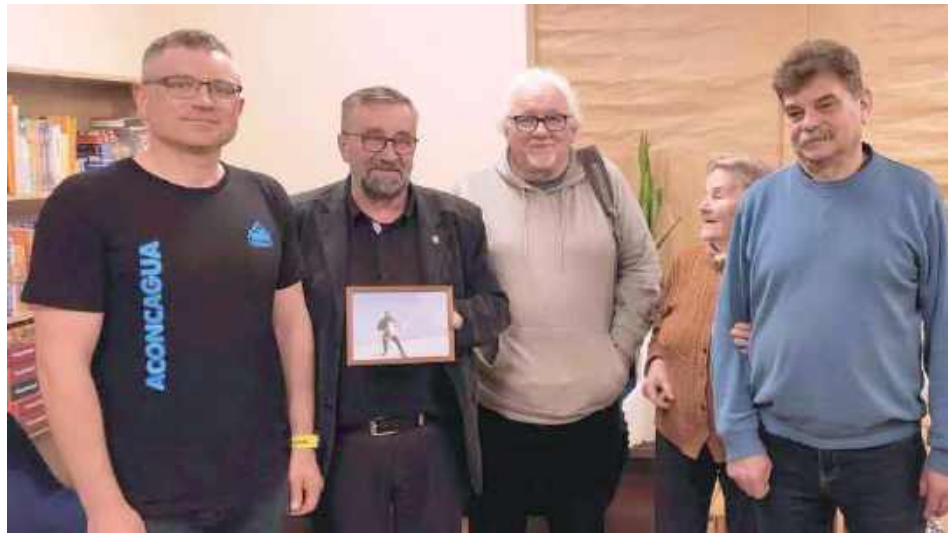
Opowiadał o swoich pasjach i podróżach w rodzinnej miejscowości

Podczas spotkania opowiedział o swojej pasji do górskich wypraw, dzięki której zdobył już trzy szczyty należące do Korony Ziemi: Mont Blanc (4810 m), Denali (6190 m) oraz Aconcaguę (6962 m). Jak