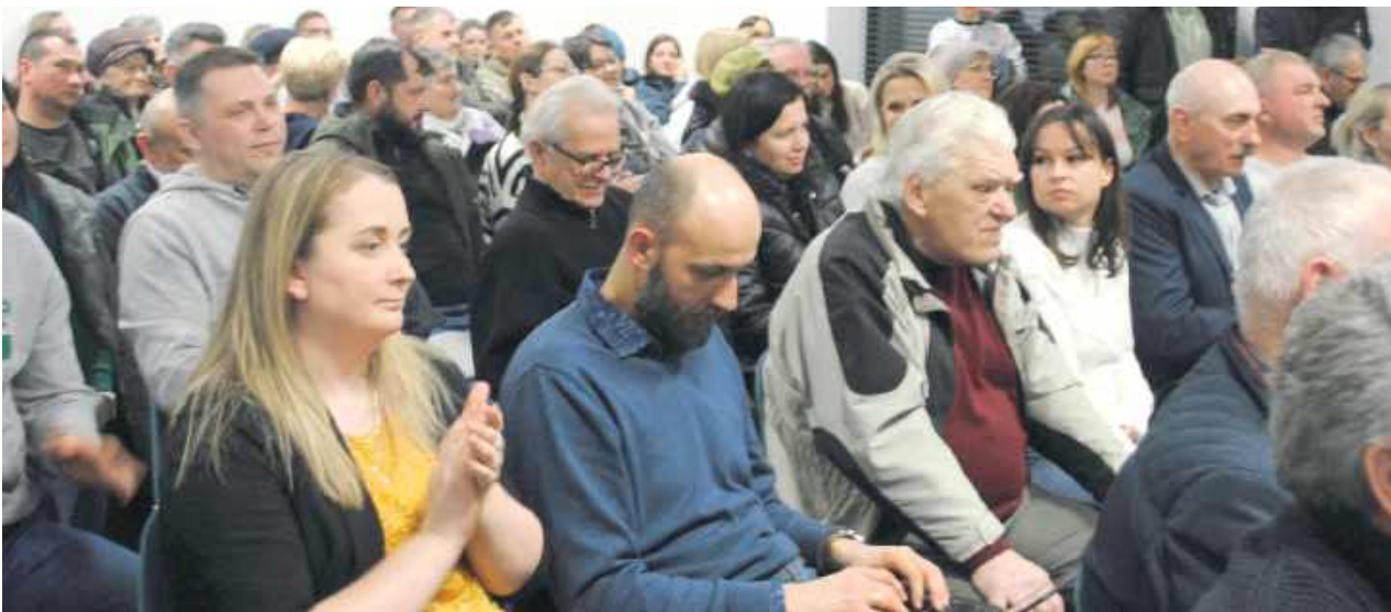
Mieszkańcy Skrobowa na zebraniu w sprawie planowanej budowy stacji odzysku surowców

- Przy użyciu wszelkich środków będziemy dążyć do niedopuszczenia realizacji tego projektu w Skrobowie Kolonii - piszą do kurii mieszkańcy wsi. Bronią się przed inwestycją, którą chce tam budować Pontes sp. z o.o. - firma należąca do lubelskiej Kurii Metropolitalnej. W Skrobowie Kolonii miałyby powstać stacja odzysku surowców wtórnych z cementarzy.