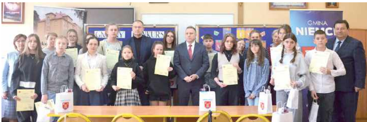
Uczestnicy konkursu oraz władze gminy Niemce i organizatorzy ortograficznego współzawodnictwa