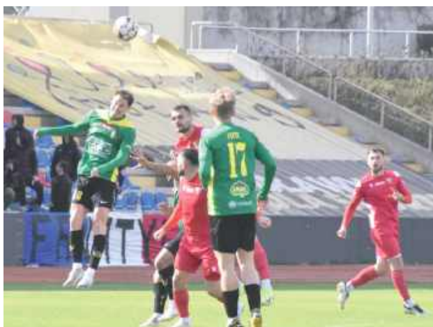
Wisłacy znow przegrali. Puławianie plasują się w strefie spadkowej...