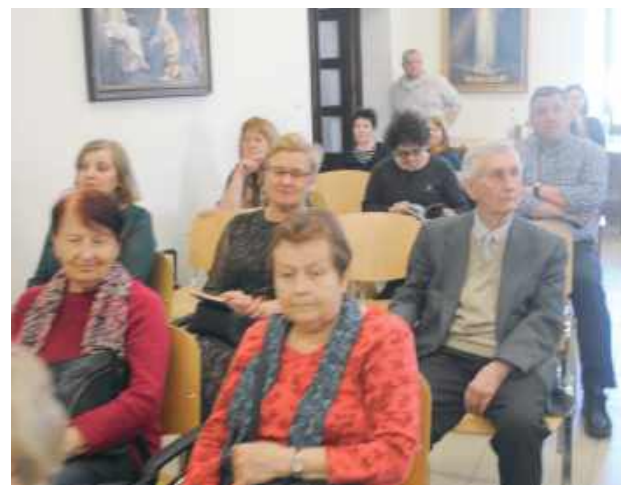
Publiczność na spotkaniu z regionalistką

po cmentarzu czasem się przedłużają. Tak było np. ze spacerem szlakiem grobów lubartowskich nauczycieli. Uczestnicy przechadzki sami wskazywali groby swoich