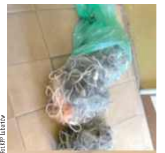
Sieci znalezione u kłusownika

Funkcjonariusze Polskiego Związku Wędkarskiego znaleźli węcierze służące do nielegalnego połowu ryb. Zawiadomili policję. Policjanci wraz ze Strażą Rybacką ustalili prawdopodobnego sprawcę nielegalnego połowu, którym okazał się 48-letni mieszkaniec gminy Uścimów. W czasie przeszukania posesji mężczyzny znaleziono osiem siatek do połowu ryb i ubrania służące do połowu. Policjanci zabezpieczyli znaleziony sprzęt - informuje mł. asp. Jagoda Maj. 48-latek odpowie za nielegalny połów ryb, przy pomocy na-