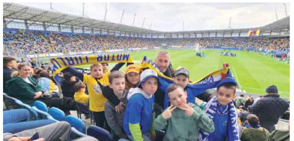
Mali kibice na meczu