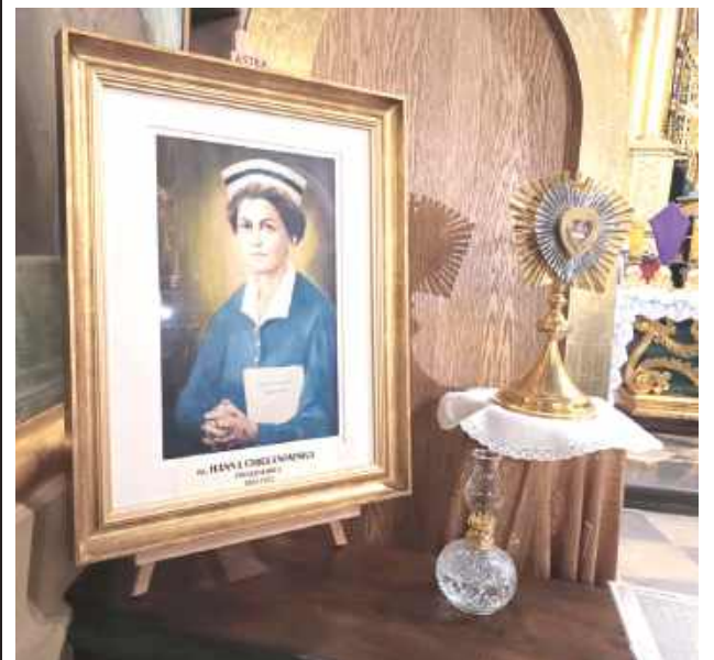
Od środy do soboty relikwie będą przebywać w Hospicjum św. Anny

Hanna Helena Chrzanowska była pielęgniarką, działaczką charytatywną, pisarką, pedagogiem (m.in. napisała podręcznik pielęgniarstwa), prekursorką pielęgniarstwa rodzinnego, domowego i parafialnego. W 2018 r. została ogłoszona błogosławioną przez papieża Franciszka. Jest patronką środowisk medycznych.