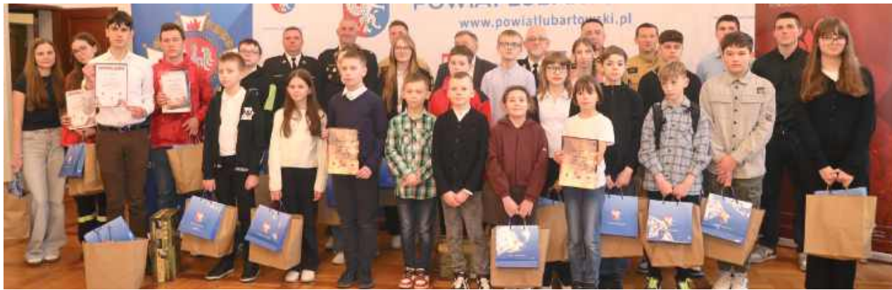
Uczestnicy turnieju pożarniczego

W powiatowym etapie Ogólnopolskiego Turnieju Wiedzy Pożarniczej „Młodzież Zapobiega Pożarom” młodzież odpowiadała na pytania testowe o zróżnicowanym poziomie trudności. Kolejnym etapem był egzamin ustny.