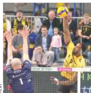
Trwa świetny sezon Bogdanki LUK