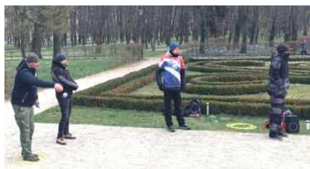
W niedzielę frekwencja nie dopisała - zimno odstraszyło część miłośników gry