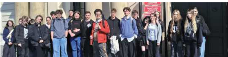
Licealiści z ZS 2 odwiedzili starostwo w Lubartowie

Klasa III P humanistyczno-prawnicza odwiedziła lubartowskie starostwo.