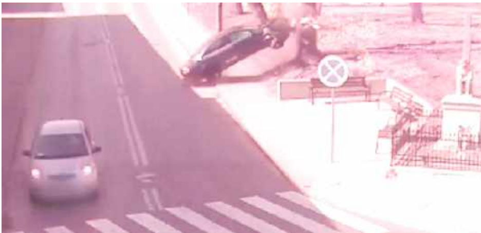
Młody kierowca skręcił z ul. Poniatowskiego w ul. Szkolną, a następnie, nie dostosowując prędkości do warunków ruchu, stracił panowanie nad pojazdem, zjechał z jezdni, wjechał na chodnik, po czym uderzył w tablicę ogłoszeń, którą uszkodził. Audi zatrzymało się dopiero na drzewie rosnącym przy drodze

- Całe szczęście w wyniku tego groźnie wyglądającego zda-