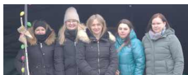
KGW w Chudowoli