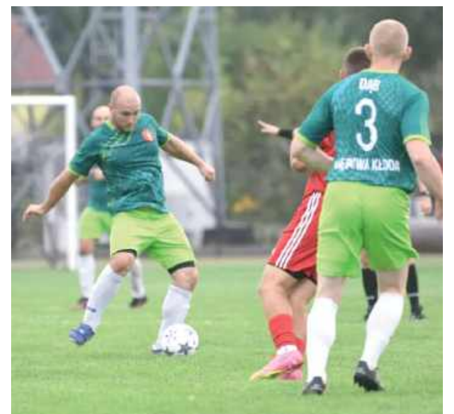
Dąb zaczął od remisu