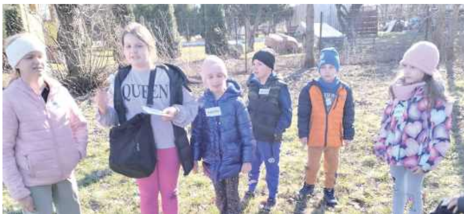
W programie była gra terenowa

- 13 kart z poleceniami, rebusami, krzyżówkami, labiryntami, zagadkami, układankami. Dowiedzieliśmy się, jak wykorzystać telefon w trakcie gry terenowej. Wykorzystaliśmy skaner do kodów QR, dzięki temu posłuchaliśmy m.in. opowieści o sierocińcu dla słoń, poznaliśmy aplikacje do tworzenia zwierząt 3 D, wykorzystaliśmy aparat w telefonie do rozszyfrowania wiadomości napisanej w formie lustrzanego odbicia. Okazało się