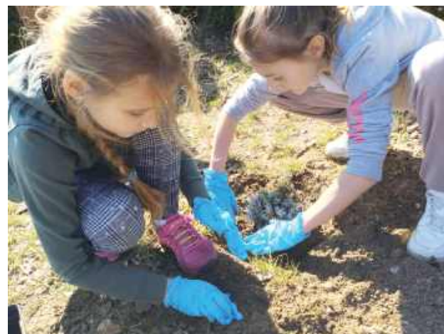
Sadzeniem lawendy zajęły się dziewczyny. Jesienią suszona lawenda może być elementem suchego bukietu, można ją też włożyć do tkaniowych saszetek i umieścić w szafach z ubraniami

Wraz z nadejściem wiosny kontynuowane są prace przy upiększaniu terenu wokół szkoły. Dzięki grantowi z Banku Ochrony Środowiska, Fundacja BOŚ, być może już za rok uczniowie będą mogli spróbować pierwszych jabłek z posadzonych przez siebie jabłoni. W szkolnym ogródku swoje miejsce znalazły również truskawki i pachnąca