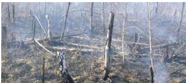
Ogniem objęte były głównie młode drzewa, krzewy oraz runo leśne

Pożaru lasu wybuchł w sobotę, 22 marca w okolicy ścieżki przyrodniczej „Bobrówka”. Następnie płonęły śmieci i opony w Gródku Szlacheckim.