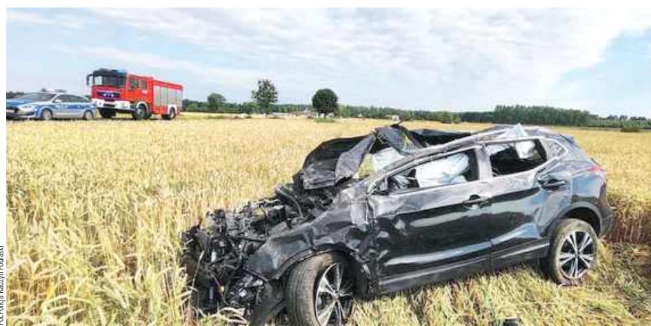
Trajektoria i rotacja pojazdu była na tyle silna, że z pojazdu wypadły na zewnątrz dwie osoby. Jak się okazało, to dwaj 18-latkowie (kierowca i pasażer), którzy ponieśli śmierć na miejscu

- Z ustaleń policjantów wynika, że 18-letni kierujący Nissanem Qashqaiem nie dostosował prędkości do warunków ruchu, w wyniku czego na prostym odcinku drogi zjechał z niej do przydrożnego rowu, a następnie doprowadził do dachowania pojazdu. Trajektoria i rotacja pojazdu była na tyle silna, że