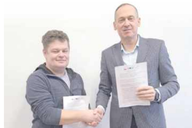
Zadanie realizuje firma ATLANTIK z Radzyna Podlaskiego

W Siemieniu powstaną garaże na zakupiony w ubiegły roku sprzęt komunalny, gmina wyłoniła wykonawcę.