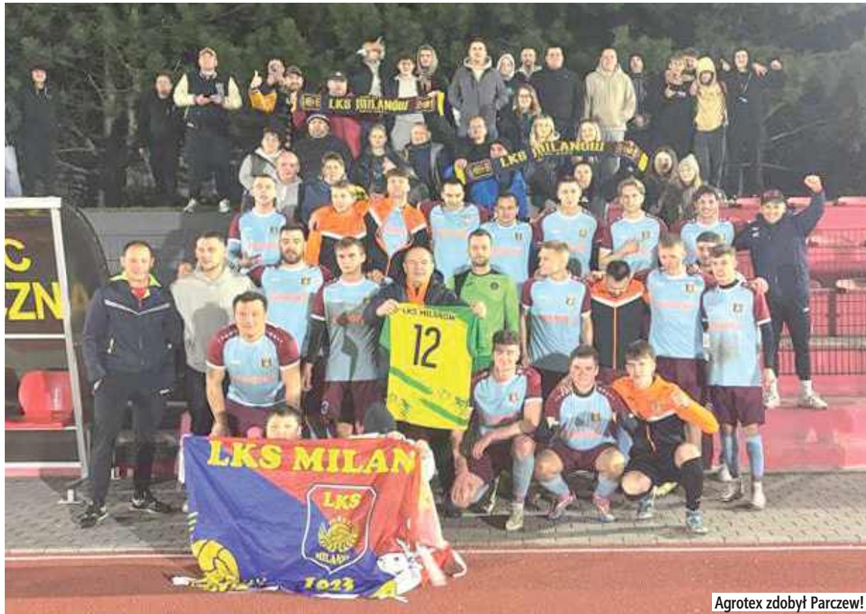
Agrotex zdobył Parczew!