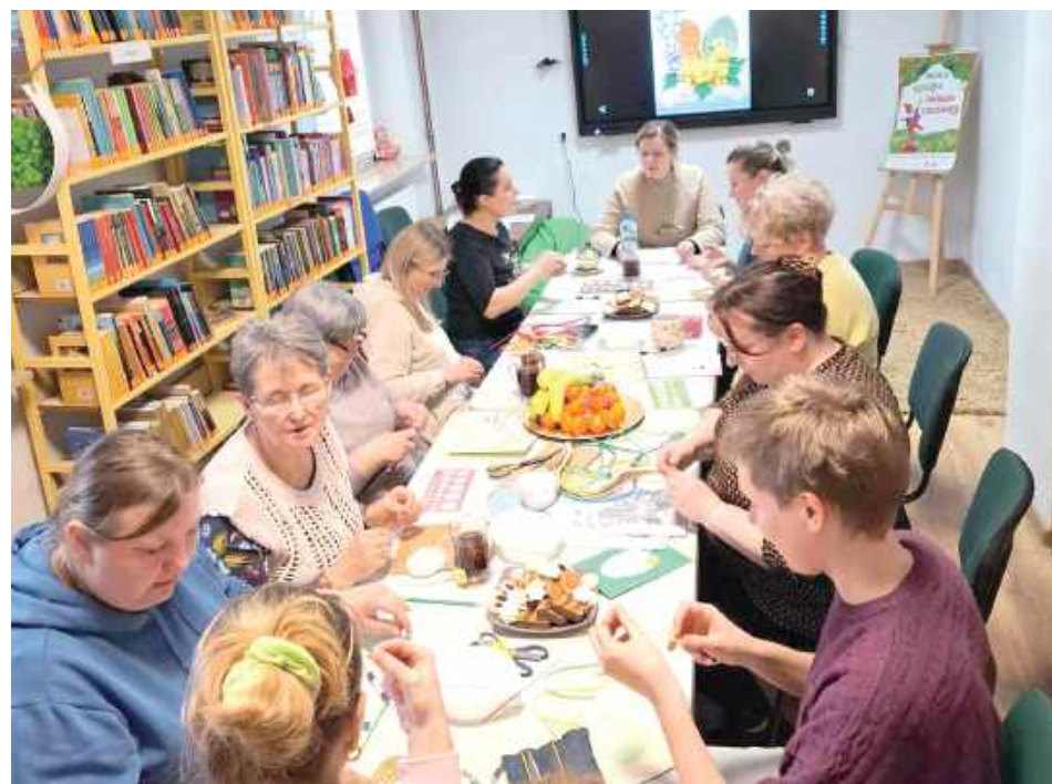
Warsztaty to świetna okazja do wyrażenia siebie, swoich emocji, a także kreatywnego spędzenia wolnego czasu

Milanów: Quilling to metoda tworzenia ozdób ze zwijanych pasków papieru. Quillingiem można zdobić kartki okolicznościowe, tworzyć ozdoby przestrzenne, zachwycające obrazy czy piękne pisanki.