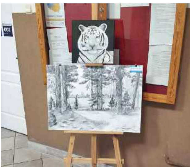
Prace ukazują m.in. naturę