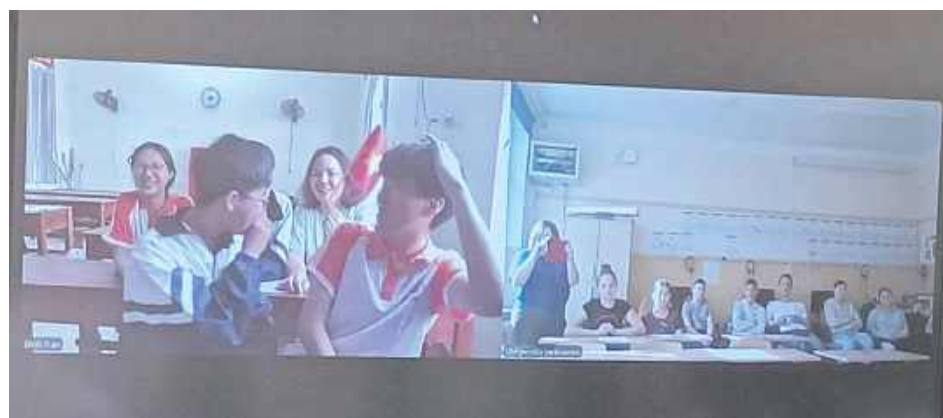
Zadaniem uczniów jest odgadnąć, z jakim krajem się połączyli. W tym celu muszą zadawać odpowiednie pytania, oczywiście po angielsku

Projekt polega na łączeniu się online z innymi szkołami. Zadaniem uczniów jest odgadnąć, z jakim krajem się połączyli. W tym celu muszą zadawać odpowiednie pytania, oczywiście po angielsku. Nauka języka jest więc połączona z zabawą. Po odgadnięciu uczniowie opowiadają o sobie i o swoim kraju. Tym sposobem otwierają się na