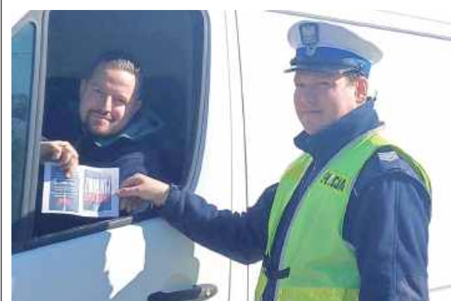
Policjanci wręczali kierowcom materiały informacyjne