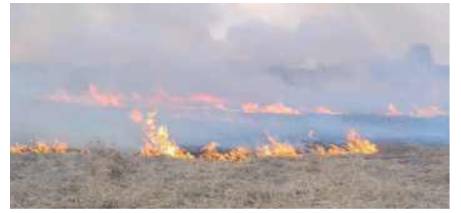
Pożarowi towarzyszyło silne zadymienie

Gmina Siemień: Pożar nieużytków rolnych wybuchł kilka dni temu w miejscowości Pomyków. Spaleniu uległa duża powierzchnia „Doliny Tyśmienicy”.