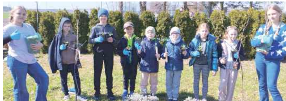
Praca w ogrodzie stała się okazją do zdobycia wiedzy i umiejętności na temat sadzenia roślin, a także do spędzenia czasu na świeżym powietrzu

Milanów: Ogród, jaki powstaje przy Szkole Podstawowej im. Marii Dąbrowskiej w Rudnie, wzbogacił się o nowe sadzonki. Dzieci wysadziły w nim jabłonki IDA-RED, lawendę i truskawki.