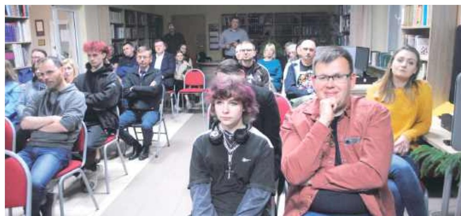
Publiczność na spotkaniu z autorem książki „Porozmawiajmy o muzyce”