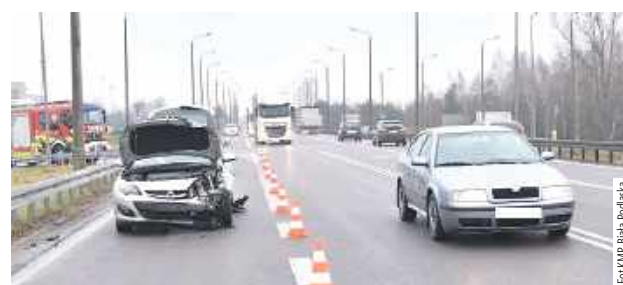
W trakcie prowadzonych czynności funkcjonariusze ustalili, że 40-letni kierowca Seata nie posiadał uprawnień do kierowania

Biała Podlaska: Kierujący Seatem 40-latek zderzył się z osobowym Oplem. Skręcając w lewo, prawdopodobnie nie ustąpił pierwszeństwa osobówce.