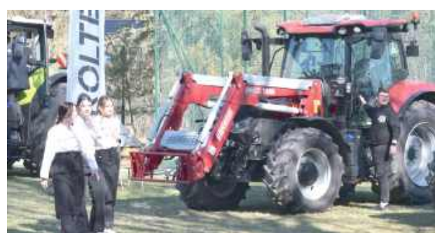
Kobiety na traktory, a czemu nie. Na przyszłych uczniów czeka nie tylko bogata oferta edukacyjna, ale też nowoczesny park maszynowy