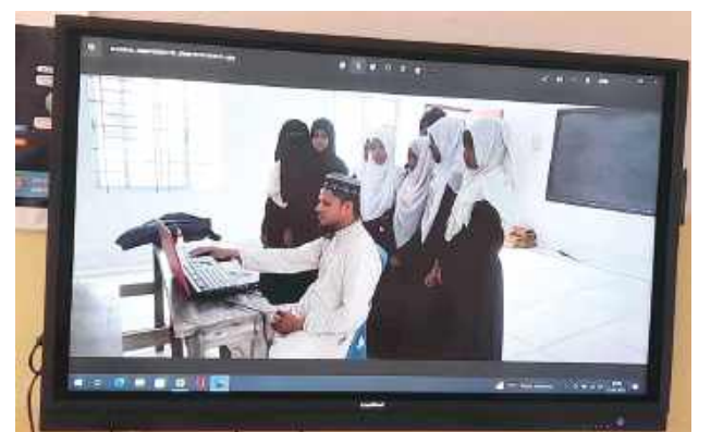
Dzięki projektowi uczniowie poznali kulturę wielu krajów - nie tylko europejskich, rozmawiali z Tajwanem, Wietnamem, Indiami, Kolumbią, Izraelem, Tajlandią, Japonią i wieloma innymi krajami

- Uczymy się praktycznego języka, takiego do rozmowy