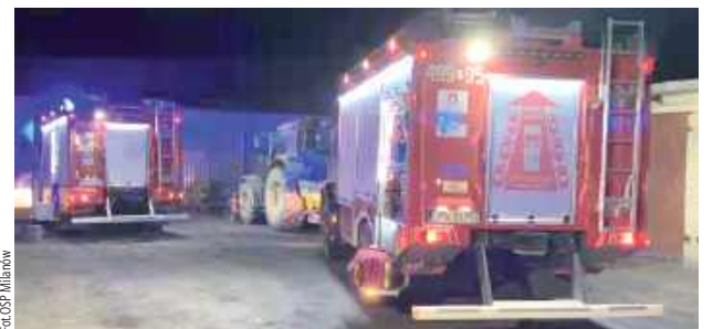
Akcja była skomplikowana ze względu na wieczorową porę

Mężczyzna wpadł kilka dni temu do silosu zbożowego w Dawidach (gmina Jabłoń). Na miejscu pracowali ratownicy pogotowia i strażacy.