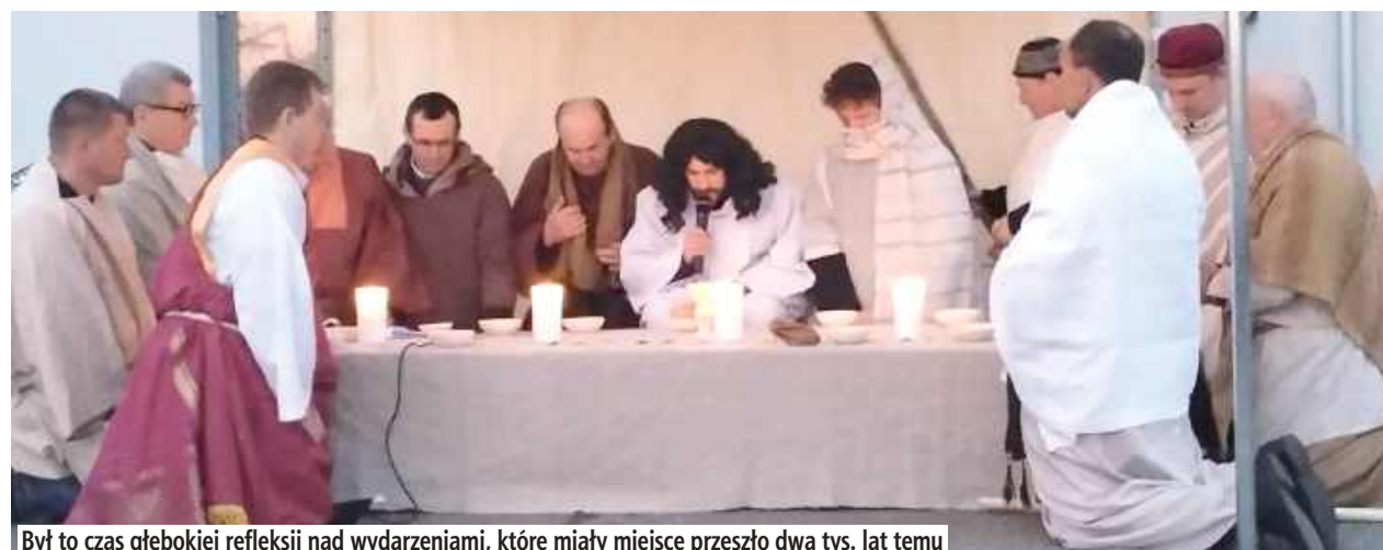
Był to czas głębokiej refleksji nad wydarzeniami, które miały miejsce przeszło dwa tys. lat temu

Był to czas głębokiej zadumy i refleksji nad wydarzeniami, które miały miejsce przeszło 2 tys. lat temu, ale i również nad naszym życiem. Cieszymy się,