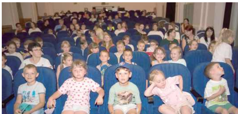
Publiczność mogła obejrzeć barwną adaptację jednej z najbardziej znanych baśni. Na scenie nie zabrakło Śnieżki, krasnoludków i Złej Królowej, a całość wzbogaciły elementy muzyczne, efektowne kostiumy oraz scenografia przygotowana przez organizatorów