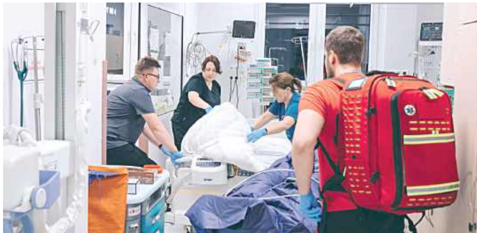
Certyfikat potwierdza, że ośrodek spełnia międzynarodowe standardy dotyczące diagnostyki, leczenia i organizacji opieki nad pacjentami z udarem mózgu

Przy leczeniu udaru mózgu znaczenie ma czas. W lubelskim szpitalu odnotowuje się jeden z najkrótszych w kraju czasów -