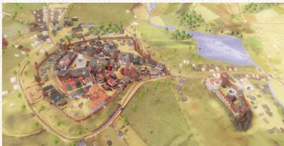
Wielki Staw Królewski zmienił swój rozmiar na przestrzeni wieków. W szczytowym momencie rozciągał się od okolic dworku Grafa na Tatarach, przez ulicę Bronowicką do Starego Miasta

Niestety, spływały też do niego ścieki z całego miasta. W każdym razie przez stulecia stał się oczywistym elementem w panoramie Lublina.