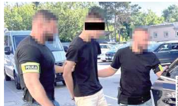
17-letni napastnik kopnął i uderzył go, po czym zerwał z niego koszulkę, w czym pomagał mu 19-latek

Nastolatki odpowiadają za rozbój. Poszło o koszulkę przeciwnej drużyny