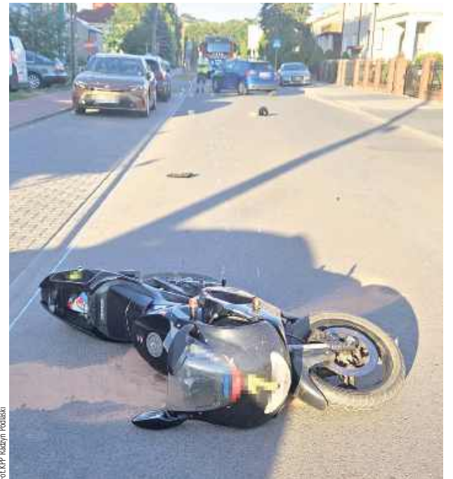
17-letni motorowerzysta został uszkodzony w wyniku zderzenia z samochodem osobowym w Radzynie Podlaskiej. Na miejscu interweniowały służby, które wyjaśniają dokładne okoliczności zdarzenia