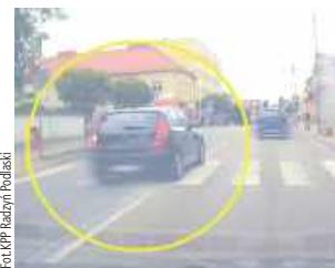
Wyczynny 19-latek nagrał inny kierowca

Radzyń Podlaski: Za szereg wykroczeń na drodze ukarany został młody mężczyzna. Dostał wysoki mandat i punkty karne.