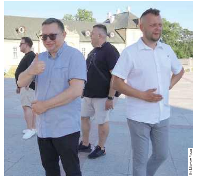
Twórcy programu postanowili pokazać Radzyna Podlaski z nieco innej perspektywy. Zamiast klasycznego programu kulinarnego powstała opowieść łącząca historię Pałacu Potockich z lokalnymi produktami i współczesną kuchnią inspirowaną tradycją

Realizacja programu na terenie jednego z najcenniejszych zabytków Lubelszczyzny to jednocześnie promocja Radzyna Podlaskiego jako miejsca, w którym historia