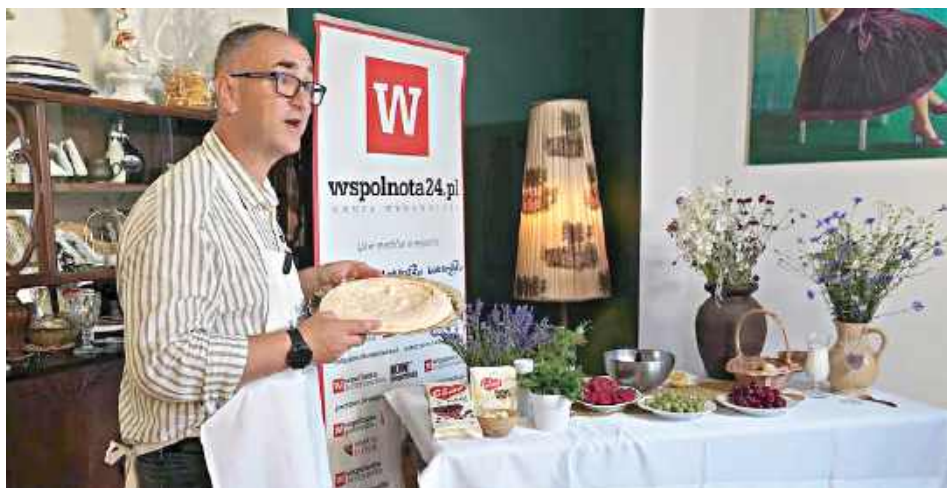
Na tapecie znalazło się kilka dań utrzymanych w radzyńskim pałacowym klimacie. Zostały one wykonane przy użyciu produktów od lokalnych firm

Radzyna Podlaska stał się bohaterem pierwszego odcinka nowego programu „Lubelskie na talerzu”.