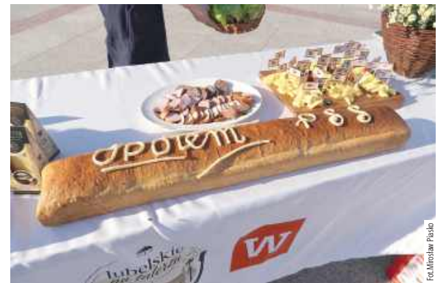
W trakcie realizacji przygotowano trzy autorskie dania nawiązujące do dawnej kuchni dworskiej. W menu znalazł się „Karp po radzyńsku à la Potocki”, przygotowany z ryb pochodzących z Gospodarstwa Rybackiego Kock i produktów Spomleku, „Połędwiczka radzyńska à la Potocki” z mięsa Zakładów Mięsnych Zemat oraz autorski deser „Biały Miś”, przygotowany we współpracy z Cukiernią Gerard

spotyka się z lokalną przedsiębiorczością i tradycjami kulinarnymi.