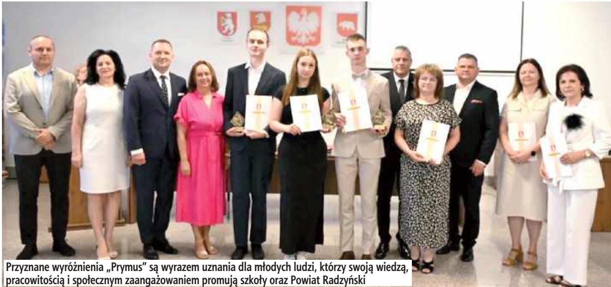
Przyznane wyróżnienia „Prymus” są wyrazem uznania dla młodych ludzi, którzy swoją wiedzą, pracowitością i społecznym zaangażowaniem promują szkoły oraz Powiat Radzyński

To wyróżnienie trafia do uczniów, którzy nie tylko osiągają znakomite wyniki w nauce, ale również odnoszą sukcesy w konkursach i olimpiadach przedmiotowych, działalnością społeczną oraz aktywnością promującą szkołę i Powiat Radzyński. Przyznane wyróżnienia „Prymus” są wyrazem uznania dla młodych ludzi, którzy swoją wiedzą, pracowitością i społecznym zaangażowaniem promują szkoły oraz Powiat Radzyński. Tegoroczni laureaci udowadniają, że sukces można budować nie tylko dzięki wysokim wynikom w nauce, ale również poprzez aktywność, pasję i gotowość do działania na rzecz lokalnej społeczności.