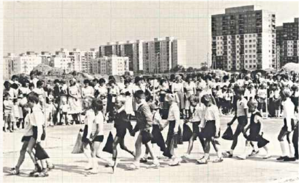
Od końca lat 50. powstały rozległe osiedla bloków z wielkiej płyty, a także obiekty użyteczności publicznej, takie jak szkoły, kościoły, biblioteki czy Szpital Kliniczny nr 4

Skąd się wziął i co pozostało po tajemniczym zamku? Czym jest skarb arabskich monet? I kiedy ta kryjąca wiele tajemnic przestrzeń stała się częścią miasta Lublina?