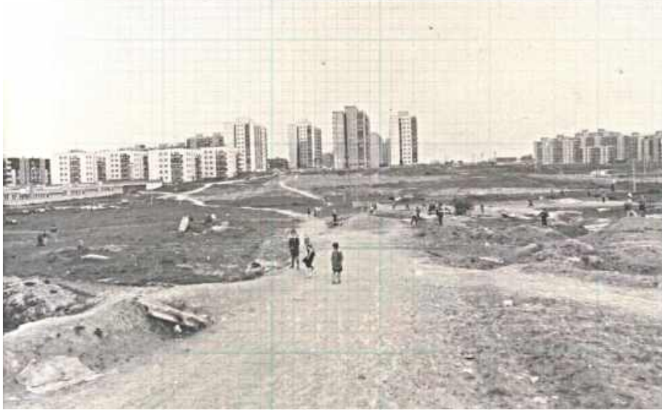
Przez lata powstały rozległe osiedla bloków z wielkiej płyty, a także obiekty użyteczności publicznej