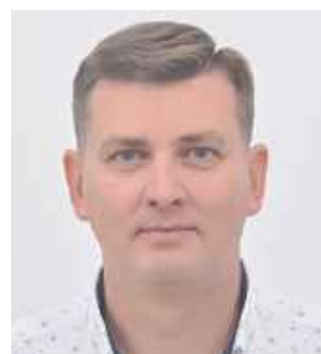
Cykl „Ślady wiary. Krzyże i kapliczki powiatu radzyńskiego” powstaje pod redakcją Roberta Mazurka – regionalisty, społecznika, animatora kultury i samorządowca.

W świecie, który pędzi naprzód, ta przydrożna kapliczka pozostaje punktem zatrzymania. Świadectwem wiary, strachu i nadziei dawnych pokoleń. I choć mijają ją samochody, a most nad Bystrzycą prowadzi dalej – ona wciąż stoi, przypominając, że niektóre historie zapisane są nie w książkach, lecz w krajobrazie.