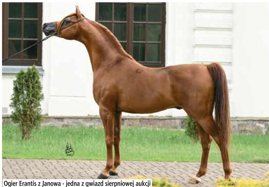
Ogier Erantis z Janowa - jedna z gwiazd sierpniowej aukcji

Organizatorzy podkreślają, że oferta aukcyjna została przygotowana na podstawie wielomiesięcznych analiz i selekcji najlep-