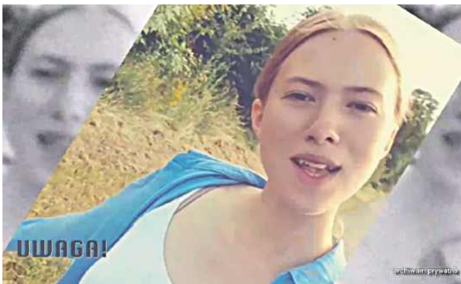
W programie „UWAGA!” matka Gabrieli opowiada o córce, pokazuje jej zdjęcie, na którym widać uśmiechniętą, pełną życia nastolatkę...