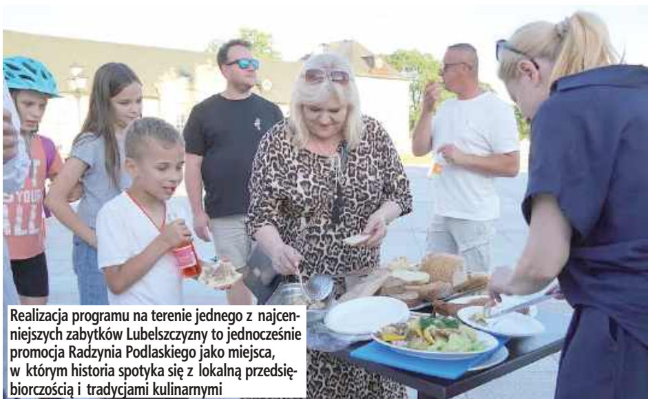
Realizacja programu na terenie jednego z najcenniejszych zabytków Lubelszczyzny to jednocześnie promocja Radzyna Podlaskiego jako miejsca, w którym historia spotyka się z lokalną przedsiębiorczością i tradycjami kulinarnymi

dowiedzą się, jak lokalni producenci od lat budują kulinarną markę regionu.