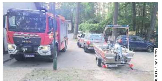
W akcji ratowniczej brały udział jednostki straży pożarnej z powiatu lubartowskiego i z Lublina

Do tragedii doszło w niedzielę, 28 czerwca około godz. 18.