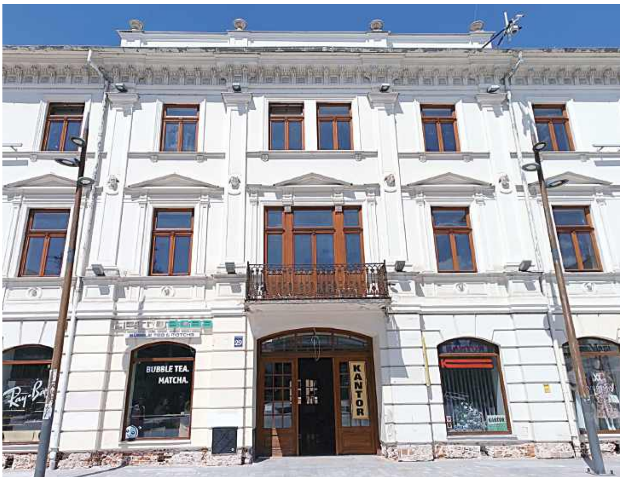
Budowę ukończono w 1867 roku, a obiekt zyskał miano Hotelu Europejskiego. Architektonicznie stanowił skromniejszą replikę słynnego warszawskiego Hotelu Europejskiego