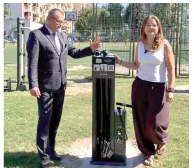
Samoobsługowa stacja wyposażona jest w podstawowe narzędzia umożliwiające wykonanie drobnych napraw oraz regulacji roweru. Dzięki temu rowerzyści mogą szybko usunąć usterkę lub przygotować jednoślad do dalszej jazdy bez konieczności odwiedzania serwisu