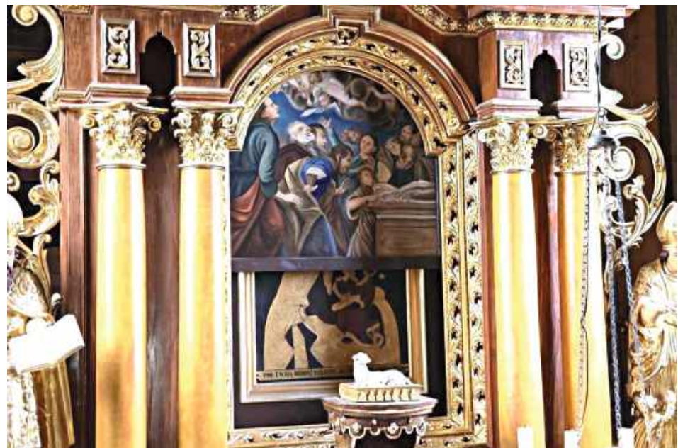
Ukryty mechanizm w trakcie działania

Fioletową fotografię zastąpił obraz wier- nie odwzorowujący oryginał. Dołączył do dwóch pozostałych malowideł w ołtarzu głównym. Jedno z nich można zobaczyć tylko w wyjątkowych okolicznościach, po urucho- mieniu ukrytego mechanizmu.