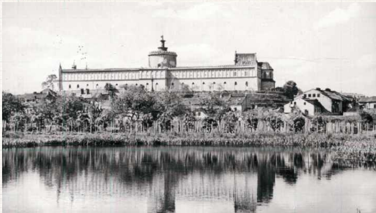
W stawie hodowano ryby, funkcjonowały przy nim młyny, jako zbiornik retencyjny chronił też podgrodzia przed zalaniem

Wielki Staw Królewski zmienił swój rozmiar na przestrzeni wieków. W szczytowym momencie rozciągał się od okolic dworku Grafa na Tatarach, przez ulicę Bronowicką do Starego Miasta. Pod wodą były