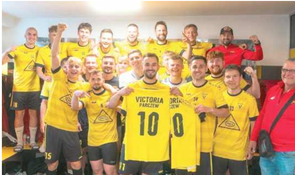
Victoria wywalczyła wicemistrzostwo Klasy Okręgowej. Ze względu na brak odpowiednich środków nie zagra w IV lidze. Szkoda

Kibice Victorii Parczew nie zobaczą swojej drużyny na czwartoligowych boiskach w sezonie 2026/2027. Zarząd klubu poinformował o rezygnacji z udziału w rozgrywkach IV ligi, wskazując na brak wystarczających środków finansowych niezbędnych do funkcjonowania zespołu na tym poziomie.