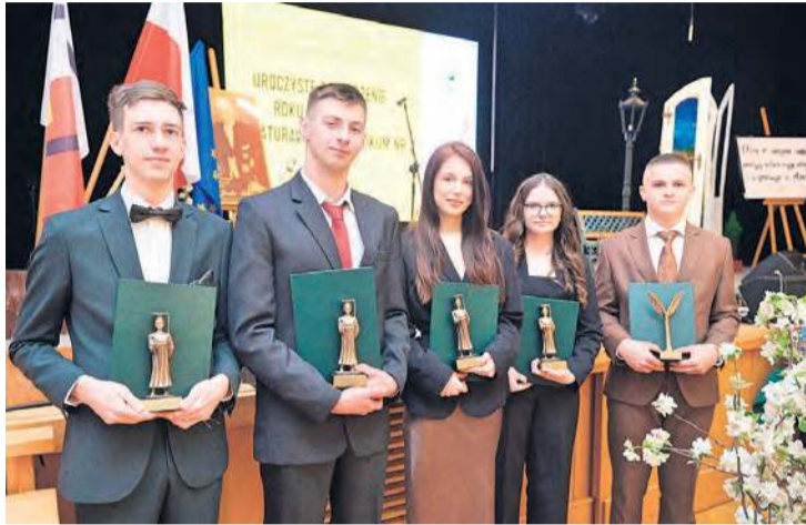
Statuetki trafiły do najlepszych absolwentów w konkretnych dziedzinach. Ich nazwiska podajemy przy artykule.

W Tucholskim Ośrodku Kultury z rodzicami, wychowawcami, nauczycielami i dyrekcją spotkali się maturzyści Zespołu Szkół Licealnych i Agrotechnicznych w Tucholi. Na uroczystość złożyły się przemówienia, wyróżnienia, pożegnania itd. Z jednej strony mowy motywacyjne, z drugiej lzy wzruszenia. Słowa wzbogaciła muzyka, bo w gronie ZSLiA w Tucholi nie brakuje uzdolnionych uczniów.