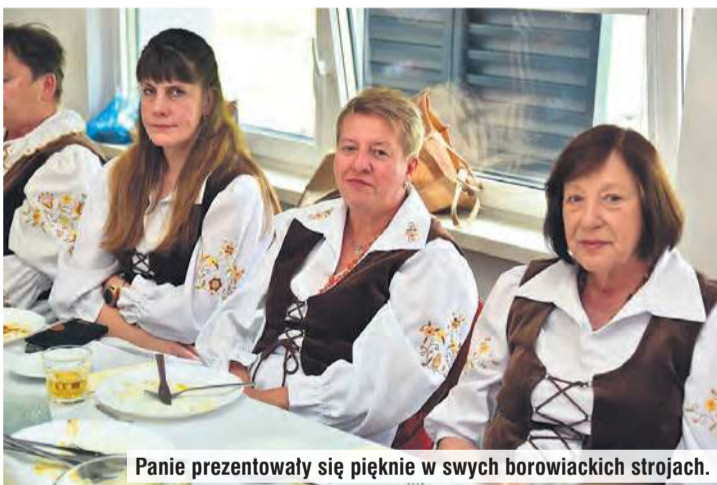
Panie prezentowały się pięknie w swych borowiackich strojach.