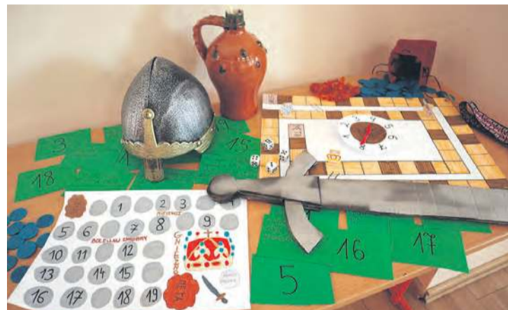
Wykonane gry o Chrobrym, z których można korzystać w szkolnej bibliotece.