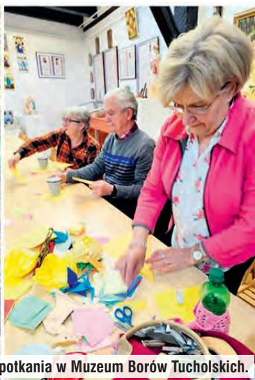
Kolejne „eskapady”. Kadry z Jeleniej Wyspy i spotkania w Muzeum Borów Tucholskich.