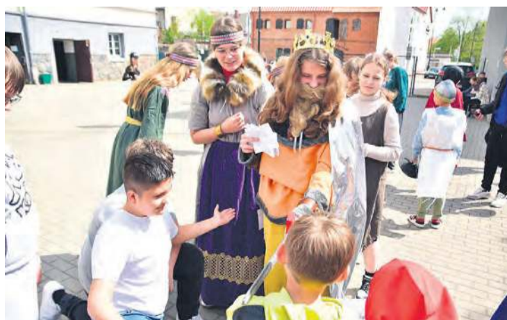
Bolesław Chrobry nie tracił czasu. Szybko mianował nowych rycerzy.