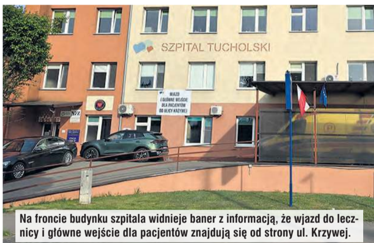
Na froncie budynku szpitala widnieje baner z informacją, że wjazd do lecznicy i główne wejście dla pacjentów znajdują się od strony ul. Krzywej.