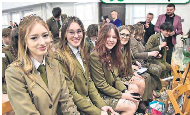
Dobre humory mieszały się ze łzami wzruszenia. Uczniowie żegnają się ze swoimi przyjaciółmi, z którymi żyli się przez ostatnie 5 lat.