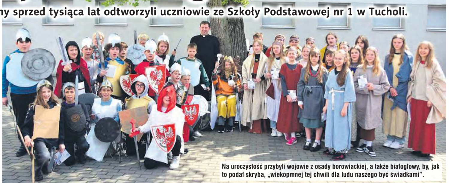
Na uroczystość przybyli wojowie z osady borowiackiej, a także białogłowy, by, jak to podał skryba, „wiekopmej tej chwili dla ludu naszego być świadkami”.

Pierwsze z zadań realizowanych przez Szkołę Podstawową nr 1 w Tucholi polegało na wybraniu drużyny Chrobrego – wszyscy uczniowie z klas 4-6 napisali test dotyczący wiedzy o tamtych czasach. Najlepsze białogłowy (dawniej tak właśnie mówiono na kobiety) i kandydaci na wojów musieli również wykazać się sprytem, zwinnością i szybkością