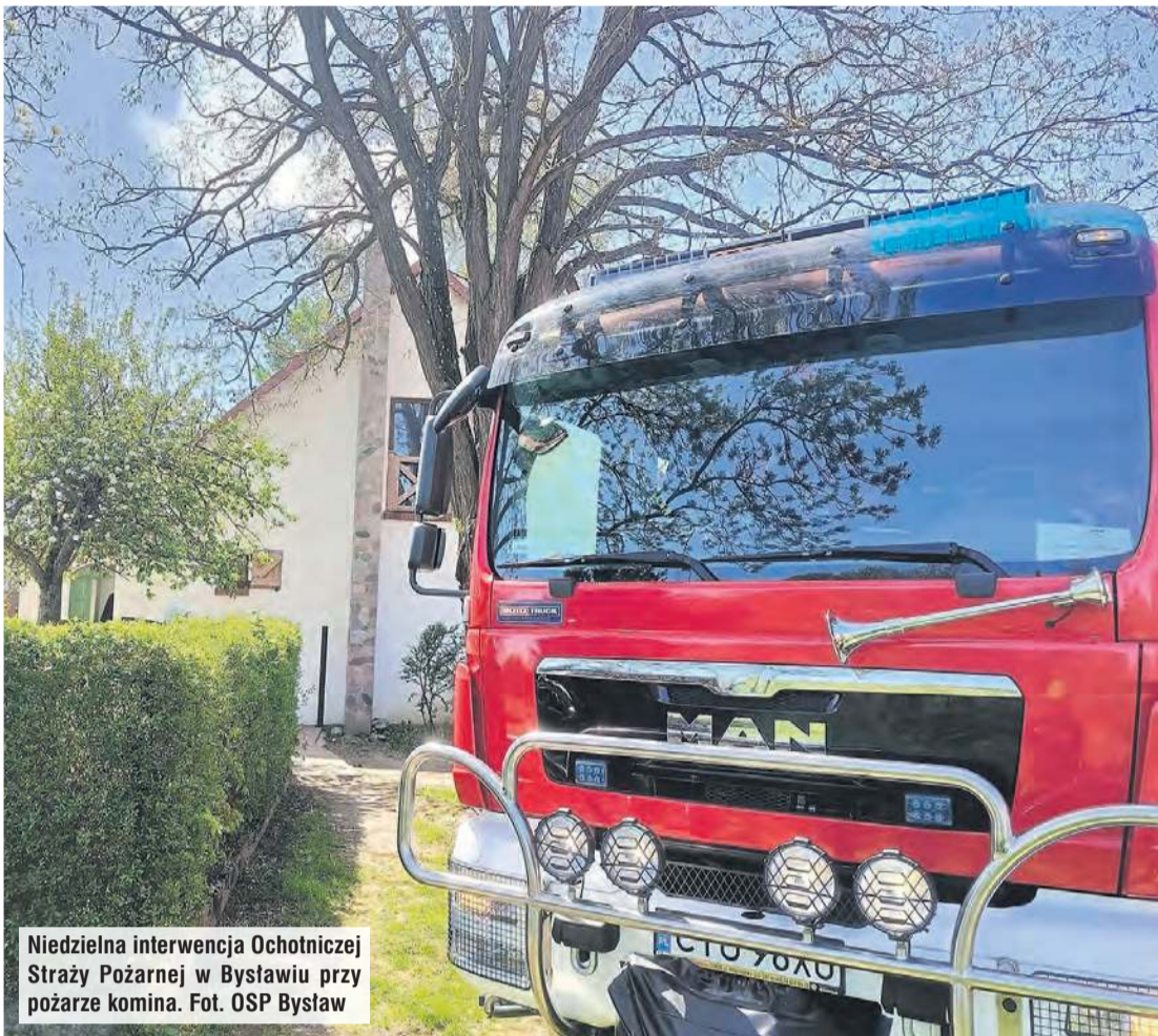
Niedzielną interwencją Ochotniczej Straży Pożarnej w Bystawiu przy pożarze komina.