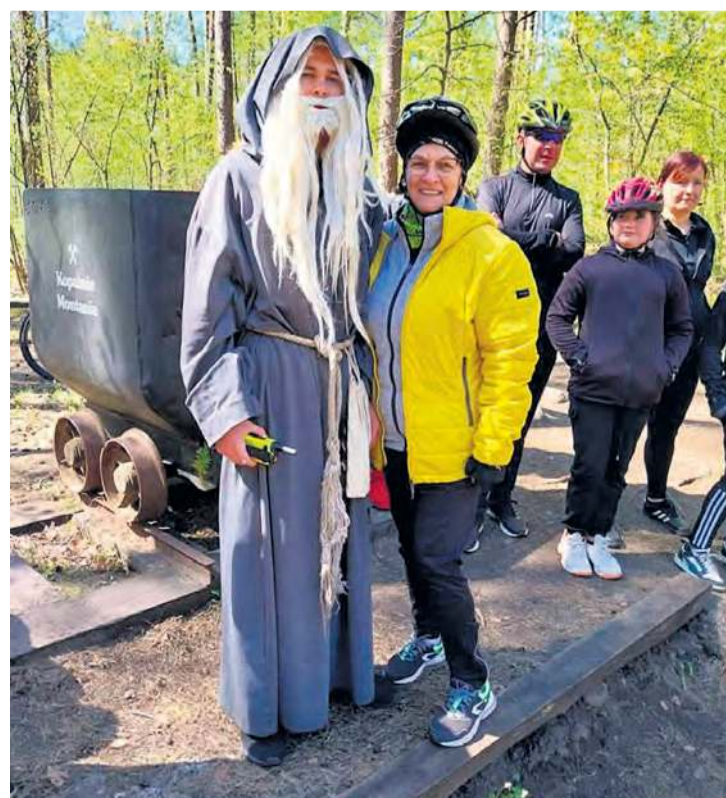
Przystanek rowerowej eskapady w Górniczej Wiosce.