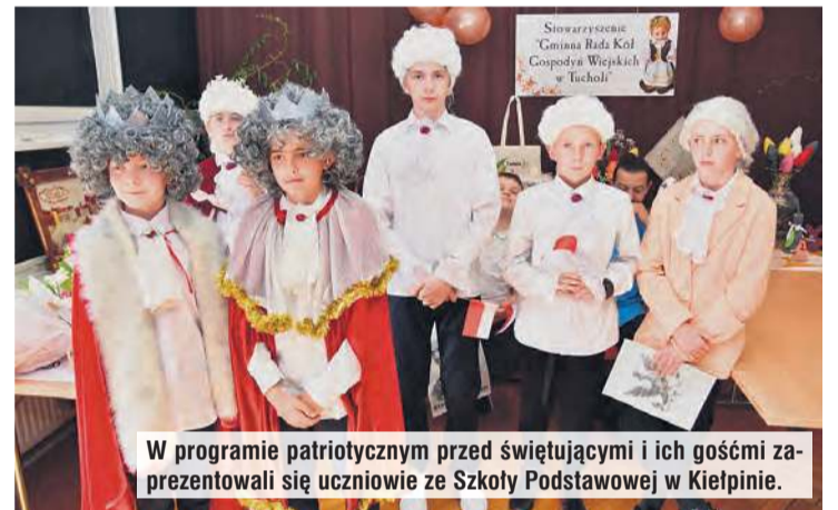
W programie patriotycznym przed świętującymi i ich gośćmi zaprezentowali się uczniowie ze Szkoły Podstawowej w Kielpinie.

– W sumie do tej pory koła z naszego stowarzyszenia do-