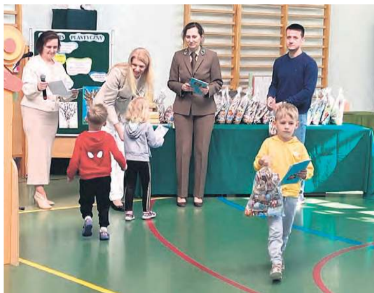
Za wykonanie pracy konkursowej – wiosennego drzewa – przedszkolaki odebrały nagrody.