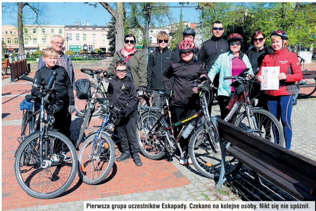
Pierwsza grupa uczestników Eskapady. Czekało na kolejne osoby. Nikt się nie spóźnił.

Kąpiel, ale specyficzna, bo bez wody. Bardziej ma się tu na uwadze zanurzenie zmysłów w naturę. Taka filozofia towarzyszyła tucholanom, którzy w ramach Eskapady z przewodnikami obejmującej całe województwo ruszyli na rowerach w Bory Tucholskie. Nie jest to zwykły rajd, bo akcja ma specjalne przestanie.