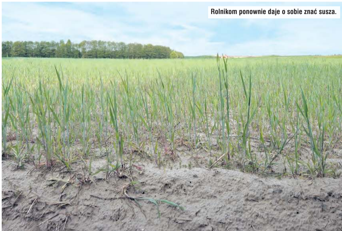
Rolnikom ponownie daje o sobie znać susza.

ARiMR nabór dokumentów prowadził w ramach trzech różnych naborów związanych z wystąpieniem klęski suszy w 2024 roku. O pomoc publiczną do upraw ubiegać mogli się rolnicy, w których gospodarstwach rolnych