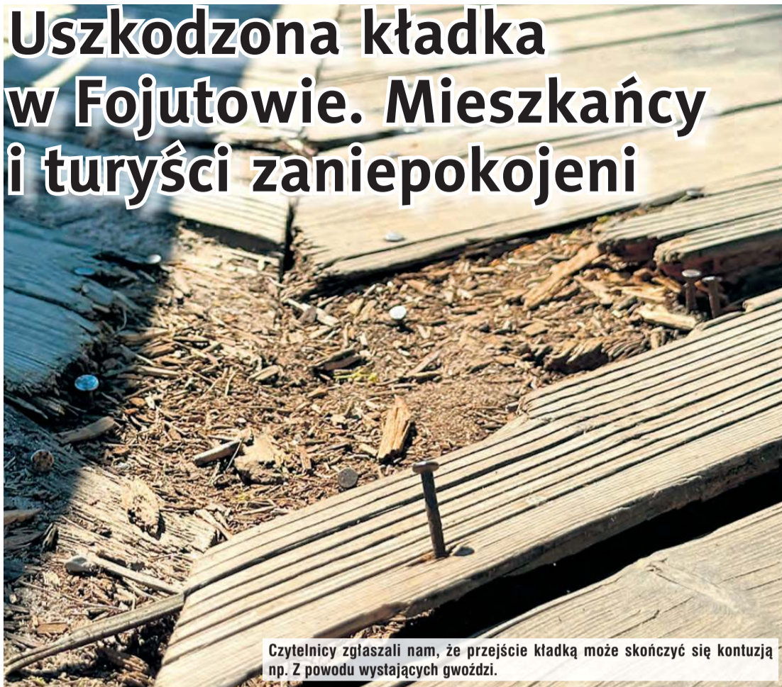
Czytelnicy zgłaszali nam, że przejście kładką może skończyć się kontuzją np. Z powodu wystających gwoździ.

Wiosna przyciąga turystów do Fojutowa, m.in. po to, aby zobaczyć owiany sławą akwedukt. Na ubytki w infrastrukturze od pewnego czasu zwracają nam uwagę czytelnicy. Wczorajszy telefon od jednej z czytelniczek potwierdził w sobotę (26 kwietnia) przedpołudniowym spacerem nad Wielkim Kanalem Brdy. Poważnie uszkodzona jest drewniana kładka łącząca brzegi i jeden z tarasów widokowych.