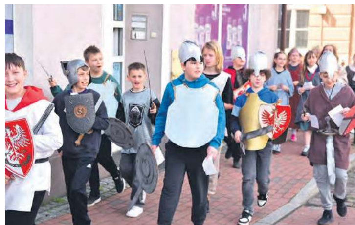
Po koronacji władca ze swą drużyną udał się na tucholski rynek, gdzie informowano o ważnej dla historii Polski rocznicy.