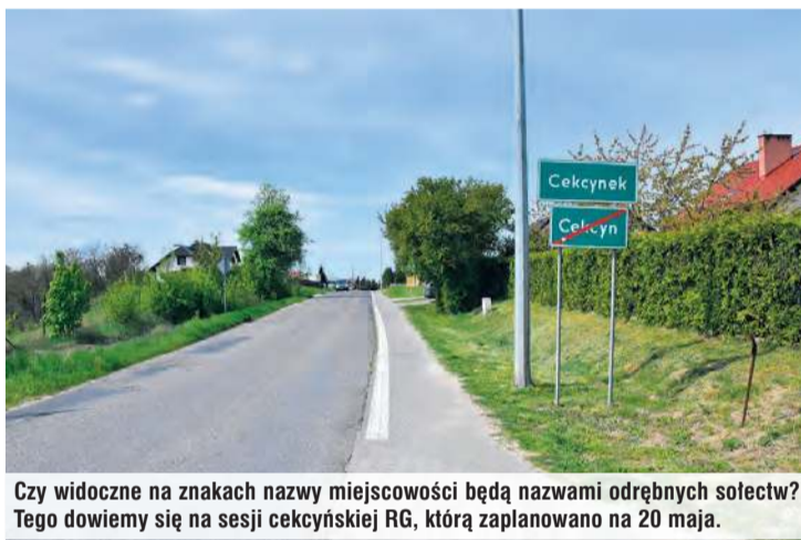
Czy widoczne na znakach nazwy miejscowości będą nazwami odrębnych sołectw? Tego dowiemy się na sesji cekcyńskiej RG, którą zaplanowano na 20 maja.

miejsce na uwagi i wnioski. Ankiety były dostępne w internecie, urzędzie i podczas zebrania sołeckiego, które odbyło się w Cekcynie 13 września 2024 r. Po zakończonych konsultacjach na stronie urzędu udostępniono protokół. Dokument wskazywał, że swoje zdanie w tej sprawie wraziło jedynie 125 osób.