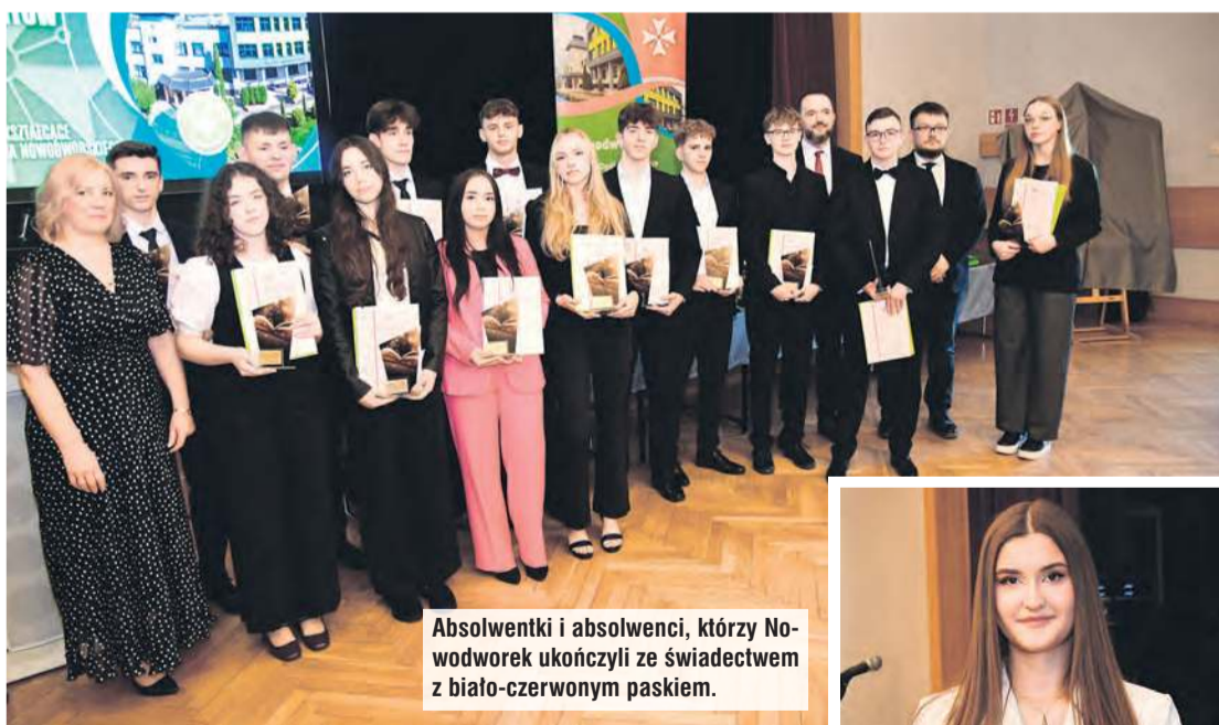
Absolwentki i absolwenci, którzy Nowodworek ukończyli ze świadectwem z biało-czerwonym paskiem.

– One są niezwykle trwałe, a niezbędne w dorosłym życiu. Przeżywamy dzisiaj ogromny kryzys relacji.