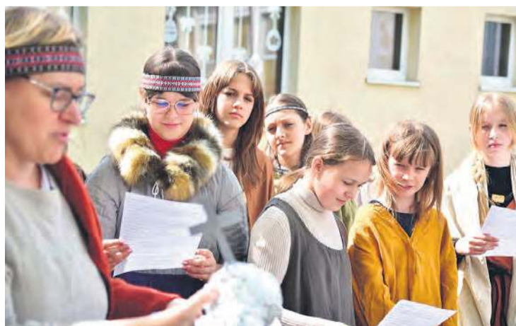
Lud życzył władcy, aby panował mu miłościwie i sprawiedliwie, jako dobry, a surowy ojciec, niestrudzony krzewiciel wiary chrześcijańskiej i Boży pomazaniec.