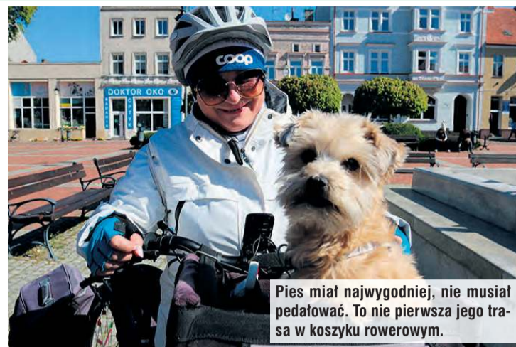
Pies miał najwygodniej, nie musiał pedałowac. To nie pierwsza jego trasa w koszyku rowerowym.

Rajdowi towarzyszy pewna filozofia, bo wyprawa nie tylko ma na względzie walory krajoznawcze. To spojrzenie w głąb siebie, skupienie się na wła-