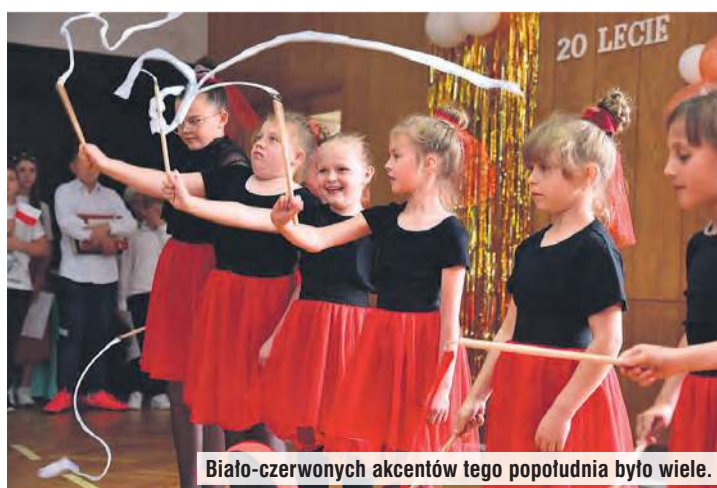
Białoczerwonych akcentów tego popołudnia było wiele.

swoim i pozostałych członkiń lokalnym samorządom, jednostkom kultury i oświaty oraz innym instytucjom za dotychczasową współpracę i okazaną pomoc. Sama odebrała wiele