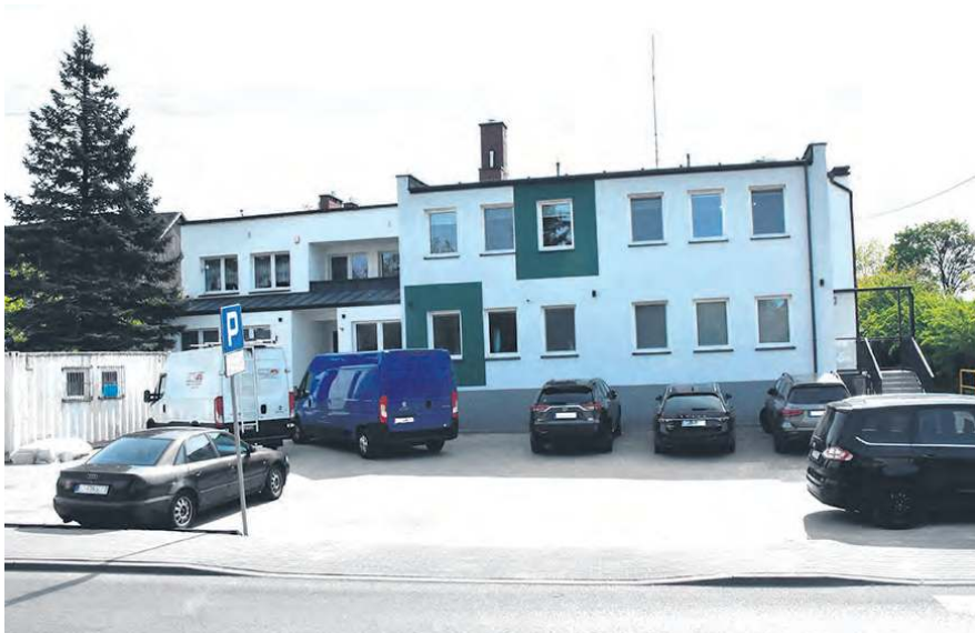
Budynek przychodni zyskał m.in. gabinet lekarski, powiększony gabinet zabiegowy czy pomieszczenia administracyjne. Komfort dostępu do SPZOZ dla części pacjentów poprawią również windy.

W ramach inwestycji poprawiona została komunikacja wewnątrz budynku ośrodka zdrowia. Mowa o połączeniu poczekalni dziecięcej i poczekalni ogólnej. Rozbudowano rejestrację i miejsce na przechowywanie kartotek. Powiększono gabinet zabiegowy i zaadaptowano jedno z mieszkań, gdzie powstała powierzchnia typowo administracyjna, tj. biura dla kierownika ośrodka, księgowej, a także zaplecze socjalne i salka narad.