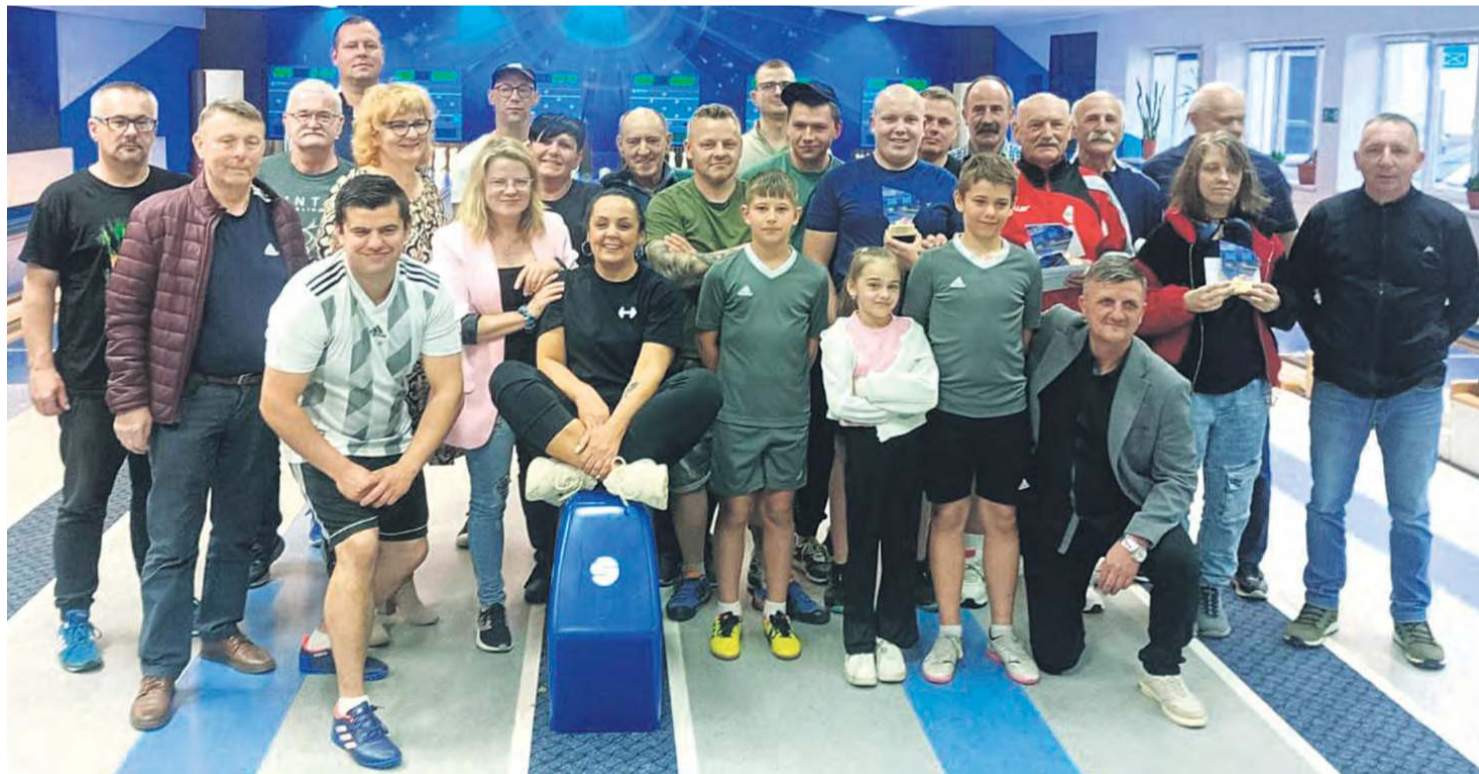
Turniej zgromadził na tucholskich torach znanych sobie nawzajem zawodników.