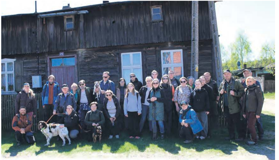
Uczestnicy eskapady z Tucholskim Parkiem Krajobrazowym. Zdjęcie w Kręgu, który znany jest z charakterystycznej zabudowy.

– Większość z nich to stare drewniane chałupy, z których kilka krytych jest strzechą. Zachowane do dzisiaj są bez wątpienia klejnotami boro-