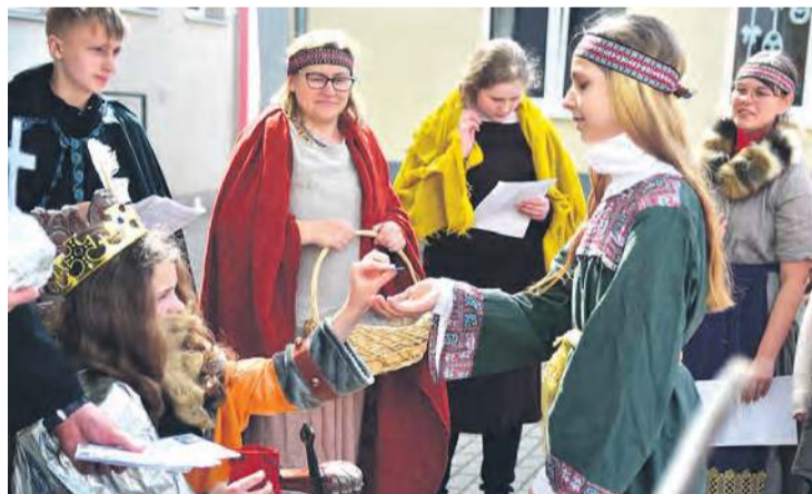
Pierwsze władcy pokłonili się białogłowy.