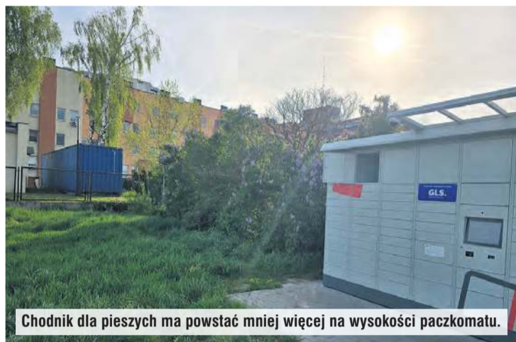
Chodnik dla pieszych ma powstać mniej więcej na wysokości paczkomatu.