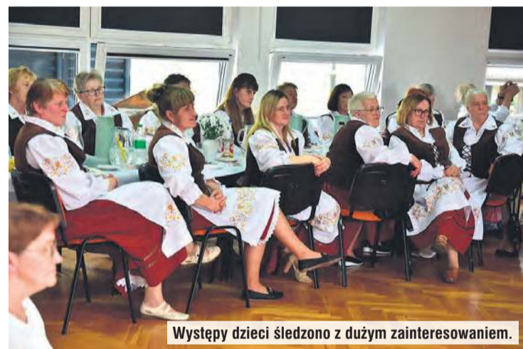
Występy dzieci śledzono z dużym zainteresowaniem.