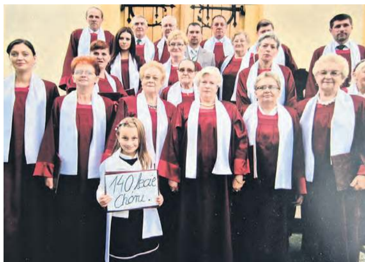
Uroczystość 140-lecia chóru „Orfeusz”.