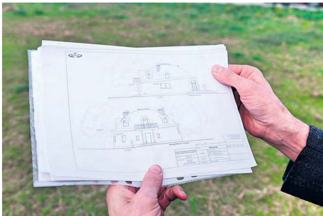
Projekt domu kopułowego, który powstanie w Jeleńcu.