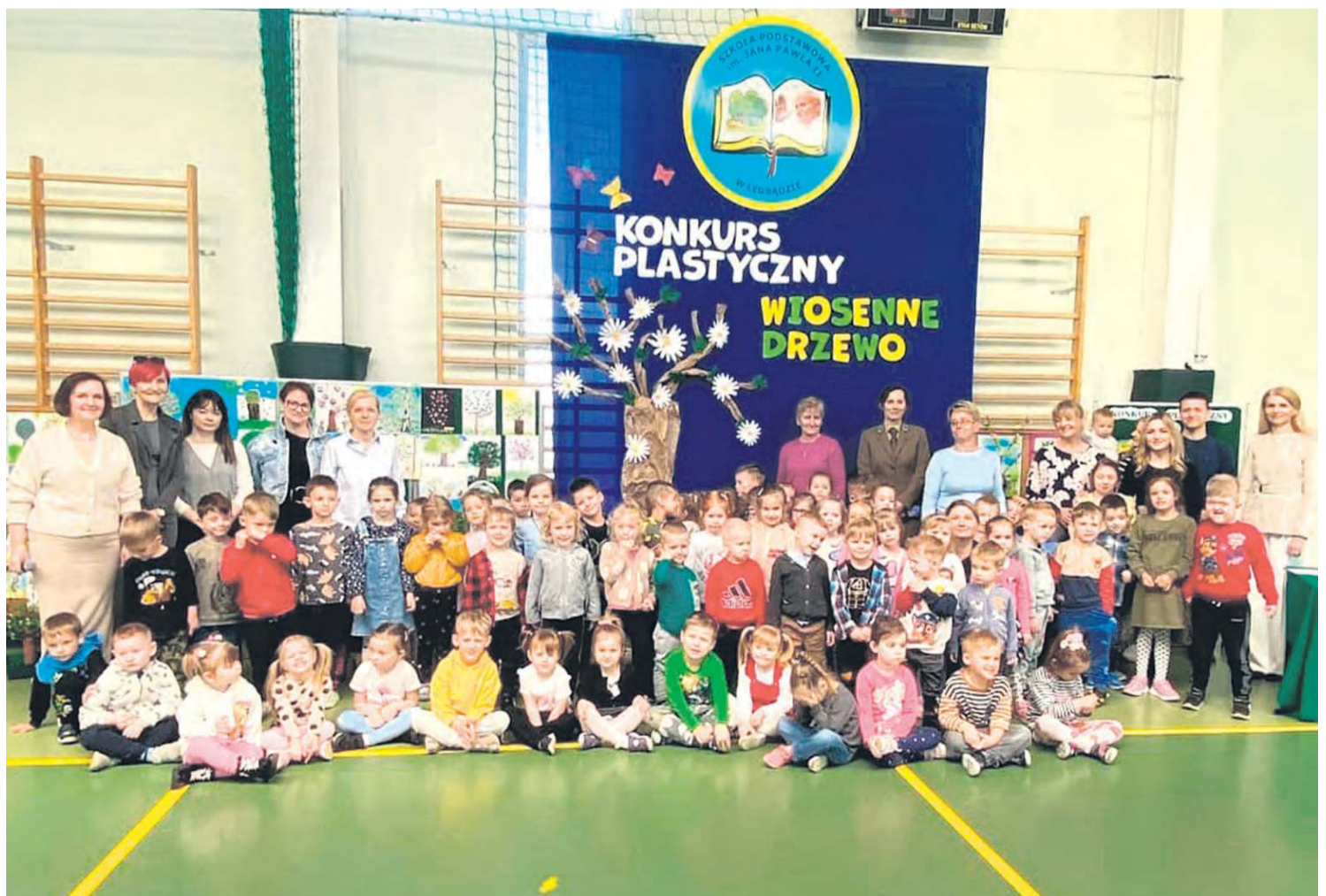
O tym pozytywnym wydarzeniu jego uczestnikom przypominać będzie pamiątkowe zdjęcie.