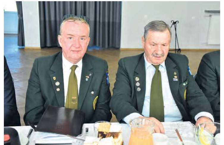
Tucholski cech w większości charakteryzuje się spójnym ubiorem, co dodaje rangi temu gremium.

Prezes, wypowiadając się, przypominał o idei cechów rze-