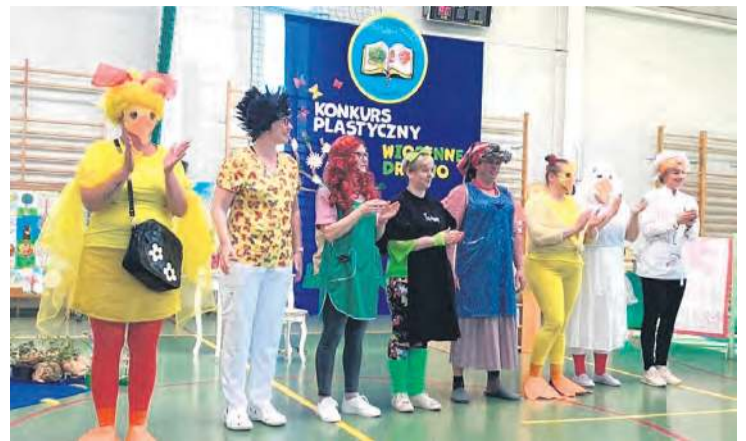
Przed przedszkolakami w spektaklu „Kaczka dziwaczka” zprezentowali się rodzice uczniów ze Szkoły Podstawowej w Legbądzie.