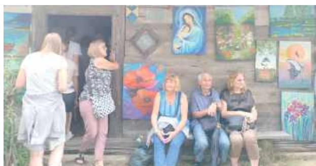
Goście mogli poczuć uroki dawnej wsi