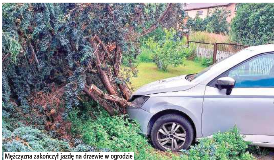
Mężczyzna zakończył jazdę na drzewie w ogrodzie

W środę, 30 lipca policjanci parczewskiej drogówki na ul. 1-go maja w Parczewie dokonali pomiaru prędkości Skody. Okazało się, że kierujący w obszarze zabudowanym przekroczył dopuszczalny limit prędkości. Mundurowi wydali kierowcy sygnał do zatrzymania pojazdu, ten jednak ominął policjantów i skręcił w kierunku miejscowości Jasionka.