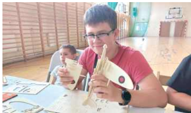
Warsztaty sprzyjały rozwijaniu zdolności manualnych, koncentracji oraz pracy zespołowej

Podczas warsztatów dzieci miały okazję składać modele samolotów, co stanowiło nie tylko świetną zabawę, ale