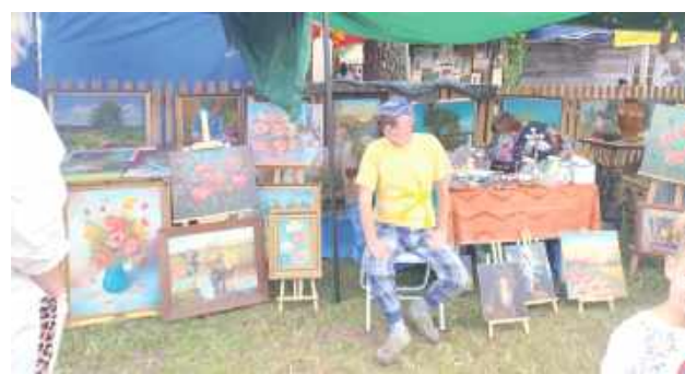
Można było m.in. kupić obrazy namalowane przez ludowych artystów

Występy zespołów ludowych czy warsztaty sztuki ludowej – pod koniec lipca został zorganizowany kolejny Jarmark Holeński.