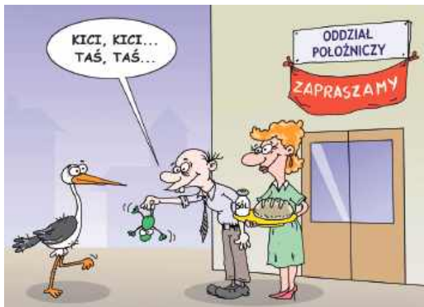
Tak jak we wszystkich parczewskich gminach problemem jest mała liczba urodzin

Budżet gminy za 2024 r. wykonany został po stronie dochodów w wysokości 41 395 396 zł, a po stronie wydatków wykonanie wyniosło 39 312 950 zł. Dochody ogółem na 1 mieszkańca gminy w 2024 r. wyniosły 11 394 zł (w 2023 – 8 384 zł).