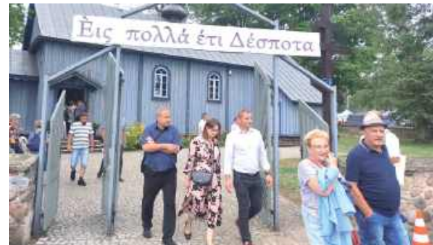
Holeńska cerkiew przeżywała prawdziwe obłędzenie