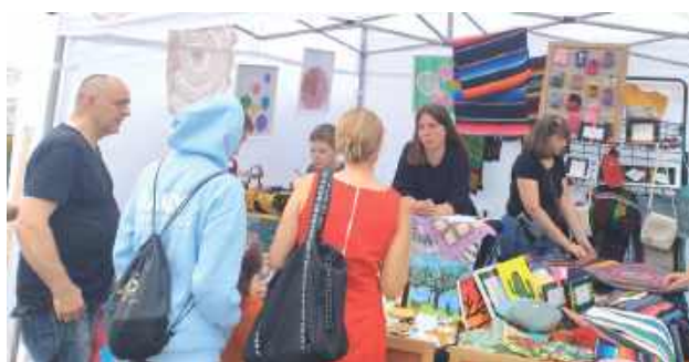
Swoje stoiska miały koła gospodyń wiejskich