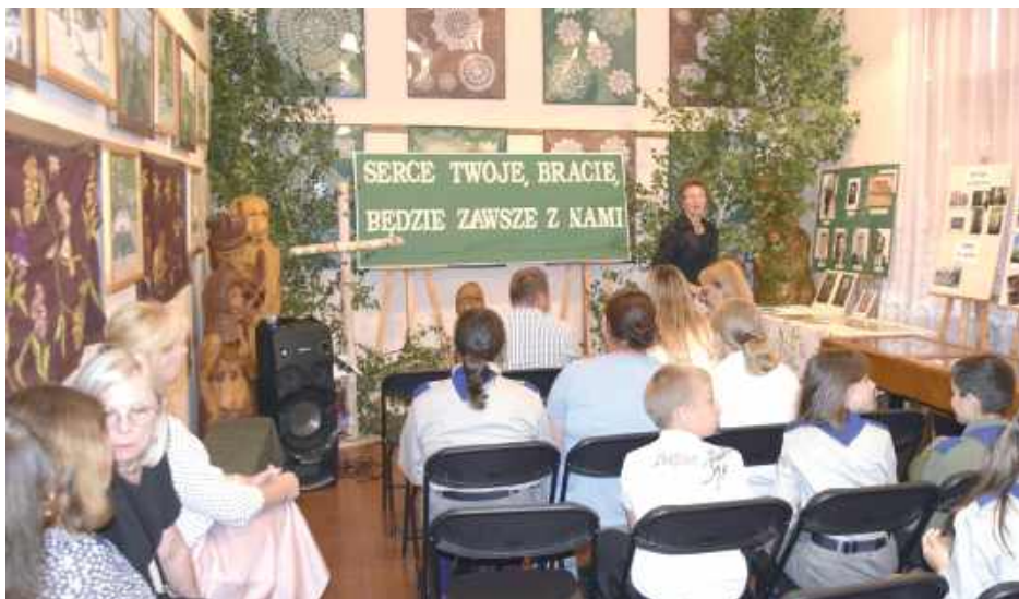
W Muzeum Regionalnym odbył się koncert pt. „Serce Twoje, Bracie, będzie zawsze z nami”

Obchody rozpoczęły się od mszy świętej w kościele parafialnym, odprawiona w intencji ofiar II wojny światowej. Następnie uczestnicy udali się pod pomnik, gdzie zapalono