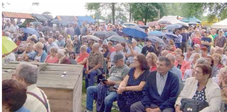
Momentami padał ulewny deszcz, dlatego frekwencja była mniejsza niż w ubiegłym roku