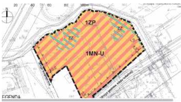
Chodzi o teren położony na północ od ul. Bema. Część tego terenu to obszar zagrożony powodzią. Został oznaczony jako „ZZ”

Wyznaczony teren zabudowy mieszkaniowej jednorodzinnej lub usługowej położony jest w bezpośrednim sąsiedztwie centrum miasta. Zdaniem urzędników „przeznaczenie wpisuje się w zwartą tkankę miasta, a w sąsiedztwie zlokalizowana jest niezbędna infrastruktura”. Zmiana planu nie wpłynie na wyznaczony w sąsiedztwie układ komunikacyjny, w tym dla ruchu pieszego i rowerowego.