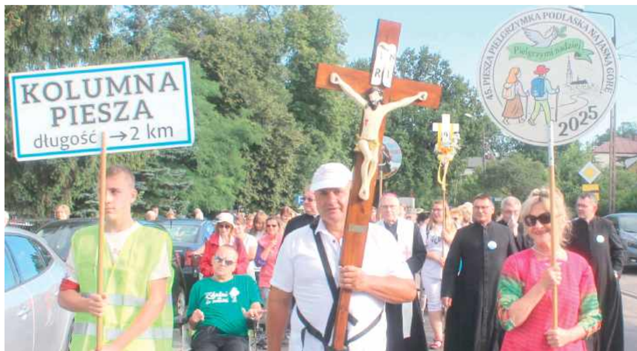
Grupa 9. na starcie 45. Pieszej Pielgrzymki Podlaskiej tuż po wyjściu z kościoła

Kilkaset osób przybyło w piątek o godz. 6 na Mszę św. w kościele Wniebowzięcia NMP (przy ul. Długiej), gdzie później nastąpił biały start 45. Pieszej Pielgrzymki Podlaskiej.