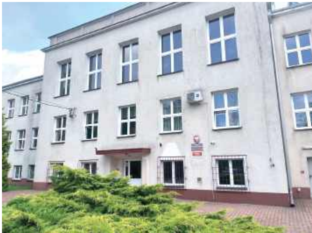
Gmina planuje dalej wykorzystywać budynek

Gmina Komarówka: Z 31 sierpnia br. LO w Komarówce Podlaskiej zostanie zlikwidowane. Zdecydowała o tym Rada Gminy. W szkole już od kilku lat nie można było przeprowadzić skutecznej rekrutacji.