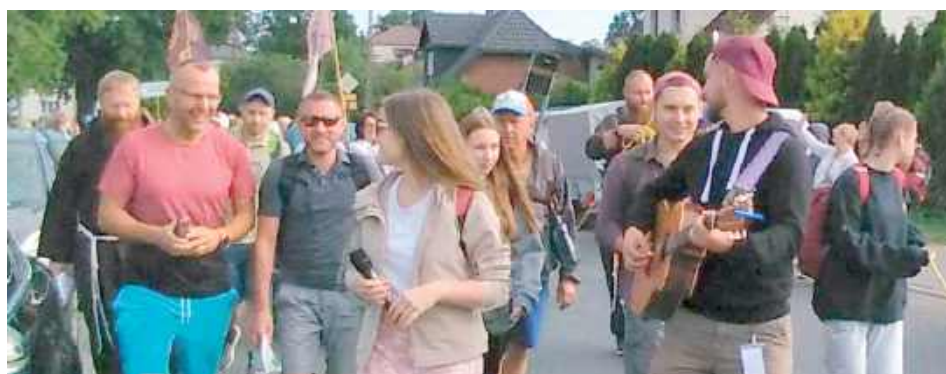
Grupa 9b, czyli franciszkańska, była bardziej rozspiewana. Gitara i śpiew oraz mocne nagłośnienie wystarczyły, żeby docenić takie pielgrzymowanie