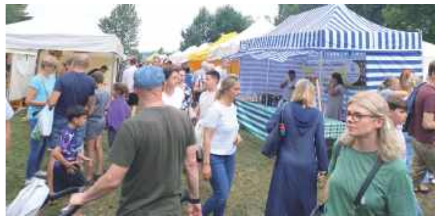
Nie zabrakło stoisk gastronomicznych