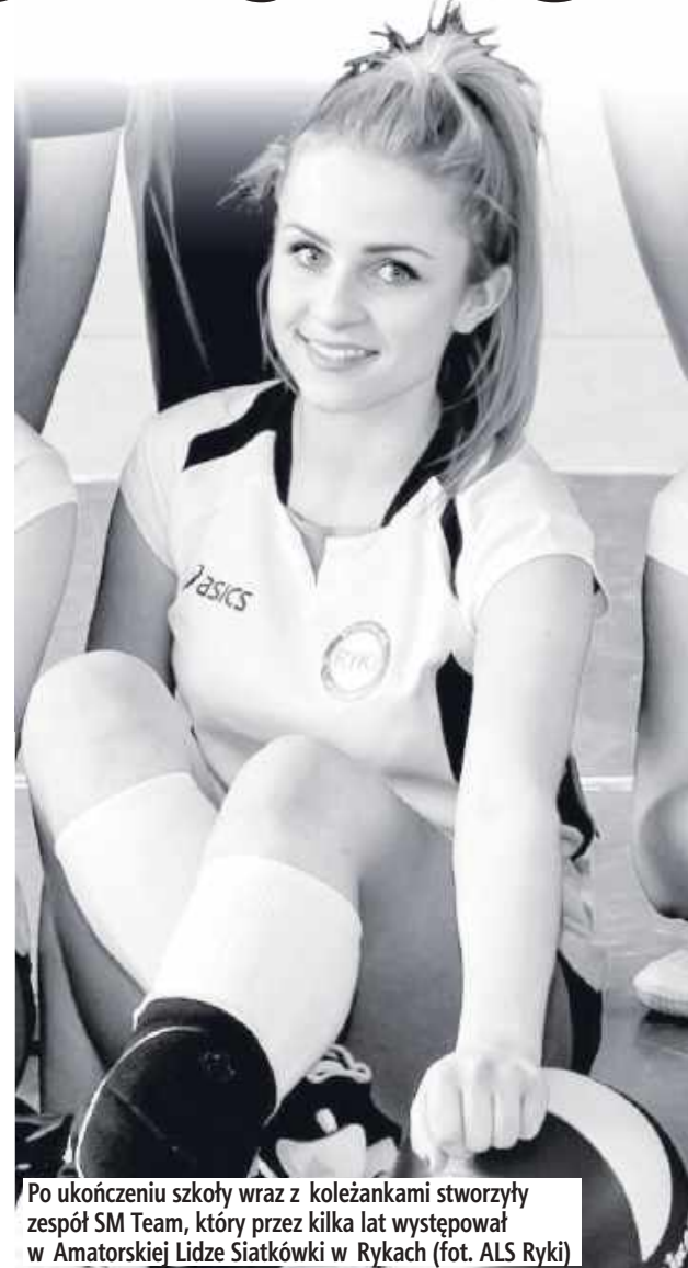
Po ukończeniu szkoły wraz z koleżankami stworzyły zespół SM Team, który przez kilka lat występował w Amatorskiej Lidze Siatkówki w Rykach

Nazywaliśmy ją naszą „Iskierką”. Była zawsze uśmiechniętą i pozytywnie nastawioną dziewczyną. Klientki ją bardzo lubiły