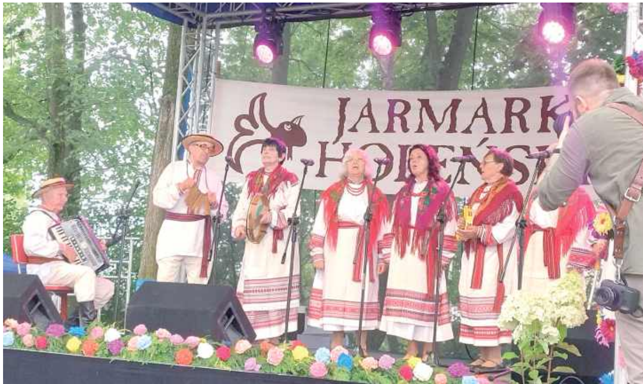
W programie były m.in. występy zespołów ludowych