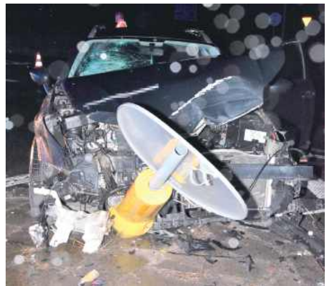
Citroen był mocno uszkodzony

Zignorował znak STOP i doprowadził do zderzenia. Przed sądem nie stanie