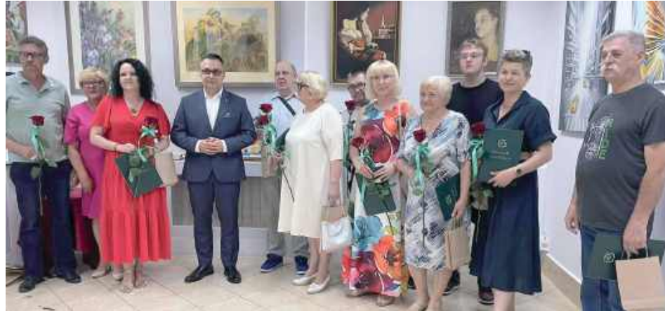
GR Wystawa czynna do 29 sierpnia w godz. 8-15

- Zapraszamy wszystkich mieszkańców do odwiedzenia wystawy i poznania talentów, które mamy tu, w Parczewie. Wystawa czynna do 29 sierpnia w godz. 8-15 - informuje PDK.