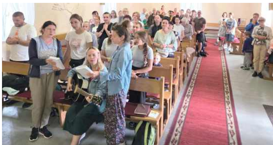
GR Grupa liczyła kilkadziesiąt osób

Po raz kolejny Parafię Narodzenia NMP w Kodeńcu odwiedzili pielgrzymi idący z Włodawy na Jasną Górę. - W tym roku grupa jest większa i zdominowana przez młodych. Maryjo, prowadź - apelowali przedstawiciele parafii.