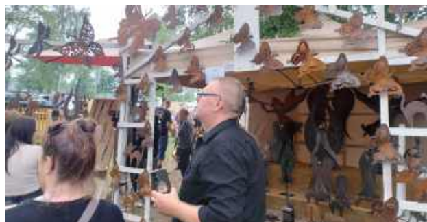
Rękodzieła robiły ogromne wrażenie