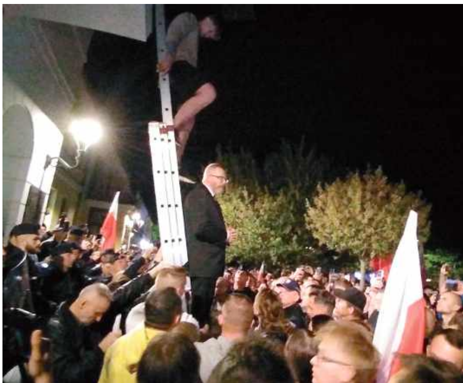
Z balkonu białskiego Urzędu Miasta uczestnik wiecu Grzegorza Brauna, przy wsparciu kandydata na prezydenta RP zjął flagę Ukrainy