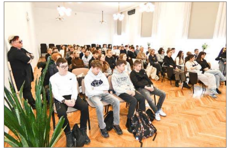
Młodzież ze szkół podstawowych ma 2 miesiące na decyzję.

- Będziemy też prowadzić nabór do klasy licealnej o profilu psycholo-