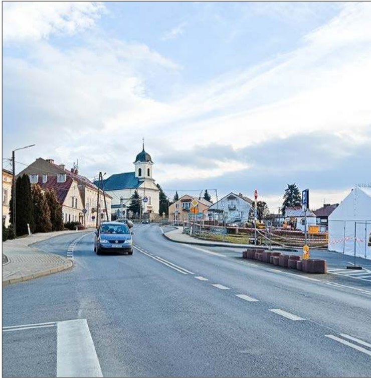
Budowa obwodnicy pozwoli wyprowadzić ruch z centrum Brzostku.

O konieczności budowy obwodnicy Brzostku mówi się od dawna. Kilka lat temu zadanie zostało włączone do projektu Prawa i Sprawie-