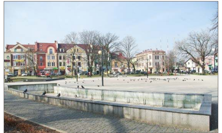
Jeśli tempo spadku liczby ludności się utrzyma, to za 25 lat w Dębicy będzie niewiele ponad 30 tysięcy osób.

Drugim powodem wskazanym przez burmistrza jest emigracja zarobkowa po otwarciu się zagranicznych rynków, zwłaszcza po