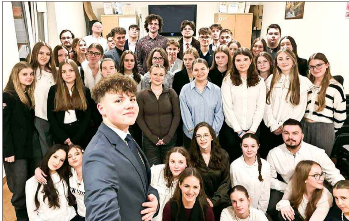
W styczniu zorganizowane zostało walne zebranie połączone z wyborami nowego zarządu KSM w Straszęcinie.