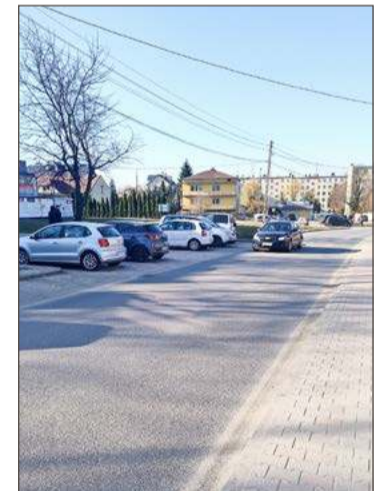
Nowe przejście miałyby powstać na tej wysokości.

Dyrektor twierdzi, że na tym odcinku, szczególnie w godzinach rannych, kiedy jedne dzieci idą, a inne są odwożone przez rodziców do szkoły, już dziś tworzą się spore korki. A gdyby wyznaczyć tam jeszcze jedno przejście dla pieszych to ruch mógłby zostać całkowicie sparalizowany. Obiecuje jednak jeszcze raz się temu przyjrzeć, jak tylko otrzyma wniosek.