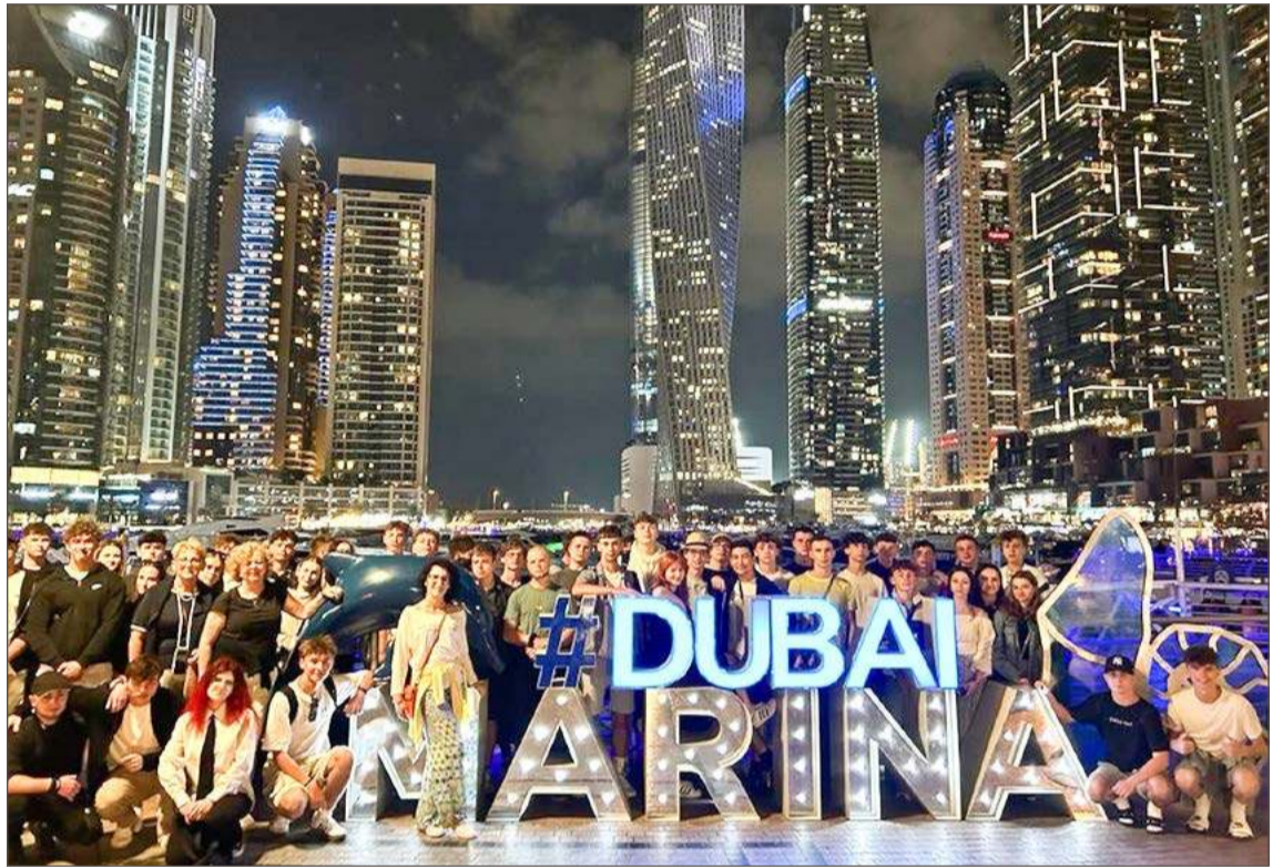
Młodzież z Kwiatka odwiedziła Dubaj już w zeszłym roku.

- Czego my się mamy tak naprawdę obawiać? Przecież mieszkamy na Podkarpaciu, więc wojnę mamy tuż obok siebie, na Ukrainie, od czterech lat. A ludzie i tak cały czas na wycieczki jeżdżą. Moja ko-