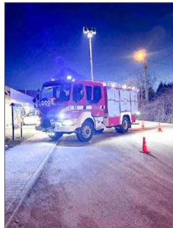
Kierująca motorowerem trafiła do szpitala w Dębicy.