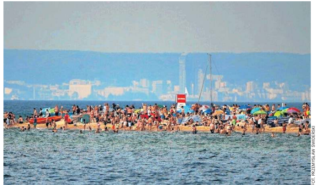
W ostatnich latach (wyjątkiem był rok ubiegły) Bałtyk latem był rekordowo ciepły

- Przyczyn powstawania dużych wlewu barotropowych należy doszukiwać się w różnicy poziomów wody pomiędzy Bałtykiem a Morzem Północnym. Znacząca różnica poziomów może powstać jedynie wskutek układu barycznego