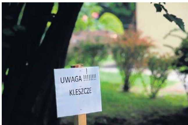
Populacja kleszczy roznoszących kleszczowe zapalenie mózgu rozrasta się. Są już w naszym regionie

Dwa z tych przypadków powiązane z pobytem chorego za granicą (Szwajcaria, Niemcy), w dwóch innych chorzy w momencie pokucia przez kleszcza przebywali na terenie innych województw (mazowieckiego i łódzkiego).