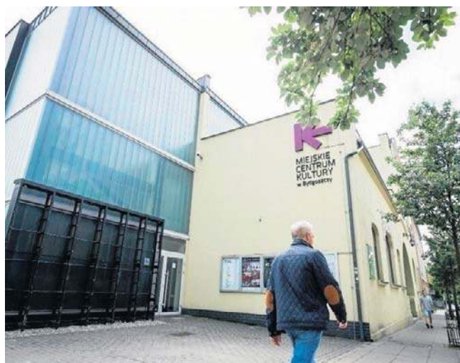
Zgłoszenia projektów w ramach Dzielnicowego Programu Kooperacje-Fordon można przesyłać do 24 kwietnia

Wnioski do programu Kooperacje-Fordon (dostępne na stronie internetowej www.mck-bydgoszcz.pl ) można składać do 24 kwietnia, do godziny 14.00. Po wypełnieniu należy zapisać je w formacie PDF i wysłać na adres: kooperacje-fordon@mck-bydgoszcz.pl. ©