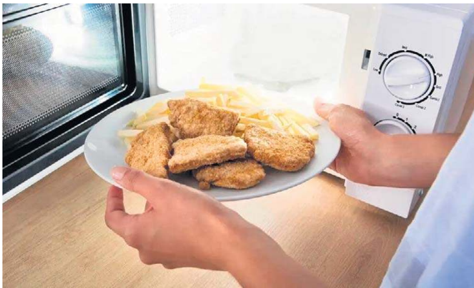
Dania gotowe najczęściej zawierają niewiele warzyw i witamin, a więcej soli, cukrów prostych, nasyconych kwasów tłuszczowych i kalorii

- W dłuższej perspektywie nadużywanie gotowych posiłków może pogarszać ogólną jakość diety, wiążąc się z niedoborami pokarmowymi i zwiększać ryzyko wystąpienia nadmiernej masy ciała czy chorób