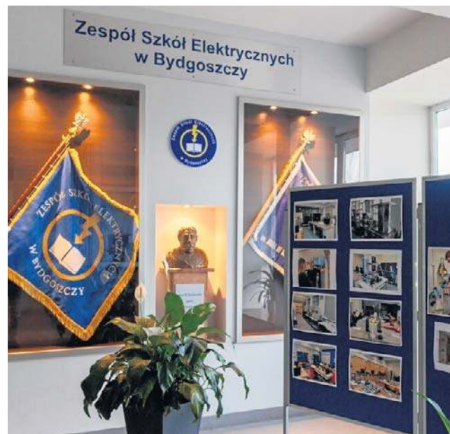
W sobotę w Zespole Szkół Elektrycznych przy ul. Stawowej, w godz. 13.30-16, odbędzie się „Spotkanie po latach”