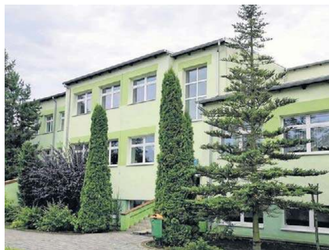
W 2011 roku SP w Kołaczku została ocieplona i otynkowana. Dziś boryka się z problemami

tworzyć oddziału zerowego w Kołaczku i zaproponowałem rodzicom aby 6-latk i 7-latk rozpoczęły edukację w istniejących oddziałach SP nr 1 w Szubinie - informuje Mariusz Piotrowski, burmistrz Szubina.