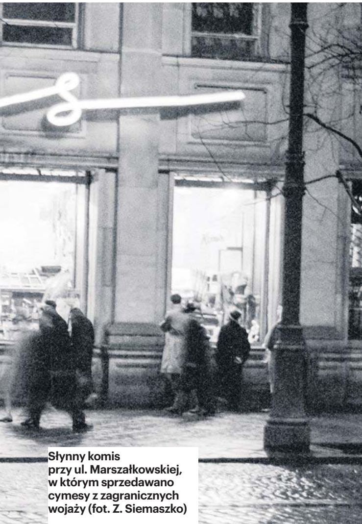
Słynny komis przy ul. Marszałkowskiej, w którym sprzedawano cymesy z zagranicznych wojaży

wstwiało się do komis na Nowym Świecie przy Chmielnej za dwieście pięćdziesiąt złotych”.