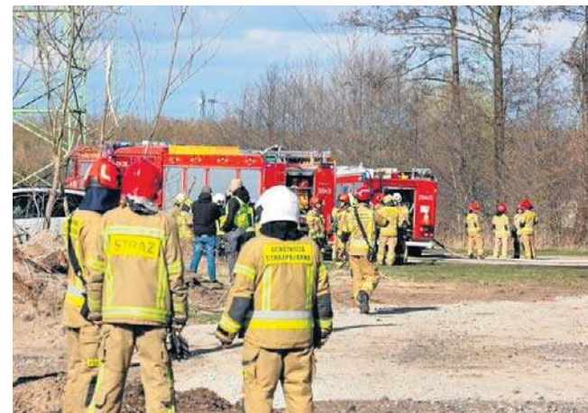
W środę na miejscu pożaru butli z acetylenem w Bydgoszczy pracowało nadal około 50 strażaków

- Strażacy nadal pracowali w strefie ochronnej. Działania wspomagane były za pośrednictwem dwóch robotów gaśniczych i działek wodnych - mówiła st. bryg. Małgorzata Ja-