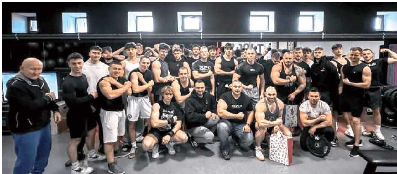
Pamiątkowe zdjęcie uczestników zmagania

- Mam 24 lata i trenuję od 12 roku życia, czyli już połowę życia! Do zawodów nie przygotowywałem się specjalnie. Po prostu trenowałem na co