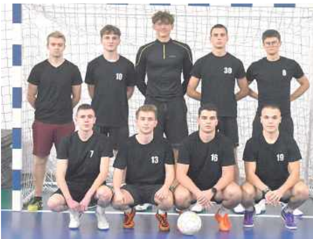
WKS Iskra Swaty