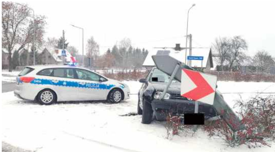
Badanie alkomatem wykazało, że mężczyzna miał w organizmie ponad 2,5 promila alkoholu. Kierowca stracił prawo jazdy, a wkrótce usłyszy zarzuty kierowania pojazdem w stanie nietrzeźwości oraz spowodowania zagrożenia bezpieczeństwa w ruchu drogowym

- Połączenie spożywania alkoholu, jazdy samochodem oraz trudnych zimowych warunków drogowych może prowadzić do bardzo niebezpiecznych zdarzeń - ostrzega asp. Łukasz Filippek,