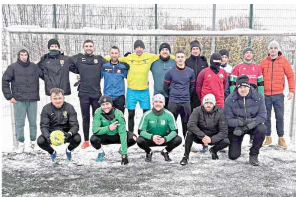
Pamiątkowe zdjęcie uczestników niecodziennego meczu

Zgodnie z tradycją spotkanie miało nie tylko sportowy, ale przede wszystkim integracyjny charakter. W historii na murawie pojawiali się nie tylko piłkarze Ma-