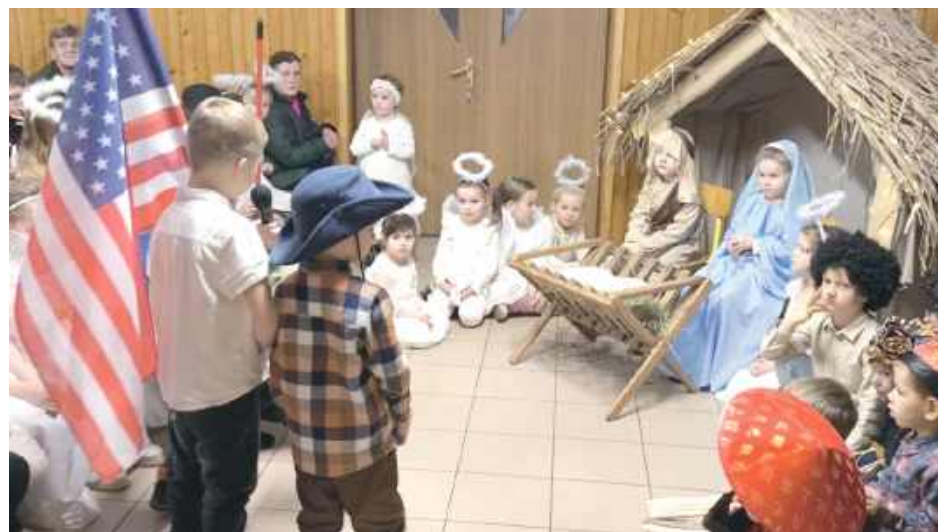
W przedstawieniu udział wzięły dzieci z oddziałów przedszkolnych oraz uczniowie szkoły, którzy z dużym zaangażowaniem i dziecięcą radością wprowadzili widzów w wyjątkowy klimat Świąt Bożego Narodzenia

W Szkole Podstawowej w Niedźwiedziu odbyły się jasełka bożonarodzeniowe, które zgromadziły społeczność szkolną na wspólnym przeżywaniu świątecznego czasu.