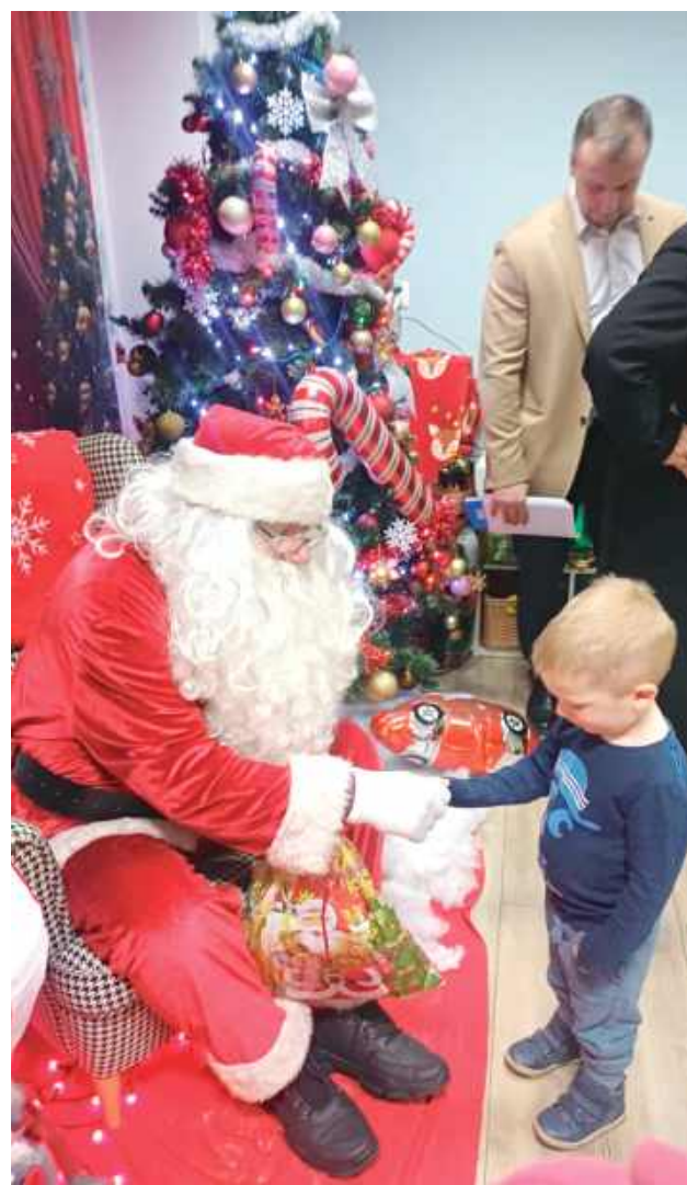
W dniu otwarcia świetlicy nie zabrakło wyjątkowego gościa

od początku aktywnie angażował się w remont świetlicy. Jego pomoc, obecność i ogromne zaangażowanie miały kluczowe znaczenie na każdym etapie prac, zarówno organizacyjnych, jak i fizycznych - kończy Renata Grążka.