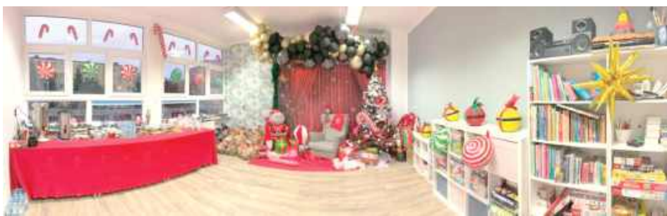
Świetlica wygląda pięknie. W Dęblinie powstało miejsce zabawy, nauki dla dzieci i młodzieży