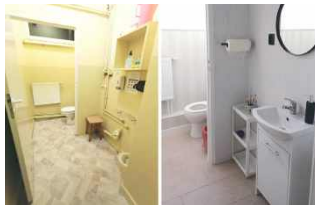
mp „Przed” i „po” remoncie. Efekt widać gołym okiem