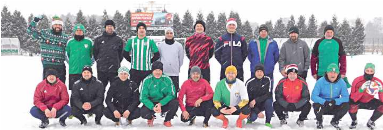
Pamiątkowe zdjęcie z meczu Zielonych z Niebieskimi

Nowy Rok w Rykach od kilkunastu lat ma nie tylko wymiar symboliczny, ale i sportowy. Wszystko zaczęło się w 2011 roku, kiedy po raz pierwszy piłkarze, byli zawodnicy oraz sympatycy Ruchu Ryki spotkali się na boisku, by wspólnie zainauguować kolejny rok.