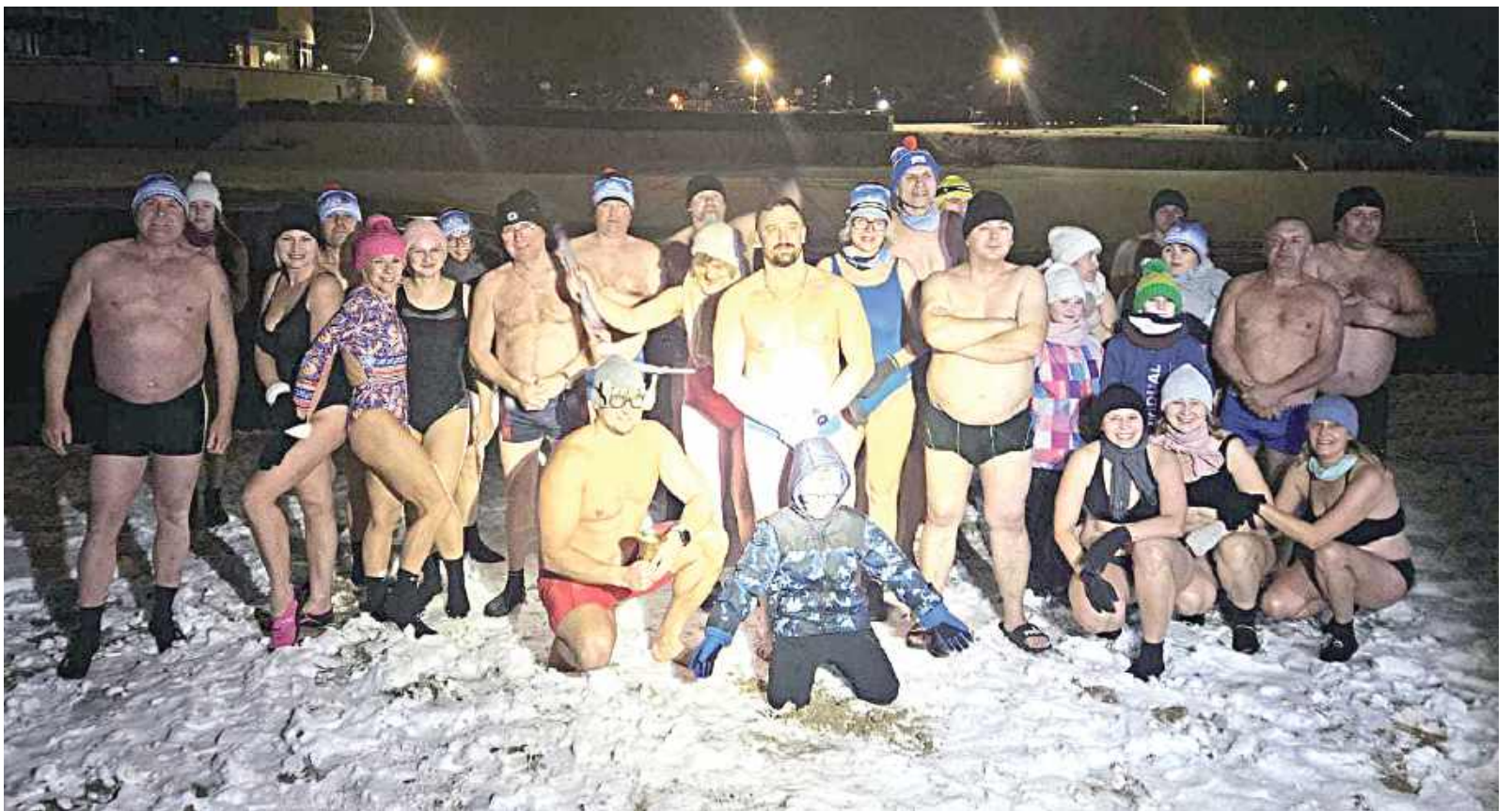
Grupa uczestników morsowania noworocznego