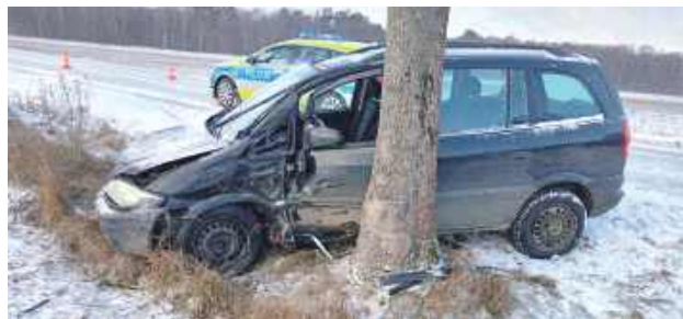
W wyniku poślizgu samochód zjechał z jezdni i zakończył jazdę na drzewie. Kobieta została przetransportowana do szpitala. Na szczęście nie doznała poważnych obrażeń

Zimowe warunki na drogach powiatu ryckiego dają się kierowcom we znaki. Śliska nawierzchnia i niskie temperatury były przyczyną groźnego zdarzenia drogowego, do którego doszło ostatniego dnia roku w miejscowości Wola Zadybska. 50-letnia kobieta kierująca oplem straciła panowanie nad pojazdem i uderzyła w przydrożne drzewo.