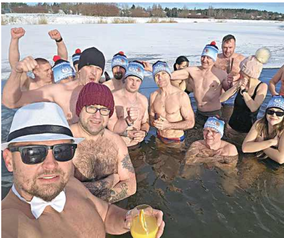
Sylwestrowe morsowanie wielkiej rodziny Nieformalnego Klubu Morsa - Z Łabędziem Być

- To dobre samopoczucie, poprawa nastroju, a nawet zmniejszenie stresu i lęków. Wyrzut hormonów, takich jak dopamina, endorfiny, adrenalina czy testosteron, działa niemal jak naturalny doping dla organizmu. W tym sezonie morsuję codziennie od 30 listopada, po 3-5 minut i czuję się