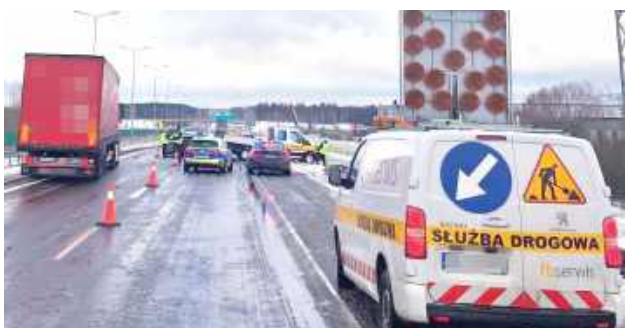
Tego dnia na ekspresowce w miejscu kolizji na drodze było ślisko. Po zdarzeniu policja zaapelowała o skierowanie tam dodatkowych piaskarek

44-latką z Lublina była trzeźwa. Pracownicy służby drogowej zostali przewiezieni do szpitala. Przez dłuższy czas przez policyjne czynności wykonywane na miej-