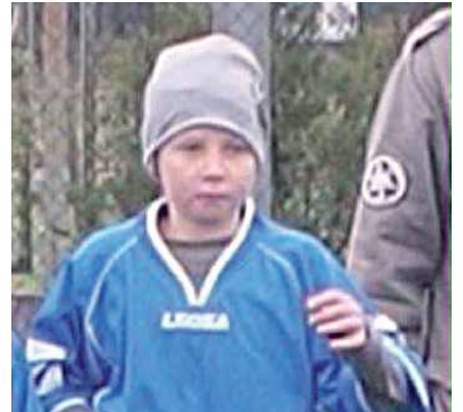
Młody „Sebuś” podczas gry w Ruchu Ryki

- Zależy od poczucia humoru. Lubię to i to. Czasem potrzebuję ludzi i energii, a czasem chwili tylko dla siebie.