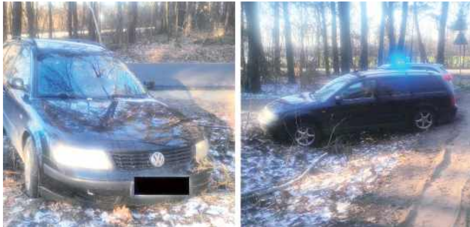
Dzięki szybkiej reakcji świadka zdarzenia kobieta została zatrzymana, a interweniujący policjanci potwierdzili, że kierowała pojazdem w stanie nietrzeźwości

W świąteczny czwartek w miejscowości Lasocin doszło do niebezpiecznego zdarzenia drogowego. 55-letnia mieszkanka powiatu ryckiego straciła panowanie nad samochodem i wjechała do przydrożnego rowu.