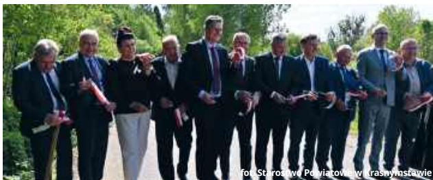
fol. Starostwo Powiatowe w Krasnostawie

● GM. GORZKÓW Symboliczne przecięcie wstęgi i trzy zakończone inwestycje warte łącznie ponad 6,5 mln zł. W gminie Gorzków odbyło się uroczyste podsumowanie projektów, które mają poprawić komfort życia mieszkańców, bezpieczeństwo na drogach oraz warunki nauki w lokalnej szkole.