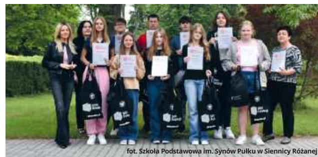
fol. Szkoła Podstawowa im. Synów Pułku w Siennicy Różanej

Konkurs „ Silni Polską! ”, organizowany przez Instytut Pamięci Narodowej , składał się z trzech etapów. Na początku uczestnicy brali udział w ponad 400 warsztatach historycznych. W drugim etapie uczniowie uczestniczyli w spacerach edukacyjnych, rajdach, odwiedzali