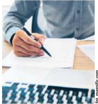
Gmina Leśniewice prowadzi czynności administracyjne w sprawie wydania decyzji o środowiskowych uwarunkowaniach dla biogazowni w Janówce.

Mieszkańcy mogą zapoznać się z dokumentacją dotyczącą inwestycji w siedzibie Urzędu Gminy Leśniewice, w Referacie Inwestycji, Gospodarki Komunalnej, Ochrony Środowiska i Rolnictwa (pokój nr 3c).