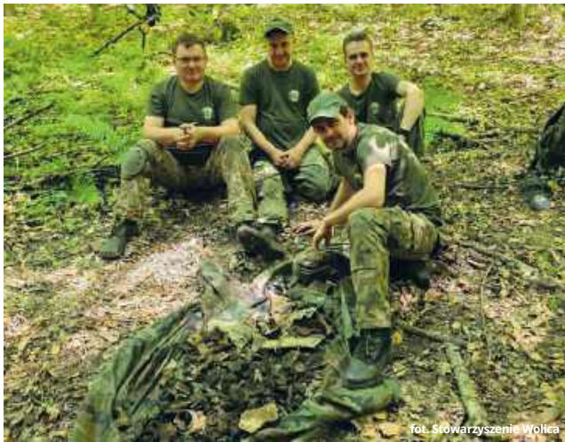
fol. Stowarzyszenie Wolica

Ślady wojny sprzed ponad 80 lat wciąż kryją się pod ziemią Lasu Orłowskiego w gminie Izbica. Pasjonaci historii i militariów przeszukali miejsce katastrofy niemieckiego bombowca, który rozbił się tam 3 kwietnia 1944 roku po bombardowaniu wsi Majdan Sitaniecki. W ziemi do dziś znajdują się fragmenty samolotu, a miejsce katastrofy nadal nosi wyraźne ślady tragicznych wydarzeń z czasów II wojny światowej.