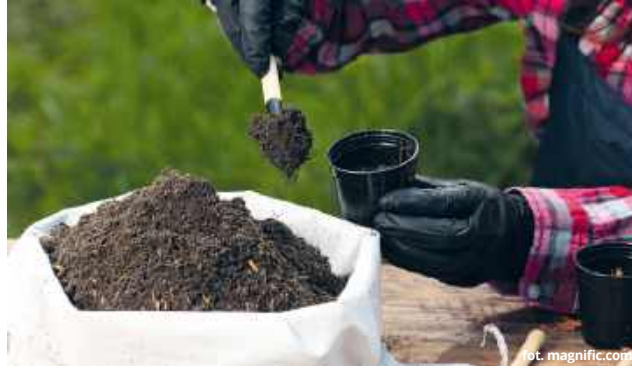
Mieszkańcy, którzy zainteresowani są działalnością spółki Agrocal w Buśnie mogą zająć stanowisko w sprawie planów

Przedsiębiorca podkreśla, że prowadzi swoją działalność od ponad 20 lat i czuje się nękany licznymi kontrolami. W sporze