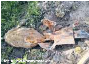
fol. KPP w Krasnymstawie

● GM. IZBICA Podczas prac ziemnych w Tarnogórze ujawniono bombę lotniczą z okresu II wojny światowej. Miejsce zabezpieczyli policjanci, a niewybuch przejęli saperzy.