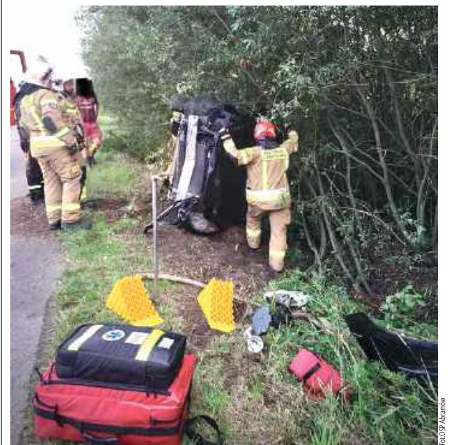
Jak informuje OSP KSRG Abramów do zdarzenia doszło na drodze Abramów - Wola Przybysławska

Do zdarzenia doszło 10 sierpnia. Jak informuje OSP KSRG Abramów do zdarzenia doszło na drodze Abramów - Wola Przybysławska. Według zgłoszenia jedna osoba była poszkodowana.