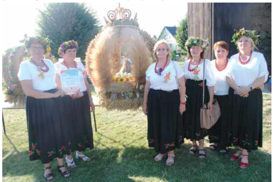
Wieniec z Annoboru, I miejsce w kategorii wieńców tradycyjnych

- Becuś to taka nasza regionalna brzezińska potrawa, a głównym składnikiem są ziemniaki i kasza, przepalana w piecu chlebowym. Ucieramy ziemniaki, w zależności od tego, ile chcemy. Jak chcemy dużo, to ucieramy 3 kg, jak małą blaszkę - 1 kg ziemniaków. Do tego dodajemy 30 dag, na dużą blachę 60 dag, podsmażonego na cebulce boczku i szklankę kaszy i to pieczemy