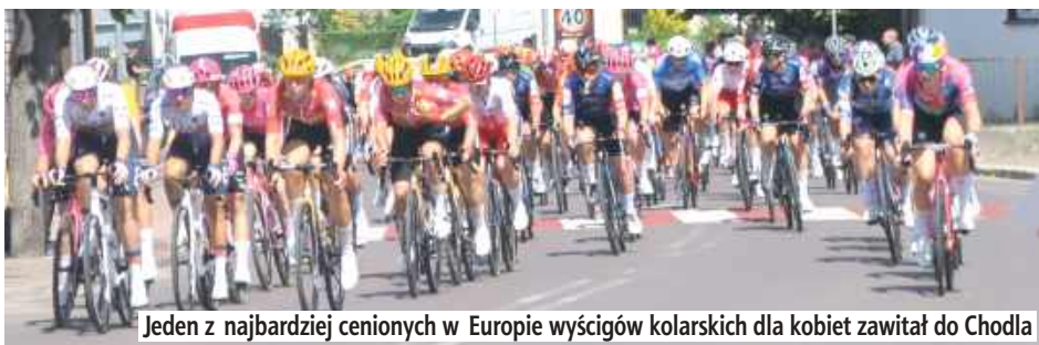
Jeden z najbardziej cenionych w Europie wyścigów kolarskich dla kobiet zawitał do Chodla

Kolarskie emocje na najwyższym poziomie zawitały do gminy Chodel.