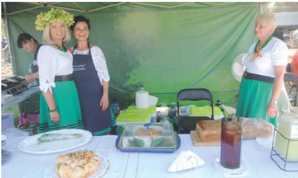
KGW Rokitno bez Granic