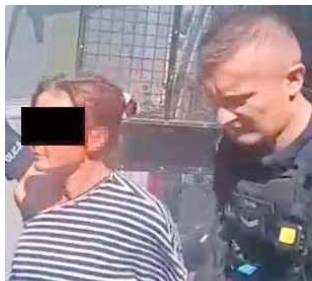
Kobieta została zatrzymana i doprowadzona do policyjnego aresztu

Opole Lubelskie: Środek dnia (poniedziałek, 11 sierpnia), centrum Opola Lubelskiego, pod wiatą przystankową siedzą trzy osoby - dwóch mężczyzn i kobieta. Policjanci podjeżdżają radiowozem, a wtedy zaczyna się scena jak z filmu. Jeden z mężczyzn nerwowo chowa coś pod koszulkę - jak się okazuje - zgniecioną puszkę po piwie. Ale prawdziwa akcja rozgrywa się obok.