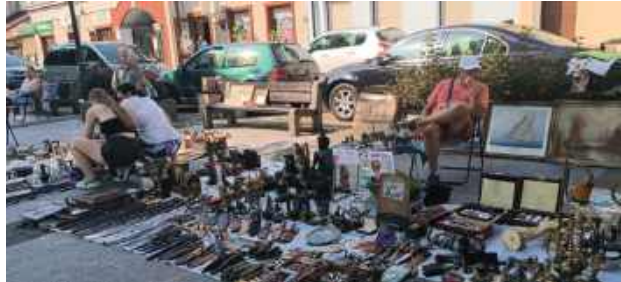
Jak co miesiąc można było obejrzeć lub kupić wiele kolekcjonerskich przedmiotów

Na giełdzie można obejrzeć lub kupić stare monety, ozdoby, obrazy świeczniki, militaria, książki, zabawki i wiele innych przedmiotów. W przeciwieństwie do giełdy lipcowej, gdy po-