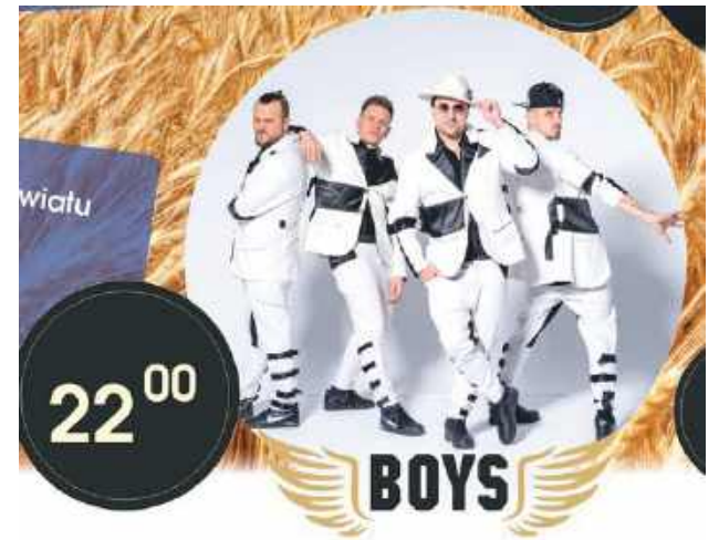
Boys - gwiazda dożynek powiatowych

O godz. 22.00 - na scenę wkroczy gwiazda wieczoru - zespół Boys