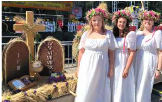
Wieniec wykonany przez sołectwo Siedliska

nalnych przysmaków. Goście częstowani byli m.in. pierogami ruskimi i z grzybami, knezlami z mięsem, pyzami, flakami, bigosem, chłop-dogami, chlebem ze smalcem czy kompotem z pyrzu sporządzonego według receptury znanej tylko KGW Syrakius. Na miłośników słodkości czekały domowe wypieki, a na dzieci, kolorowa wata cukrowa od KGW Dąbrówka. Podczas dożynek zaprezentowało się około 50 stoisk.