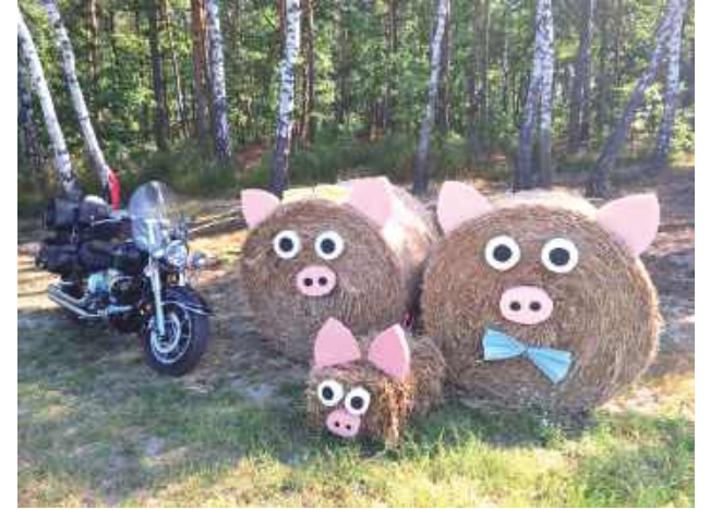
Dożynkowe witacze zwracały uwagę już z daleka