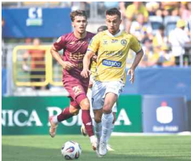
Po czterech rozegranych meczach Motor ma na koncie pięć punktów