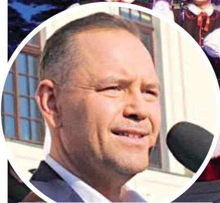
Karol Nawrocki był w Lubartowie niedługo przed drugą turą wyborów