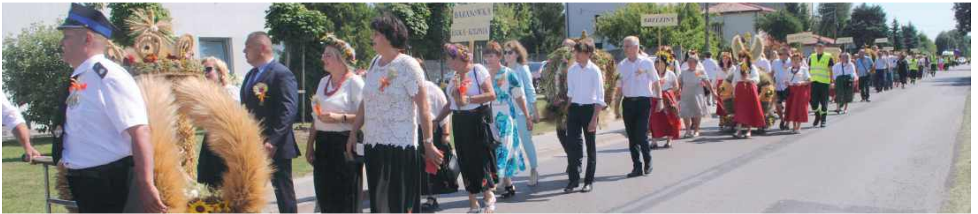
Korowód dożynkowy w Lisowie