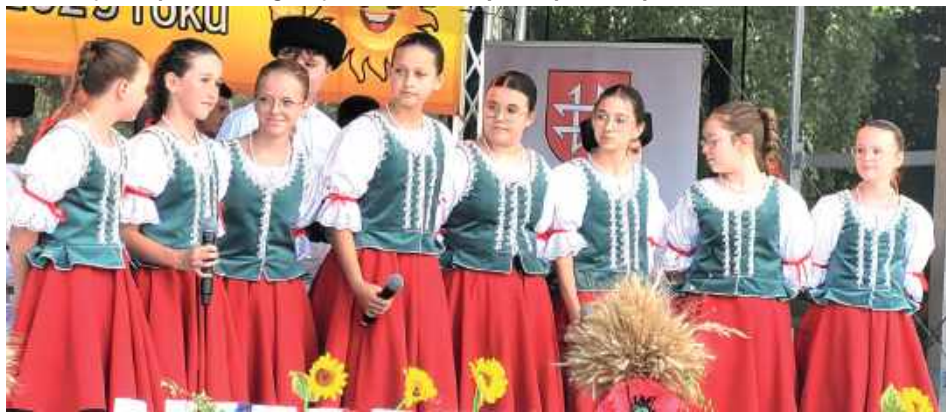
Zespół Sokół zaprezentował umiejętności wokalne i taneczne

nalnych przysmaków. Goście częstowani byli m.in. pierogami ruskimi i z grzybami, knezlami z mięsem, pyzami, flakami, bigosem, chłop-dogami, chlebem ze smalcem czy kompotem z pyrzu sporządzonego według receptury znanej tylko KGW Syrakius. Na miłośników słodkości czekały domowe wypieki, a na dzieci, kolorowa wata cukrowa od KGW Dąbrówka. Podczas dożynek zaprezentowało się około 50 stoisk.