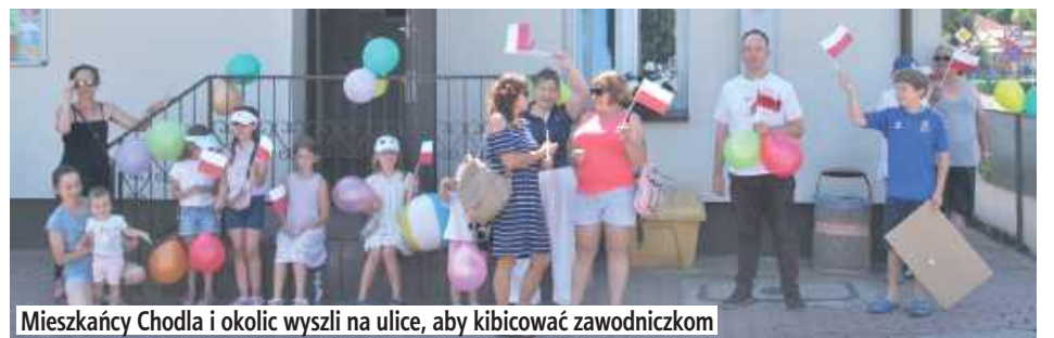
Mieszkańcy Chodla i okolic wyszli na ulice, aby kibicować zawodniczkom

– To wielka dumą i radością, że Chodel znalazł się na mapie tak prestiżowego wyścigu. To wydarzenie nie tylko promuje naszą