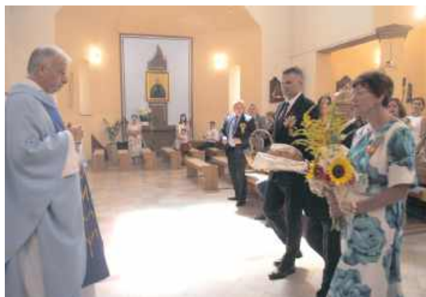
Msza święta w kościele w Lisowie i dary od władz gminy