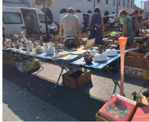
Na giełdzie były ozdobne naczynia, zegary, figurki itp.