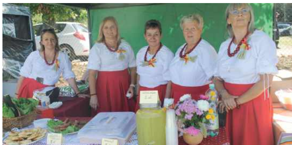
KGW w Trzcincu