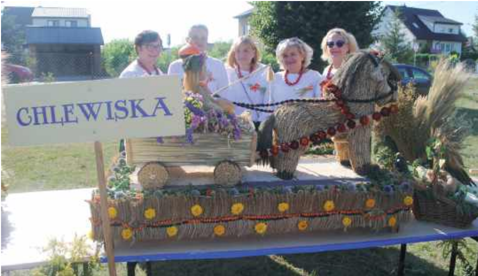
Wieniec z Chlewisk, I miejsce w kategorii wieńców współczesnych KGW z Chlewisk

- Wieniec powstawał przez miesiąc, wykonywało go 6 osób. Mężowie robili konstrukcję wieńca. Powstał z owsa, pszenicy, pszenżyta, żyta, jęczmienia. Podobał nam się taki wieniec na dożynkach w poprzednich latach, więc taki zrobiliśmy. Nasze koło istnieje od siedmiu lat