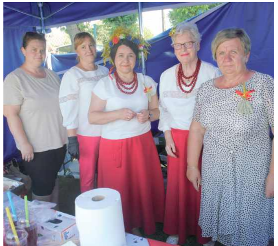
KGW z Brzezin

- Becuś to taka nasza regionalna brzezińska potrawa, a głównym składnikiem są ziemniaki i kasza, przepalana w piecu chlebowym. Ucieramy ziemniaki, w zależności od tego, ile chcemy. Jak chcemy dużo, to ucieramy 3 kg, jak małą blaszkę - 1 kg ziemniaków. Do tego dodajemy 30 dag, na dużą blachę 60 dag, podsmażonego na cebulce boczku i szklankę kaszy i to pieczemy