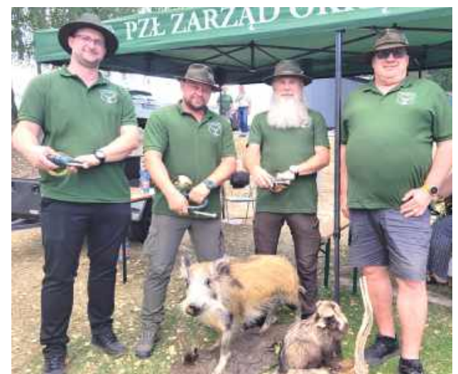
Koło Łowieckie Lis