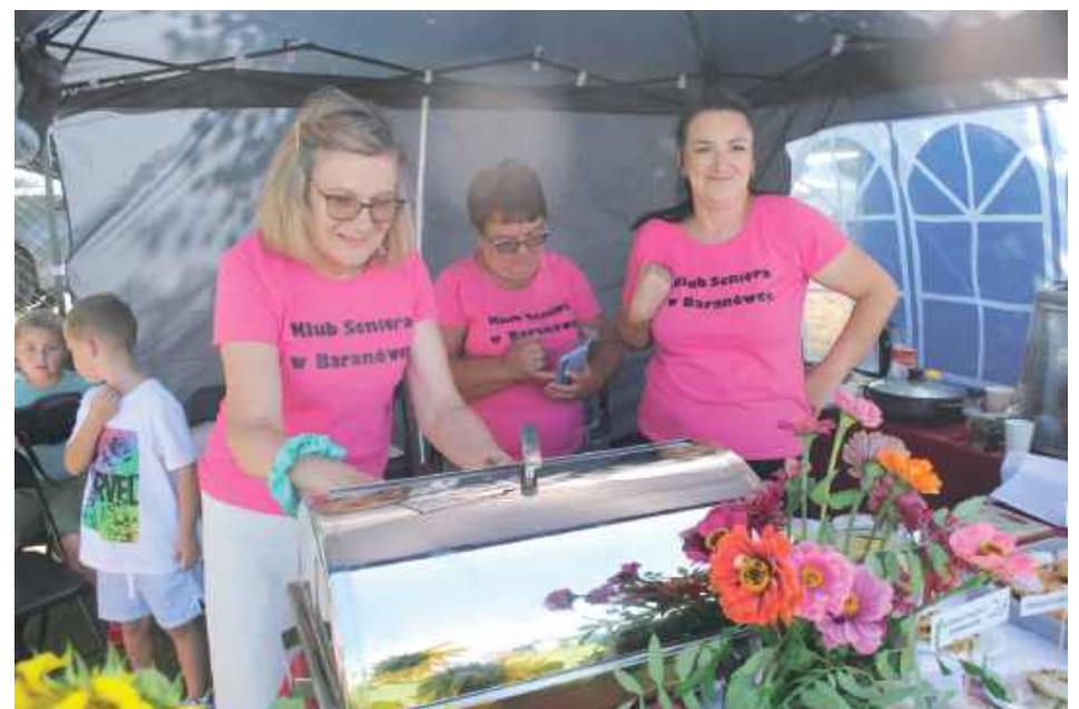
Klub Seniora w Baranówce