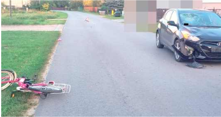
Potrącona dziewczynka doznała obrażeń ciała i została przetransportowana karetką pogotowia do szpitala. Całe szczęście w momencie zdarzenia dziecko miało założony na głowie kask ochronny

Policjanci przypominają o konieczności zapewnienia dzieciom odpowiedniej opieki w rejonie dróg. Nawet chwilo-