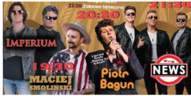
Oni zagrają w Abramowie

Wśród atrakcji organizatorzy wymieniają rejs motorówką po Jeziorze Maśluchowskim.