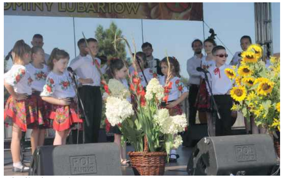
Mała Rokiczanka na scenie