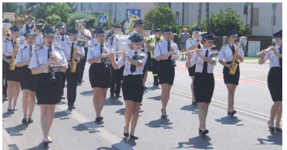
Orkiestra dęta OSP

- Wieniec zaczęliśmy robić dużo wcześniej. Wykorzystany jest jęczmień, pszenica, żyto i owies. Wykonywało go 4-5 osób. wieniec symbolizuje koronę Matki Boskiej. Anieli zabrali Matkę Boską żywcem do nieba, w środku jest anioł, który czyta modlitwę. Zaczęliśmy robić wieniec w czerwcu. Nasze koło istnieje drugi rok, liczy około 40 członków