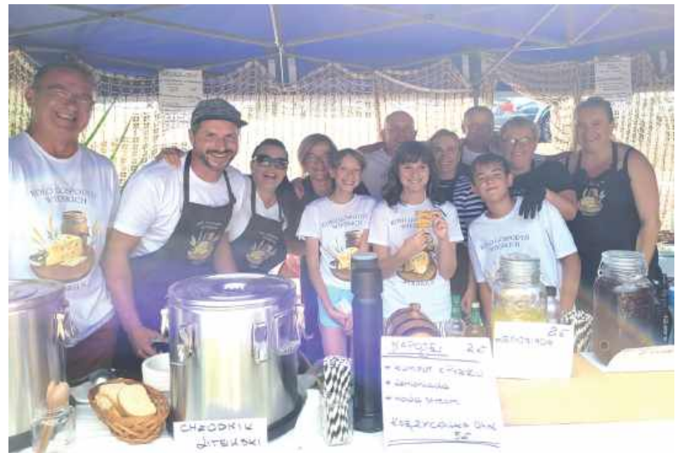
Chłodnik Litewski, lemoniada, kompot z pyrzu, a nawet księżycówka KGW Syrakius serwowało i coś do picia, i coś do jedzenia