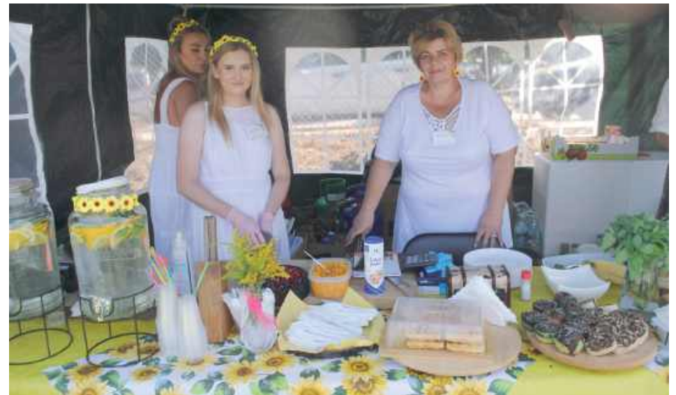
KGW w Wandzinie