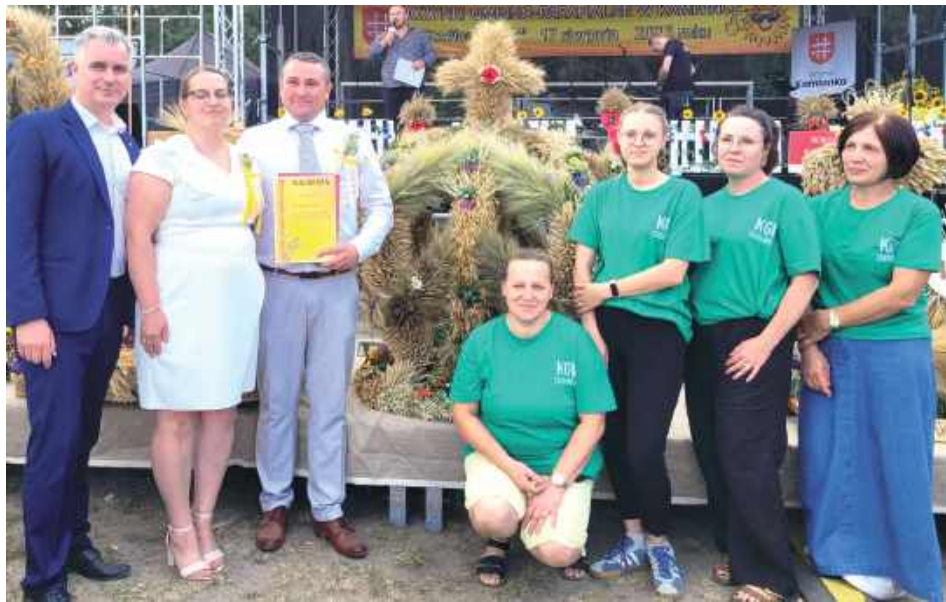
Tytuł najpiękniejszego wieńca dożynkowego w tym roku otrzymało sołectwo Stanisławów Duży, to ich wieniec będzie reprezentował gminę Kamionka na dożynkach powiatowych

Jak to na dożynkach bywa, nie mogło też zabraknąć regio-