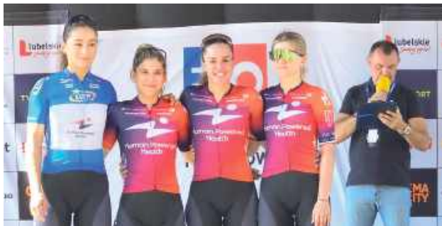
Przed startem wyścigu nastąpiła prezentacja poszczególnych zespołów, a każda z zawodniczek złożyła swój podpis na liście startowej

Od wczesnych godzin porannych w sercu Nałęczowa