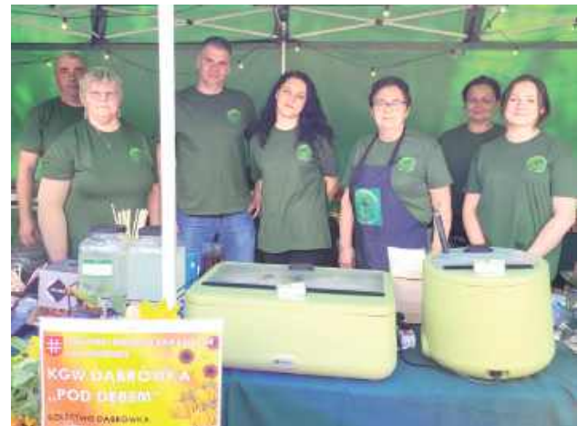
Na stoisku KGW Dąbrówka Pod Dębem znalazły się m.in. pierogi, zupa krem z borowików, lemoniada, ciasta, a nawet kolorowa wata cukrowa