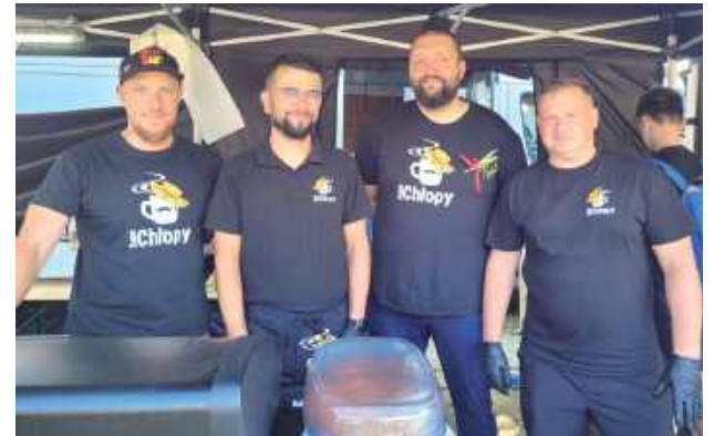
Tych panów chyba każdy zna - Same Chłopy, a ich dania to kiełbasa, kurczak, karkówka, frytki, chłop-dogi i czarna z mlekiem lub mrożona