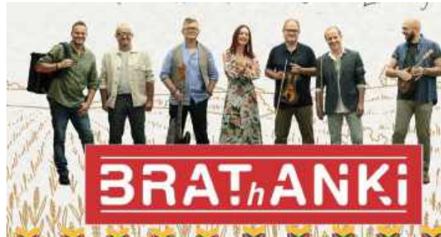
Brathanki zagrają w Ostrowie Lubelskim

Koncerty na dożynkach Godz. 16.00 - Piękni i Młodzi Godz. 18.00 - News Godz. 20.30 - Eratox Godz. 21.30-24.00 - dyskoteka pod gwiazdami