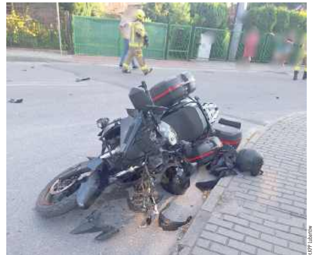
Do zderzenia samochodu osobowego z motocyklem doszło w niedzielę 10, sierpnia

51-letni motocyklista z obrażeniami ciała został przetransportowany do szpitala - informuje lubartowska policja.