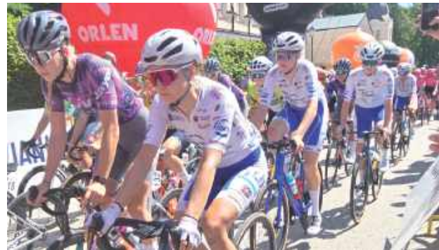
Start kolarek z Parku Zdrojowego

czuć było sportowe emocje. Już o 11:00 rozpoczęła się oficjalna prezentacja drużyn biorących udział w wyścigu. Punktualnie o 12:15 burmistrz oddał honorowy strzał