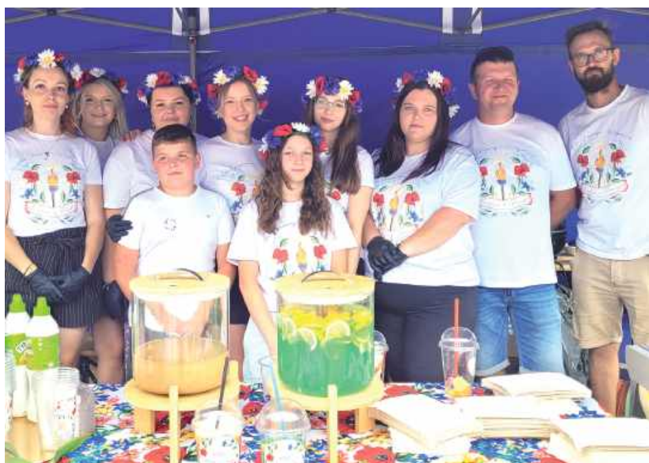
Kolorowe stoisko KGW Amelin