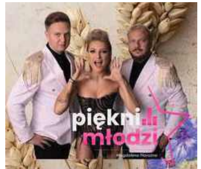
Piękni i Młodzi zagrają w Uścimowie