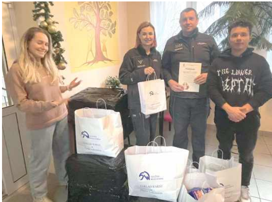
Dzięki wewnętrznej zbiórce zorganizowanej w jednostce przygotowano świąteczne paczki dla dzieci z Domu Dziecka im. Janusza Korczaka w Lublinie

Przedświąteczny czas w Zakładzie Karnym w Opolu Lubelskim upłynął pod znakiem pomocy, empatii i twórczego zaangażowania. Funkcjonariusze przygotowali świąteczne prezenty dla dzieci z Domu Dziecka w Lublinie, a osadzeni z oddziału terapeutycznego włączyli się w działania charytatywne, tworząc rękodzieło i ucząc się nowych, pozytywnych sposobów przeżywania świąt.