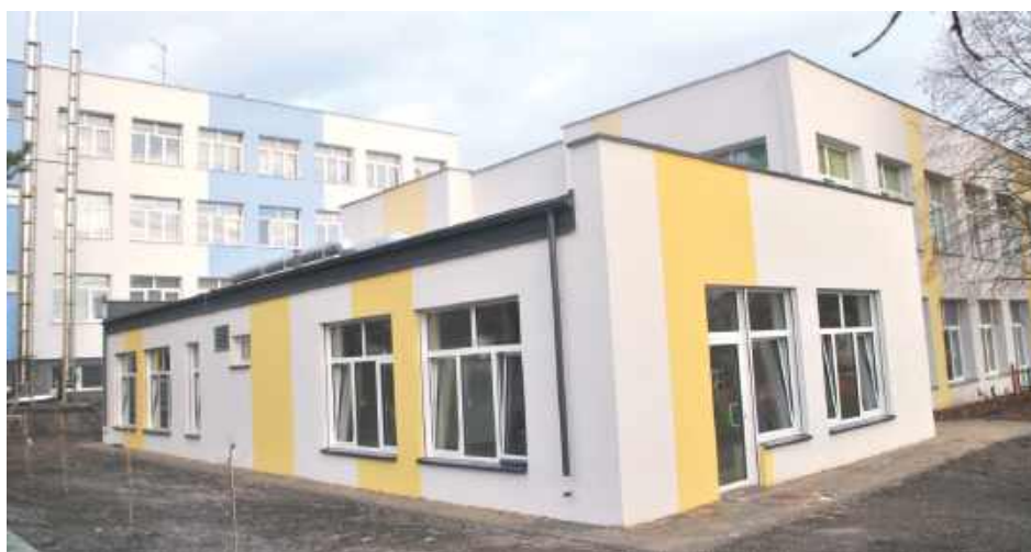
Całkowita wartość projektu wynosi 1 549 955,23 zł, z czego ponad milion złotych stanowi dofinansowanie z Funduszy Europejskich dla Lubelskiego

Część prac zaplanowano jeszcze na przyszły rok. Dotyczyć