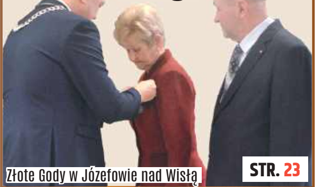
Złote Gody w Józefowie nad Wisłą

Gmina Józefów nad Wisłą: Pół wieku wspólnej drogi