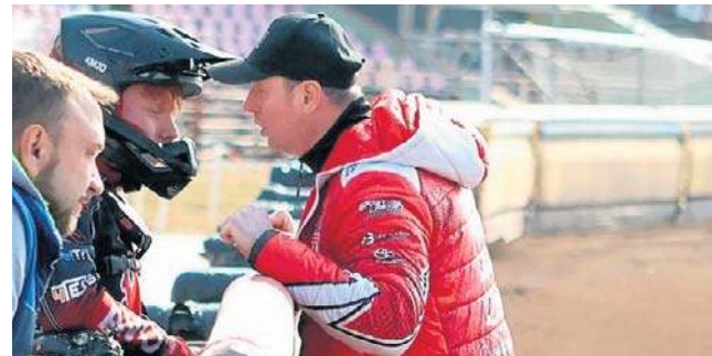
Abramczyk Polonia czeka na piątkowe starcie w Toruniu, dzień wcześniej spotka się z kibicami

W Tauron Lidze rusza play off Dziś (g. 20) w Rzeszowie Metalikas Pałac Bydgoszcz rozpocznie walkę w play off. Rywalkami będzie ekipa DevelopRes, zwycięzca sezonu zasadniczego. Gra się do dwóch zwycięstw. Mecz w Polsat Sport 1.