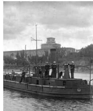
„Neptun” wpływa do Modlina. W tle twierdza

Spotkanie odbędzie się jutro o godzinie 17.30 w Muzeum Twierdzy Toruń w Koszarach Bramy Chełmińskiej przy Wałach gen. Sikorskiego 23. Wstęp, jak zawsze, jest wolny. ©P