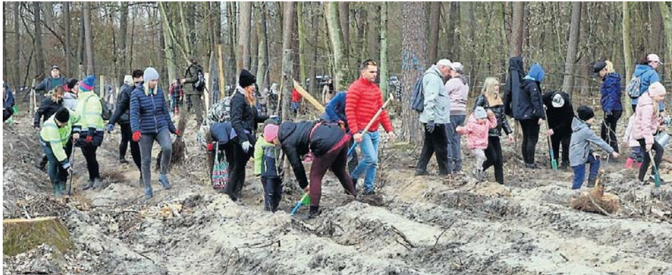
Akcja sadzenia lasu pod Grudziądzem. Chętnych nie brakowało

● Nadleśnictwo Woziwoda - 30 marca 2026 r.