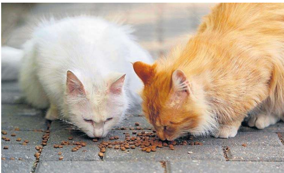
- Brakuje skutecznego nadzoru nad produkcją karm dla kotów i psów, w tym nad zapewnieniem zgodności produktu z recepturą - ocenia Inspekcja

Co piąta karma była źle opisana. Brakowało informacji