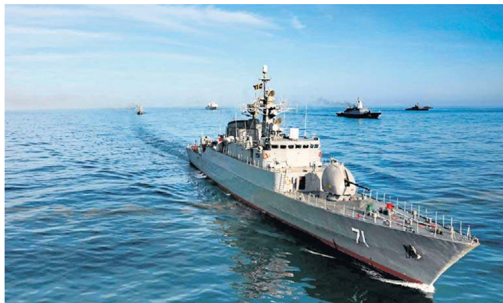
Stany Zjednoczone starają się ponownie otworzyć Cieśninę Ormuz dla dostaw surowców energetycznych

W sobotę Trump zapowiedział, że irańskie elektrownie staną się celem ataków, jeśli Teheran nie otworzy całkowicie Cieśniny Ormuz dla ruchu statków w ciągu 48 godzin. Termin ten upłynął po północy z niedzieli na poniedziałek czasu polskiego.