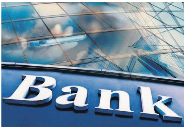
Banki w Polsce mają za sobą rekordowy rok. Do akcjonariuszy może trafić nawet 25 mld zł dywidend, choć wyniki w 2026 r. mogą być już słabsze

Należy jednak pamiętać, że bank w ubiegłym roku na poczet zaliczki dywidendy przeznaczył już 448 551 276,72 zł. Zaliczka na poczet dywidendy na jedną akcję wynosiła 3,44 zł brutto. Ostatecznie wyniki za ubiegły rok dopiero poznamy.