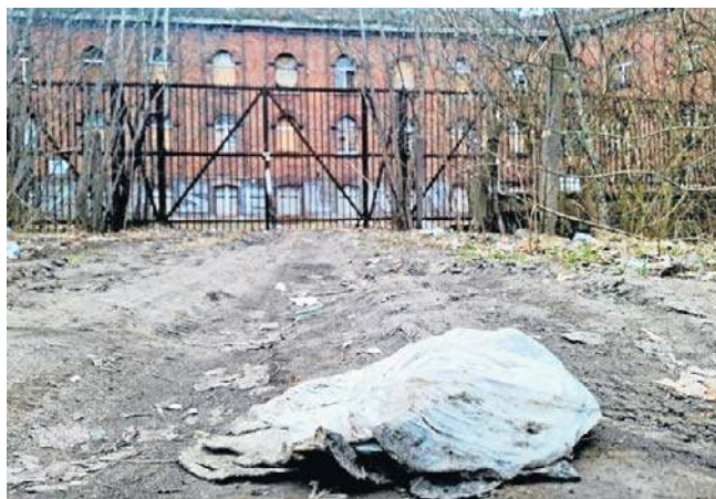
Tak wygląda obecnie zabytkowy Fort Jakuba

Za czasów rządów PiS minister kultury Piotr Gliński odmówił miastu dotacji na stworzenie w nim muzeum „Baza Zo” (na kanwie życiorysu generała Elżbiety Zawackiej). Obecny resort, pod wodzą minister Marty Cienkowskiej, nie przyznał natomiast miastu dotacji na remont dachu i zabezpieczenie fortu przed dalszą degradacją i zniszczeniem. Takie cele już w tytule wniosku Torunianie zawarli, licząc na 3,75 mln zł wsparcia z programu „Ochrona Zabytków ruchomych i nieruchomości 2026”.