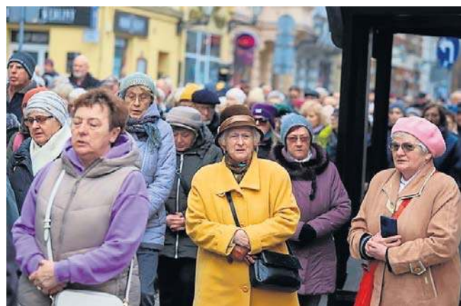
Droga Krzyżowa w Toruniu w 2025 roku

- Podobnie jak w ubiegłych latach będziemy szli w ciszy i skupieniu. Podczas mszy świętej w kaplicy w Brzezinku będziemy modlić się we wszystkich intencjach, które wypiszecie na kartkach i złożycie do skarbonki przy figurze Matki Bożej Fatimskiej. Planujemy zatrzymanie na krótki odpoczynek w Młyńcu Pierwszym. Zabierzmy ze sobą krzyże, latarki, kamizelki odblaskowe oraz stosowne do pogody ubranie. Można do nas dołączyć na każdym etapie drogi, zwłaszcza podczas mszy świętej. Dalej przemarsz w stronę remizy, koło dawnej jednostki wojskowej, leśną drogą do Młyńca. Następnie asfaltem do Brzezinka. Powrót drogą gminną przy starym cmentarzu około północy. Będziemy mieli do dyspozycji samochód dla osób, które mogłyby zasłabnąć po drodze - podają organizatorzy. ©️