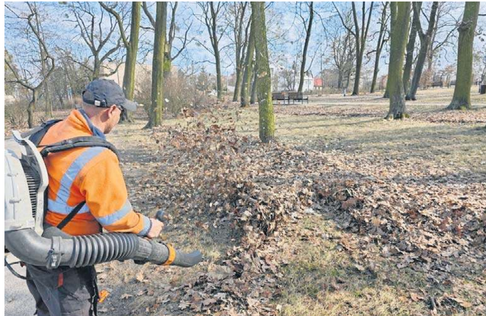
W planach są oczywiście nasadzenia zieleni w Toruniu. Najpierw jednak sprzątnięcie

Przygotowania do sezonu obejmują również nasadzenia roślin sezonowych. Od 15 maja są planowane nasadzenia roślin jednorocznych na rabatach w centrum miasta, bylin w donicach oraz kwiatów na wieżach kwiatowych.