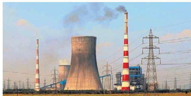
FOT. ADAM JANKOWSKI

Raport zwraca uwagę na zagrożenia geopolityczne wynikające z dominacji Chin w produkcji paneli PV i surowców niezbędnych do OZE. Polska, inwestując w OZE bez atomu i biogazu, może zastąpić zależność energetyczną od Rosji zależno-