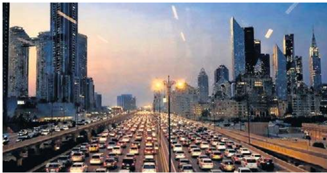
Polka mieszkająca w Dubaju od 20 lat obala mity i pokazuje, jak naprawdę wygląda prowadzenie biznesu w emiracie

Jesteśmy dobrze informowani, dowództwo obrony robi live'y z informacjami i instrukcjami. Wczoraj mieliśmy tylko jedno ostrzeżenie o ataku. Dostaliśmy komunikat na komórkę, żeby się schronić, a potem drugi, że już jest bezpiecznie. Poza tym wszyscy chodzą normalnie do pracy, biznesy działają normalnie. System edukacji funkcjonuje jak zwykle i żadne zmiany nie