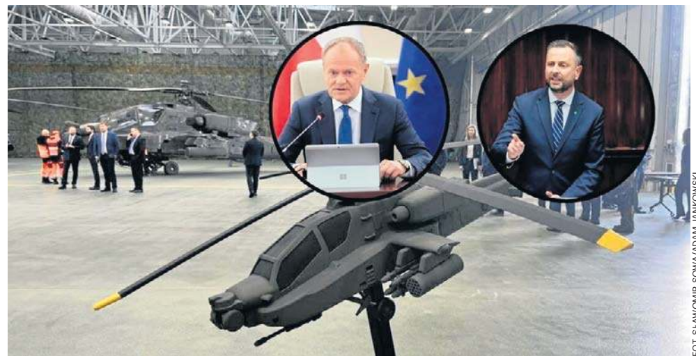
Władysław Kosiniak-Kamysz: Silna polska armia, dobrze wyposażony żołnierz Wojska Polskiego to gwarancja bezpieczeństwa

Jak mówił, silna polska armia, dobrze wyposażony żołnierz Wojska Polskiego to gwarancja bezpieczeństwa. - 96 Apache'ów to druga na świecie armia śmigłowców bojowych produkcji amerykańskiej, zaraz po Stanach