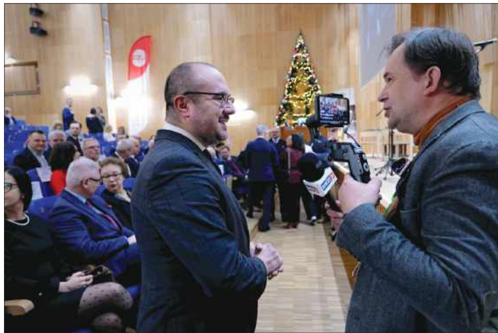
■ Paweł Jabłoński w Raciborzu na jubileuszu I LO, którego jest absolwentem. – Po upływie kilkunastu miesięcy od tej wiekopomnej reformy (ograniczenia zadawania zadań domowych) można z pewnością dokonać oceny skutków jej wprowadzenia – uważa poseł