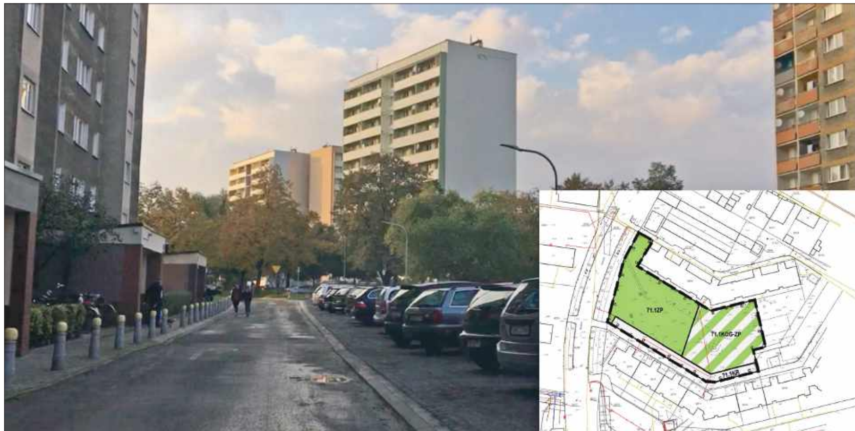
■ Osiedle wieżowców przy ulicy Katowickiej w Raciborzu. Inwestor chciał tam postawić kolejny blok mieszkalny, ale urząd miasta go zablokuje zapisem w planie zagospodarowania przestrzennego

D. Konieczny ponowił swoje pytanie: czy zdefiniowano i oszacowano ryzyka? On chciał wiedzieć z