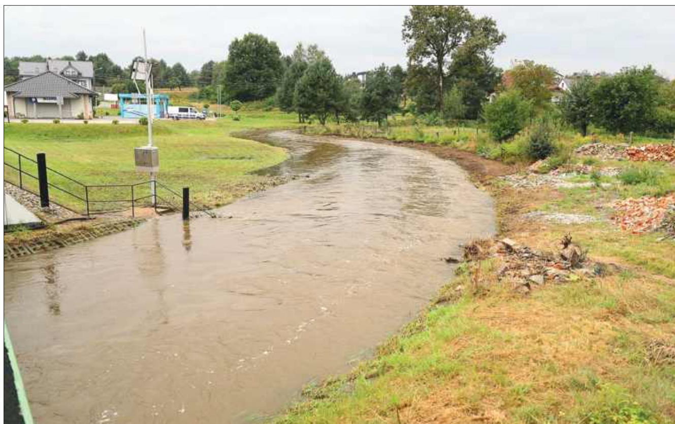
■ Rzeka Sumina sfotografowana z mostu przy ul. Jana Pawła II w Nędzy. Zdjęcie wykonano we wrześniu 2024 roku.