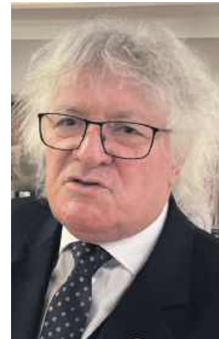
■ Senator z Koalicji Obywatelskiej, Henryk Siedlaczek uważa, że samo podniesienie kar nie rozwiąże problemu

Nowelizacja kodeksu wykroczeń zakłada m.in. zaostrzenie kar za wypalanie traw i rozniecanie ognia w lasach, na łąkach i torfowiskach. – Czy zaostrzone przepisy nie uderzą nadto w zwykłych ludzi, zwłaszcza mieszkańców wsi, którzy od lat w sposób kontrolowany spalają liście czy resztki roślin na własnych terenach? – z takim pytaniem wystąpił na forum izby wyższej senator ziemi raciborskiej, Henryk Siedlaczek.