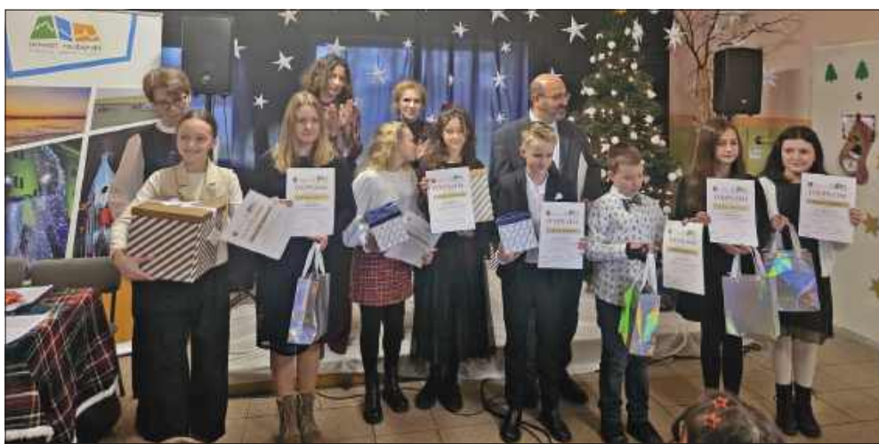
■ W Wojnowicach odbył się VII Powiatowy Konkurs „Śpiewajmy Małemu!”

W piątek, 12 grudnia, w Zespole Szkolno-Przedszkolnym w Wojnowicach odbył się VII Powiatowy Konkurs Kolęd i Pastorałek „Śpiewajmy Małemu!”. W wydarzeniu wzięli udział młodzi wykonawcy z całego powiatu. Do tegorocznej edycji zgłosiło się 59