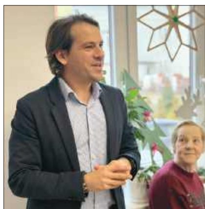
■ Wiceprezydent Michał Kuliga proponuje wspólne śpiewanie kolęd