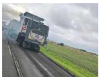
■ Remont prowadzony przez Powiat Raciborski w 2025 roku na drodze Racibórz – Zawada Książęca