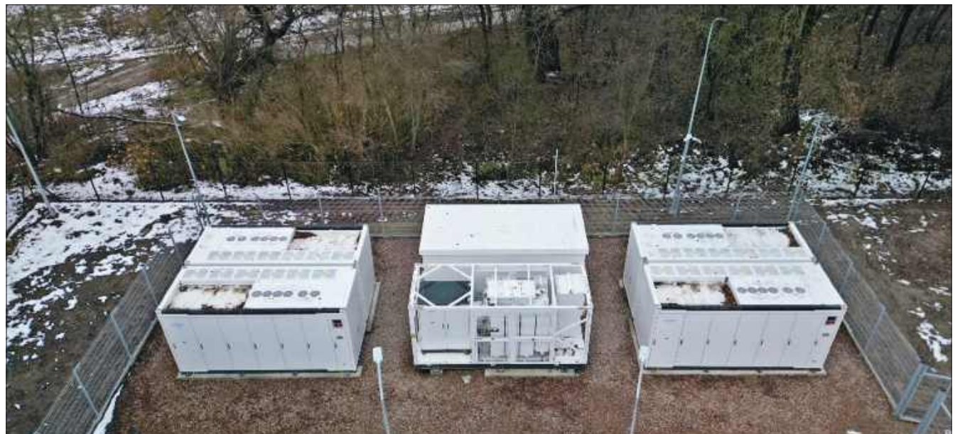
■ Tauron inwestuje w magazyny energii, a jeden z nich powstanie w naszym regionie.