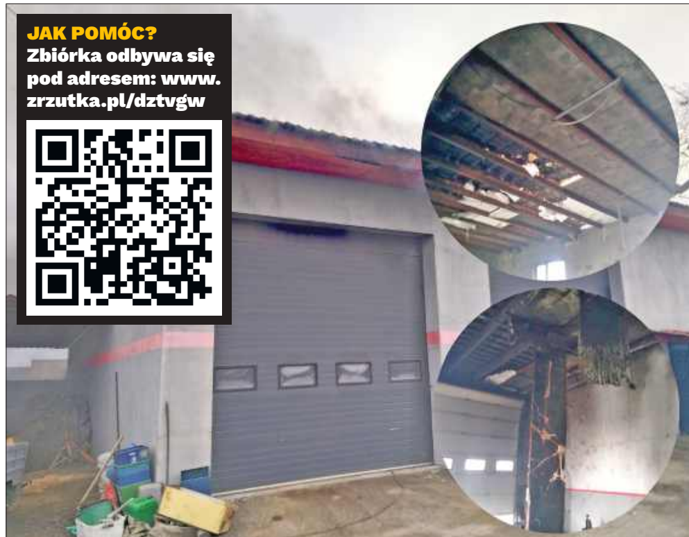
■ Pożar w JustynTrans. Mieszkańcy i internauci ruszyli z pomocą.

25 tys. zł – taki cel ma zbiórka uruchomiona w serwisie zrzutka.pl po pożarze firmy „JustynTrans”, jednego z przedsiębiorstw działających przy ul. Staszica w Kuźni Raciborskiej. Jej właściciel znany jest z zaangażowania w akcje charytatywne oraz udziału w programach telewizyjnych TTV „Wyburzacze” i „Dobra robota”.