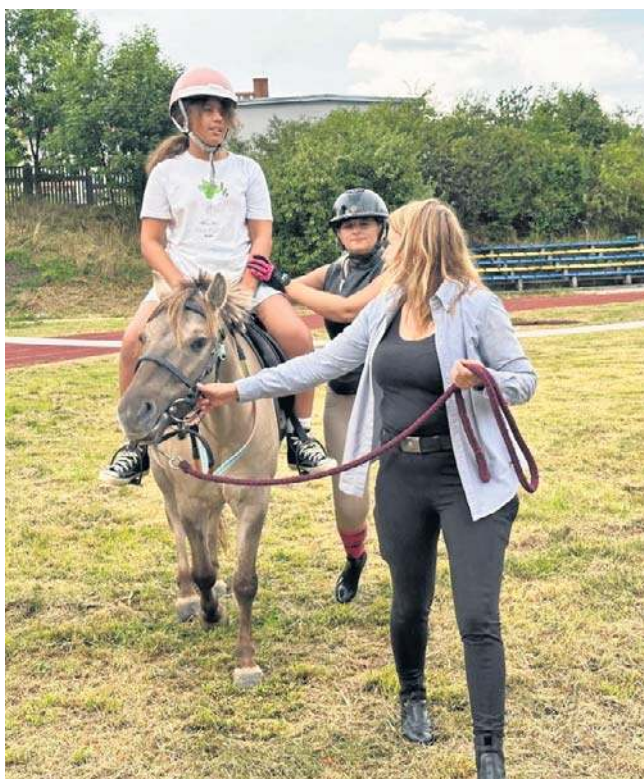
Dla najmłodszych uczestników przygotowano wyjątkową ofertę - przejażdżkę na koniku