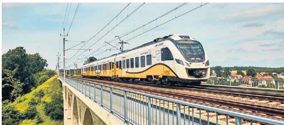
Według planu w 2027 roku linia do Stronia Śląskiego będzie przejezdna

tobusy za pociągi, które w ramach Kolei Dolnośląskich kursują w ramach rozkładów kolejowych. Na odcinku Kłodzko - Łądek-Zdrój - Stronie Śląskie co miesiąc podróżują nimi tysiące osób: w tygodniu do pracy czy szkoły, a w weekendy: turyści do podnóża Śnieżnika. Co ważne podróżuje tym „PKS-em” kosztują tyle co bilet kolejowy.