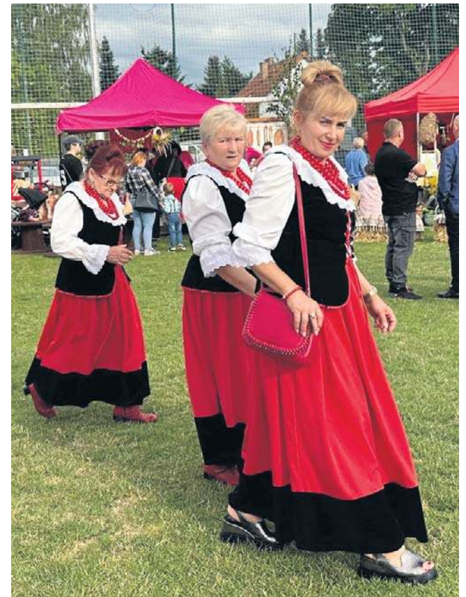
Barwne stroje ludowe przeplatały się z tradycyjnymi ubiorami, tworząc wyjątkową, dożynkową atmosferę