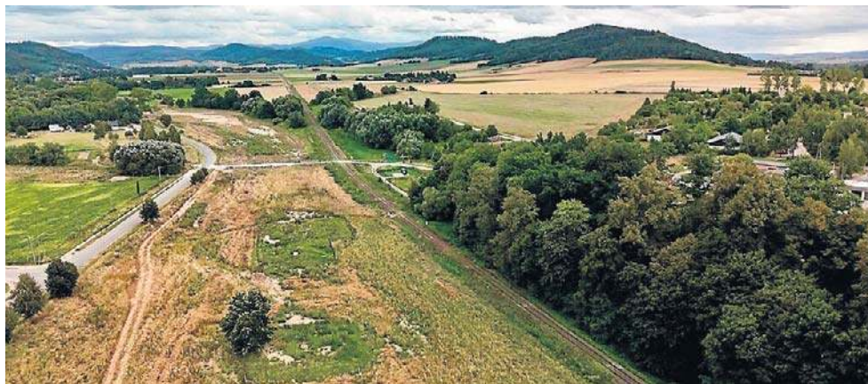
Za dwa lata tędy pojadą pociągi Kolei Dolnośląskich

Ogromny potencjał tej linii pokazują uruchomione na niej (po raz pierwszy w Polsce) au-