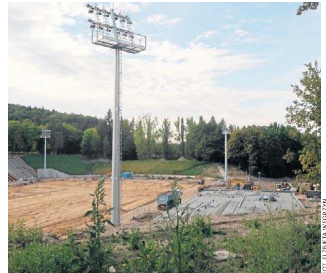
Trwa przebudowa stadionu. Czy termin ukończenia prac będzie utrzymany?

- Wykonawca złożył wniosek o przedłużeniu terminu oddania tego stadionu do użytku