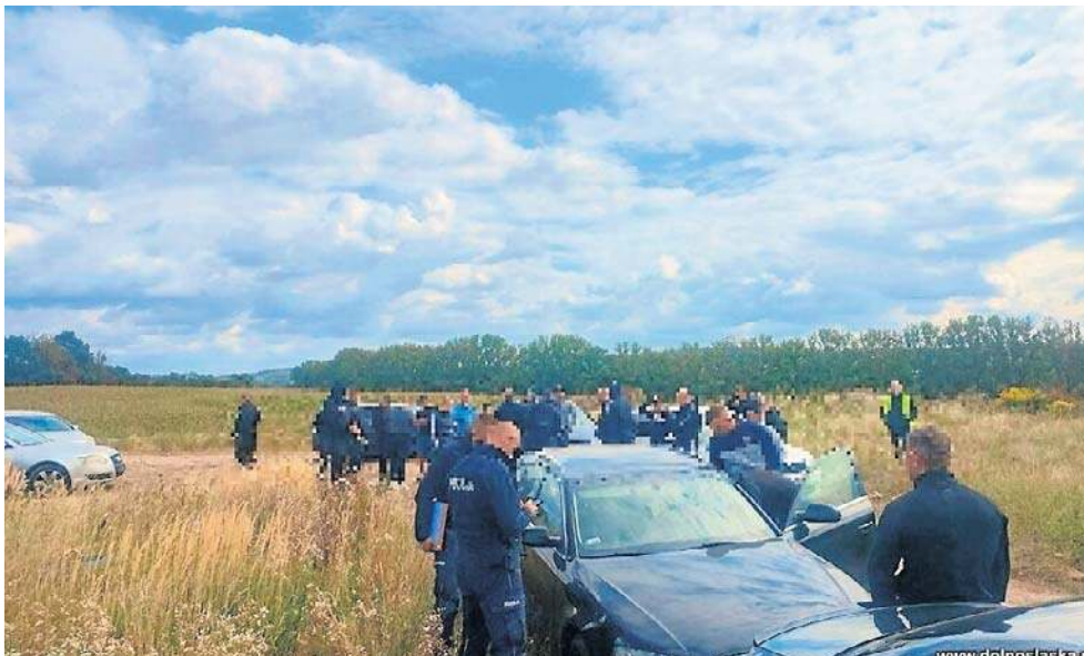
Na miejscu znajdowali się pseudokibice klubów piłkarskich z Lubina, Świdnicy i Wałbrzycha.

Jak dodają policjanci, okazało się, że na miejscu znajdowali się pseudokibice klubów piłkarskich z Lubina, Świdnicy