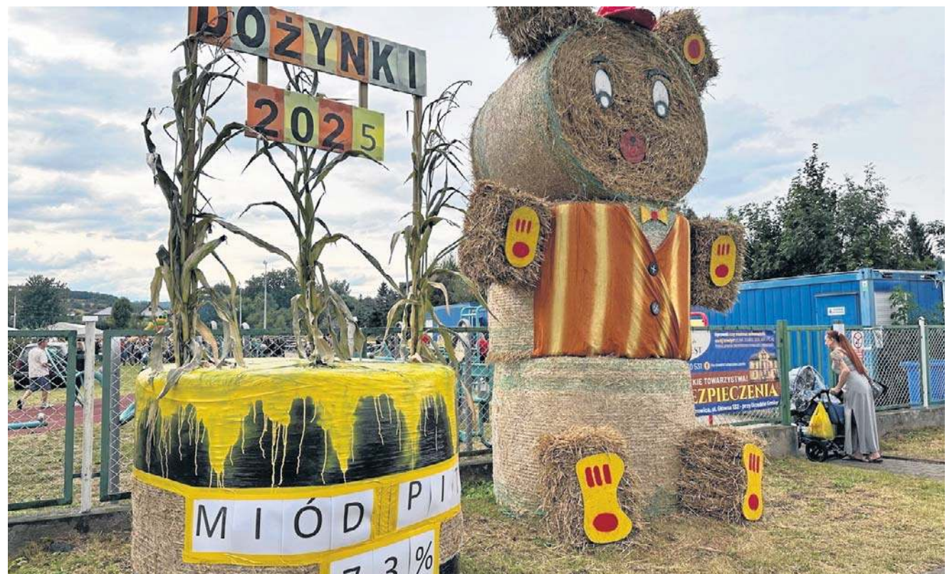
Dożynki w Starych Bogaczowicach rozpoczęły cykl imprez w regionie