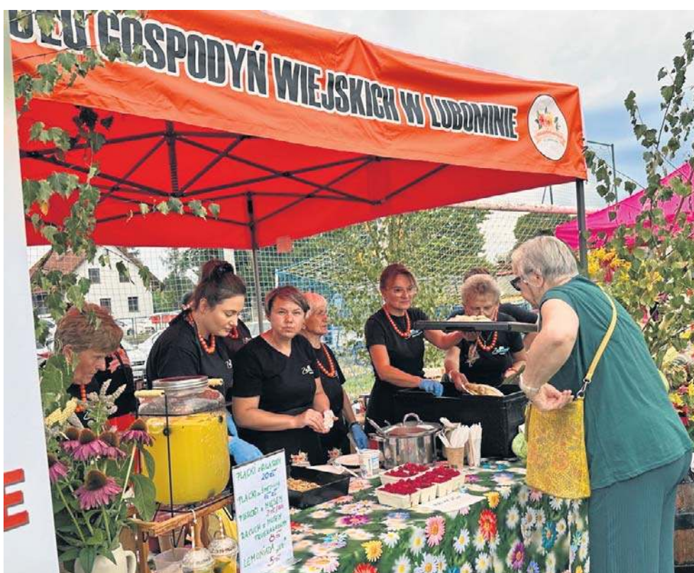
Furorę robiły Koła Gospodyń Wiejskich i ich stoiska