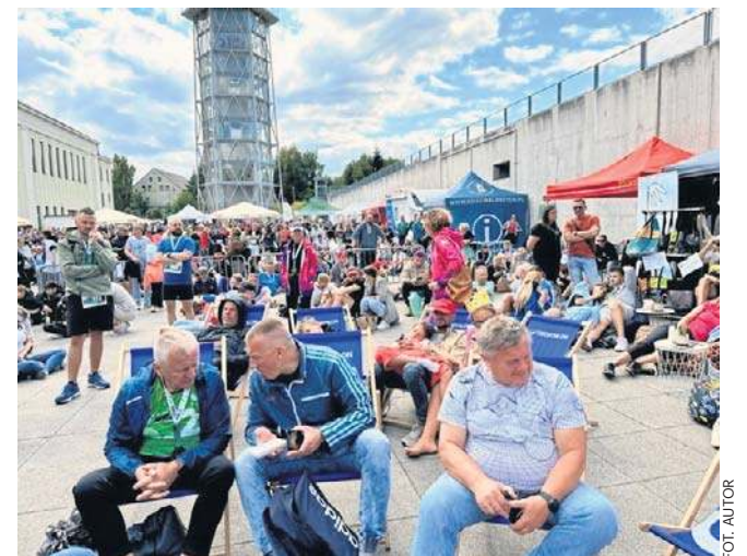
Widzowie i biegacze licznie stawili się na losowaniu nagród XXV Toyota Eko Półmaratonu

Wałbrzyski bieg zalicza się do Korony Polskich Półmaratonów. Medal to trofeum w kształcie korony.