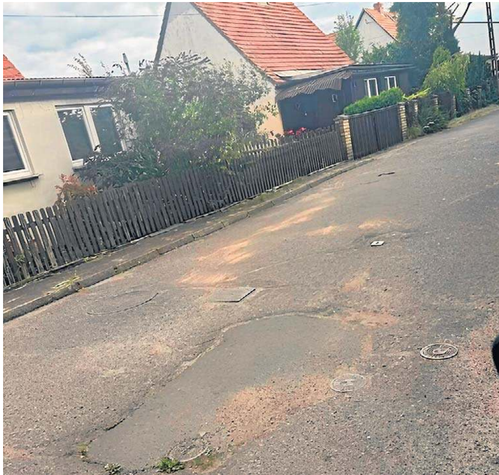
Tak wyglądały ślady zabezpieczone na miejscu tragedii dzień po zdarzeniu

Miała potrącić kobietę i kontynuować jazdę. Zdaniem prokuratury nie zatrzymała się i nie udzieliła pomocy ofierze. Spowodowała obrażenia wewnętrzne, które doprowadziły