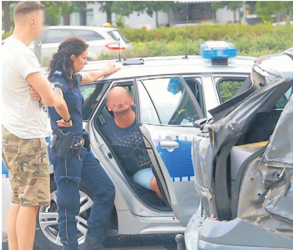
Już ponad 800 kierowców na Dolnym Śląsku straciło swoje auto

Jak podaje Wirtualna Polska, najwięcej kierowców straciło swoje samochody w województwie mazowieckim, aż 944. W dolnośląskim liczba ta jest niewiele mniejsza. Funkcjonariusze zajęli u nas 828 pojazdów należących do pijanych kierowców.