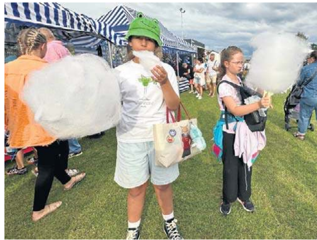
Stoisko z watą cukrową cieszy się niesłabnącą popularnością wśród najmłodszych