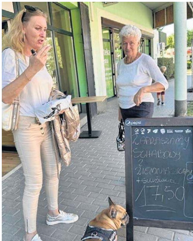
Bar karmi mieszkańców na wałbrzyskim Podzamczu, jedzenie znika w mgnieniu oka

- Zamiłowanie do tej branży wyniosłam z domu. Mój tata działał w branży gastronomicznej, moja mama też. Zresztą mama do dzisiaj sprzedaje wyroby garmażeryjne