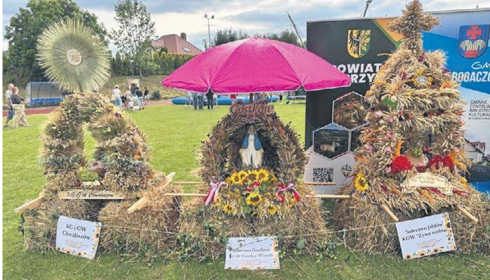
Tegoroczne wianki i witacze były wyjątkowe