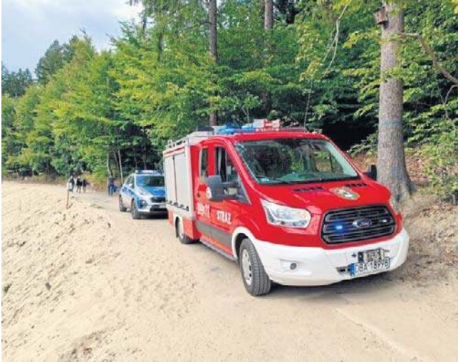
FOT. OSP ZAGÓRZE ŚLĄSKIE

Strażacy wyciągnęli z jeziora mieszkańca Wrocławia