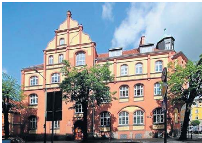
Prokuratura Rejonowa w Świdnicy po przeanalizowaniu dowodów wszczęła śledztwo

Na miejscu tragedii, tuż przy krawężniku, znaleziono równo ułożone obok siebie buty ofiary i torebkę powieszoną na płocie