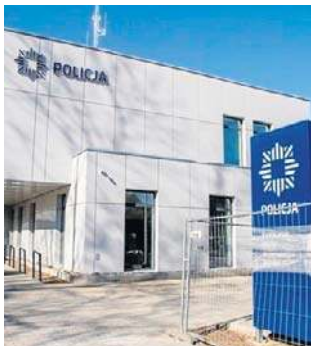
Na komisariacie przyjęto zgłoszenie o oszustwie

19-latek zgłosił się na Komisariat Policji I w Wałbrzychu i zawiadomił o przestępstwie.