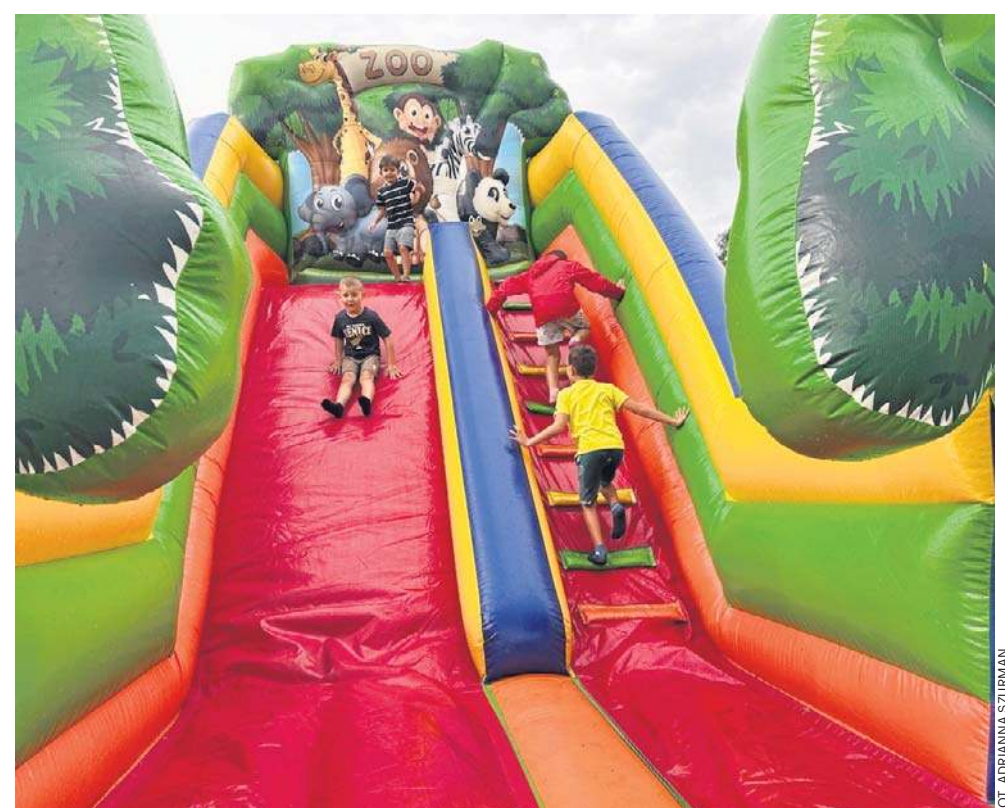
Dzieci bawiły się na dmuchańcach