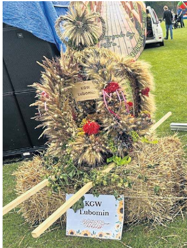
Każde z sołectw zostało uhonorowane za starannie przygotowany wieniec dożynkowy