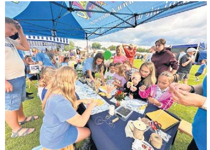
Gdy dorośli prowadzili rozmowy przy stołach, dzieci z radością korzystały z licznych atrakcji