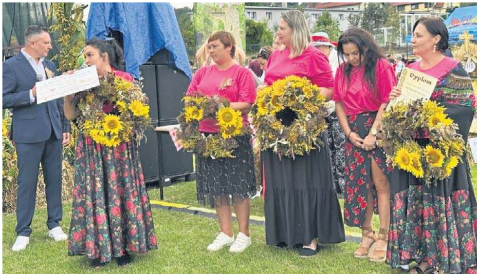
Nagrody w konkursach wręczyli samorządowcy