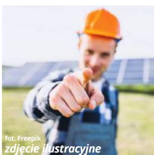
fol. Freepik zdjęcie ilustracyjne

W czasie niedawnych obrad rady gminy przyjęta została uchwała w sprawie przystąpienia do „Spółdzielni energetycznej ziemi chełmskiej”. To projekt, który samorząd podejmuje ponownie, ponieważ ten, do którego dołączył przed kilku laty, nie został ostatecznie zrealizowany.