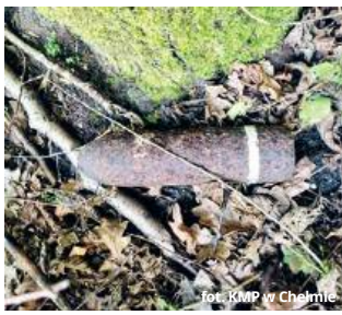
fol. KMP w Chełmie

● GM. BIAŁOPOLE Podczas rutynowego obchodu lasu w gminie Białopole leśniczy natknął się na pocisk artyleryjski z okresu II wojny światowej. Na miejsce natychmiast wezwano patrol policji, który zabezpieczył teren do czasu przybycia saperów.