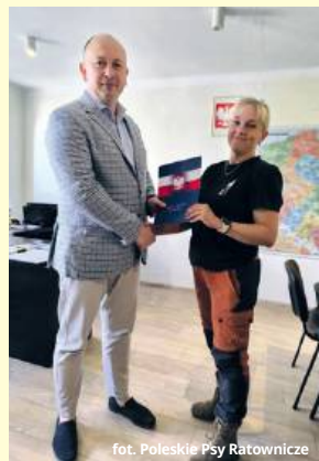
Stowarzyszenie Poleskie Psy Ratownicze

- To przełomowy moment, który formalnie potwierdza nasz profesjonalizm i gotowość operacyjną. Uznanie nas za podmiot ochrony ludności to nie tylko prestiż, ale przede wszystkim większa odpowiedzialność i determinacja w dalszym rozwoju struktur cywilnego ratownictwa na Lubelszczyźnie – komentuje