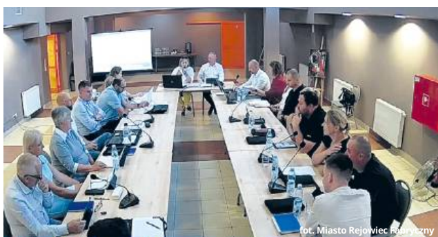
Sala Rady Miasta Rejowiec Fabryczny - sala konferencyjna

Jednogłośnie, ale po wcześniejszej dyskusji, została przyjęta uchwała dotycząca umieszczenia głazu i pamiątkowej tablicy w pobliżu obiektu dworca kolejowego w Rejowcu Fabrycznym. O co dokładnie pytali radni?