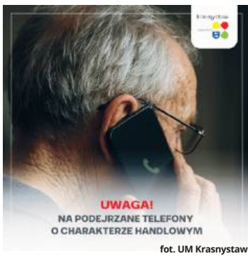
fol. UM Krasnostaw

● KRASNYSTAW W ostatnich dniach do mieszkańców Krasnegostawu docierają telefoniczne zaproszenia na rzekome spotkania organizowane z okazji Dni Krasnegostawu. Podczas rozmów osoby dzwoniące powołują się na wydarzenia miejskie, proponując udział w prezentacjach o charakterze handlowym. Urząd miasta wydał w tej sprawie oficjalny komunikat, w którym stanowczo odcina się od takich działań.