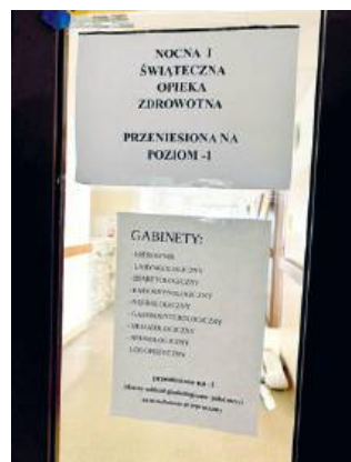
fol. SPWSZ w Chełmie

Pacjenci, którzy chcą skorzystać z usług nocnej i świątecznej opieki medycznej znajdują ją także na poziomie -1. szer