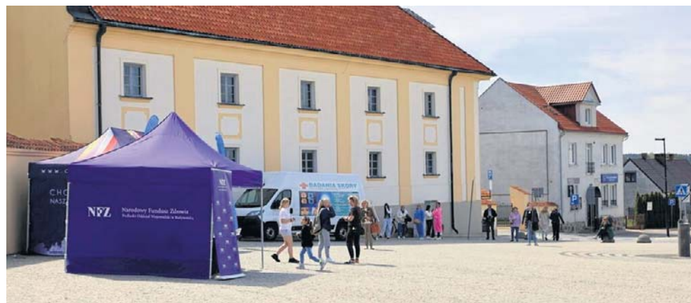
Na Rynku 11 Listopada w Choroszcz stanął dermobus i namiot podlaskiego NFZ