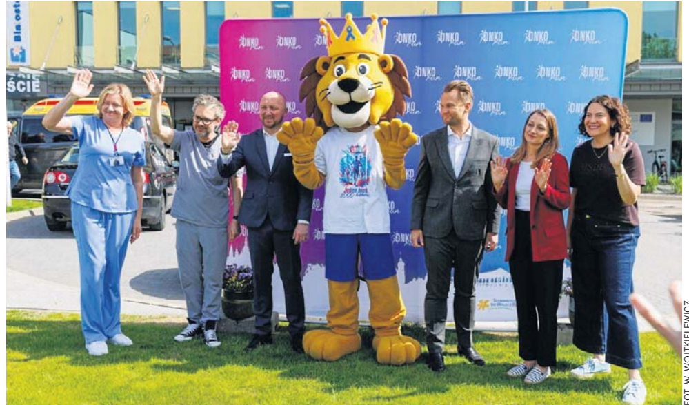
Organizatorzy OnkoRun zachęcali wczoraj do udziału w wydarzeniu

- To cudowny event integrujący całe środowisko onkologiczne, pacjentów, rodziny i pracowników Białostockiego Centrum Onkologii. Na pewno pogoda dopisze, jak co roku.