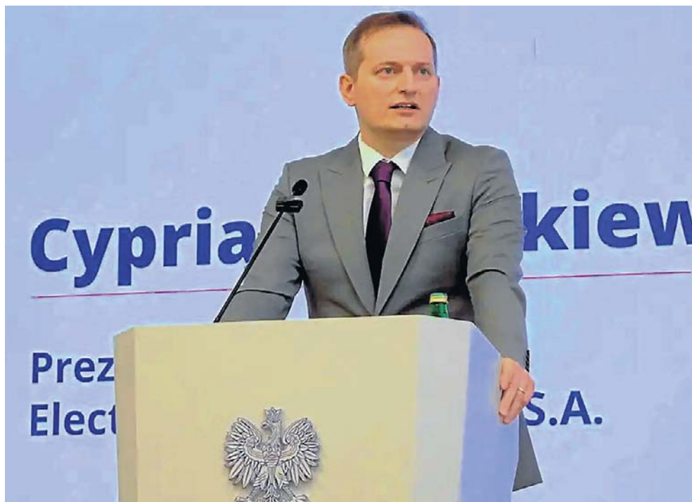
- Pierwszy samochód zjedzie z linii produkcyjnej w Jaworznie w 2029 roku - powiedział na konferencji prezes EMP

Dorota Mariańska dorota.marianska@polskapress.pl