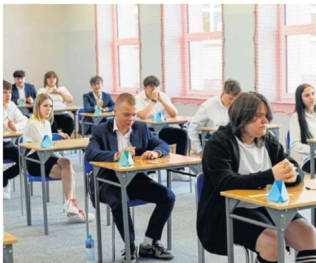
W SP 20 w Białymstoku do egzaminu przystępuje w tym roku około 40 ósmoklasistów

W tym roku uczniowie mogli wybrać jeden z dwóch tematów. Pierwszy dotyczył przygotowania przemówienia o tym, że każdy człowiek może kształtować swoją przyszłość, z odwołaniem do lektury obowiązkowej i innego utworu literackiego.