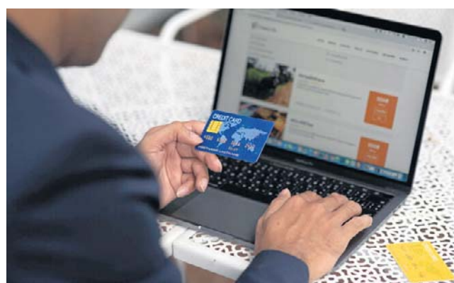
Handel i e-commerce coraz mocniej zależą od zrozumienia klienta oraz zmieniających się nawyków konsumentów

Zapytany o doprecyzowanie tego, jak rozumie egzekucję, wyjaśnił, że z jednej strony chodzi o konsekwentne realizowa-