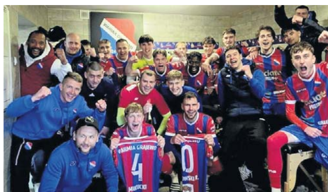
Tak się cieszą piłkarze Warmii Grajewo. Pokonali Supraślankę 4:0