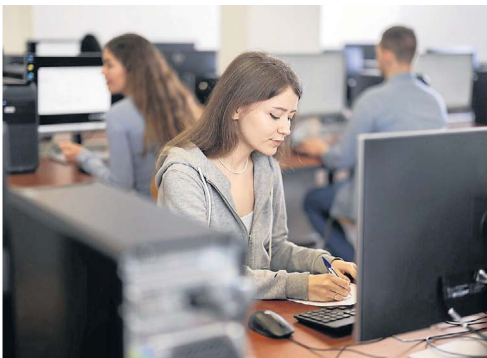
Pod niektórymi kierunkami studiów w Polsce zarobki przewyższają średnią krajową