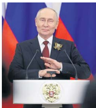
Putin „straszy” Armenię losem Ukrainy

Prezydent Rosji dał do zrozumienia, że wybór na korzyść Brukseli nieuchronnie doprowadzi do rewizji stosunków z Mo-