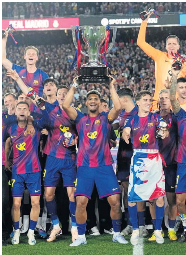
Barcelona pokonała Real 2:0 i zapewniła sobie drugi rok z rzędu mistrzostwo Hiszpanii. Na stadionie Camp Nou wybuchła prawdziwa euforia

Kibice Barcelony wiele minut przed końcem meczu śpiewali: „Campeones, campeones!” („Mistrzowie, mistrzowie!”).