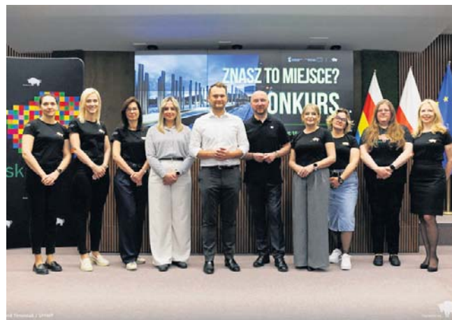
Podczas wczorajszej konferencji prasowej mówiono m.in. o znaczeniu środków europejskich dla rozwoju regionu

Samorząd wojewódzki to, jak zmieniło się Podlaskie, prezentował co roku podczas Dni Funduszy Europejskich. Było to za zwyczaj w jednym z majowych weekendów. Tym razem akcja będzie miała znacznie szerszy