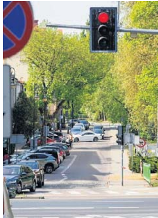
Ulica Elektryczna będzie przebudowana

Przy okazji wykonany zostanie przejazd dla rowerów, ułatwiający bezpieczne przekroczenie ul. Mickiewicza oraz śluza autobusowa dla pojaz-