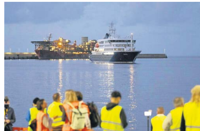
Ministra zdrowia Francji poinformowała, że kobieta ewakuowana do kraju ze statku ma pozytywny wynik testu. Wezwała, by „nie się paniki”

3 maja Światowa Organizacja Zdrowia (WHO) poinformowała o śmierci trzech osób na wycieczkowcu MV Hondius, który na początku kwietnia wyruszył z południowej Argentyny na rejs po Atlantyku. Do tej pory organizacja potwierdziła osiem przypadków zakażenia groźnym dla ludzi hantawirusem, który jest przenoszony głównie przez gryzonie. PAP