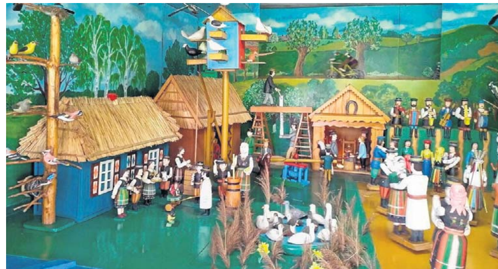
Sromów, czyli wstydliva wieś