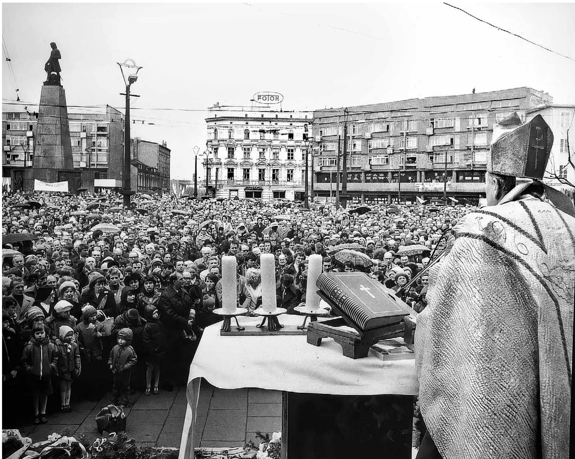
Msza odprawiana na placu Wolności w Łodzi, w którym tłumnie brali udział strajkujący

Po strajku na spokój z pewnością nie mogli liczyć organizatorzy akcji protestacyjnej. Bezpieka zidentyfikowała te osoby i poddała je kontroli operacyjnej. Robotnicy ci musieli się też liczyć z tym, że przy najmniejszej niesubordynacji w przyszłości zostaną zwolnieni z pracy.