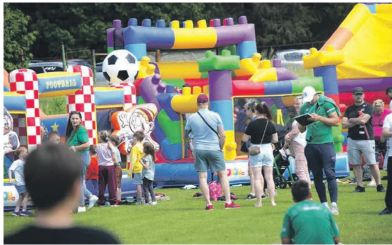
Atrakcji podczas festynu nie zabraknie

Podczas festynu czeka nas między innymi koncert Górnicy Orkiestry