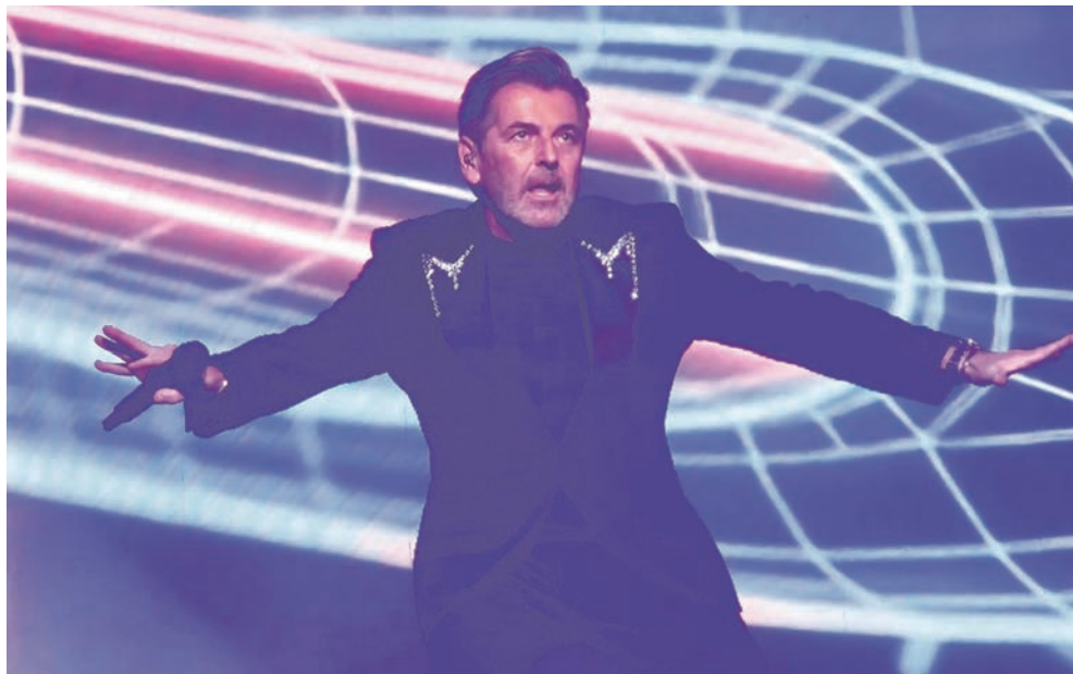
Thomas Anders zatańczy na placu Sobieskiego

Jak się potem okazało panowie za sobą prywatnie nie przepadali, ale razem zrobili oszałamiającą karierę. I choć krytycy kręcili nosami twierdząc (trochę zgodnie z prawdą), że każda piosenka Modern Talking jest mniej więcej taka sama, to niech pierwszy rzuci kamieniem ten, kto ma dziś