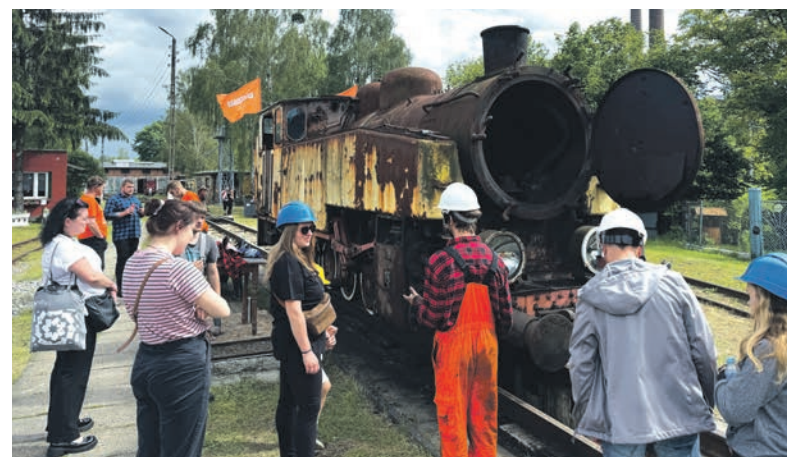
Uczestnicy dowiedzieli się nieco o budowie zabytkowych lokomotyw.

W kolejną odsłonę festiwalu włączyło się Stowarzyszenie Górnośląskich Kolei Wąskotorowych. Nasza lokalna atrakcja, nie tylko od święta - gromadzi wielu miłośników tej formy transportu. Podczas Industriady, oprócz możliwości przejazdu najstarszą, nieprzerwanie czynną koleją wąskotorową - chętni spróbowali swoich sił na ręcznej dreźynie, poznali sylwetki osób związanych z pierwszą w Polsce Fabryką Lokomotyw, zwiedzali Izbę Tradycji i stację Bytom Karb Wąskotorowy.