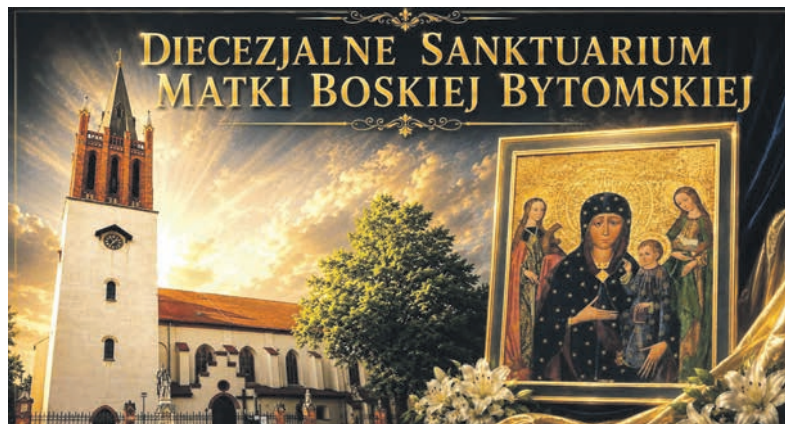
FB KOŚCIÓŁ MARIACKI

Obraz nie od razu cieszył się estymą. W 1852 roku rozpoczęto remont kościoła mariackiego, a ówczesny pro-