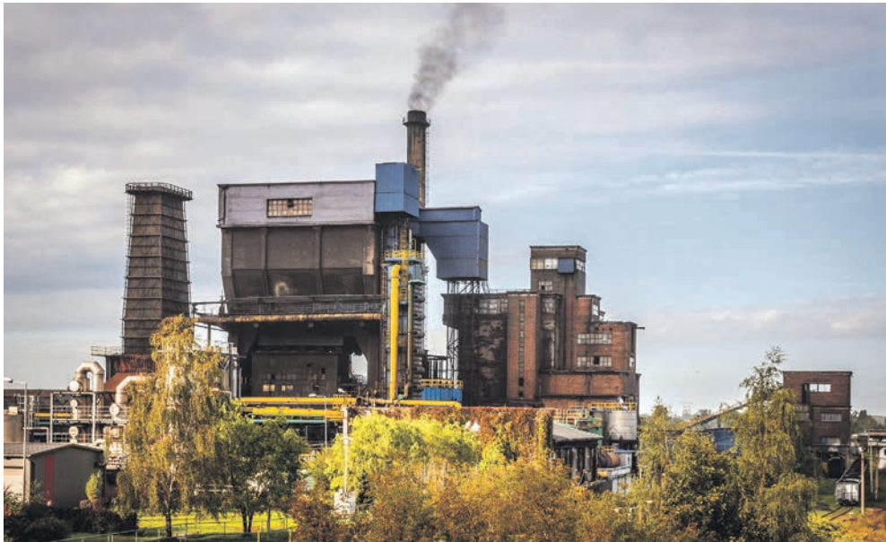
Koksownia Bytom wyszła na prostą

To nie jedyna innowacja w Koksowni Bytom. Od początku drugiego kwartału tego roku