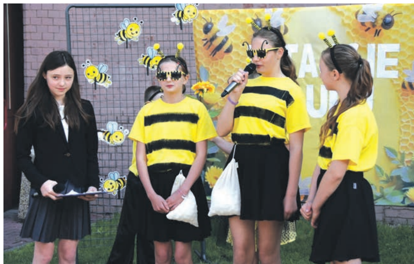
Otwarcie ekopracowni uświetnił program artystyczny w wykonaniu uczniów SP nr 16

Co konkretnie zrobiono? W szkolnym ogrodzie posadzone zostały miododajne, pięknie się prezentujące kwiaty i byliny. Poza tym powstała ścieżka sensoryczna. Całe przedsięwzięcie wzbogacono też o elementy małej architektury oraz tablice informacyjne i pomoce dydaktyczne. Ciekawostką jest pomysłowo zaaranżowana, tak zwana strefa uprawna, która zajmują się uczniowie. Ta praca daje im nie tylko frajdę, ale przede wszystkim pozwala obserwować fascynujący cykl życia roślin. Jednakże na pozwalającym na praktycznym zdobywaniu wiedzy obserwowaniu się nie skończy. Młodzi ludzie