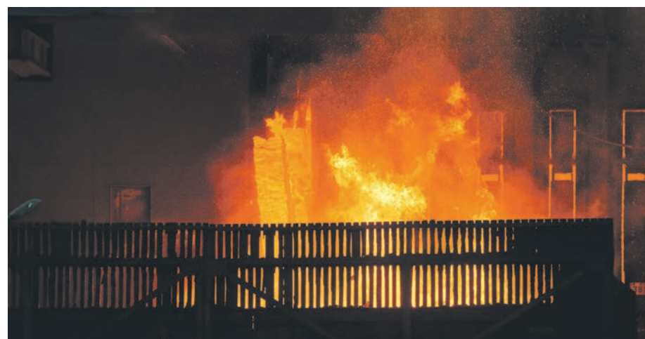
Taniec ognia? Nie, to Koksownia Bytom w nocnym ujęciu