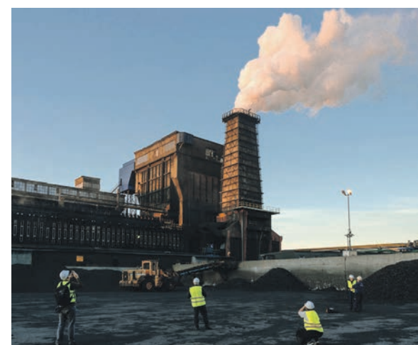
Słońce powoli zachodzi, a jego promienie odbijają się w kłębach wydostającej się z kominu pary. Nic, tylko fotografować