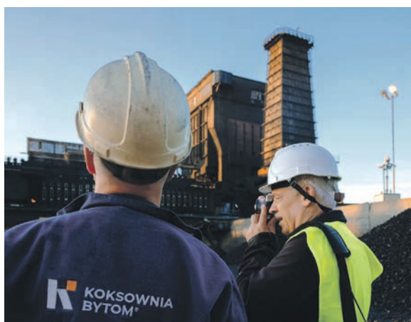
Wycieczka z aparatem fotograficznym po Koksowni była warta tego, by specjalnie przyjechać do naszego miasta z drugiego końca Polski