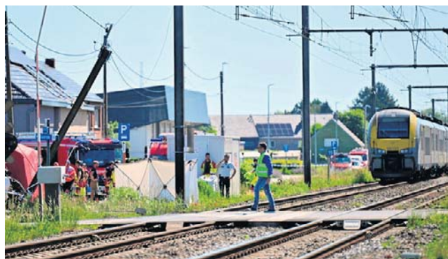
Belgia jest wstrząśnięta wypadkiem, do którego doszło na przejeździe kolejowym w mieście Buggenhout

Z pociągu ewakuowano około 100 pasażerów, jedna osoba ucierpiała z powodu szoku.