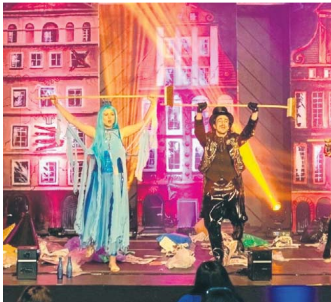
Wstęp na sobotni spektakl Teatru Katarynka będzie bezpłatny

Podczas spektaklu w fabułę wplecione zostaną cztery lekcje związane z poszczególnymi żywiołami: ziemią, powietrzem, wodą i ogniem. W trakcie jednej z nich, dzieci będą mogły zostać naukowcami i przeprowadzić serię eksperymentów z wykorzystaniem wody.