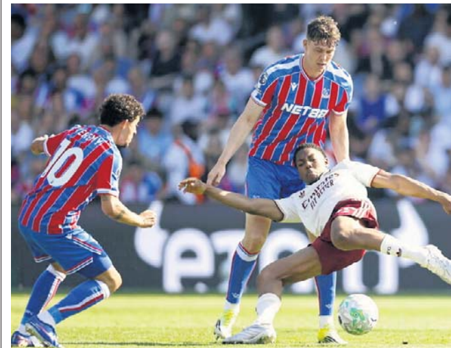
Crystal Palace miał próbę generalną z Arsenalem (1:2) w Premier League przed finałem Ligi Konferencji z Rayo

Transmisję finału przeprowadzi Polsat Sport Premium 1 oraz w serwisie streamingowym Polsat Box Go. ©