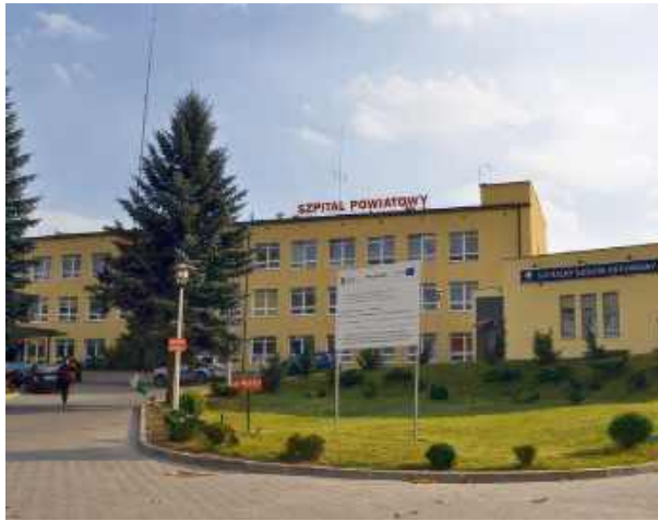
Sytuacja finansowa placówki jest bardzo poważna i wymaga pilnego wsparcia.