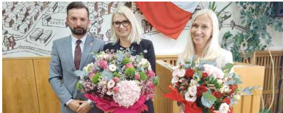
Radni byli jednogłośni.

W raporcie znalazły się m.in. informacje o zakończonych inwestycjach, działaniach proekologicznych, modernizacjach dróg, wsparciu dla seniorów i aktywizacji społecznej. Wydatki miasta wyniosły ponad 129 mln zł, z czego 14,3