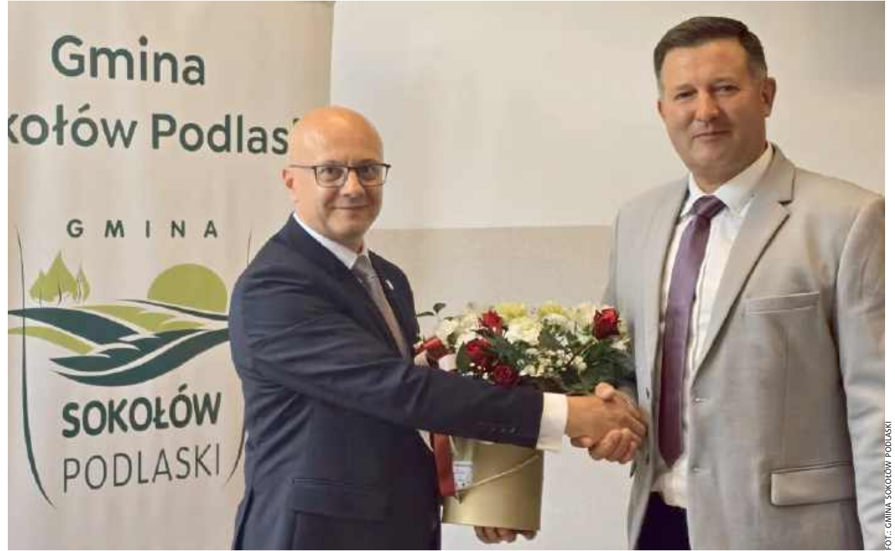
Radni wyrażali zadowolenie z kierunku, w jakim zmierza gmina pod przewodnictwem wójta.