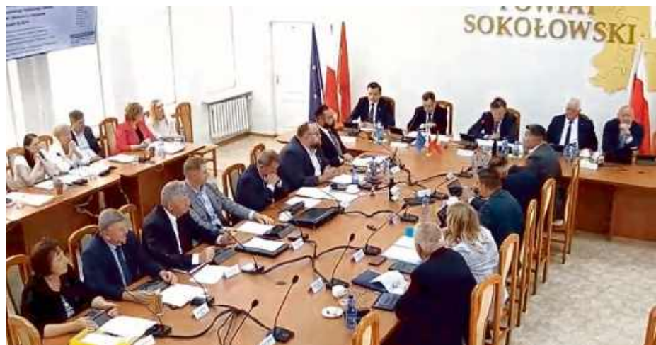
Brak wymaganej większości oznacza, że zarząd nie uzyskał poparcia rady.

Podczas tej samej sesji przyjęto również inne uchwały dotyczące realizacji budżetu i finansów powiatu. Jednak to rozdzielnie kwestii zaufania od oceny wykonania budżetu wybrzmiało najmocniej – jako sygnał, że nawet przy poprawnych wynikach finansowych, zaufanie do kierunku prowadzenia powiatu nie jest już oczywiste. ID