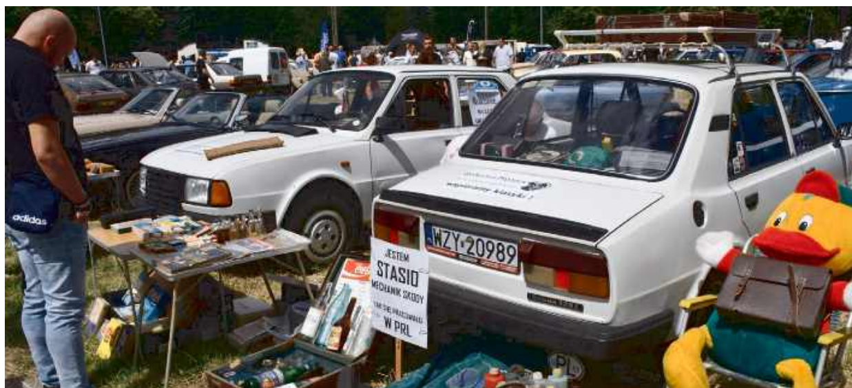
XVI Zlot Pojazdów Zabytkowych „Mrowisko” zgromadził ponad 500 unikalnych pojazdów i miłośników klasycznej motoryzacji.

Sercem spotkania była strefa „kanap” — miejsce, gdzie miłośnicy motoryzacji zasiadali wspólnie, rozmawiając i wymieniając się historiami swoich po-