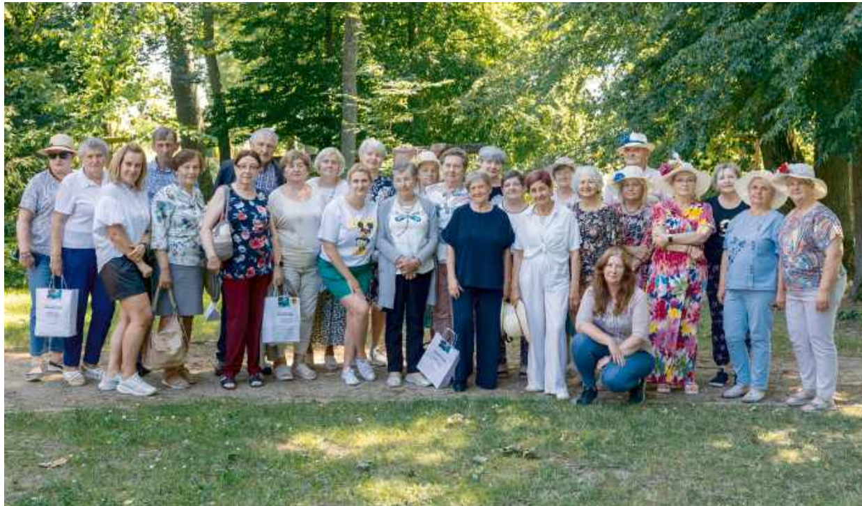
Projekt „Z Kameralą na Mazowszu” to nie tylko cyfrowe umiejętności. Chcieliśmy połączyć technologię z lokalną tradycją i przyrodą.