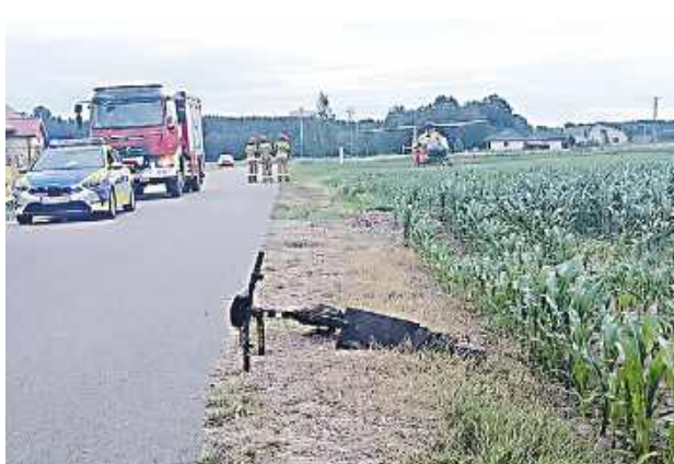
Hulajnoга elektryczna jest przeznaczona do przewozu tylko jednej osoby - przewożenie pasażerów jest zabronione.

Hulajnoга elektryczna jest przeznaczona do przewozu tylko jednej osoby - przewożenie pasażerów jest zabronione. Korzystając