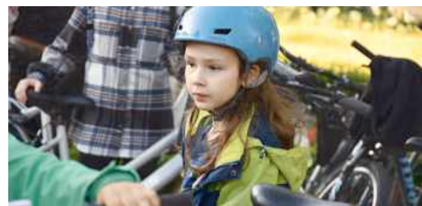
W rajdzie udział wzięli mieszkańcy w każdym wieku.

W rajdzie udział wzięli mieszkańcy w każdym wieku – od dzieci po seniorów, od zapalonych kolarzy po tych, którzy po prostu lubią jazdę na dwóch kółkach. Zorganizowana kolumna rowerzystów wyruszyła punktualnie o 19.00, a barwny peloton pilotowany przez policję i zmotoryzowanych przejechał przez centrum miasta, wzbudzając żywe zainteresowanie przechodniów. Po drodze nie zabrakło uśmiechów, pozdrowień i energii, która udzielała się nawet tym, którzy tylko stali na chodniku.