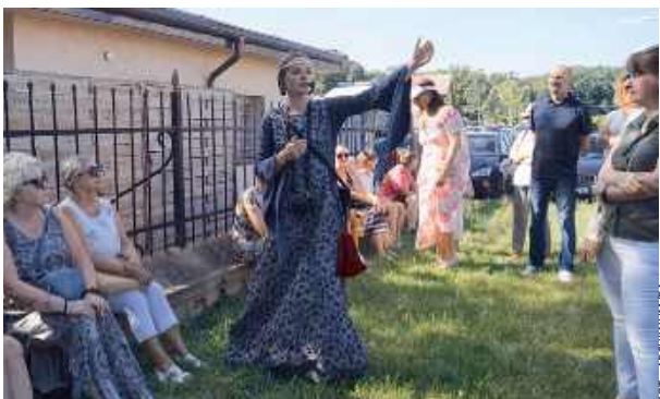
Kolejny spacer z przewodnikiem już 6 lipca.

Cykl otwiera spacer poświęcony walorom turystycznym