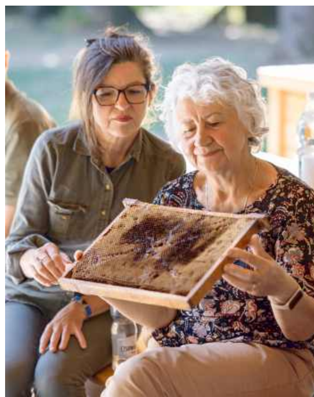
Seniorzy wzięli udział w praktycznych warsztatach z pszczelarzem.