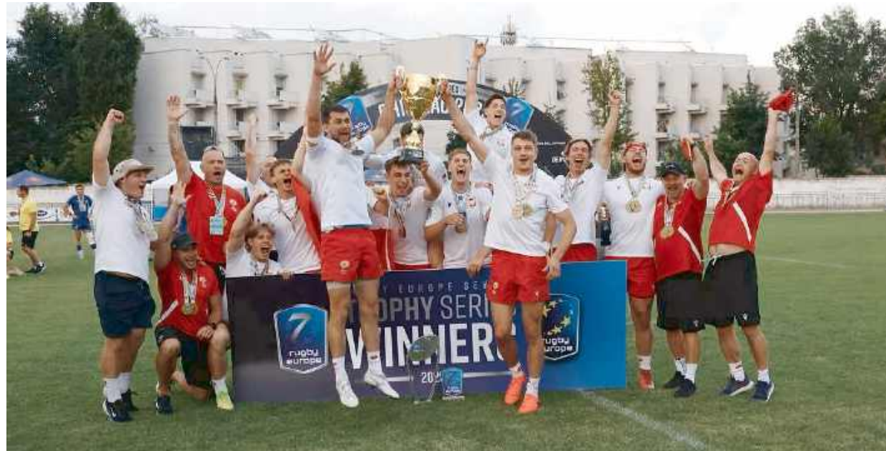
Reprezentacja Rugby 7 awansowała do Championship.