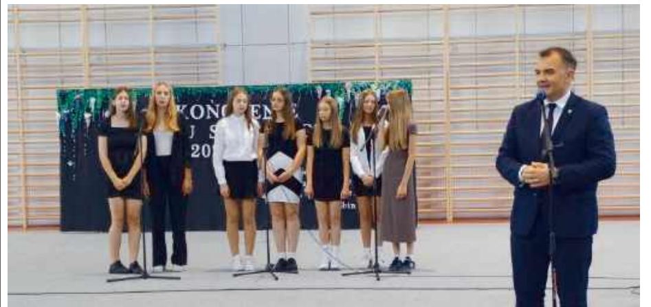
Za szczególne osiągnięcia stypendia burmistrza otrzymało 109 uczniów