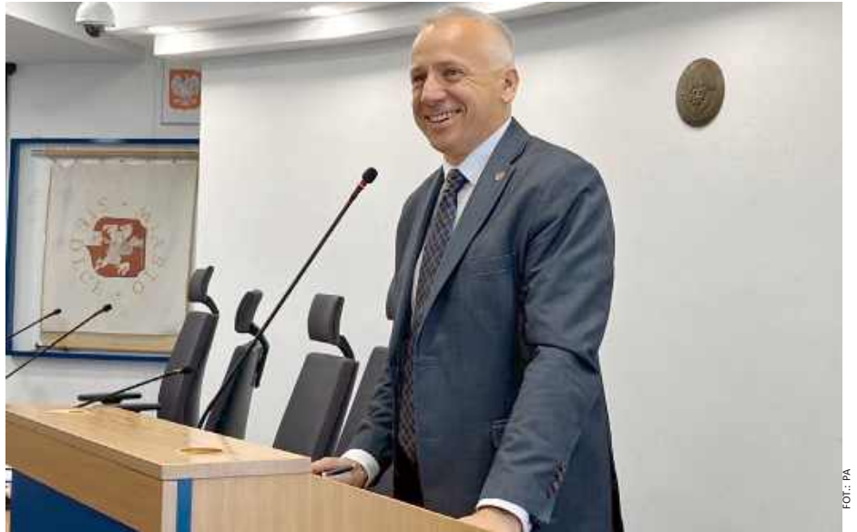
Hapunowicz z wotum zaufania i absolutorium za rok 2024.