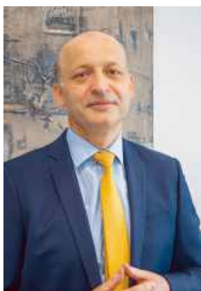
Prof. Lubomir Bodnar

- To na pewno ważny moment i ważny etap w moim życiu, ale też ogromne wyzwanie