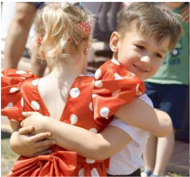
Sercem wydarzenia była przecudowna część artystyczna.

W czwartkowe popołudnie (26 czerwca) w Starym Opolu rozbrzmiewał śmiech dzieci i dźwięki tanecznej muzyki. Rodzinny piknik przedszkola „Kraina Fantazji” był nie tylko symbolicznym rozpoczęciem wakacji, ale przede wszystkim pięknym świętem wspólnoty, bez troski i dziecięcej radości.