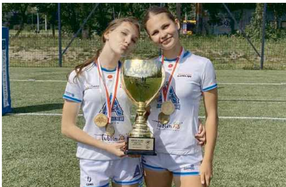
Zawodniczki Pogoni w barwach Amazonek Lublin.

Przed rozpoczęciem nowego sezonu 2025/2026, Siedlce po raz kolejny staną się ważnym punktem na mapie krajowego rugby. W dniach 9–10 sierpnia na obiektach Awenty Pogoni odbędą się egzaminy dla sędziów rugby. Osoby zainteresowane udziałem proszone są o przesłanie zgłoszenia do 9 lipca na adres mailowy: kolegium.sedziow@polskie.rugby. W wiadomości powinny znaleźć się dane osobowe oraz rekomendacja z OZR potwierdzająca aktywność sędziowską.