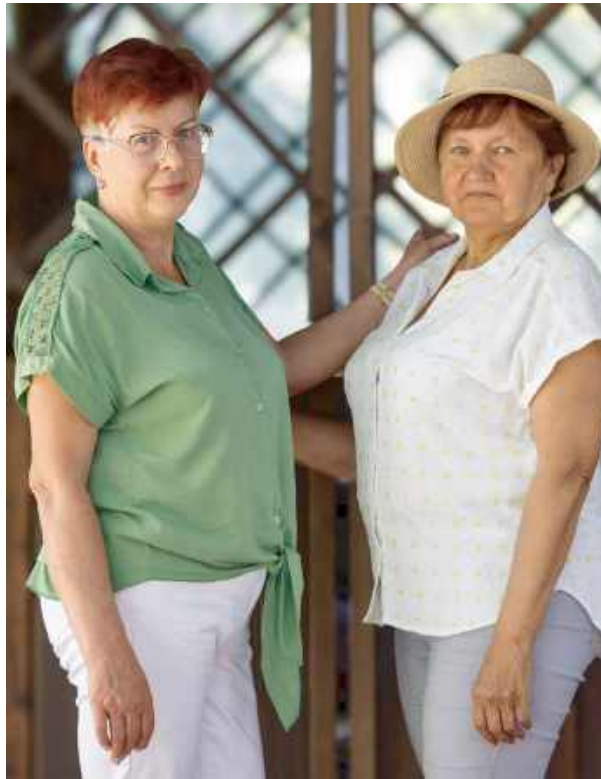
Dodatkową atrakcją była sesja zdjęciowa.