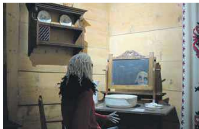
W lustro spogląda jedna z postaci z wystawy Igora Omuleckiego.

przed lustrem włochata eleganka szykuje się do ablucji. Przed nią miska i dzban do polewania tych białych rąk. Ruszasz ku tej dziwnej pani, a to też kukła. Włosy zrobione z białych sznurków. Z dała wyglądają jak dredy. Manekiny. Jeszcze więcej dzieje się na piętrze.