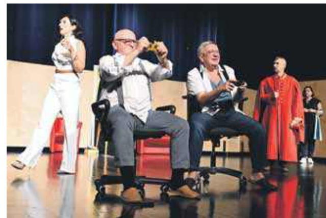
Bohaterowie z nowotarskiej interpretacji „Ślubów panięskich” Fredry spędzali czas na grze komputerowej.