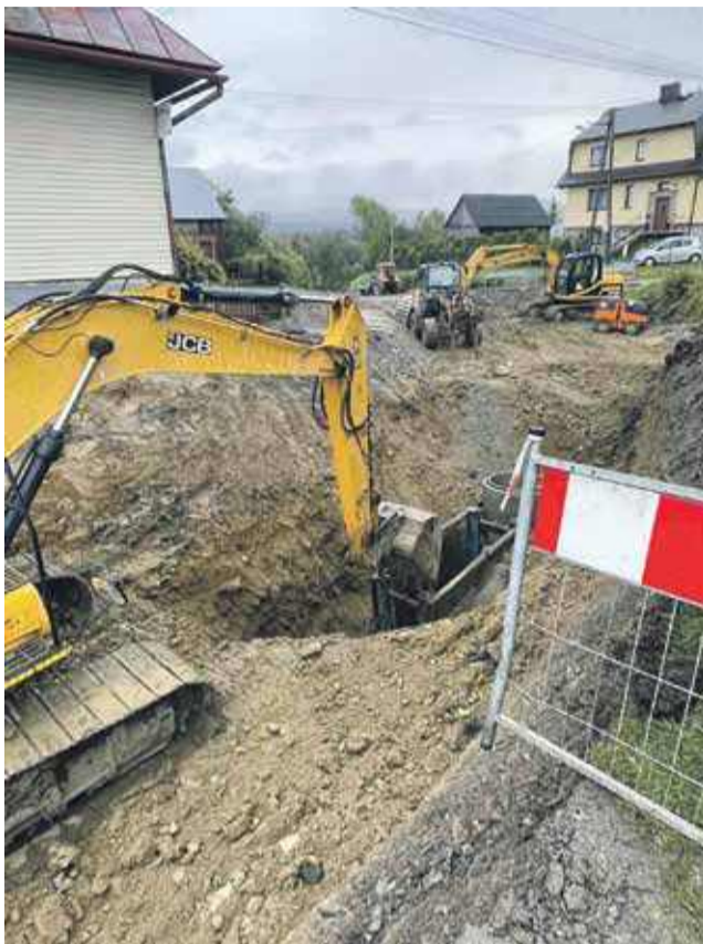
Nie było innej możliwości przeprowadzenia remontu - twierdzą władze Bukowiny Tatrzańskiej.

- Prowadzimy tam przebudowę drogi razem z budową sieci kanalizacyjnej, chodników, oświetlenia. Są to tak naprawdę dwie równoległe inwestycje. Pierwsza wymagała wykopania kanału sanitarnego o głęboko-