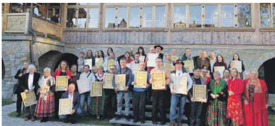
Nagrodzeni i wyróżnieni wraz z organizatorami konkursu w ogrodzie przed Czerwonym Dworem.