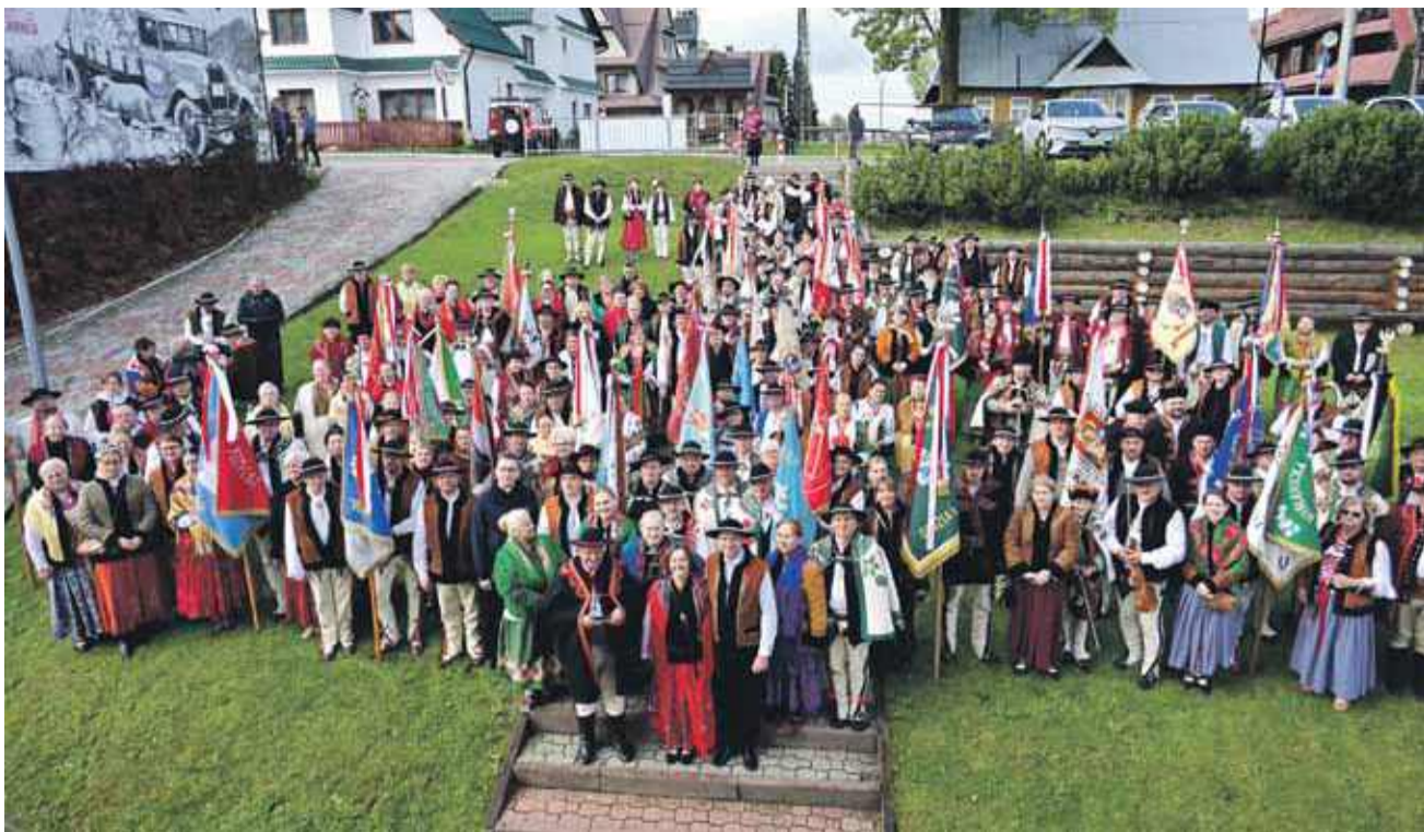
Uczestnicy 55. Nadzwyczajnego Zjazdu Podhalan przed Bukowińskim Centrum Kultury.

- Tak to było sto lat temu i wielkie Bóg zapłać, żeście tu dziś są. A te chwile niech przypomną nam, jak wielką siłą jest