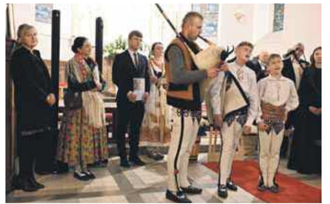
Nie brakowało elementów nawiązujących do góralskiego folkloru.