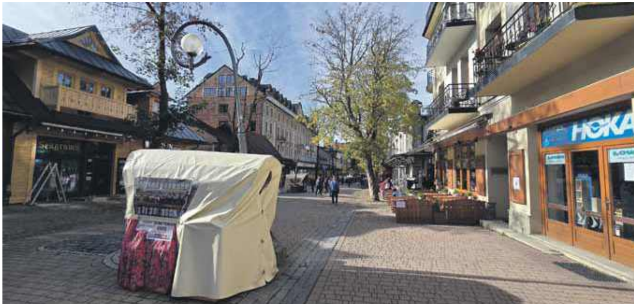
Czy Krupówki staną się zabytkiem? Na razie konserwator mówi nie.

- W niniejszym postępowaniu występujemy w charakterze strony. Po zapoznaniu się z uzasadnieniem decyzji Małopolskiego Wojewódzkiego Konserwatora Zabytków zamierzamy złożyć odwołanie. Uważam, że Krupówki - jak w soczewce - odzwierciedlają proces rozwoju Zakopanego. Z małej osady przekształci-