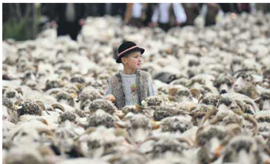
Fot.: Bartłomiej Jurecki