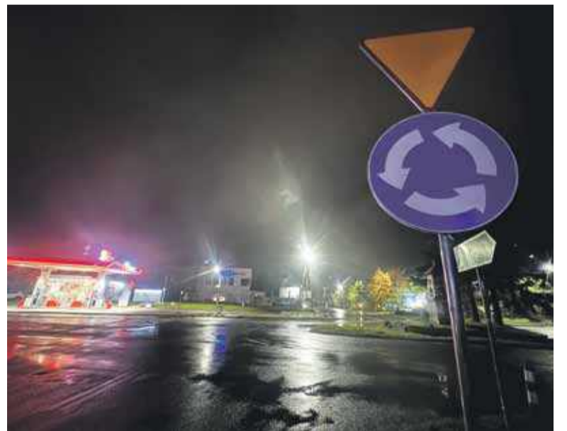
Na Zaborni powstało rondo.