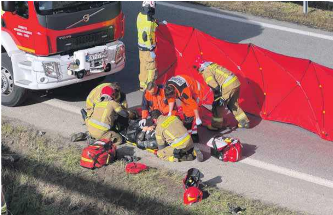
Motocyklista został ukarany mandatem.