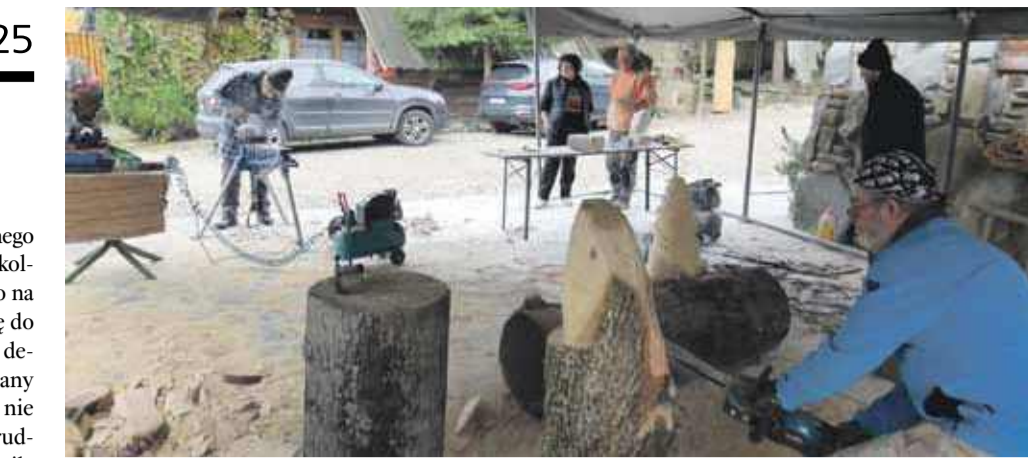
Pod namiotem przy Javorinie praca wrę, jej efekty podziwiać będzie można już od najbliższego piątku.