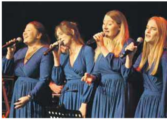
Artystki z Bełchatowa na scenie nowotarskiego MCK-u zaprosiły publiczność do wspomnień o Janie Pawle II.