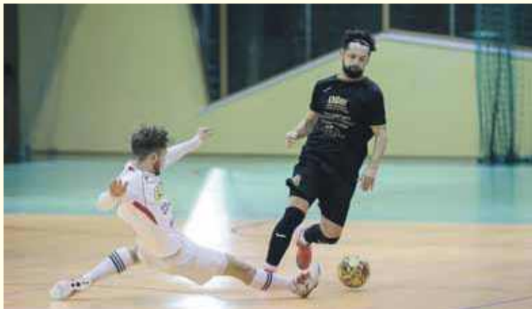
Piłkarze z Ostrowska lepsi od drużyny GKS.

Migrondu Ostrowsko nie tylko awansował do kolejnej rundy Pucharu Polski, ale też poka-