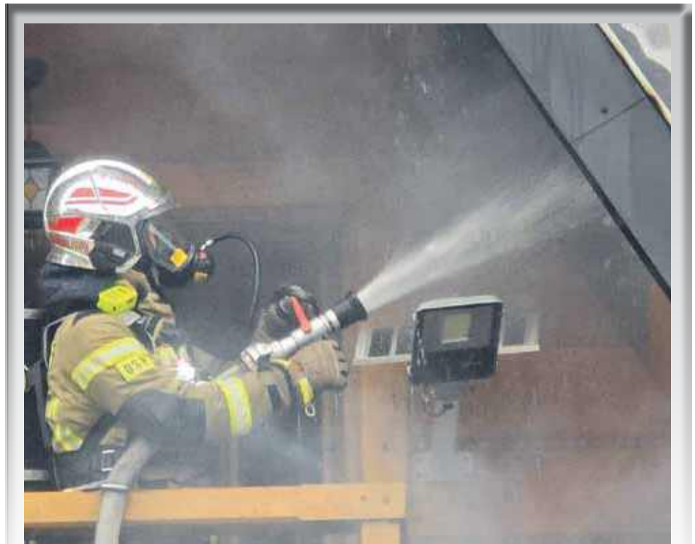
We wtorek ok. godz. 11 w Dzianiszu wybuchł pożar budynku mieszkalno-usługowego. Ogień objął poddasze domu. Pożar gasili strażacy z OSP Dzianisz Dolny, Górny, Kościelisko, Witów oraz JRG w Zakopanem. Nikt nie został poszkodowany.

Sąd Rejonowy w Nowym Targu zdecydował, że najbliższe miesiące 35-latek spędzi w areszcie tymczasowym. - Policja i prokuratura prowadzą dalsze czynności w tej sprawie - podsumowuje rzecznik policji. mk