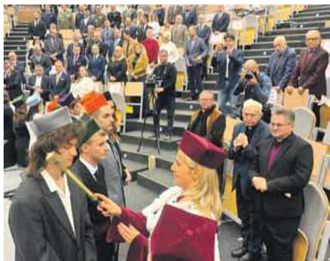
W tym roku ANS przyjęła o 20 procent więcej studentów, niż rok wcześniej.