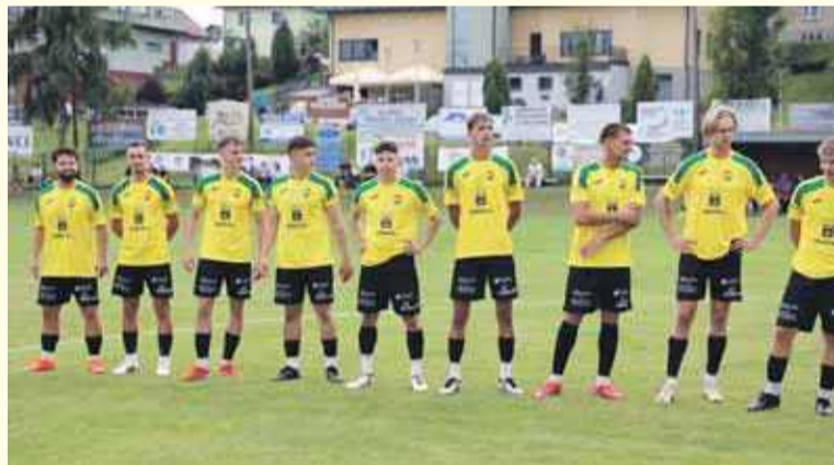
Lubań wysoko pokonał Limanovię.