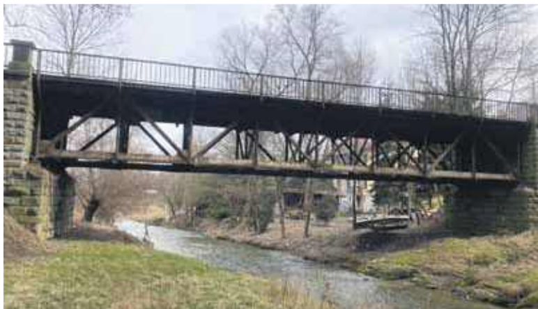
Stary most jest w fatalnym stanie technicznym.