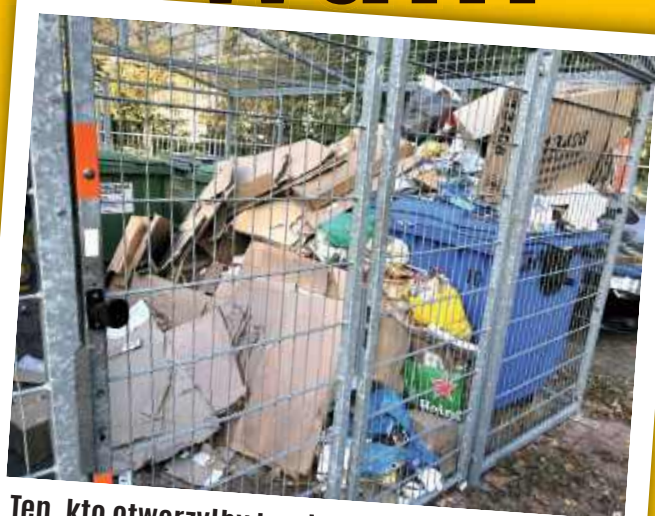
Ten, kto otworzyłby tę wiatę, musiałby najpierw przebrnąć przez stertę makulatury...