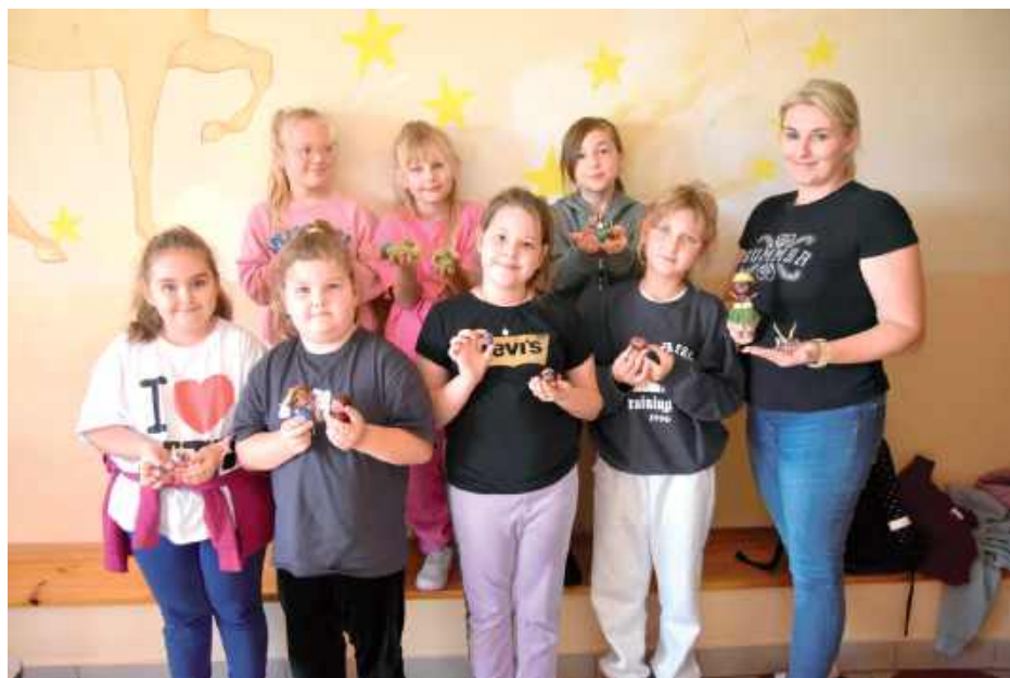
„Kreatywne ręczki” odbywają się w każdy wtorek o godz. 13