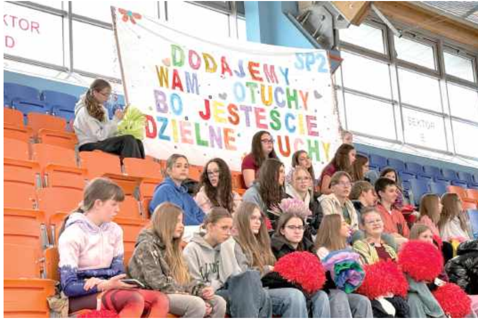
Niepełnosprawnych uczestników dopingowali ich koleżanki i koledzy z radzyńskich szkół. Hala ZSP była praktycznie pełna

Hala Widowiskowo-Sportowa ZSP przy ul. Sikorskiego 15 w Radzynie Podlaskim stała się miejscem wyjątkowego święta – jubileuszowej, dziesiątej edycji Radzyńskiej Paraolimpiady, organizowanej przez Stowarzyszenie „Ósmy Kolor Tęczy”. Tegoroczne hasło wydarzenia brzmiało: „RAZEM – WSZYSCY JESTEŚMY NIE/PEŁNOSPRAWNI. Poznajemy siłę i piękno niepełnosprawności”.