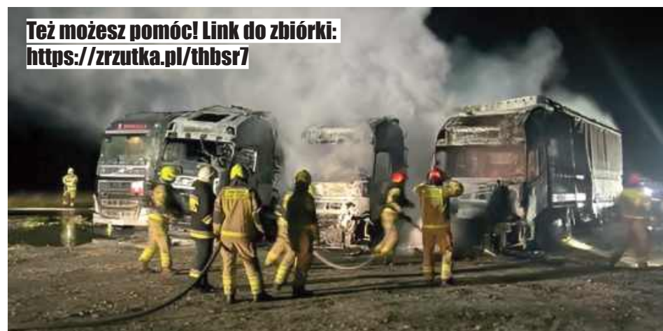
Też możesz pomóc! Link do zbiórki: https://zrzutka.pl/thbsr7