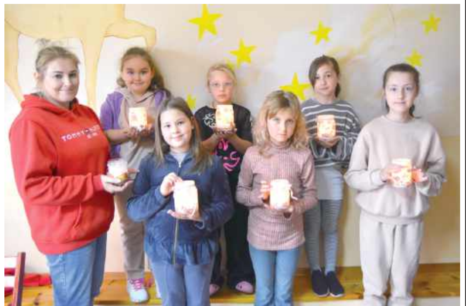
Zajęcia prowadzą animatorzy Gminnego Ośrodka Kultury w Kąkolewnicy

W Gminnym Ośrodku Kultury w Kąkolewnicy ruszył cykl zajęć kreatywnych dla dzieci. Co tydzień najmłodsi spotykają się, by rozwijać swoje zdolności manualne i pomysły artystyczne.