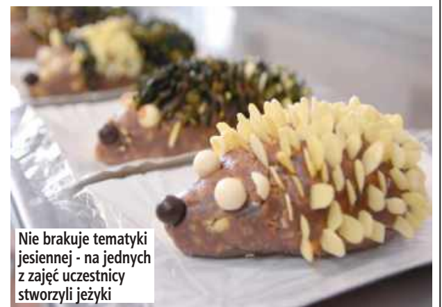
Nie brakuje tematyki jesiennej - na jednych z zajęć uczestnicy stworzyli języki