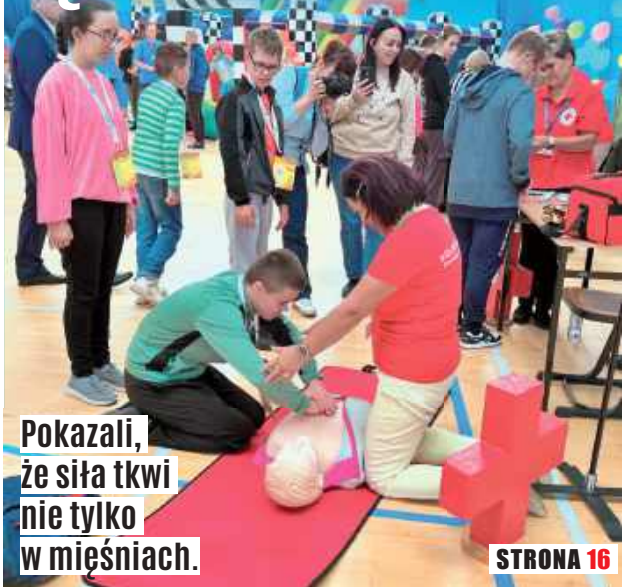
Pokazali, że siła tkwi nie tylko w mięśniach.