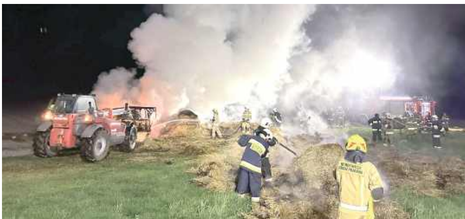
Do działań wykorzystano ładowarkę teleskopową, która służyła do rozwarstwiania bel