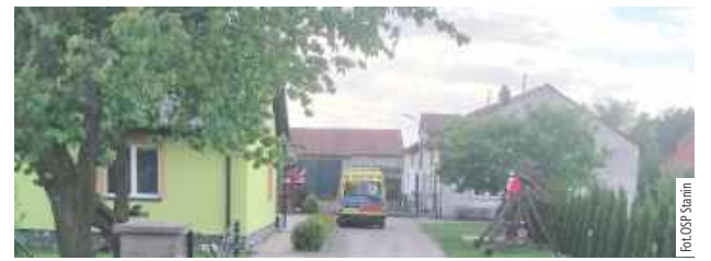
Na miejsce został skierowany helikopter LPR, ostatecznie został jednak odwołany, a kobieta została przekazana pod opiekę zespołu ratownictwa medycznego

12 maja tuż po godzinie 14 do straży wpłynęło zgłoszenie, że 85-letnia, mieszkanka Nowej Wróbliny wymaga natychmiastowej pomocy medycznej.