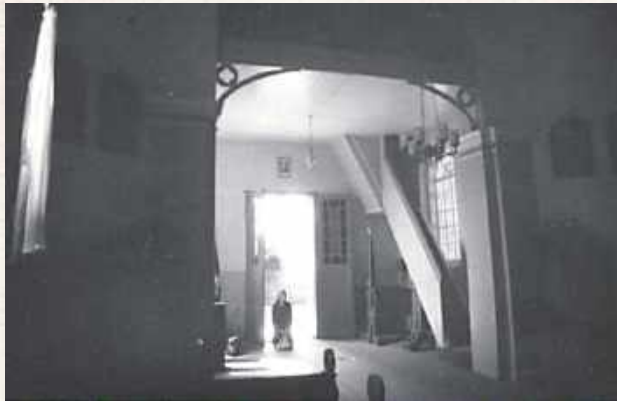
Wnętrze kościoła Opieki św. Józefa ok. 1968 r., kiedy jeszcze odprawiali się tu nabożeństwa. W trakcie inwentaryzacji konserwatorskiej jego stan określono wtedy jako bardzo dobry. Odnotowano, że w ołtarzu głównym znajduje się obraz Matki Boskiej, w bocznych św. Józefa i Matki Boskiej. Nad łukiem nad prezbiterium polichromia z Niewiastami opiekującymi Chrystusa

W takiej sytuacji nowi gospodarze przyjmowali różne strategie odniesienia się do wschodniej (w tym także grekokatolickiej!) przeszłości. Zwłaszcza na Południowym Podlasiu przejmowano je jako mienie pounickie, zgodnie z zasadą, że skoro dawni unicy zapisali się do parafii łacińskich to i ich świątynie oraz przynależne grunty powinny pójść tą drogą. Nawet jeśli w konkretnych przypadkach przesłanki faktyczne i prawne były dość wątpliwe, nikt się tym zanadto nie przejmował. Żeby uniknąć wszelkich nieporo-