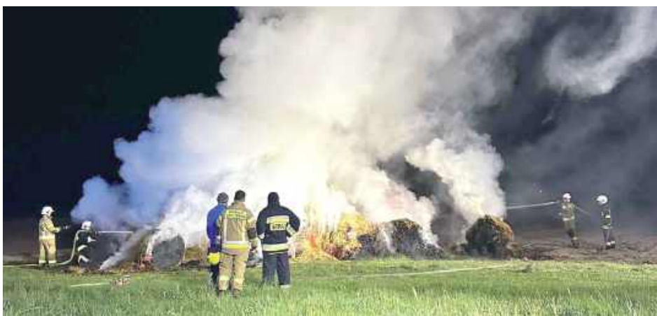
Akcja gaśnicza trwała około trzy godziny

Jednostki biorące udział w akcji: OSP KSRG Krzywda, JRG Łuków, OSP Wola Okrzejska, OSP KSRG Okrzeja, OSP Drożdżak, OSP Radoryż Kościelny. Na miejscu obecna była również policja.