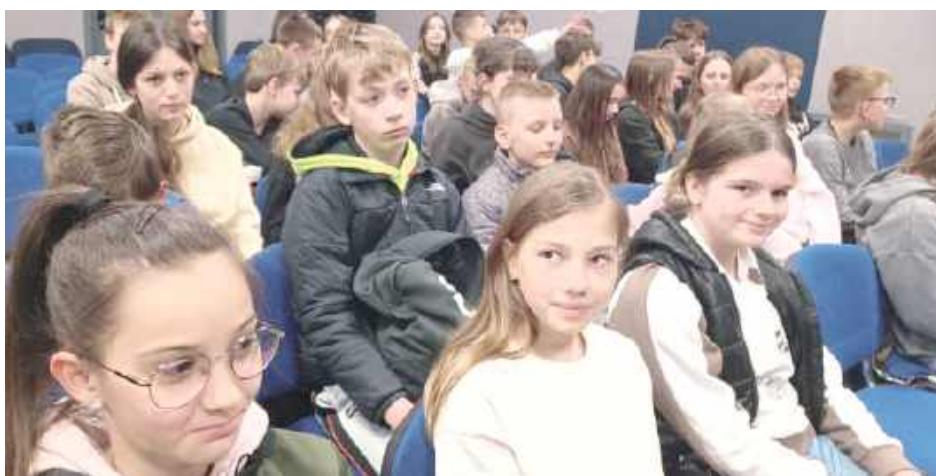
W lekcji edukacyjnej wzięli uczniowie ZS w Gołębce z klas V-VIII

Zajęcia przygotowało Centrum Edukacji Filmowej. Tematem spotkania były zagrożenia, jakie mogą wy-