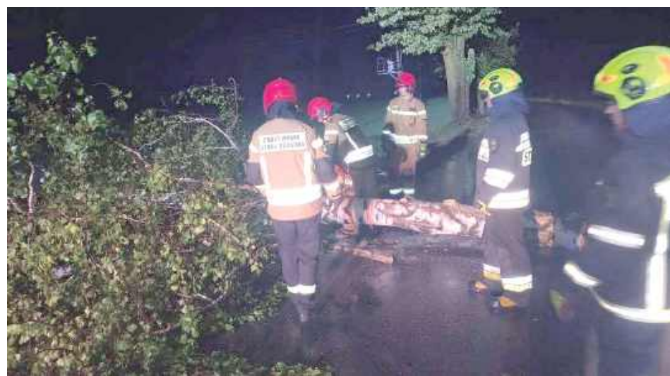
an W działaniach uczestniczył zastęp z JRG Łuków oraz OSP Łazy

Na miejsce zadysponowano również pogotowie energetyczne, ponieważ drzewo przewróciło się w pobliżu linii energetycznych. Na szczęście nikt nie został poszkodowany. Strażacy usunęli zagrożenie i przywrócili drożność drogi.