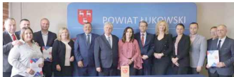
Pieniądze trafią do jednostek Ochotniczej Straży Pożarnej w Woli Gułowskiej, Gołych Łazach, Serokomla i Staninie

Każda z gmin otrzymała po 15 tysięcy złotych. Pieniądze te zostaną przeznaczone na zakup nowego sprzętu dla miejscowych jednostek Ochotniczej Straży Pożarnej w Woli Gułowskiej, Gołych Łazach, Serokomla i Staninie.