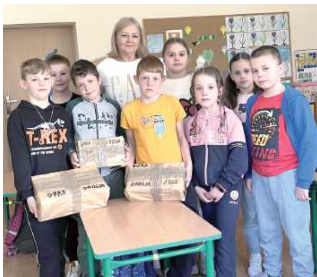
„Góra Grosza” uczy wrażliwości na ludzkie potrzeby i kształtuje wrażliwość u młodego pokolenia, aby potrafiło nieść pomoc i okazywać empatię