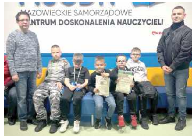
Gracze Orłąt Łuków wywalczyli trzy medale

17 maja w Warszawie odbył się Grand Prix Polski 2025 w szachach. Znakomicie spisali się zawodnicy Orłąt Łuków.