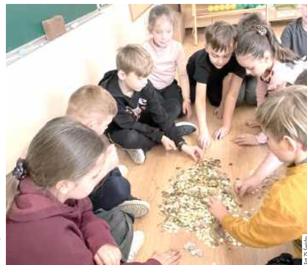
Razem w szkole zebrano 9134 monety. Na wyróżnienie zasługuje klasa II, która zebrała 2795 monet. W akcji „Góra Grosza” aktywni byli również uczniowie klasy I, III i VIII