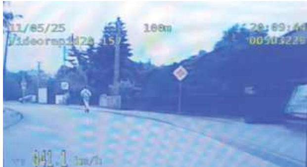
Nastolatek jechał zamiast po chodniku, po ulicy Ławeckiej w Łukowie, do tego przekroczył prędkość na odcinku, gdzie obowiązuje ograniczenie prędkości do 40 km/h

- W niedzielę, 11 maja patrolujący ulice Łukowa policjanci zauważyli na ulicy Ławeckiej jadącego hulajnogą elektryczną nastolatka. Na tym odcinku drogi obowiązuje ograniczenie prędkości do 40 km/h. Nie ma tam drogi dla rowerów lub pasa ruchu dla rowerów, dlatego też nastolatek mógł skorzystać z chodnika i jechać z prędkością zbliżoną do prędkości pieszego. Niestety jechał po jezdni -