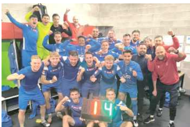
Wisła wywalczyła szalenie ważne punkty w kwestii walki o utrzymanie w II lidze