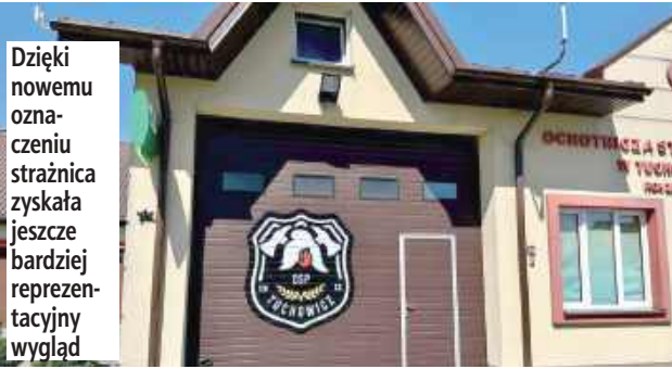
Dzięki nowemu oznaczeniu strażnica zyskała jeszcze bardziej reprezentacyjny wygląd