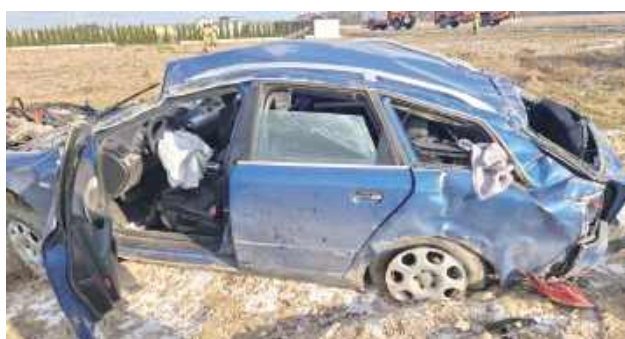
Moment zdarzenia w Dębownicy uchwycił monitoring zamontowany na domu, obok którego audi prowadzone przez 20-latka - dosłownie - przeleciało

Na miejscu policjanci znaleźli w polu obok drogi wrak opisywanego w zgłoszeniu audi. 20-latek został zabrany karetką do szpitala. Obrażenia, jakich doznał, nie zagrażały jego zdrowiu i życiu.