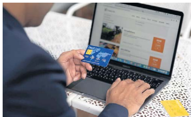
Handel i e-commerce coraz mocniej zależą od zrozumienia klienta oraz zmieniających się nawyków konsumentów

Zapytany o doprecyzowanie tego, jak rozumie egzekucję, wyjaśnił, że z jednej strony chodzi o konsekwentne realizowa-