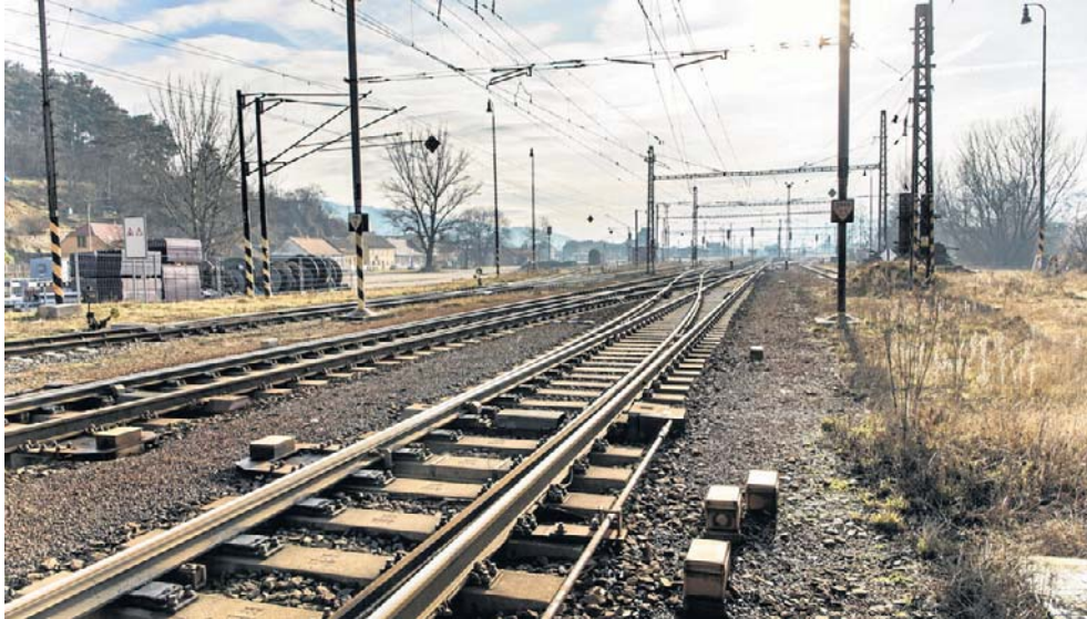
Inwestycja PKP PLK ma omijać Przemysł i stworzyć alternatywne połączenie w stosunku do mostu kolejowego na terenie miasta

- W obecnym kształcie projekt ten budzi wśród mieszkańców bardzo poważne obawy dotyczące bezpieczeństwa, stabilności istniejącej zabudowy oraz dalszych warunków życia w naszej okolicy. Z ogromnym niepokojem odnosimy się do in-