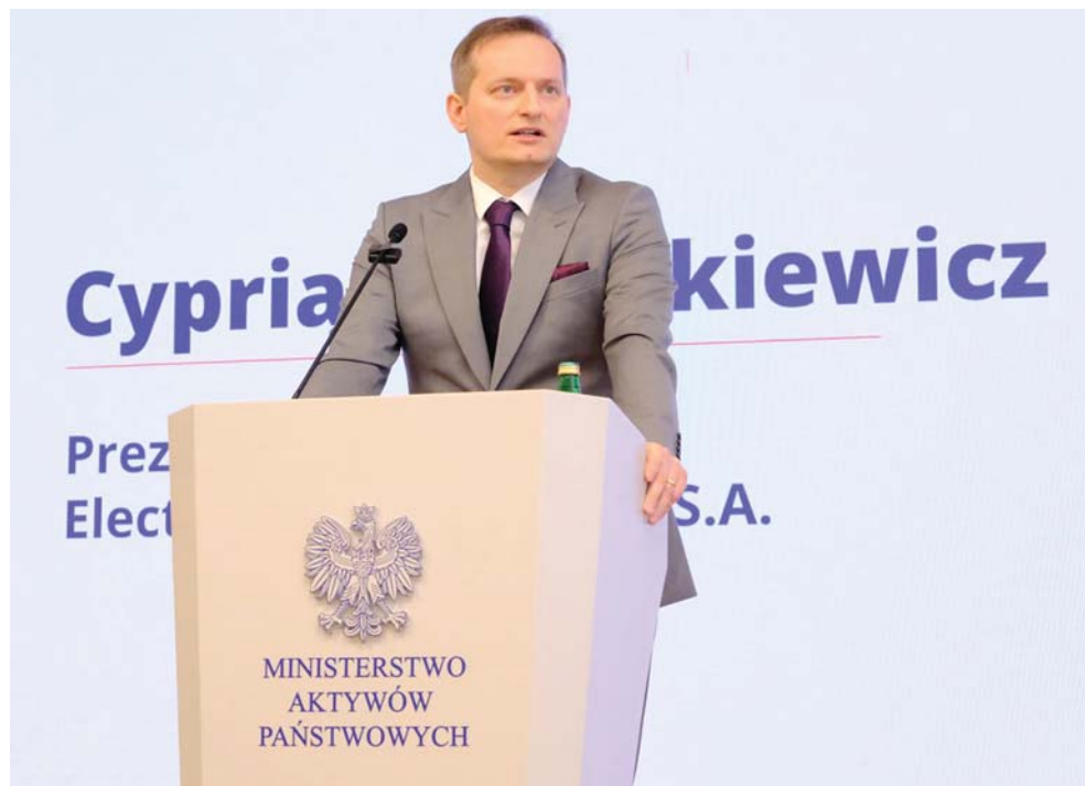
– Pierwszy samochód zjedzie z linii produkcyjnej w Jaworznie w 2029 roku – powiedział na konferencji prezes EMP

Dorota Mariańska dorota.marianska@polskapress.pl