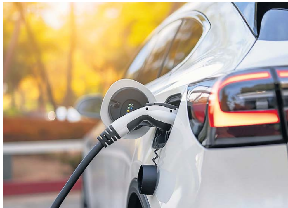
Spółka ElectroMobility Poland powstała w 2016 roku pod kątem budowy polskiej marki samochodów elektrycznych

– Od pierwszego dnia produkcji będzie zapewniony local content na poziomie 70 procent – wskazał prezes Gronkiewicz.