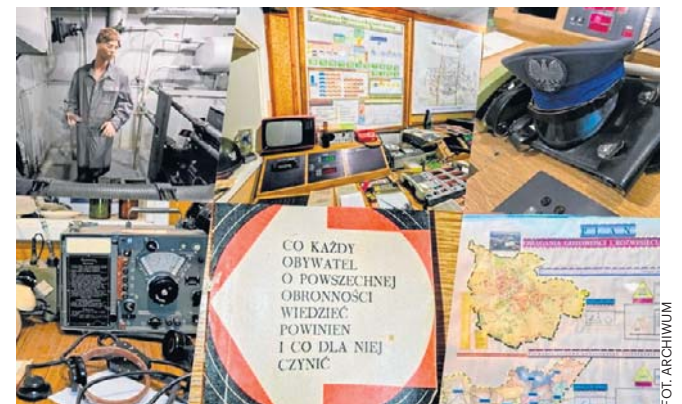
Schron Kierowania Obroną Cywilną to miejsce, w którym zegary stanęły w połowie lat 60. XX wieku

Ilu mieszkańców wiedziało o istnieniu tego schronienia i jego przeznaczeniu? Przez niemal 40 lat tylko nieliczni urzędnicy, oficerowie wysokiej rangi i dyrektor szkoły. Dziś jednak każdy ma szansę przekroczyć jego próg. Schron Kierowania Obroną Cywilną to nie zwykłe muzeum, gdzie eksponaty ogląda się zza grubego szkła. To interaktywna podróż do świata pełnego napięcia, wojskowych map i przesywającego dźwięku syren alarmowych. Wchodząc pod budynek Szkoły Podstawowej nr 14, uderza zapach nafty, ropy i specyficzna aura izolacji. Zobaczymy w pełni sprawne urządzenia filtrowentylacyjne, oryginalne radiostacje, telefony korbowe oraz magnetofony szpulowe. Wszystko wygląda tak, jakby obsługa wyszła stąd przed chwilą. Dzięki efektom