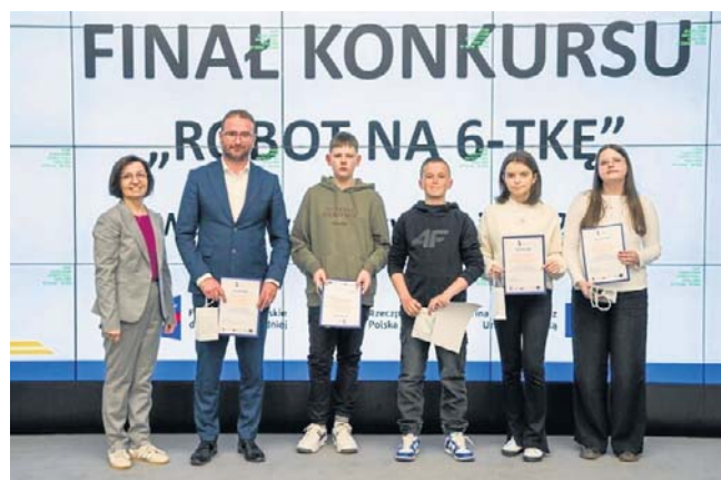
Drużyna z SP w Starym Mieście dobrała wyróżnienie podczas finału w Warszawie