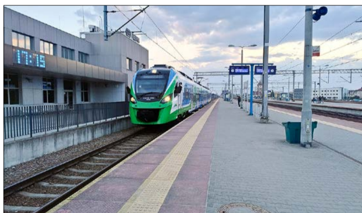
Jedzie pociąg z daleka...