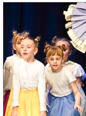
Pieguski na scenie DK Śnieżka.

Starszą kategorię wygrały grupy z Tarnowa i Wielopola Skrzyńskiego.