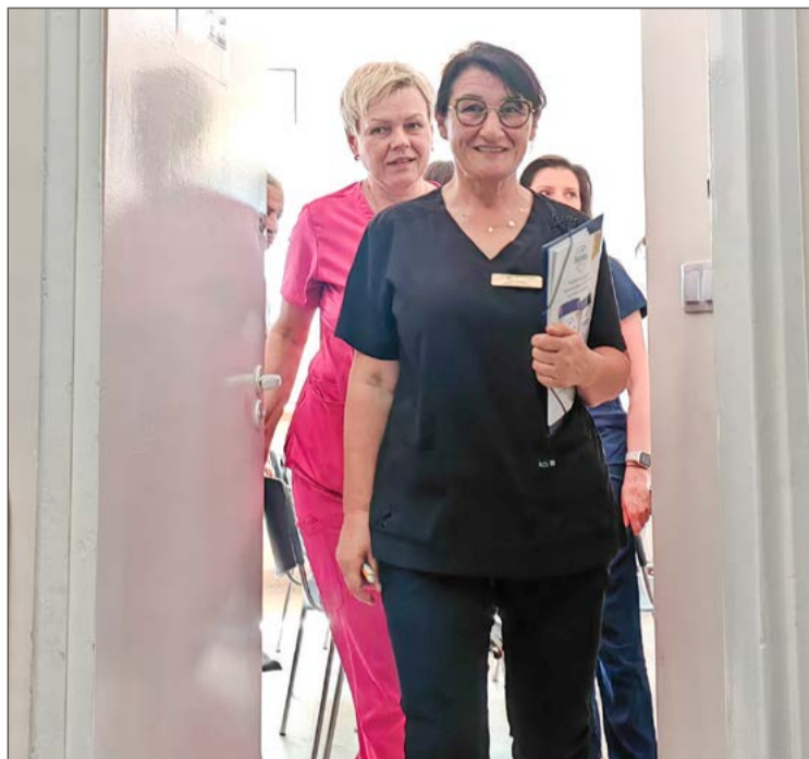
W przeddzień sesji pracownicy spotkali się z dyrektorem z Rzeszowa.