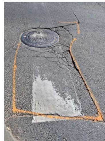
Niebawem zacznie się wycinanie uszkodzonego asfaltu.

W kilkunastu miejscach w mieście należy spodziewać się utrudnień w ruchu.