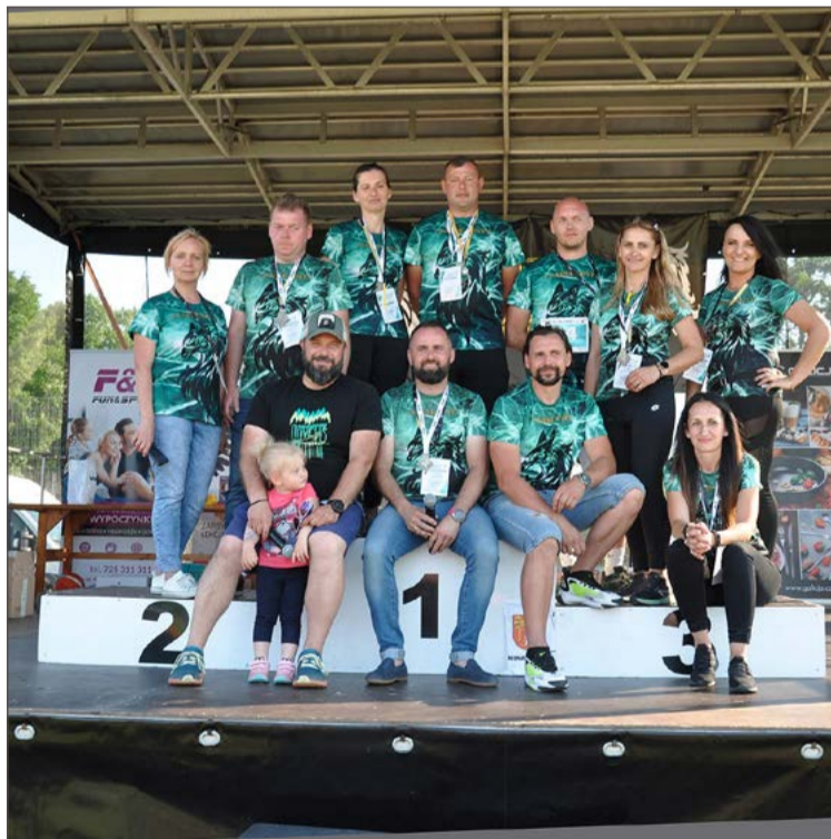
Grupa od wielu lat wspiera najbardziej potrzebujących.

Sercem całego zamieszania będzie Szkoła Podstawowa w tej miejscowości, gdzie zlokalizowana będzie linia startu i mety oraz biuro zawodów. Na uczestników czekają wymagający bieg na 10 km (limit czasu 90 min) oraz na 5 km (50 min). Ale będzie też krótsza trasa na 2 km (30 min). Natomiast miłośnicy marszów z kijami będą mogli spróbować swoich sił w kategorii nordic walking na dystansie 5 km (90 min). Nie zapomniano również o najmłodszych, dla których od godziny 11 zaplanowano gry i zabawy, a o 13 biegi dziecięce z limitem 200 miejsc. Wszystkie biegi główne wystartują o godz. 15. Zapisy prowadzone są drogą internetową za pośrednictwem formularza na stronie timekeeper.pl . Dla osób, które podejmą decyzję w ostatniej chwili, będzie możliwość rejestracji w biurze zawodów w dniu biegu, pod warunkiem, że będą wolne miejsca. Opłata startowa na każdym z głównych dystansów wynosi 50 zł. Organizatorzy wprowadzili łączny limit wynoszący 300 uczestników na wszystkich dystansach dorosłych. W biegach mogą wzięć udział osoby, które najpóźniej