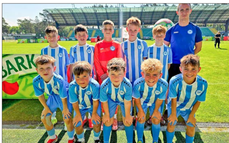
W kategorii U-10 najlepszy okazał się SMS Igloopol Dębica.

dziewczeta muszą pokonać drużyny: Rosolki Stężycza, SP 48 UKS Zaspas Gdańsk i ZSP Podsarnie-Rokiciny, a chłopcy: SP 1 Bieruń, 300 Spartan i SP 51 Poznań. Finałisci zagrają na PGE Narodowym przed