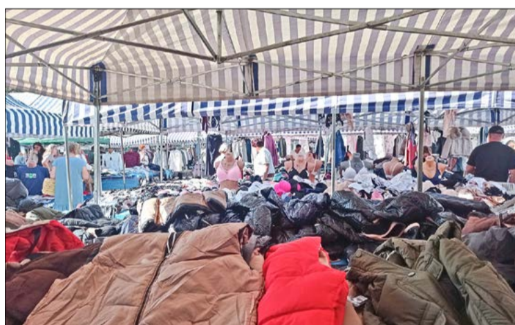
Szwarc, mydło i powidło, czyli dębicki targ.