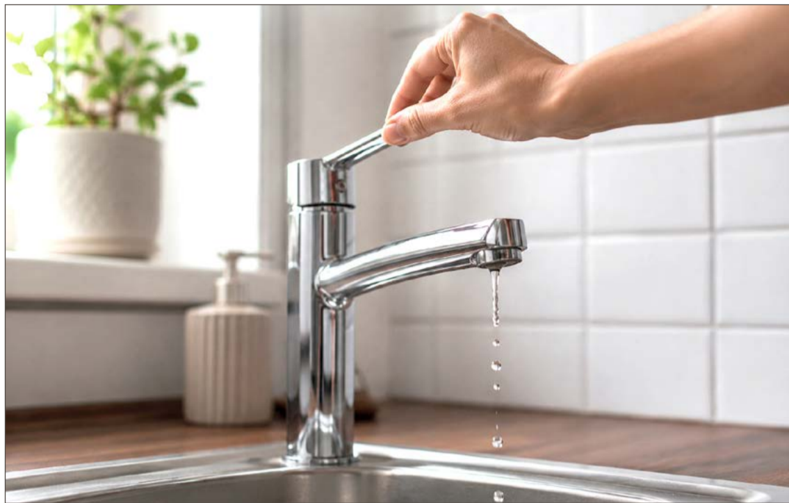
Sytuacja z wodą w gminie już jest trudna, a burmistrz przewiduje, że może być jeszcze gorzej.

I wyjaśnia, że władze gminy ciągle rozbudowują sieć wodociągową. O kolejnej takiej inwestycji