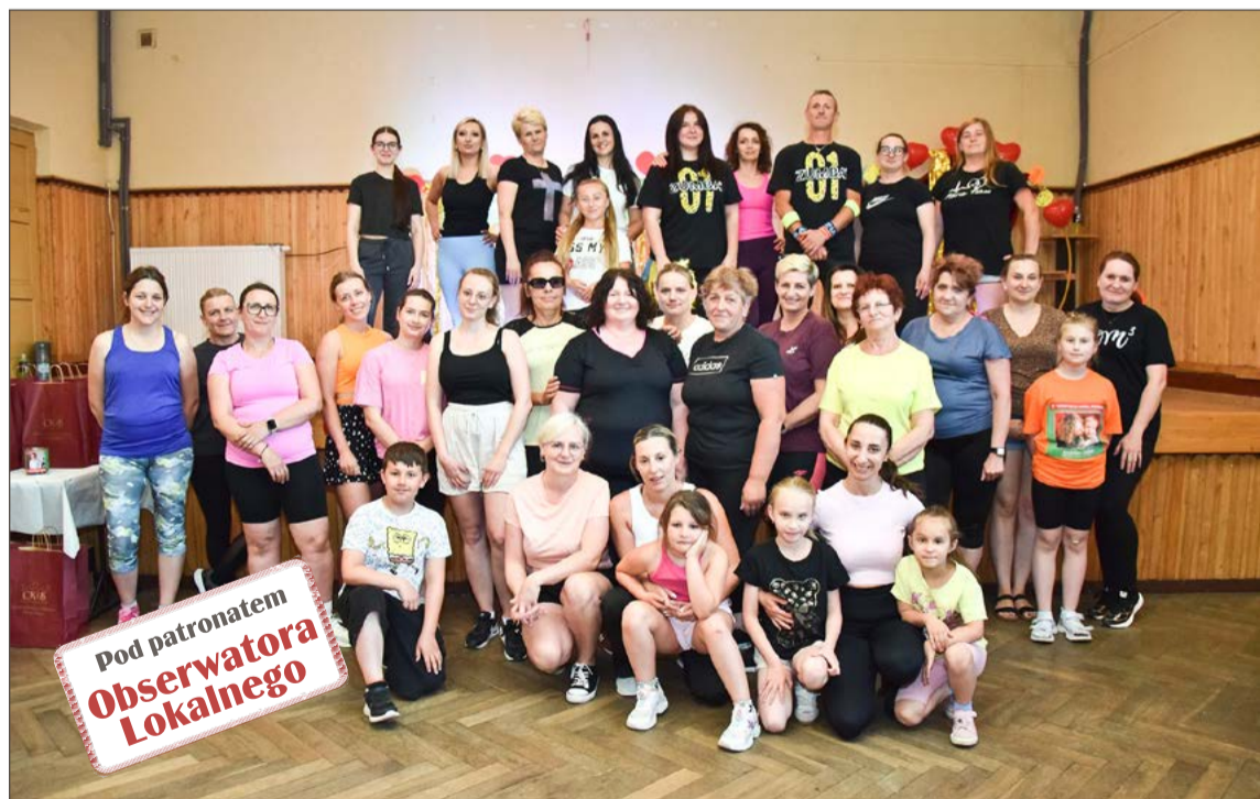
Wydarzenie przyciągnęło ponad 30 pań. Więcej zdjęć znajdziecie na www.debica24.pl .

- W tym roku, 20 czerwca, odbędzie się kolejne wydarzenie, a jego