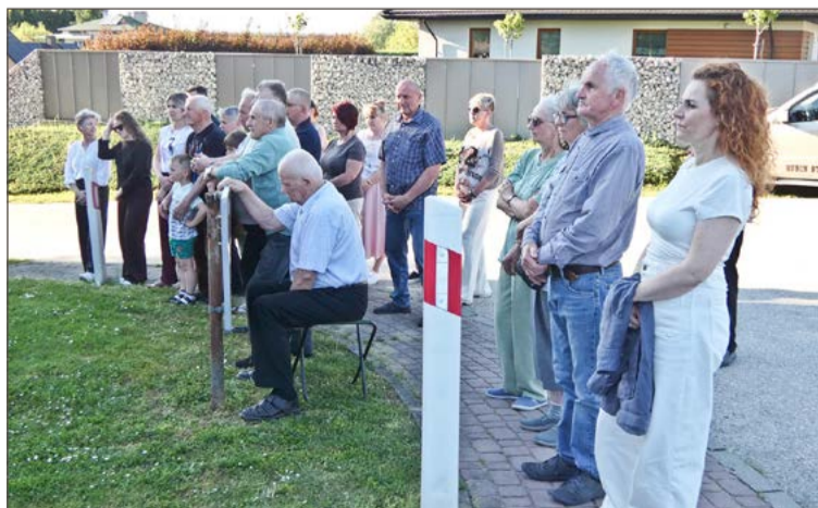
Od lat, pod koniec maja, odprawiana jest tam msza św.