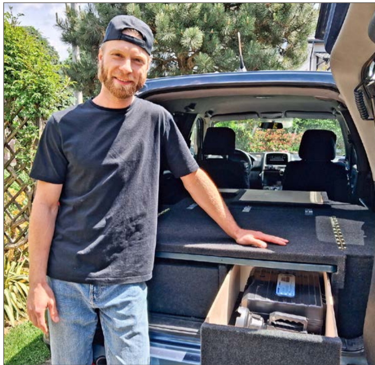
Z zewnątrz jego samochód wygląda normalnie. Ale wystarczy zajrzeć do wnętrza, by się przekonać, że śmiało można tam nocować.

Wiedział też, że samochód może być starszy, ale musi być zadbane, żeby nie musiał tracić czasu na remont blacharski. Wybór padł właśnie na Hondę. W grudniu ubiegłego roku zaczął zastanawiać się, jak przerobić pojazd tak, by dawał możliwość wygodnego spa-