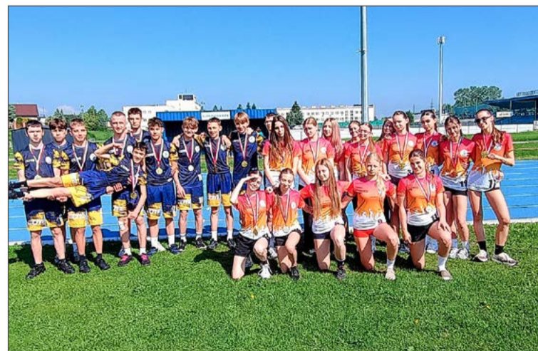
Do rywalizacji z uczniami dębickiej szkoły nie stanął nikt.