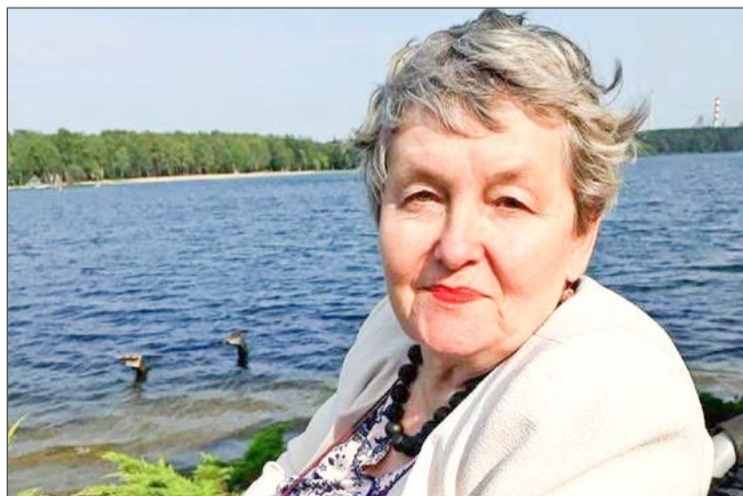
Zawsze uśmiechnięta i pogodna - taka zostanie we wspomnieniach.

- Z głębokim smutkiem przyjąłem wiadomość o śmierci Pani Doktor. Była niezwykle dobrym, życzliwym i pełnym serca człowiekiem. Nigdy