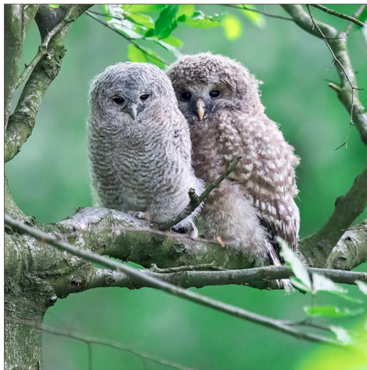
Teraz bracia, w przyszłości mogą stać się rywalami.

Zapadła decyzja, by młodego umieścić na drzewie, z którego spadł. Ekipa ratunkowa szybko zorganizowała nowe lokum dla