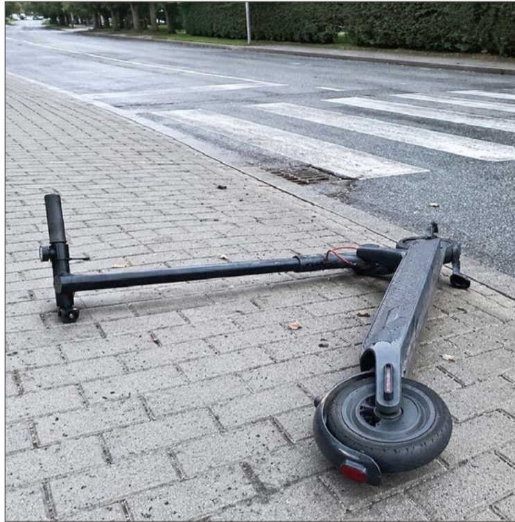
To kolejne wypadki z udziałem hulajnog w ostatnim czasie.

Około godz. 17:40 służby zostały poinformowane o zderzeniu osobowego Opla z hulajnogą elektryczną. Kiedy na miejsce dotarła policja, to pomocy poszkodowanej 14-latce udzielali już strażacy z Komendy Powiatowej Państwowej Straży