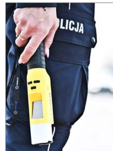
Kierujący odpowiedzą teraz przed sądem.

Tak samo, jak zatrzymany 1,5 godziny wcześniej na MOP Jastrząbka 36-letni mieszkaniec Dębicy. Do dy-