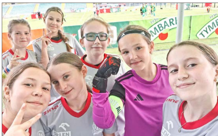
Reprezentacja Szkoły Podstawowej nr 9 w Dębicy wygrała kategorię U-12.