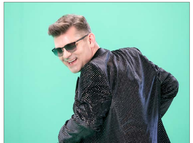
Koncert Zenona Martyniuka to gratka dla fanów disco polo.