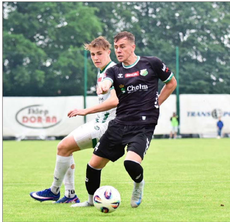
Wisłoka (białe stroje) wyglądała na drużynę solidniejszą, ale musieli uznać wyższość zawodników Chełmianki.

W końcówce gospodarze próbowali jeszcze doprowadzić do wyrównania, lecz nie zdołali stworzyć sytuacji pozwalającej na zdo-