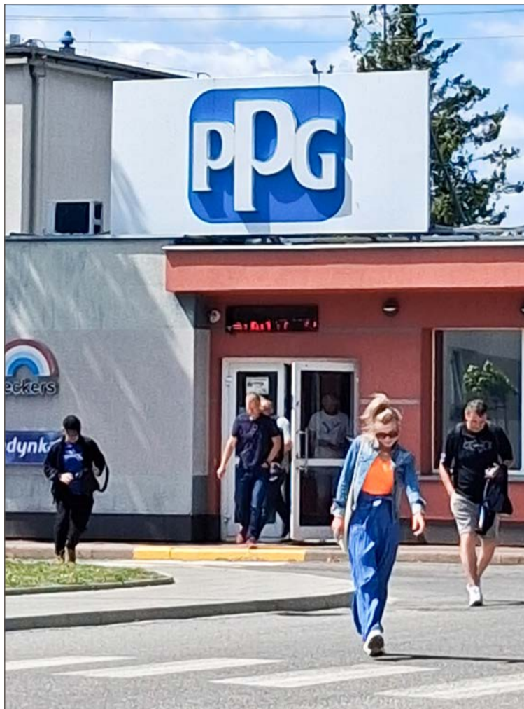
Pracownicy PPG zgodzili się na zaproponowane im porozumienie.

Tyle tylko, że spółka PPG Deco Polska nie zamierzała zmieniać zdania, a wręcz przeciwnie. Proces wygaszania zakładu trwał, a z pra-