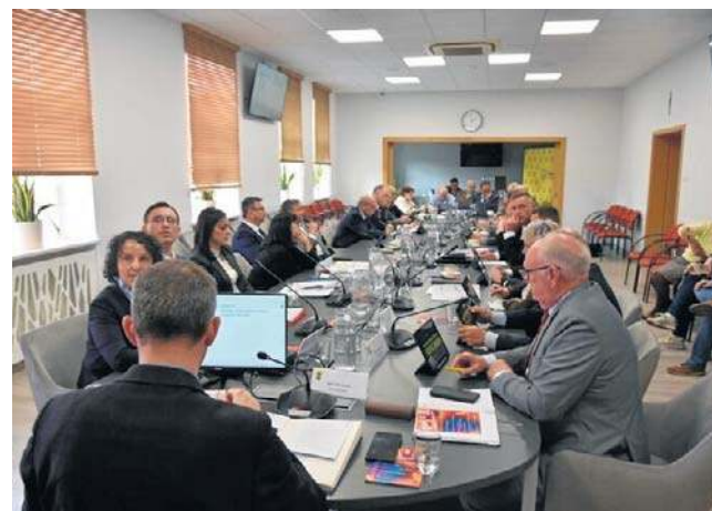
Rada miejska dyskutowała o projekcie uchwały ws. przeprowadzenia budżetu obywatelskiego na 2027 r.

Łączna pula w tym segmencie wynosi 100 tys. zł. Z kolei