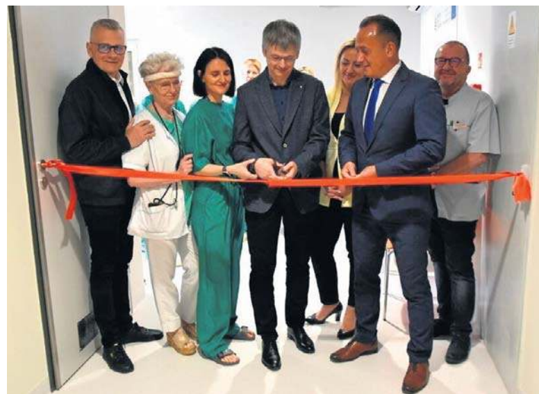
Za nami otwarcie pracowni endoskopowej w nowosolskiej lecznicy

- Dostępność tych zabiegów w Polsce jest za mała - uważa. - Powinno być więcej ośrodków, które je robią. Byłem kiedyś na szkoleniu w Hamburgu i tam mówiono o tym, że każdy ośrodek, który wykonuje określoną liczbę cho-