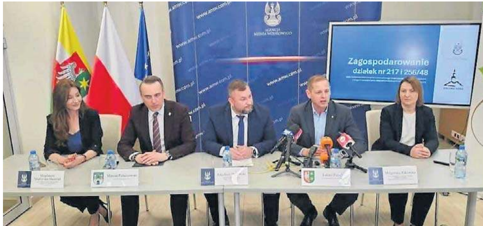
Na konferencji prasowej poznaliśmy szczegóły inwestycji

- Szacunkowy koszt pierwszego etapu inwestycji to 13 mln zł, a całego projektu - 72 mln zł - mówi Arkadiusz Dą-