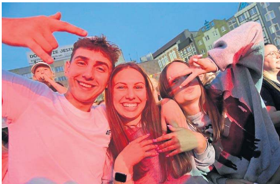
Młodzieżowy budżet obywatelski ma zacząć funkcjonować w Gorzowie od roku szkolnego 2027/2028