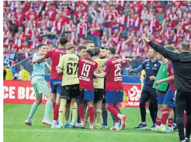
W końcówce spotkania na murawie doszło do awantury

Górniki po raz ostatni grał w finale w 2001 roku, a zdobył Puchar w 1972. Związana z tym presją dało się odczuć i była też widoczna w pierw-