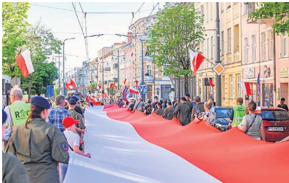
Gigantyczna flaga i wspólny marsz. Ten widok robi wrażenie

Podczas tegorocznej edycji prowadzono również zbiórki