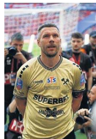
Łukasz Podolski na razie ma osiem procent akcji Górnika

Cieszymy się dzisiaj, jutro z Pucharu, a potem znów liga, przygotowania na te ostatnie cztery mecze, po to, żeby to miejsce, jakie teraz mamy, utrzymać. Może uda się jeszcze trochę więcej? I potem na spokojnie usiądę sobie i zobaczę, jak to pojedzie dalej.