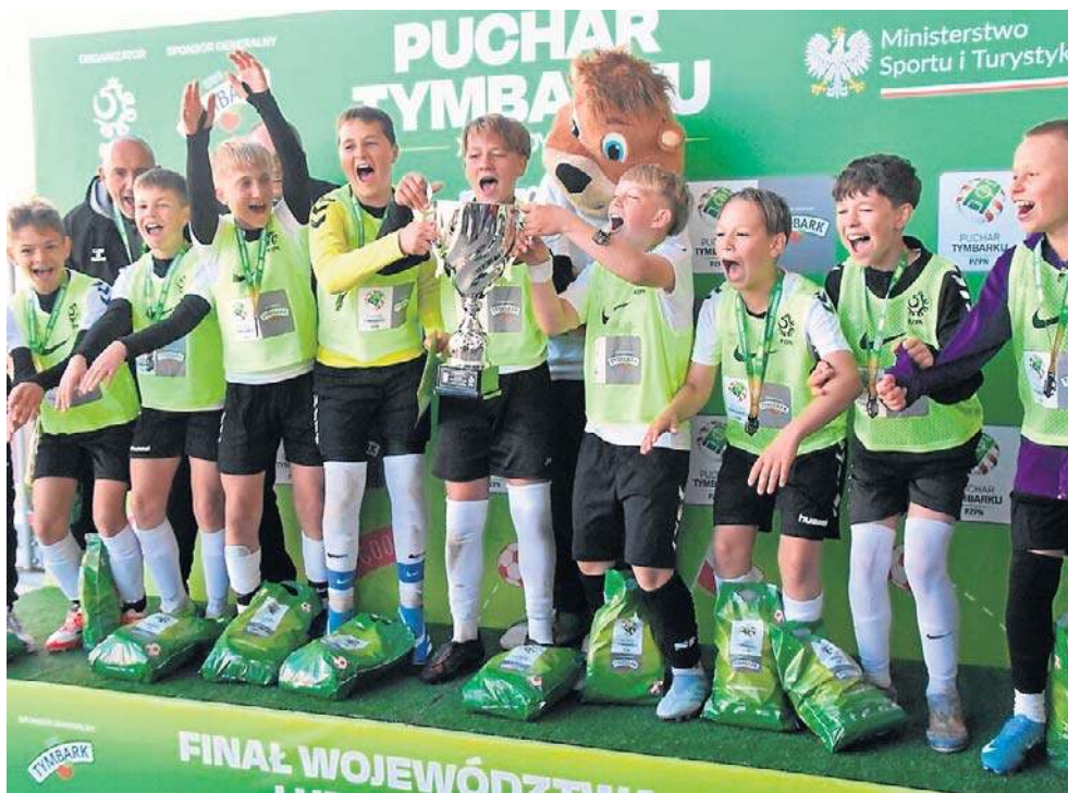
Zespoły z Zielonej Góry od trzech lat triumfują w lubuskich finałach Pucharu Tymbark