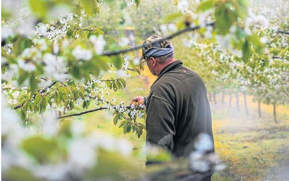
To miała być spokojna wiosna. Rolnicy mówią: jest gorzej niż źle

- Choć mogło się wydawać, że zima była śnieżna i wilgotna, w rzeczywistości na większości kraju suma opadów była poniżej normy. Śniegu momentami było sporo, ale opady występowały