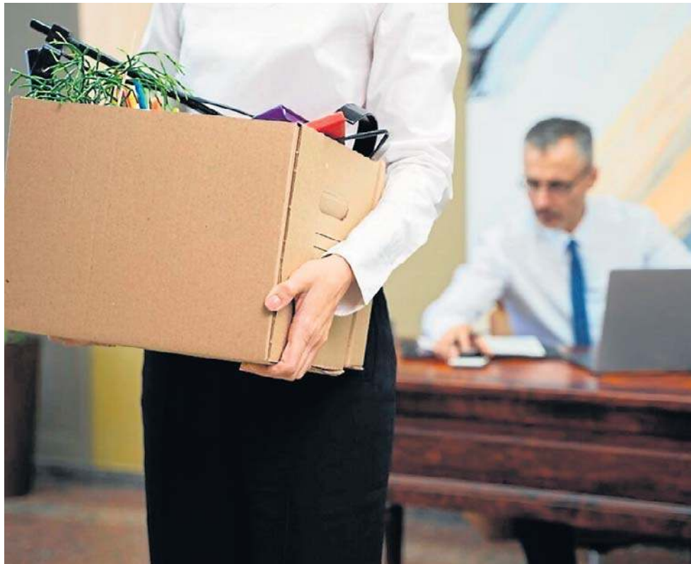
Utrata pracy to jedno z najbardziej stresujących doświadczeń życiowych i to niezależnie od tego, czy posadę tracimy po roku czy 20 latach

- Co mnie spotkało konkretnie? „Nie chwal się słubem” - ostrzegali mnie koledzki z dłuższym stażem. A ja się pochwalałam i pracę straciłam. Zamiast przedłużenia umowy, a liczyłam już na taką na czas nieokreślony, nastąpiło „nieprzedłużenie”. Bez konkretnej argumentacji,