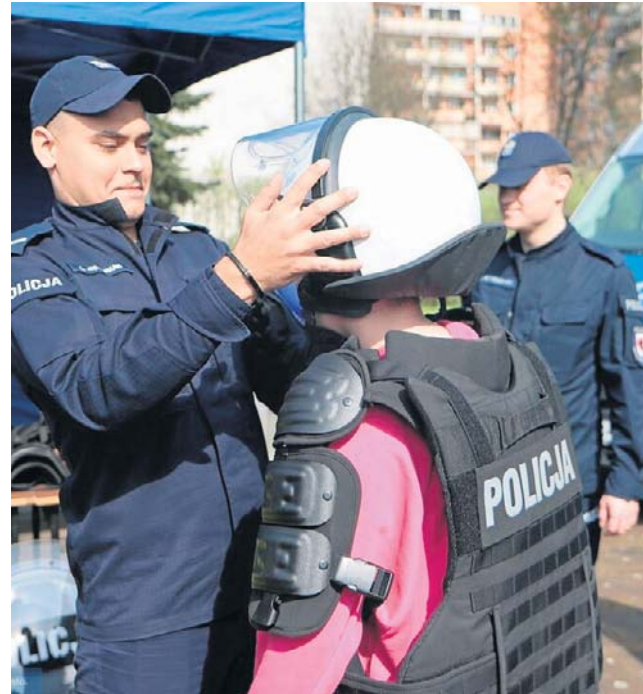
Tak było na akcji Drzwi Otwarte w komendzie miejskiej policji przy ulicy Okrężnej w ubiegłym roku

winny posiadać uregulowany stosunek do służby wojskowej (potwierdzony adnotacją w książeczce wojskowej lub zaświadczeniem z Wojskowego Centrum Rekrutacji).