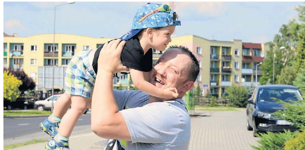
Co zastąpi WIBOR, czyli wskaźnik określający oprocentowanie kredytów, m.in. hipotecznych? Od 2037 roku będzie to POLSTR, jedyny stosowany w umowach

- Klienci banków będą mogli nadal korzystać z umów, w których jest stosowany, podobnie zresztą jak w przypadku wszystkich instrumentów finansowych czy obligacji Skarbu Państwa. W przypadku nowych umów, z komunikatu wynika, że do końca grudnia tego roku WIBOR można jeszcze stosować w okresie przejściowym. Równolegle jednak banki i inne instytucje finansowe, firmy leasingowe oraz firmy faktoringowe będą już konsekwentnie oferować umowy oparte na nowym wskaźniku - dodaje szef ZBP.