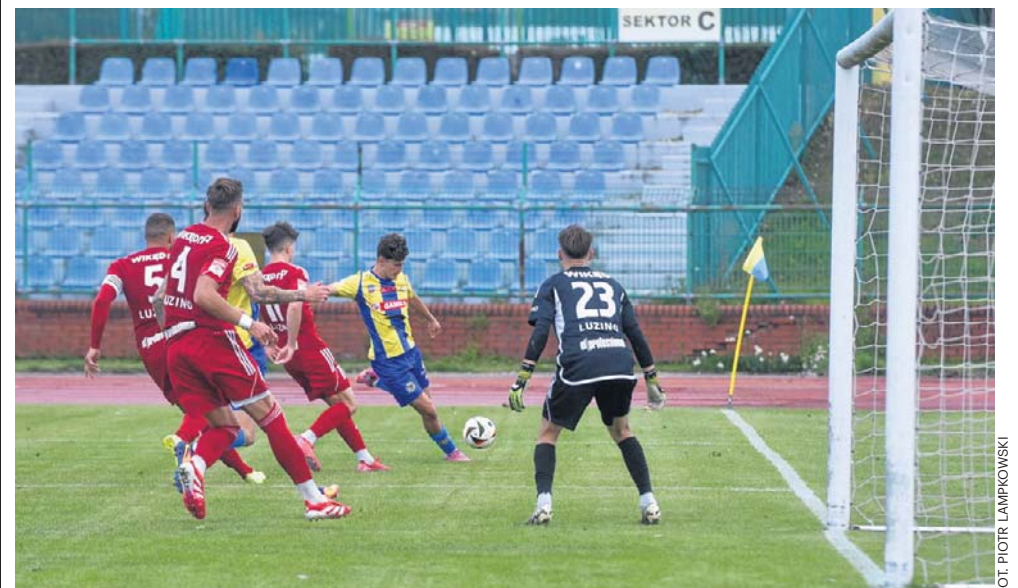
Piłkarze z Luzina to rewelacja sezonu 2025/26 w Betclit 3. Lidze

W rundzie jesiennej Zawisza przegrał w Luzinie 1:2. Czas na rewanż bydgoski rycerzu! ©