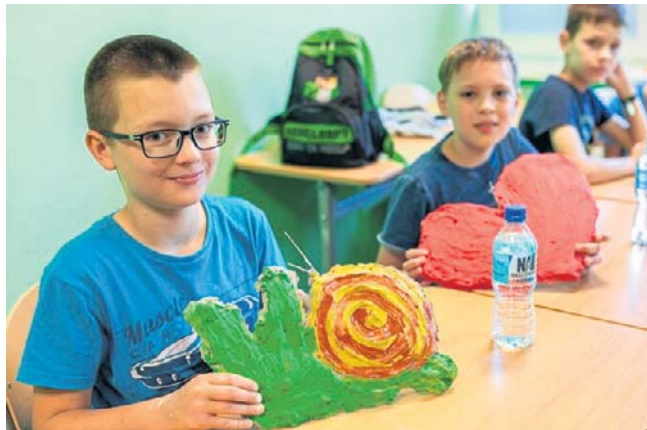
Tak było dwa lata temu podczas „Bydgoskich półkolonii” w Pałacu Młodzieży, gdzie powstały piękne prace

Jak podkreśla ratusz, uczestnicy będą objęci opieką w godz. od 7.30 do 15.30. Przewidziano, m.in., blok zajęć integracyjnych na świeżym powietrzu, zajęcia sportowe w salach sportowych