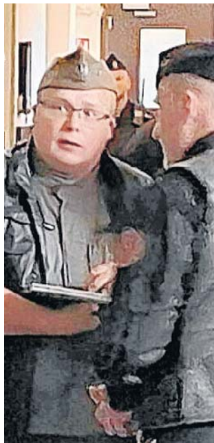
Kolejna odsłona sprawy „Kamratów” odbyła się wczoraj przed bydgoskim sądem

W akcie oskarżenia sprawy, której kolejną odsłona przed bydgoskim sądem odbyła się wczoraj, znalazły się zarzuty innych przestępstw kryminalnych. Jak informuje Ośrodek Monitorowania Zachowań Rasistowskich i Ksenofobicznych, „od posiadania broni, przez znieważanie i atakowanie ludzi