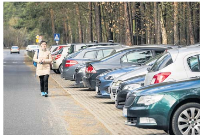
Parkowanie w Myślicinku staje się sporym problemem

Ratusz odpowiada, że w celu ograniczenia i eliminowania przypadków nielegalnego wjazdu oraz parkowania na terenach LPKiW prowadzona jest współpraca ze Strażą Miejską, obejmująca kontrole terenu Parku. Niezwłocznie po-