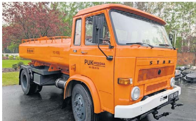
Odnowiona polewaczka należąca do MWiK

- Kiedyś służył mieszkańcom, a od teraz będzie przypominał zwiedzającym o historii bydgoskich wodociągów i pracy dawnych służb miejskich - informują Miejskie Wodociągi i Kanalizacja. Nie jest to jedyny przypadek odrestaurowania leciwego pojazdu przez miejskie spółki w Bydgoszczy.