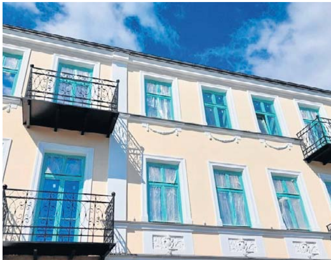
Kamienica przy ul. Maślanej wypiękniała. Do użytku oddane zostaną 23 mieszkania. Nabór wniosków trwa

Joanna Maciejewska joanna.maciejewska@polskapress.pl