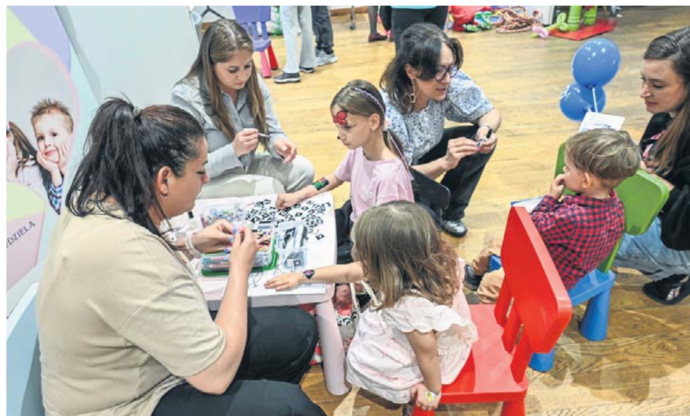
Gwarno było podczas „Bydgoskiego Dnia Rodziny” w Bydgoskim Centrum Organizacji Pozarządowych

W czasie „Bydgoskiego Dnia Rodziny” nie mogło zabraknąć