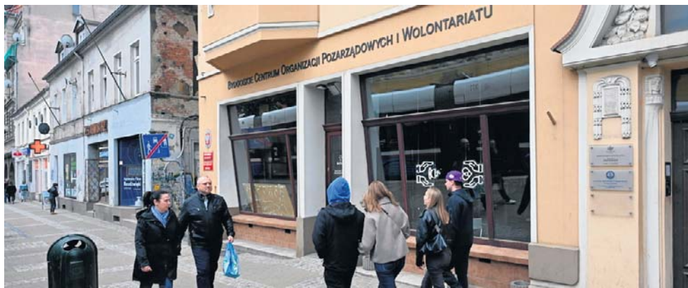
Nowy operator miejsca, gdzie działało bydgoskie centrum wolontariatu, panoramie przywróci panoramie centrum miasta sztyl „Współczesnej”

– Pomysł zrodził się już jakiś czas temu. Zastanawialiśmy się nad stworzeniem dziennej filii Mózgu – miejsca otwartego, dostępnego również poza godzinami koncertowymi. Pierwotnie myśleliśmy o Młynach Rothera, ale pojawiła się możliwość reali-