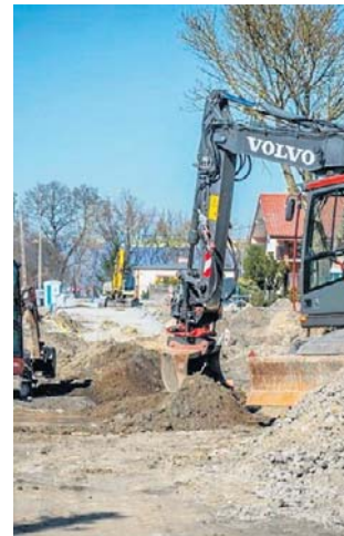
Prace na Podleśnej wiosną ruszyły pełną parą. Mają zakończyć się jesienią

Rozbudowa ulicy Podleśnej realizowana jest w ramach programu utwardzania ulic gruntowych. Za realizację inwestycji odpowiada konsorcjum bydgoskich firm Affabre i Kada-Bis.