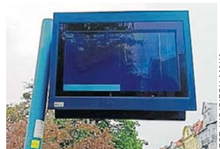
Tablica przy przystanku Mickiewicza/Teatr Polski od dłuższego czasu jest nieczynna

- Oba przypadki zostały zgłoszone do serwisu. Tablica na przystanku Mickiewicza/Teatr Polski w kierunku ulicy Gda-