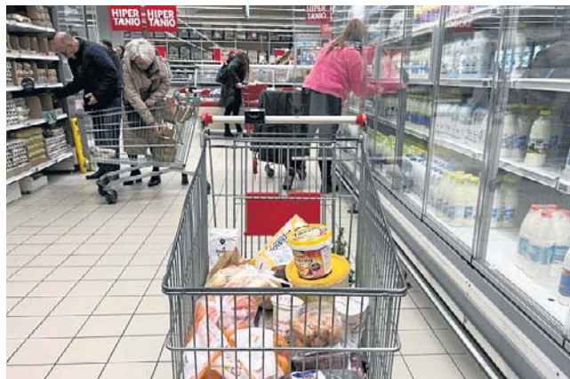
Podwyżek możemy spodziewać się w drugiej połowie roku. Wtedy wyższe ceny ropy przebiją się do sklepowych półek

W przypadku żywności, ceny nadal rosły, ale tempo wzrostu osłabło. W 2024 r. jedzenie i napoje bezalkoholowe podrożały dla mieszkańców naszego województwa o 5,1 proc., a w 2025 o 3,1 procent.