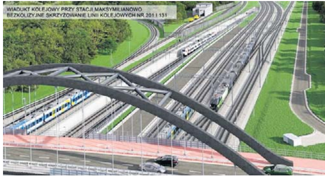
Tak ma wyglądać nowy wiadukt w Maksymilianowie

- Budowę wiaduku planujemy w latach 2027-2028. Oprócz krótkotrwałych zmian