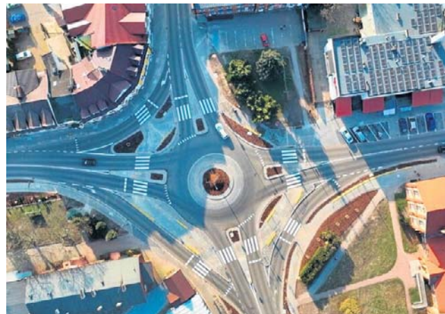
Zrealizowano szereg inwestycji, między innymi drogowych

Największą część wydatków przeznaczono na infrastrukturę drogową. Wśród zrealizowanych zadań znalazły się przebudowy dróg Ośno-Zadzromin, Ciechocinek-Siutkowo, Konradowo-Siniarzewo oraz odcinka Ciechocinek-Dąbrówka w Raciążku. Modernizowano również ulice Wojska Polskiego w Aleksandrowie Kujawskim, Zamkową i Szkolną w Raciążku oraz infrastrukturę skrzyżowań, w tym ronda w Aleksandrowie Kujawskim i Zdunach.