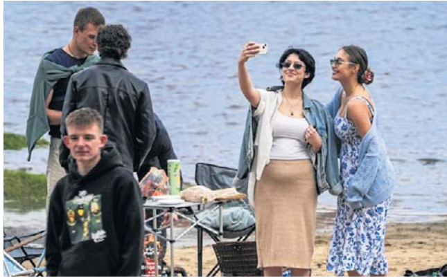
Plenerowe sceny do filmu „Całopalenie” w poniedziałek kręcono na Kępie Bazarowej, na brzegu Wisły

Tak, po około półtorej godziny, zakończyła się praca