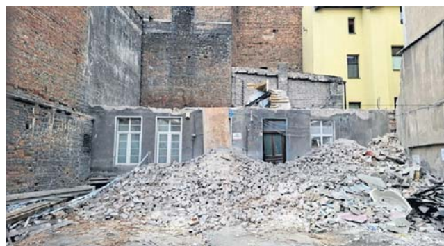
Ulica Sukiennicza 3. Z kamienicy zostały w zasadzie tylko żelazne schody

Za wysokim parkanem przy ul. Sukienniczej 3 znikają resztki kamienicy. Na starówce jest to widok rzadki. Zdarzało się, że ten czy inny inwestor wypruł wnętrze zostawiając fasadę, jednak całkowita rozbiórka to w strefie UNESCO rzecz wyjątkowa. - 8 września 2025 r. zostało wydane pozwolenie na rozbiórkę budynku mieszkalnego przy ul. Sukienniczej 3 - mówi Marcin Centkowski, rzecznik prezydenta Pawła Gulewskiego. - 20 stycznia br. Wydział Architektury i Budownictwa UMT wydał warunki zabudowy na budowę budynku wielorodzinnego z usługami. Do chwili sporządzenia niniejszej odpowiedzi nie wpłynął wniosek o pozwolenie na budowę.