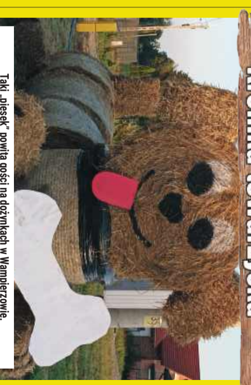
Taki „piesek” powita gości na dożynkach w Wampierzowie.