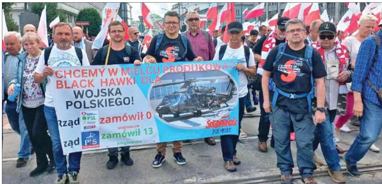
Karol Nawrocki zaprzysiężony na Prezydenta RP. Mielecka Solidarność wśród uczestników uroczystości.

— Trwa manifestacja poparcia dla Prezydenta Rzeczypospolitej Polskiej Karola Nawrockiego! Jesteśmy tu razem, zjednoczeni i pełni energii — napisali na swoim profilu przedstawiciele Solidarności PZL Mielec. — Obecna Solidarność PZL Mielec – zawsze wierni Polsce i solidarności-