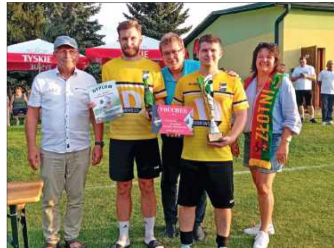
Nagrodzeni też zostali najlepsi zawodnicy turnieju.