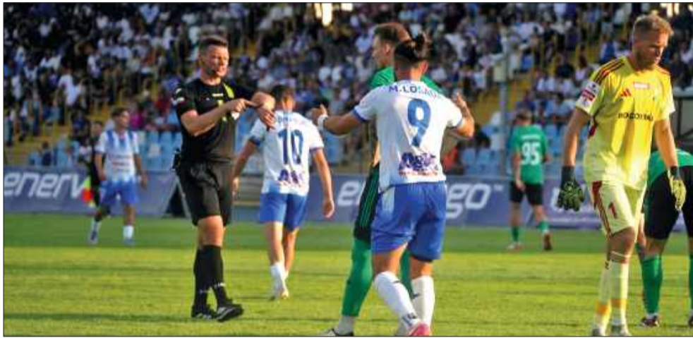
Pierwszy punkt zdobyty na własnym stadionie przez FKS Stal Mielec