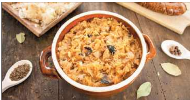
Domowa kiszona kapusta to bogate źródło witaminy C.

Mięso kroję w kostkę. Cebulę również kroję w kosteczkę i podsmażam na oleju w dużym garnku.