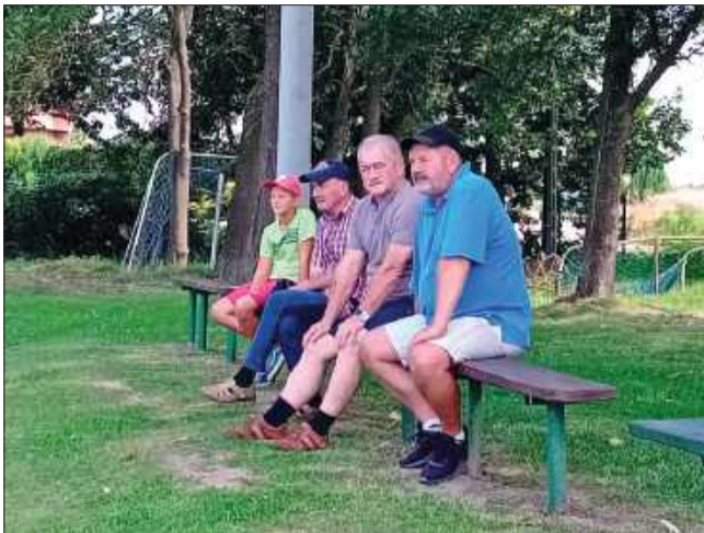
Sympatyków piłki nożnej w naszym powiecie nie brakuje.