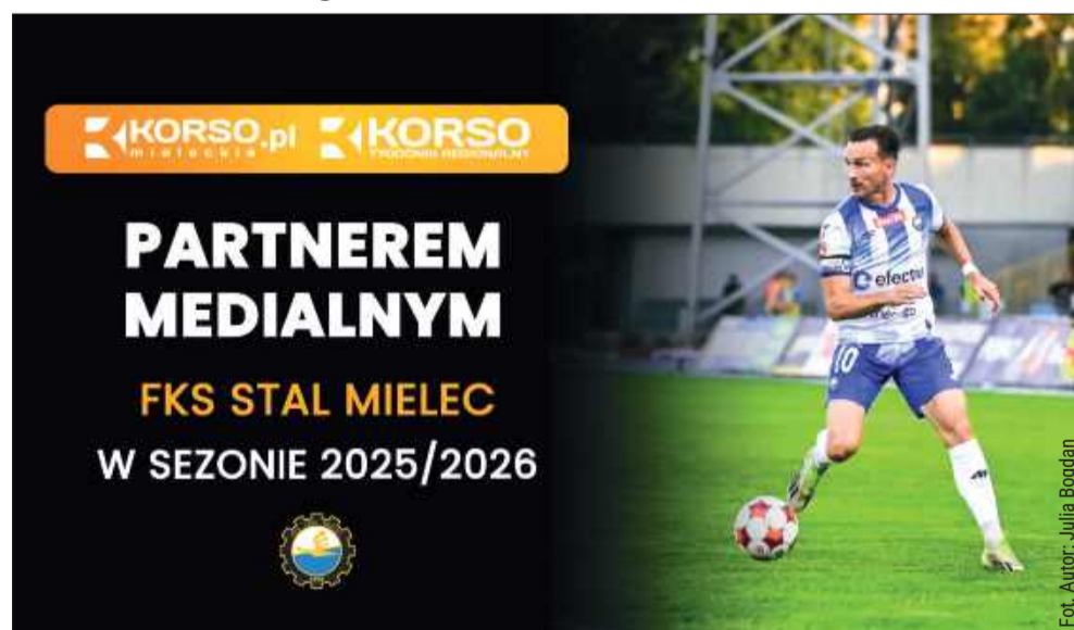
Będziemy wspierać naszą drużynę w sezonie 2025/26

Z przyjemnością informujemy, że portal Korso.pl oraz tygodnik regionalny Korso są partnerem medialnym FKS Stali Mielec w sezonie 2025/2026, w którym mielecka drużyna rywalizuje w rozgrywkach 1. ligi Betclis.