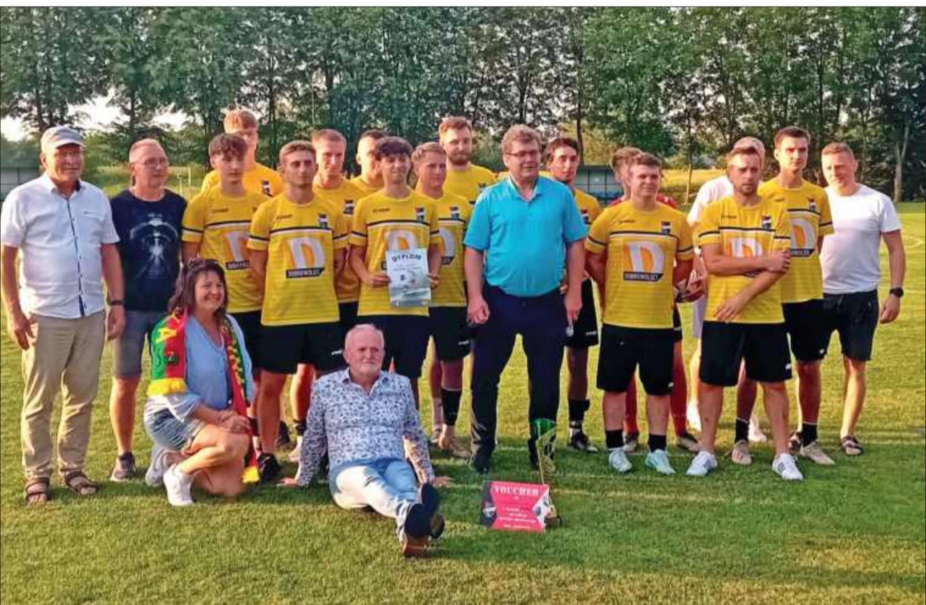
Zwycięska drużyna Piasta.