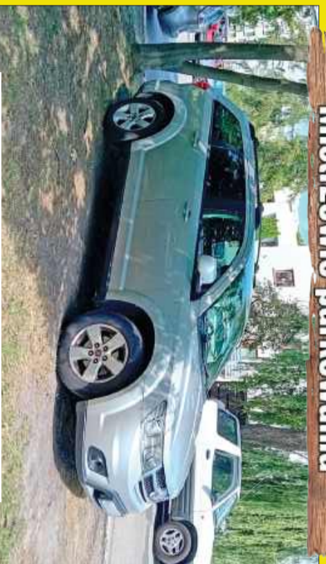
Na wyschniętej trawce.