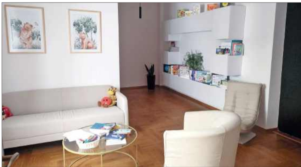
Nowa przestrzeń dla dzieci i młodzieży gotowa na przyjęcie pierwszych pacjentów.