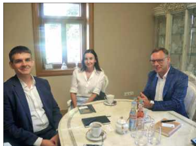
Podjęte wstępne ustalenia otwierają drogę do rozwoju lokalnych usług medycznych.