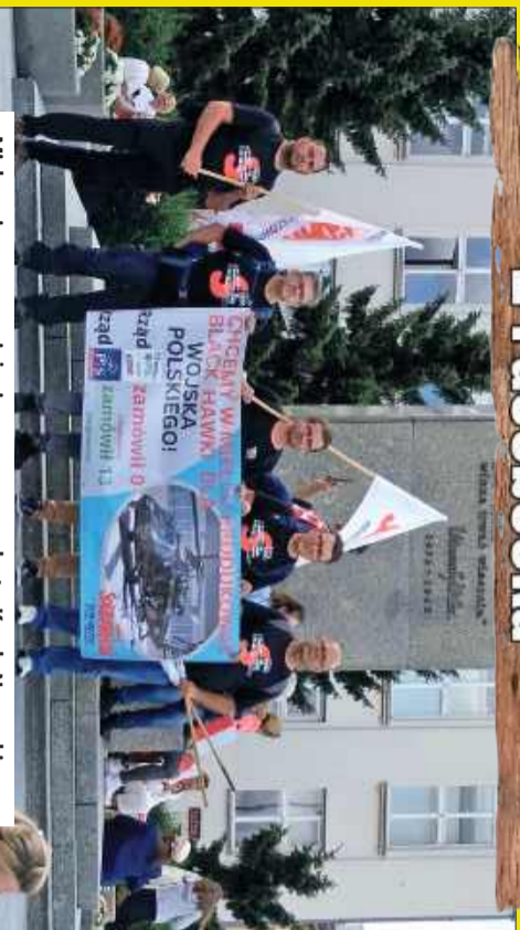
Miejscanie na zaprzysiężeniu nowego prezidenta, Karola Nawrockiego.