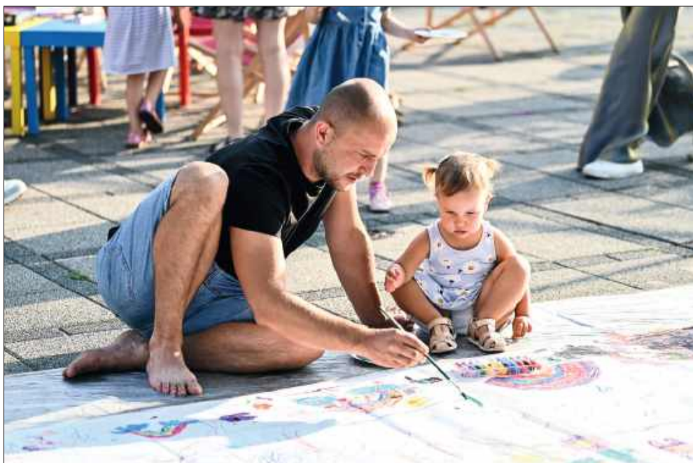
W malowaniu wzięli udział nawet rodzice