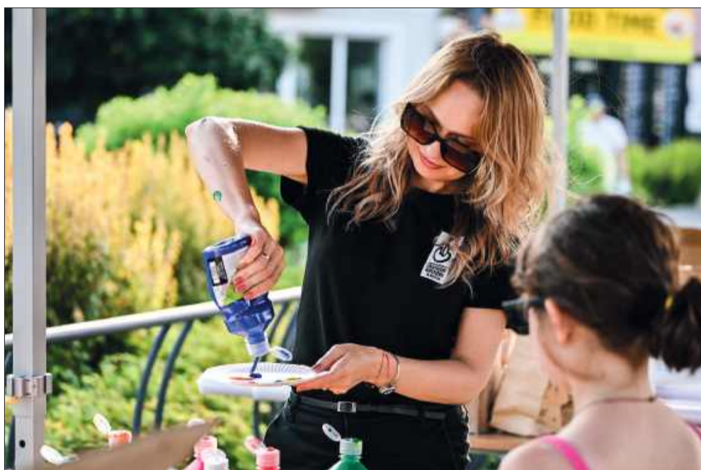
W powietrzu unosił się zapach kolorowych farb