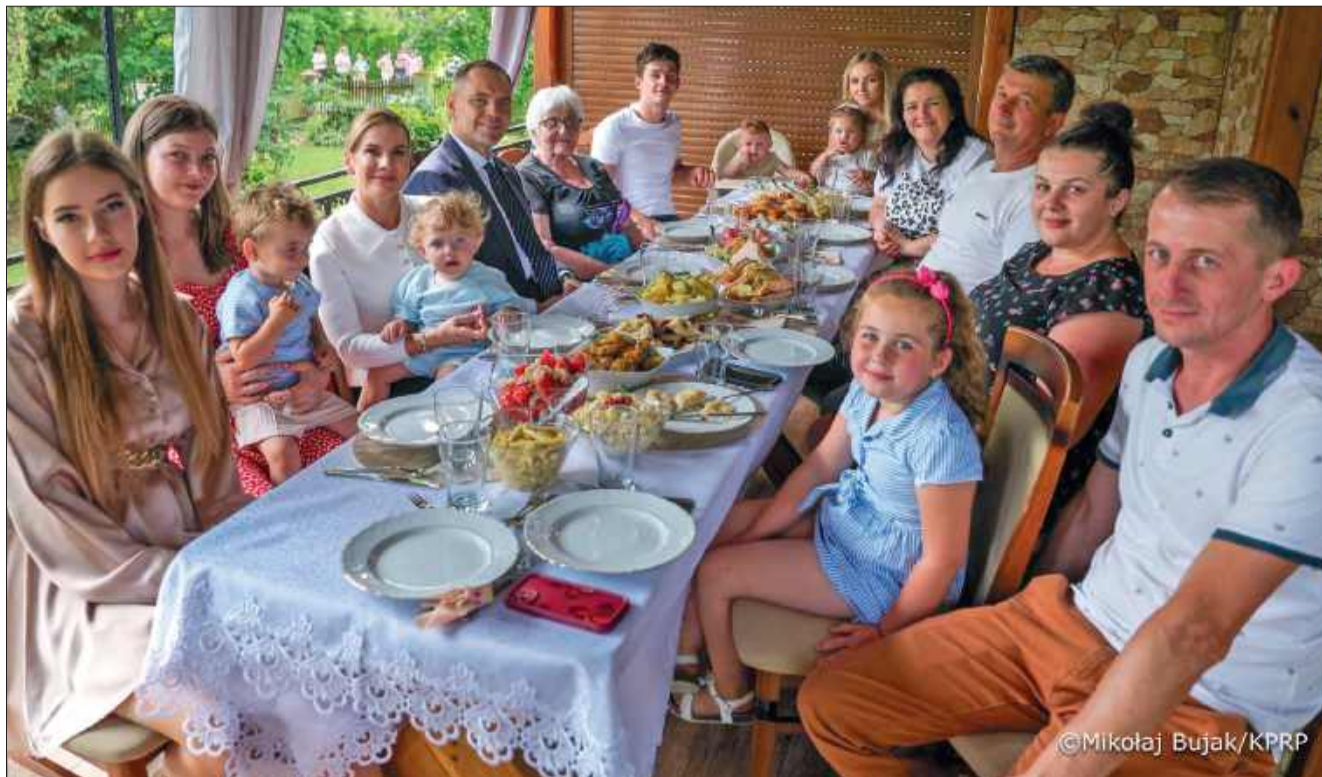
Parę prezydencką ugościła obiadem czteropokoleniowa rodzina z Cmolasu.