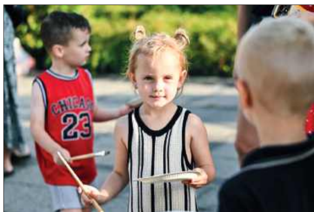
Rynek zamienił się w pracownię