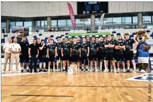
Drużyna z Mielca wygrywa XIII Memoriał