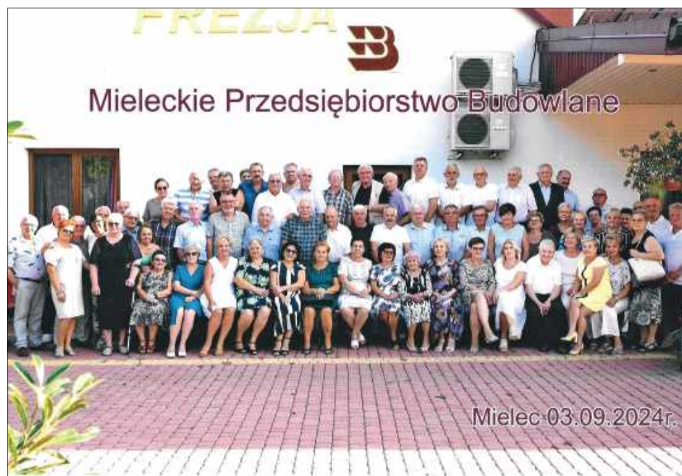
Na poprzednich spotkaniach bawiło się kilkadziesiąt osób!