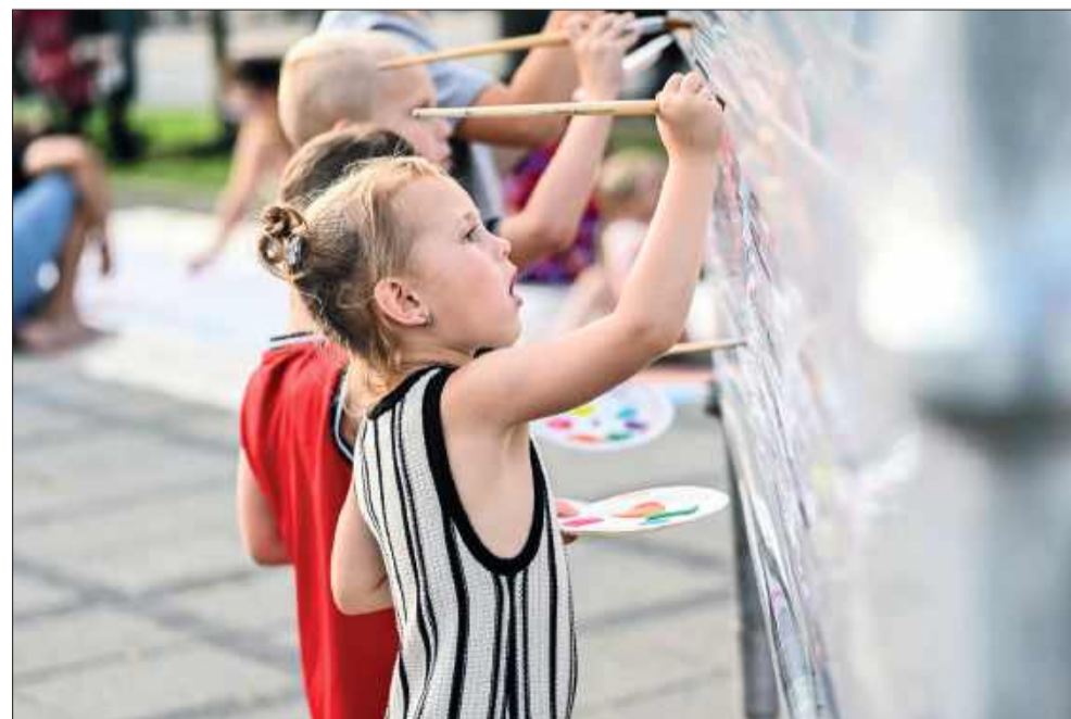
Najmłodszy z zapałem tworzyli swoje prace