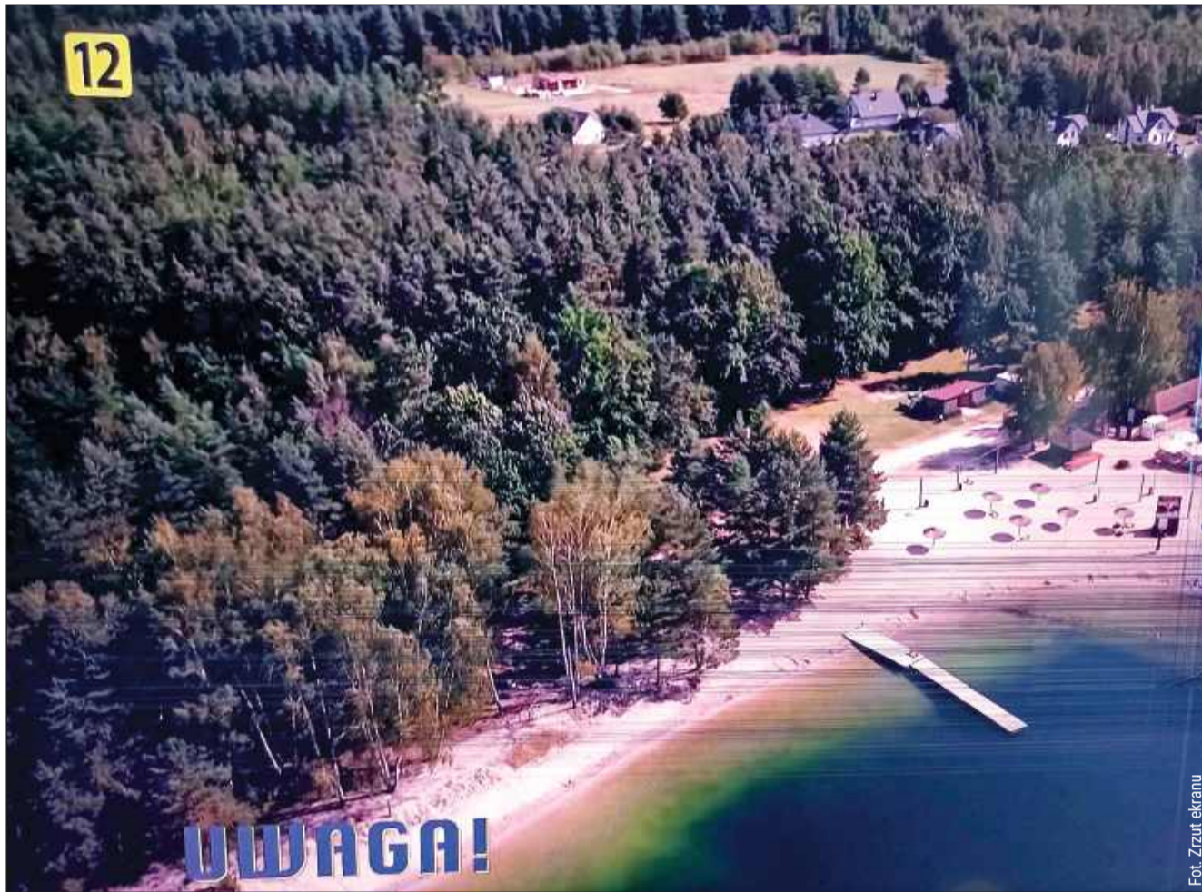
„Uwaga!” TVN to jeden z najważniejszych programów interwencyjnych w Polsce.

Jeden z mieszkańców wspominał, że poziom hałasu w jego domu przekraczał 70–80 decybeli, a u sąsiadów dochodził nawet do 100 decybeli, podczas gdy zgodnie z przepisami po godzinie 22:00 dopuszczalna wartość to 40 decybeli. Co więcej, jak przypomniano, zgodnie z art. 156 ustawy Prawo ochrony środowiska, na terenach wypoczynkowych obowiązuje zakaz używania urządzeń nagłaśniających. W przypadku Mielca przepis ten zdaje się być regularnie łamany.