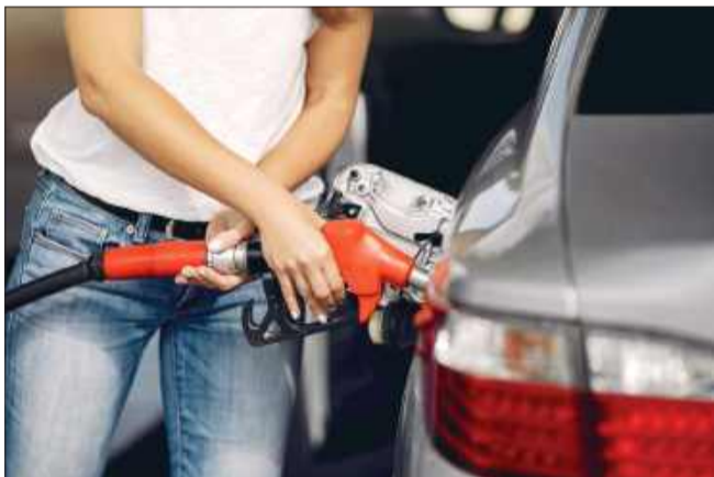
Ceny stabilne, ale różnice sięgają kilkudziesięciu groszy na litrze.

W sierpniu ceny benzyny, oleju napędowego i autogazu powinny pozostać na poziomach z lipca. Wyższe będą zawsze na stacjach premium, tych, które oferują bogatszą ofertę dodatkową, promocje dla uczestników programu lojalnościowego, oraz w regionach, w których tradycyjnie paliwa są droższe.