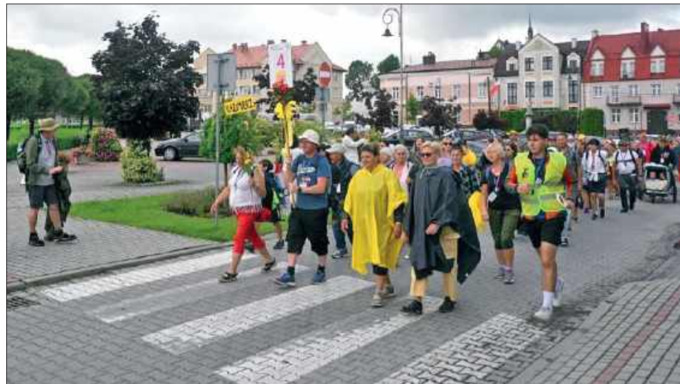
Kilkuset pielgrzymów ruszyło w drogę na Jasną Górę.

Radomyśl Wielki po raz kolejny gościł uczestników Pieszej Pielgrzymki Rzeszowskiej na Jasną Górę. Dziś rano, mimo kapryśnej pogody, pielgrzymi wyruszyli, by wspólnie przeżywać kolejne etapy drogi. Po porannym, intensywnym deszczu, pojawiło się w końcu słońce, które towarzyszyło pielgrzymom w dalszym marszu.