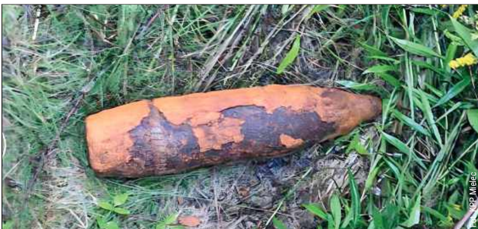
Pocisk pochodził najprawdopodobniej z czasów II wojny światowej

Niebezpieczne znalezisko odkryto rano 6 sierpnia na jednej z działek przy ulicy Podlesie w Radomyślu Wielkim. Podczas prac ziemnych prowadzonych w związku z budową domu jednorodzinnego, właściciel posesji natknął się na pocisk, który – jak się później okazało – pochodzi najprawdopodobniej z czasów II wojny światowej.