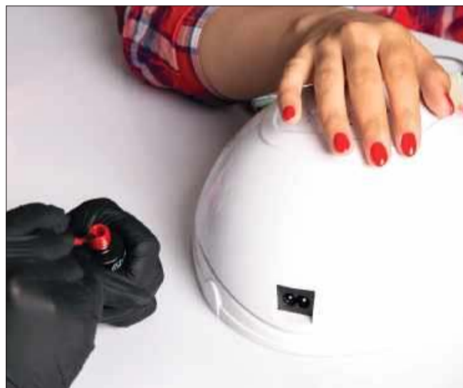
Popularne lakiery do paznokci znikną z salonów.

Decyzja Sanepidu to bezpośrednia konsekwencja zmian w unijnym rozporządzeniu dotyczącym kosmetyków. TPO zostało zaklasyfikowane jako substancja szkodliwa dla rozrod-