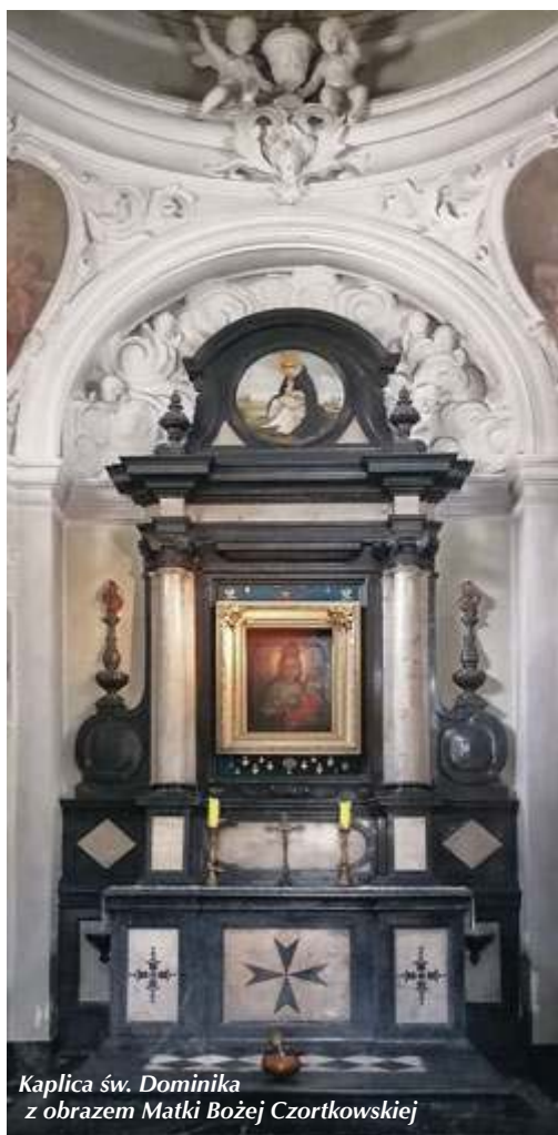
Kaplica św. Dominika z obrazem Matki Bożej Czortkowskiej

skiego przez kamieniarzy z Dębnicy. Ufundował go jej mąż Jan Zbigniew Ossoliński. Budzący zainteresowanie zwiedzających nagrobek częściowo przetrwał zawieruchy dziejowe.