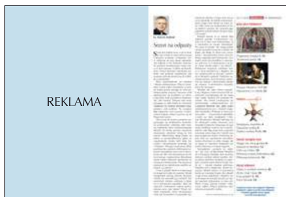
II okładka 205 x 285 + 5 mm na spady