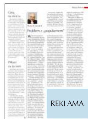
moduł reklamowy 95 x 67 mm