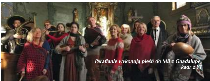
Parafianie wykonują pieśń do MB z Guadalupe, kadr z YT