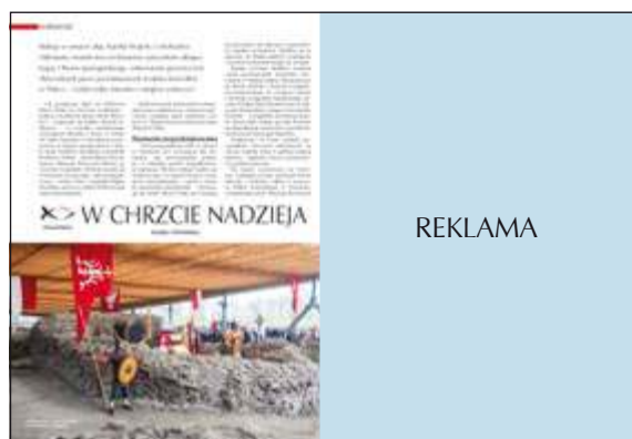
1/1 strona wewnątrz pisma 205 x 285 + 5 mm na spady