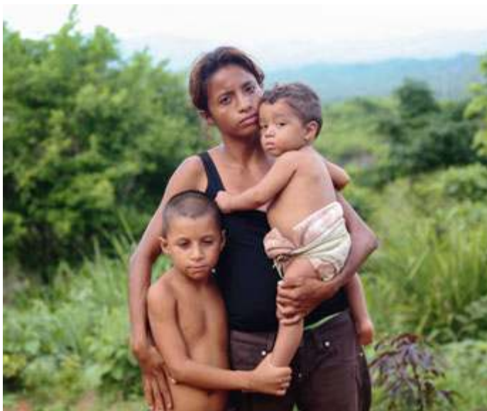
fol. Caritas Kolumbia

Wenezuela od 2014 r. znajduje się w kryzysie. Ponad 8 mln Wenezuelczyków opuściło ojczyznę w nadziei na lepsze życie. Wielu trafiło do Kolumbii, która zмага się z poważnymi problemami. Caritas Polska wspiera długofalowo najbardziej potrzebujących Kolumbijczyków i Wenezuelczyków.