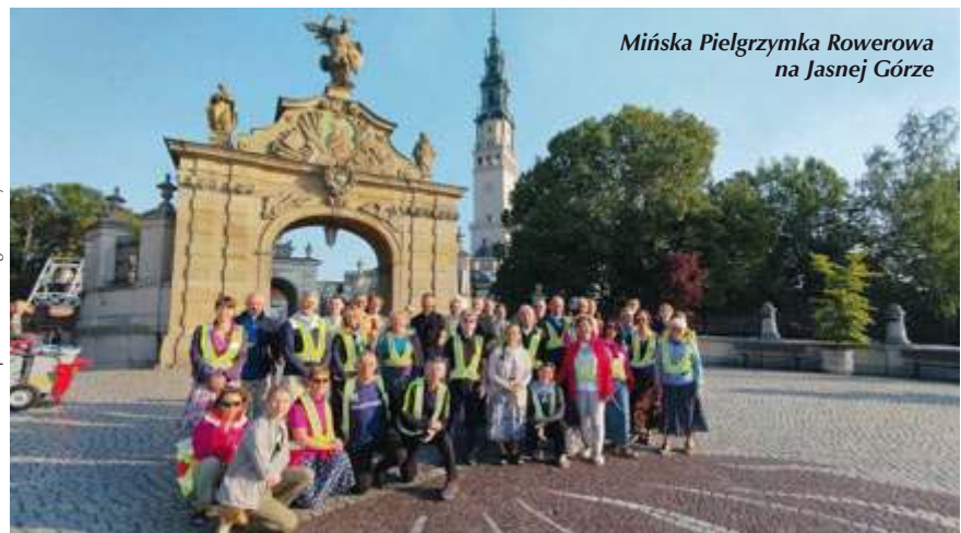
Mińska Pielgrzymka Rowerowa na Jasnej Górze