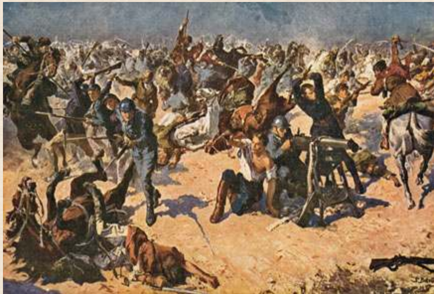
Bój pod Zadwórzem, obraz Stanisława Kaczora-Batowskiego z 1929 r.

W decydującym momencie wojny z bolszewikami na front przeciw Polsce broniącej swej niepodległości i całej cywilizacji łacińskiej rzucona została 1 Armia Konna dowodzona przez byłego wachmistrza armii carskiej Siemiona Budionnego. Był to dwudziestotysięczny związek manewrowy dysponujący nie tylko kawalerią, ale także pociągami pancernymi, eskadrami lotniczymi i wsparciem artyleryjskim. Konarmia w sposobie wojowania porównywana była do dzikich hord Czngis-chana. „Z niedowierzaniem przyglądałem się metodzie użycia jazdy na sposób Nomadów – wspominał Marszałek Józef Piłsudski – sposób przypominający mocno starodawne czasy, tak znane naszym praojcom czasy najazdów tatarskich”. Konarmia stosowała taktykę spalonej ziemi, działała błyskawicznie jak szarańcza, żyła z tego, co zagrabiła. Krasnoarmiejcy Budionnego nie brali jeńców. Ci zaś, którzy mieli nieszczęście dostać się w ich ręce, byli okrutnie mordowani, a kobiety gwałcone. Generał Maxime Weygand, szef francuskiej misji wysłanej do Polski, aby doradzać, jak pokonać bolszewików, opisywał Konarmię jako „wcielenie hord tatarskich”, która „pali szpitale, dobija rannych, a towarzyszy jej trybunał rewolucyjny składający się z komunistów, którzy osiadając w miastach, aresztują podejrzanych, sądzą ich i tracą. Tak np. w Równem w sierpniu 1920 r. rozstrzelano około 200 osób,