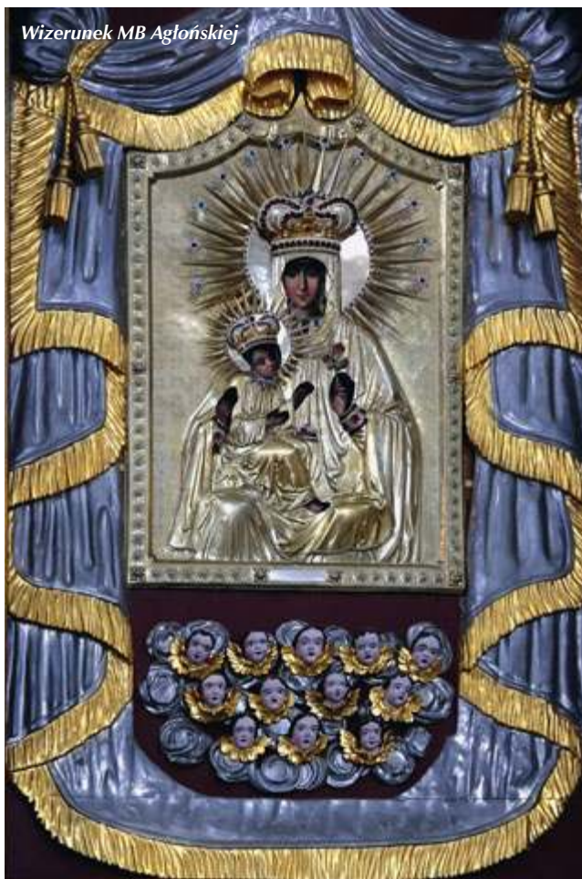
Wizerunek MB Agłońskiej

Wizerunek Maryi umieszczony jest w dwupoziomowym ołtarzu głównym, określanym jako typ loretański. Konstrukcja nawiązuje do domku loretańskiego – mieszkania Matki Bożej. Za ołtarzem głównym, z poziomu parteru kościoła, schody prowadzą na górną kondygnację, gdzie znajduje się również ołtarz do celebracji liturgii. Nad