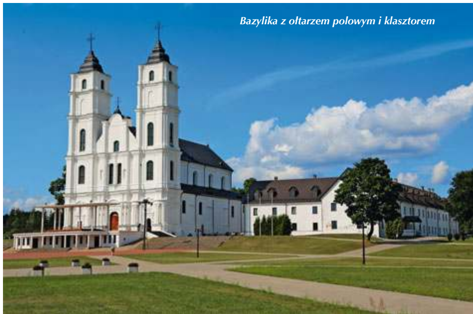
Bazylika z ołtarzem polowym i klasztorem

Okazała bazylika Wniebowzięcia NMP znajduje się w niewielkiej, liczącej niespełna tysiąc mieszkańców miejscowości, w południowo-wschodniej części Łotwy. W stylu włoskiego