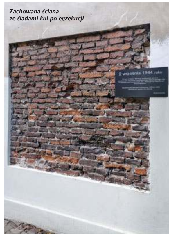
Zachowana ściana ze śladami kul po egzekucji

ZWIEDZANIE: kościół św. Jacka przy ul. Freta 10, pon.–sob. 7.00–19.00, niedz. 8.00–22.00, (poza nabożeństwami).