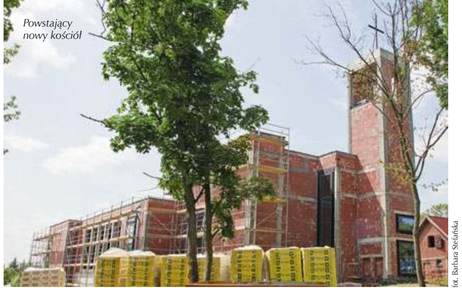
Powstający nowy kościół

Przywieźli obraz prosto z Ameryki Południowej. Teraz nieopodal Poznania powstaje kościół Matki Bożej z Guadalupe. Niewielka, a prężna parafia ma własne czasopismo i grupę katechistów.