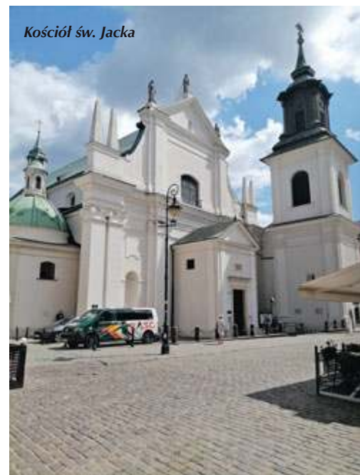
Kościół św. Jacka