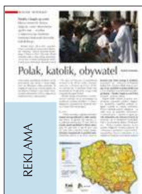
moduł reklamowy 75 x 140 mm