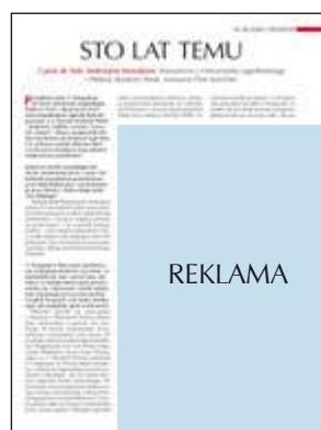
Junior page 135 x 190 mm + 5 mm na spady