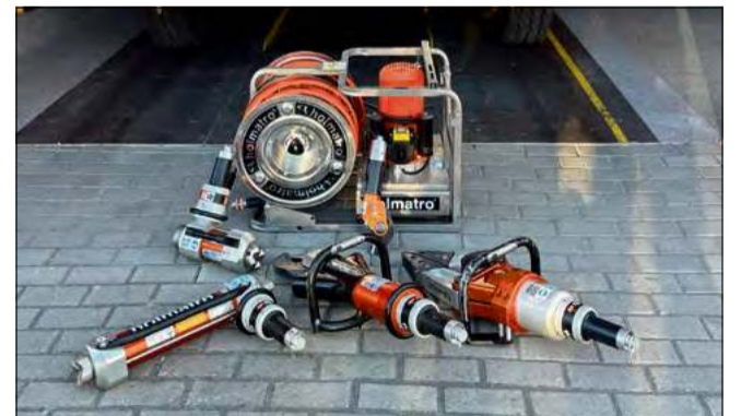
Zestaw znajduje się w gotowości operacyjnej na wyposażeniu jednostki OSP.

Święta Wielkanocne w jednostce OSP Przywory przyniosły nie tylko tradycyjną wizytę zajączka, ale także profesjonalny zestaw narzędzi hydraulicznych, który trafił na wyposażenie strażaków.