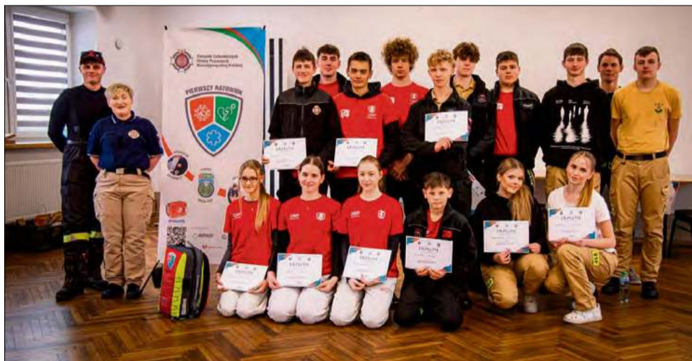
To była cenna lekcja dla młodych.