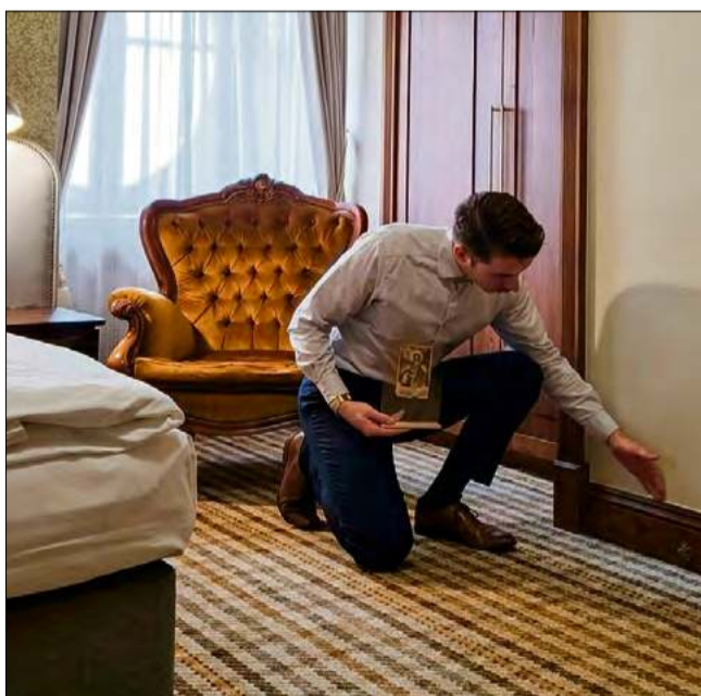
Pokój 330. Za taką listwą ukryta była pocztówka. Jest to przybliżona lokalizacja znaleziska.

- Ciekawostką, czy też osobliwością tej pocztówki jest to, że grafika wzbogacona jest o srebrzoną ramkę i inne dodatkowe małe detale sre-