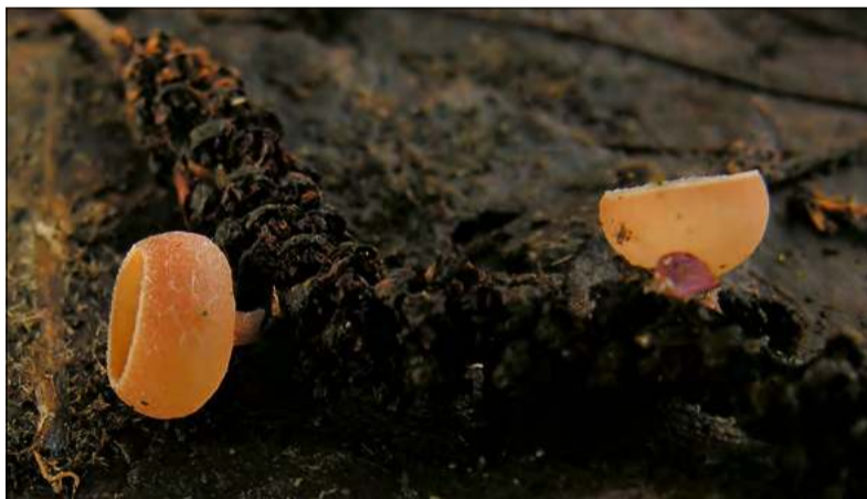
Kubianka kotkowa ( Ciboria amentacea ) – w mikroskali grzybów wygląda niezwykle dekoracyjnie i delikatnie.

rejonach górskich, pojawia się rzadki zwiastun sezonu – wodnicza marcowa ( Hygrophorus marzuolus ). Jak wskazuje nazwa, owocnikuje już od marca. Rośnie głównie w lasach iglastych, szczególnie jodłowych, często na nasłonecznionych stokach. Ze względu na nietypową porę