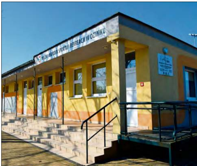
Gmina Ozimek pozyskała środki na modernizację budynku szatniowo-socjalnego w Ozimku.

Całkowita wartość inwestycji wynosi 406 202 zł, z czego 203 100 zł stanowi dofinansowanie. Pozostała część, w wysokości 203 102 zł, zostanie pokryta z budżetu gminy Ozimek.