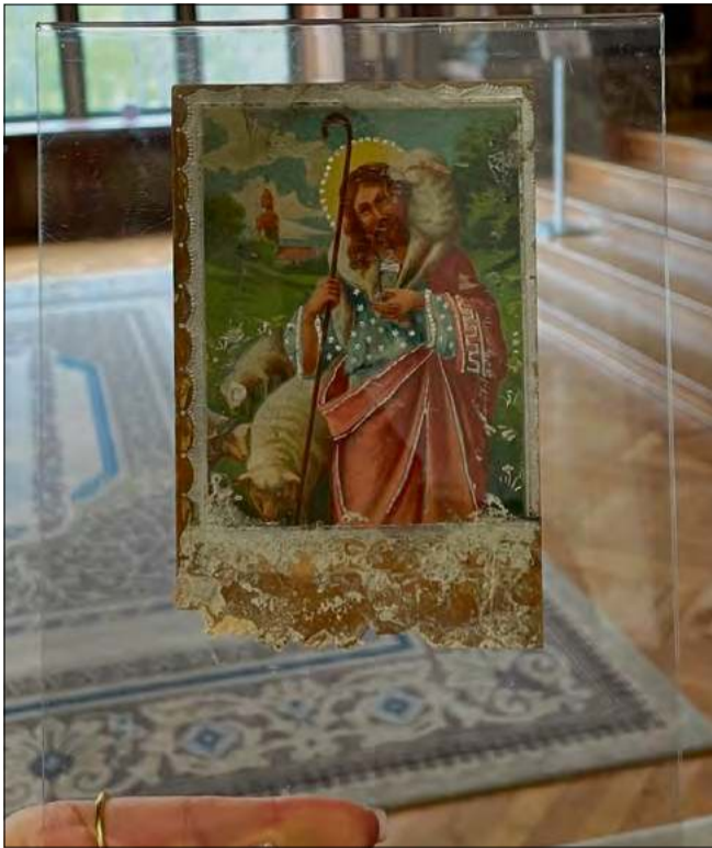
Barwna grafika przedstawia Jezusa Chrystusa z barankiem na plecach. Jest to obraz mający dla nas chrześcijan wielkie znaczenie symboliczne.

W pałacu w Mosznej znaleziono kapsułę czasu. Schowana za listwą przypodłogową pocztówka z życzeniami wielkanocnymi przetrwała tam ponad sto lat. Dziś wiemy, że pochodzi z 1919 roku i jest związana z rodem Tiele-Wincklerów. Jednak nadawca wciąż pozostaje zagadką.