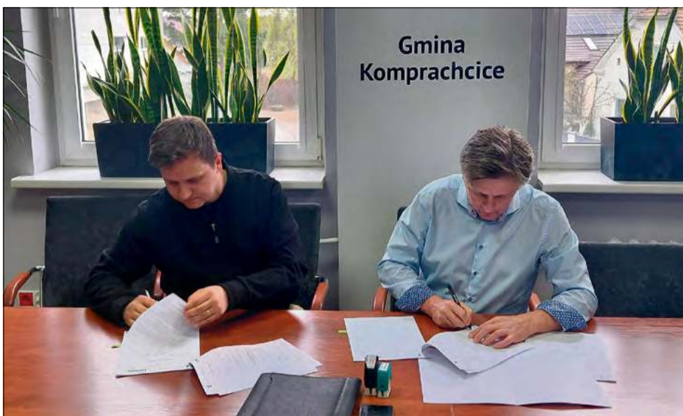
Na modernizację budynku szkoły podstawowej w Komprachcicach pozyskano dofinansowanie z programu rewitalizacji.

Zmiany obejmą także otoczenie placówki. Przebudowane zostanie boisko asfaltowe, część terenu zostanie przeznaczona na mini boisko do koszykówki, a reszta zamieni się w zieloną przestrzeń rekreacyjną. Budynek