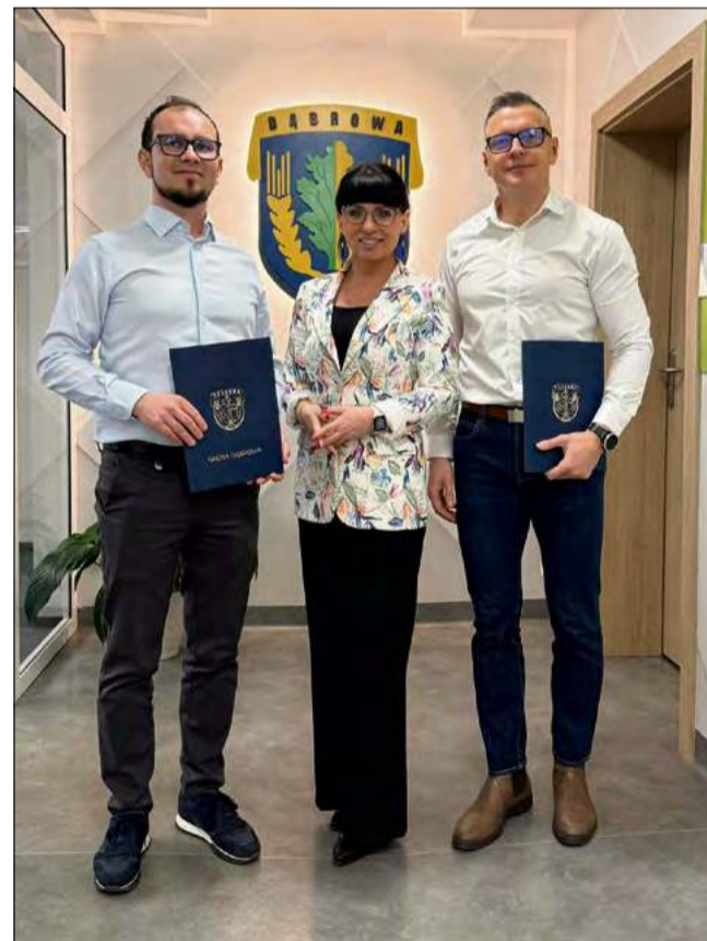
Łączna wartość zadań zaplanowanych do wykonania w szkole podstawowej w Dąbrowie przekracza 5,2 mln zł.

W ójt gminy Dąbrowa podpisała umowy na realizację kluczowych inwestycji, obejmujących zarówno modernizację infrastruktury oświatowej, jak i społecznej.