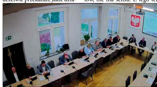
Temat poruszono podczas ostatniej sesji Rady Gminy Chrząstowice.

Wójt zwrócił uwagę, że samo zakładanie spółdzielni energetycznej, gdy ona nie przynosi konkretnych efektów, nie ma sensu. Z tego też