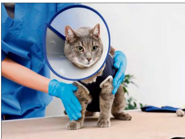
Program zakłada m.in. sterylizację, całodobową pomoc weterynaryjną, odławianie i adopcję.

Zgłoszenia o zwierzętach bezdomnych lub poszkodowanych w wypadkach przy-