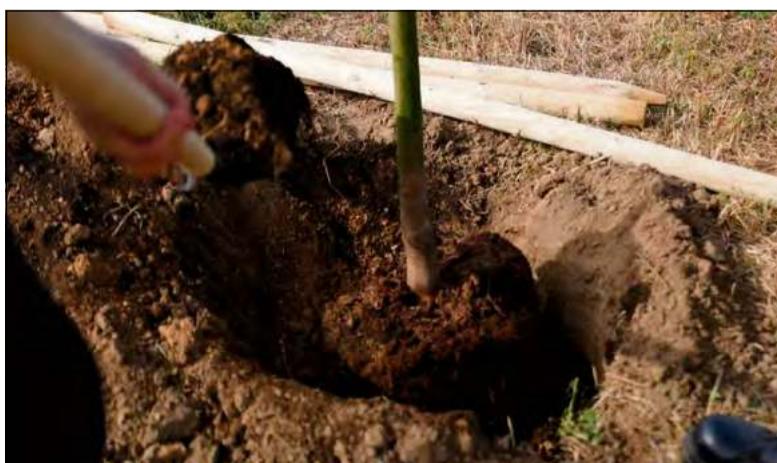
Nasadzenia realizowane są w kilkunastu lokalizacjach w różnych częściach miasta Opole.

– Są to pasy drogowe oraz ronda – dodaje Mariusz Chałupnik. – Nowe rośliny pojawiają się