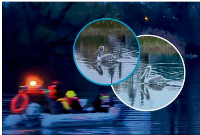
Pelikan – recydywista już po raz trzeci uciekł z opolskiego ogrodu zoologicznego.

Jak poinformowało opolskie zoo, niepokój wśród opiekunów pojawił się podczas wieczornego karmienia. Szybko okazało się, że brakuje jednego ze stałych mieszkańców – pelikana, który już wcześniej udowodnił, że potrafi skutecznie opuszczać teren ogrodu. Pracownicy przez wiele godzin przeszukiwali