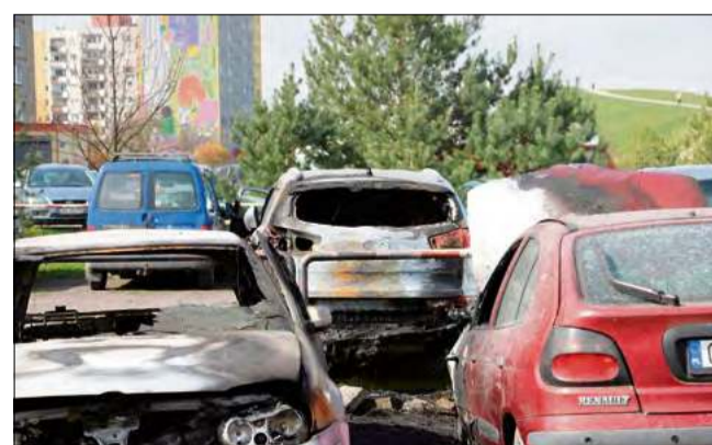
Sprawa będzie szczegółowo wyjaśniana przez policję.

W działaniach gaśniczych brały udział dwa zastępy straży pożarnej z JRG 1 Opole oraz patrol policji. Funkcjonariusze pracujący na miejscu ustalają obecnie właścicie-