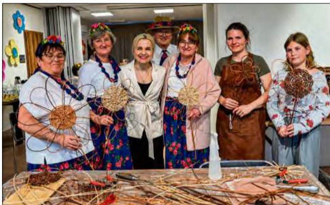
Podczas spotkania odbyły się warsztaty wikliniarskie.