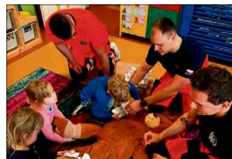
Warsztaty były doskonałą okazją do oswajania najmłodszych z tematyką pierwszej pomocy i kształtowania właściwych postaw w sytuacjach zagrożenia.

Podczas zajęć przedszkolaki uczyły się sztucznego oddychania, ćwiczyły bandażowanie oraz poznawały obsługę defibrylatora. Sprawdzały również, jak ciepłe są koce termiczne. Dzieci mogły zajrzeć do środka karetki i zobaczyć, jak czuje się osoba w niej przewożona. Poznały także numer alarmowy 112 i dowiedziały się, kiedy i jak z niego korzystać.