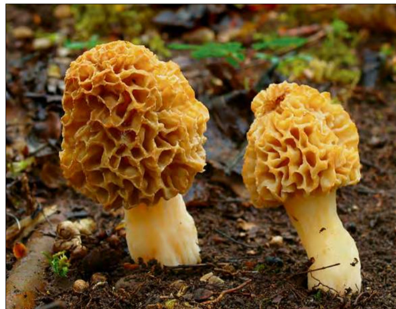
Smardz jadalny ( Morchella esculenta ) – łatwo pomylić go z toksyczną piestrzenicą kasztanowatą.

Najbardziej poszukiwanymi grzybami wiosennymi są smardze, pojawiające się od drugiej połowy marca aż do maja, najczęściej na żyznych siedliskach,