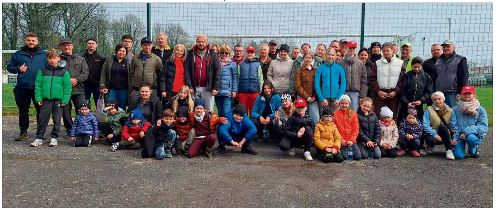
Mieszkańcy Krasiejowa spotkali się na akcji sprzątania wsi.