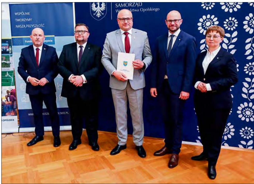
Wśród uczestników spotkania w Izbicku znaleźli się przedstawiciele gminy Tarnów Opolski.

Gminny Ośrodek Kultury w Tarnowie Opolskim przejdzie kompleksową modernizację. Zakres prac obejmie przebudowę wnętrza, instalacji elektrycznej, sieci wodno-kanalizacyjnej oraz systemu ogrzewania. Kluczowym elementem będzie modernizacja sali teatralno-kinowej wraz z wymianą wyposażenia. Teren wokół budynku zyska zagospodarowanie zielenią, w tym ogród deszczowy i ścianę zieloną.