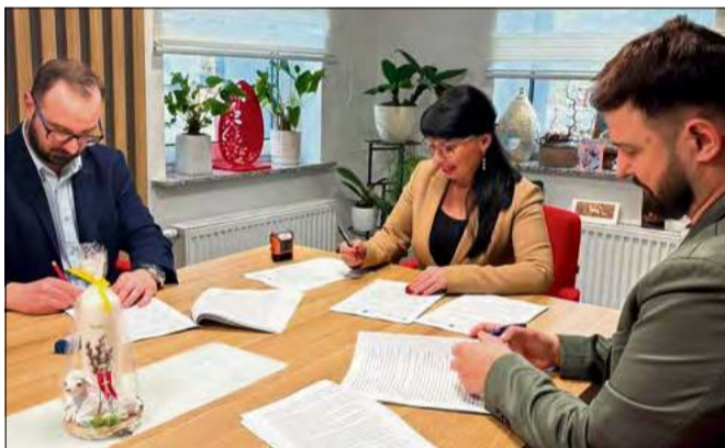
Podpisanie umowy na termomodernizację budynku Ośrodka Pomocy Społecznej w Dąbrowie, który od lat czekał na remont.