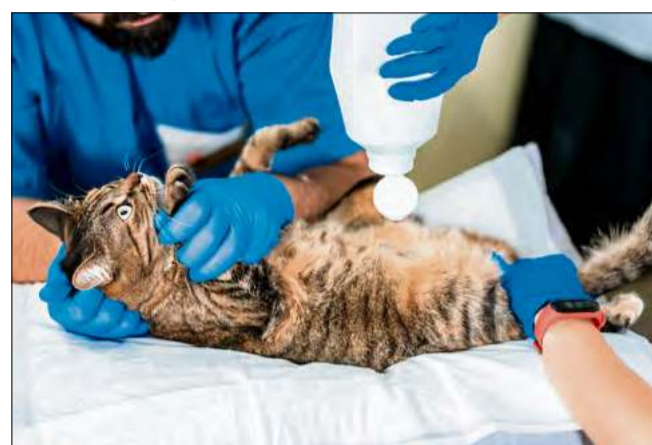
Zgodnie z regulaminem akcji, wnioskodawcy mogą uzyskać 70 procent dofinansowania do zabiegu dla maksymalnie jednego zwierzęcia.

Zabiegi wykonuje Przychodnia Weterynaryjna Jan Piskoń przy ulicy Marka Prawego 32c w Strzelcach Opolskich. Akcja potrwa do