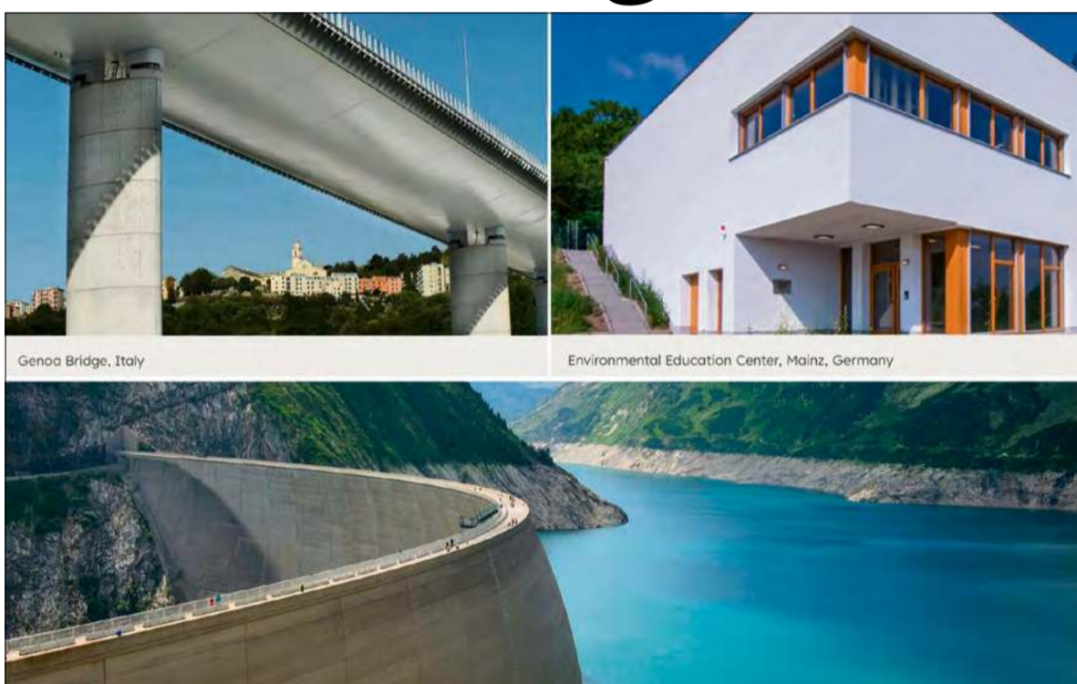
Przykłady projektów evoBuild.