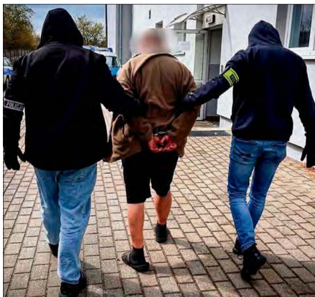
Teraz mieszkańcy Opola za sprowadzenie pożaru zagrażającego mieniu w wielkich rozmiarach grozi kara nawet do 10 lat więzienia.

Po ugaszeniu pożaru przez strażaków funkcjonariusze pionu kryminalnego natychmiast rozpoczęli intensywne czynności. Dzięki sprawniej pracy operacyjnej oraz zebranym i zabezpieczonym dowodom, personalia podejrz-