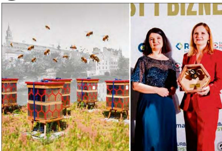
Opole z nagrodą za niestandardową edukację ekologiczną.

Ul funkcjonuje jak ekosystem w miniaturze: nic się nie marnuje, surowce są wykorzystywane wielokrotnie, a decyzje – jak