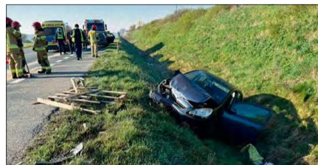
Służby zabezpieczyły teren oraz udzieliły pomocy poszkodowanym.

Na miejscu okazało się, że doszło do zderzenia dwóch samochodów osobowych. W efekcie jeden z pojazdów zakończył swoją jazdę w przydrożnym rowie. Łącznie autami podróżowały trzy osoby, w tym dziecko. Najmłodszy uczestnik zdarzenia znajdował