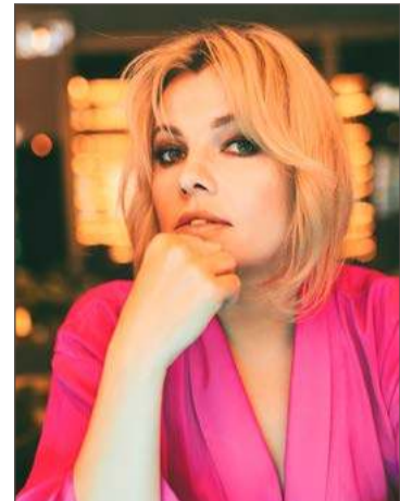
Popularna wokalistka przyjedzie do Dębicy.

Wokalistka, znana m.in. z hitu: Z Tobą nie umiem wygrać , będzie gwiazdą Dni Dębicy.