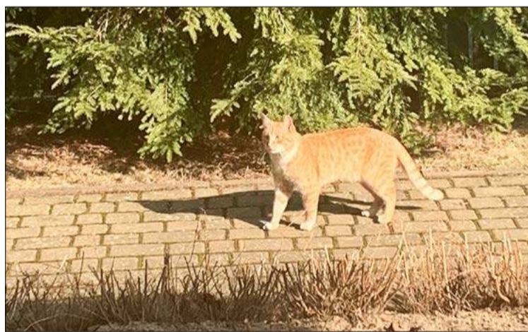
Będę wygrzewał się na słończku.