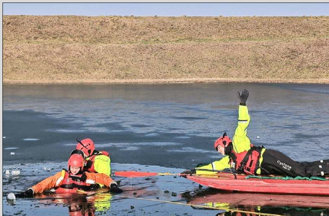
Strażacy przestrzegają, by nie wchodzić na zamrożone zbiorniki wodne. A sami szkolą się na wypadek konieczności przeprowadzenia akcji ratunkowej na lodzie. Takie ćwiczenia odbyły się w ubiegłym tygodniu na zamrożonym zbiorniku przy Al. Jana Pawła II w Dębicy. Organizatorem była Komenda Powiatowa Państwowej Straży Pożarnej, a udział wzięły jednostki z Dębicy, OSP Brzostek, OSP Pilzno, OSP Czarna i OSP Brzeźnica.