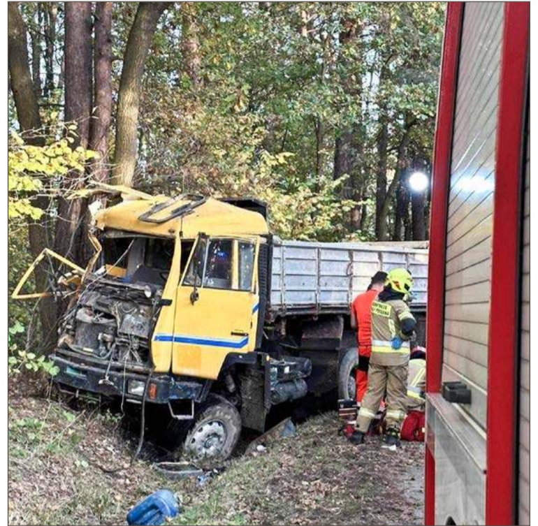
Ciężarówka, którą prowadził, uderzyła w drzewo. OSP Łęki Dolne.

Jest wyrok w tej sprawie. Sąd Rejonowy w Dębicy uznał winę Mateusza K. i skazał go na 8 lat więzienia, dożywotni zakaz prowadzenia pojazdów mechanicznych, 7 tys. zł nawiązki na rzecz Funduszu Pomocy Pokrzywdzonym oraz Po-