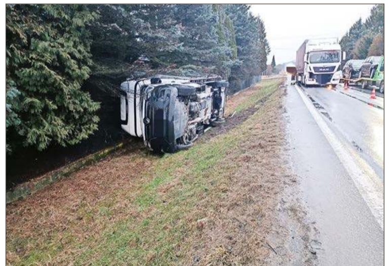
Auto dostawcze przewróciło się na poboczu.