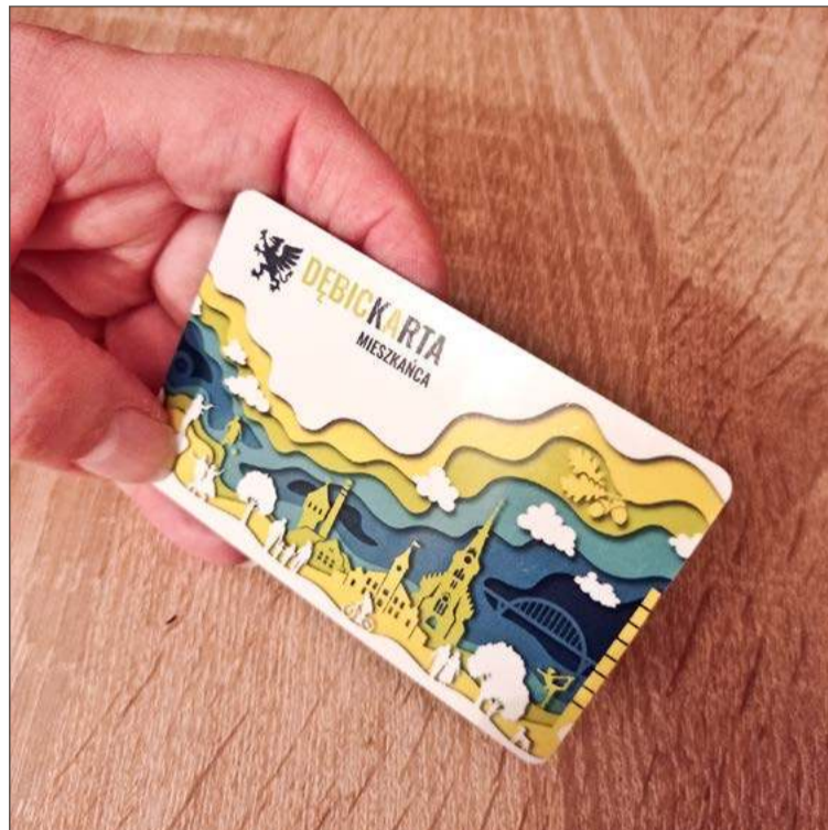
Taką kartę nosi w portfelu już 3401 mieszkańców. 2950 woli aplikację.