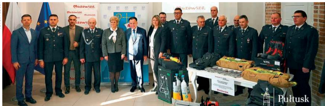
Nowe elementy wyposażenia otrzymało wiele jednostek OSP z powiatu