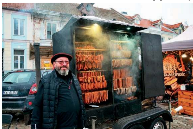
Nie zabrakło stoisk serwujących rozgrzewające potrawy