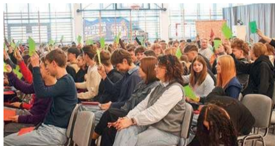
W spotkaniu uczestniczyli uczniowie ponadpodstawowych szkół z terenu powiatu