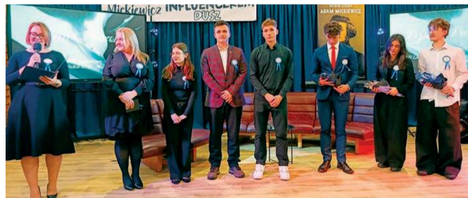
Podczas wydarzenia zaprezentowano nowy samorząd uczniowski

Przemówienie dyrektora spotkało się z bardzo entuzjastycznym przyjęciem, wzbudzając żywiołowe reakcje, śmiech i mnóstwo braw. Aplauz widowni był tym samym wyrazem uznania dla pomysłu i poczucia humoru dyrektora.