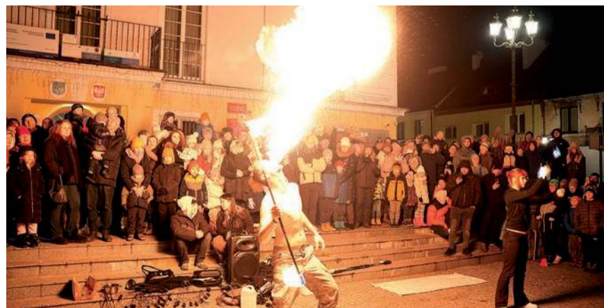
Były warsztaty, animacje i widowiskowe pokazy ognia