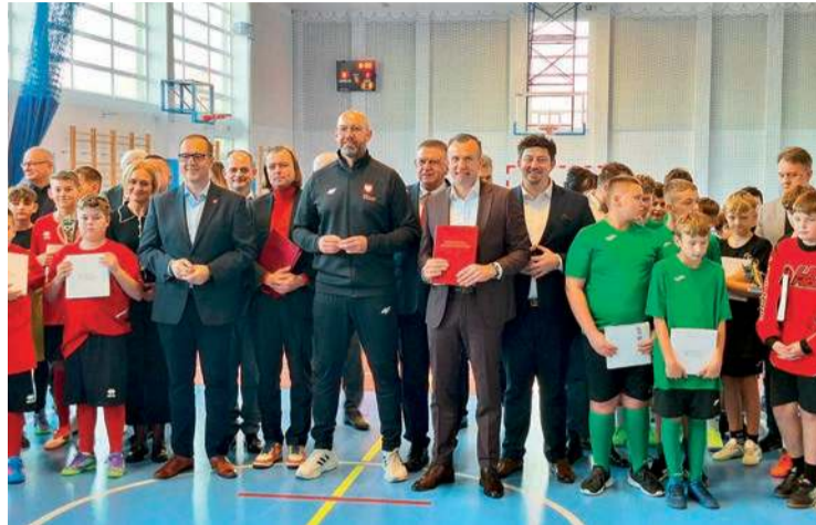
Minister sportu Jakub Rutnicki przekazał samorządowcom decyzje o rządowym dofinansowaniu budowy Orlików

W piątek, 28 listopada w niedawno wybudowanej, nowoczesnej hali sportowej w Stróżewie (gm. Żaluski) gościł minister sportu Jakub Rutnicki. Po krótkiej konferencji prasowej przekazał samorządowcom decyzje dotyczące rządowego dofinansowania budowy obiektów Orlik. W spotkaniu uczestniczyli również m.in.: poseł Adam Krzemiński, wojewoda mazowiecki Mariusz Frankowski, wicemarszałek województwa Wiesław Raboszuk, starosta powiatu płońskiego Artur