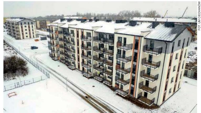
Tak prezentuje się nowy blok TBS w Ciechanowie

Mieszkania mają powierzchnię od 35 do 64 m kwadratowych. Wykończone są pod klucz. Na terenie wokół bloków powstały parkingi. Łącznie znajduje się tam 140 miejsc do parkowania samochodów. erem