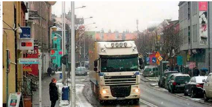
Mława w zimowej szacie

288 mln zł, w tym 71 mln ma pójść inwestycje. Plan zakłada kontynuację dużego, wieloletniego projektu „Zintegrowane przedsięwzięcia strukturalne dostosowujące teren Mławy do warunków pogodowych poprzez retencję i zarządzania wodami opadowymi” (blisko 30 mln zł). W praktyce oznacza to m. in. przebudowę nawierzchni ulic. Kolejne drogowe zadanie (6 mln zł) to modernizacja ulic Antoniego „Torfa” Załęskiego i Nowoleśnej. 600 tys. zł zarezerwowano na opracowanie dokumentacji pod rewitalizację śródmieścia. (kj)