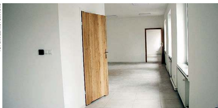
Tutaj wprowadzą się organizacje pozarządowe

Inwestycja była współfinansowana ze środków samorządu województwa mazowieckiego. Powiat otrzymał na ten cel prawie 380 tys. zł, a ze swojego budżetu dorzucił niespełna 100 tys. złotych. W.D.