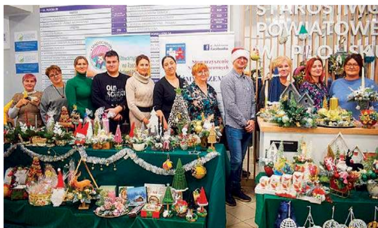
Świąteczny kiermasz w płońskim starostwie stał się już tradycją

odbył się coroczny świąteczny kiermasz. Ręcznie wykonane ozdoby, świąteczne rękodzieło, świece oraz wiele innych wspaniałych produktów prezentowały stowarzyszenia. A były to: Better LIFE Stowarzyszenie na rzecz dzieci i młodzieży SOSW w Jońcu, Stowarzyszenie Spadochron, Centrum Aktywnego Seniora w Płońsku oraz Stowarzyszenie Niepełnosprawnych „Bądźmy Razem” w Płońsku. KO