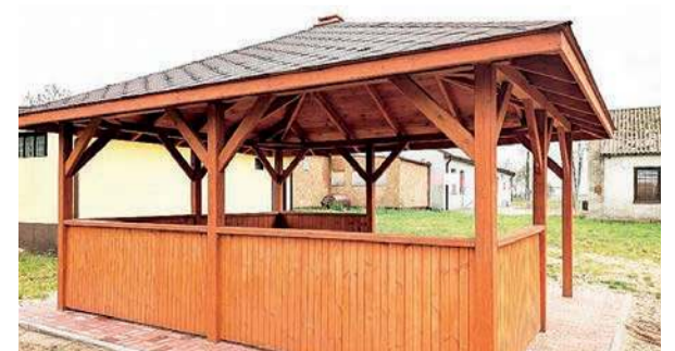
Nowa altana w Dębsku