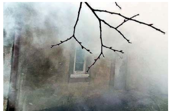
Zdjęcie z pożaru w Błominie Jeże

Gdy pierwszy zastęp przyjechał na miejsce, pożar był już w rozwiniętej fazie, a płomienie wydobywały się na zewnątrz. W środku znaleziono zwęglone ciało, jest to prawdopodobnie 75-letni