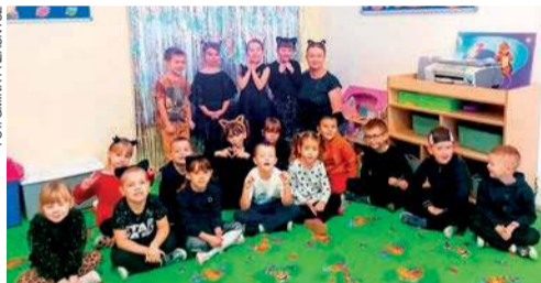
Andrzejki w Bogatem...

Dzieci, ubrane w kocie uszka i wąsy, uczestniczyły w zabawach andrzejkowych przygotowanych w kociej odsłonie. Przedszkolaki brały udział w wesołych wróżbach, zabawach ruchowych, kocich konkursach oraz zajęciach plastycznych.