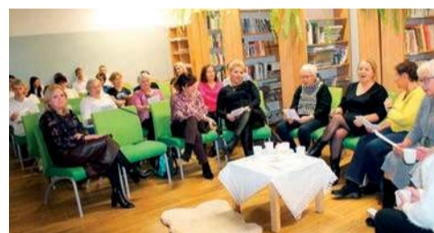
Oba spotkania zgromadziły przedstawicieli kilku pokoleń

taty cyfrowe, podczas których młodzież będzie wspierać seniorów w obsłudze nowych technologii.