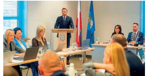
Czwartkowa sesja rady miasta

kaniową 18,2 mln zł. Kulturę i ochronę dziedzictwa narodowego miasto wesprze kwotą 32,6 mln zł, natomiast na sport i kulturę fizyczną trafi 21,7 mln zł. Pięć miejskich spółek – PUK, ZWiK, Elektrociepłownia Ciechanów, TBS oraz