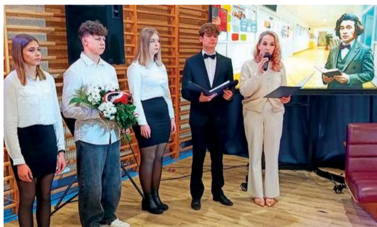
Obok prowadzących o szkole i o sobie opowiedział sam Adam Mickiewicz