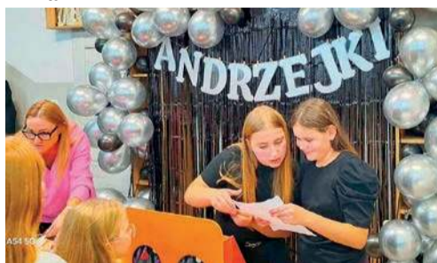
... i SP w Lesznie

nych. Był to dzień pełen śmiechu, magii i kreatywności, który pozwolił dzieciom połączyć tradycję andrzejkową z tematyką ulubionych zwierząt.