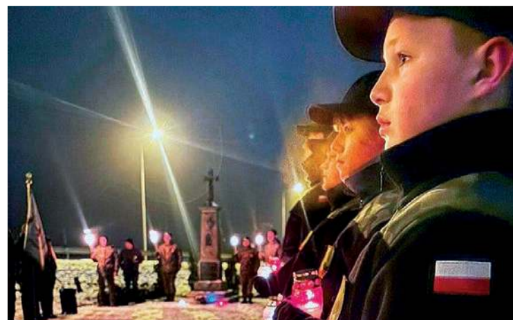
W piątkowy wieczór w Cieciersku upamiętniono 195 rocznicę wybuchu Powstania Listopadowego