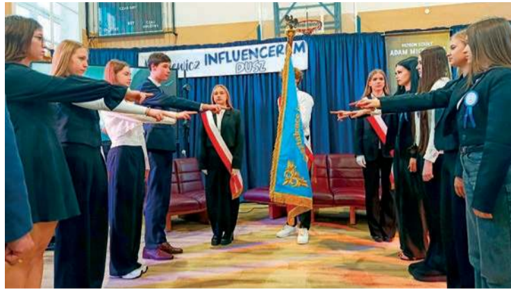
Ślubowanie uczniów klas pierwszych