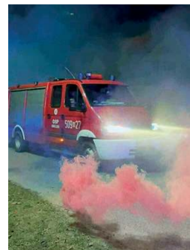
Efektowne przyjęcie nowego samochodu dla OSP