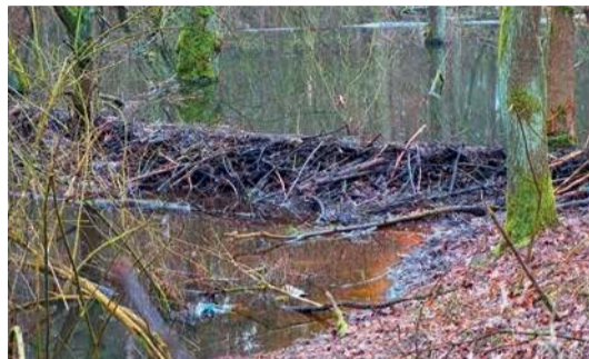
Tama zbudowana przez bobry