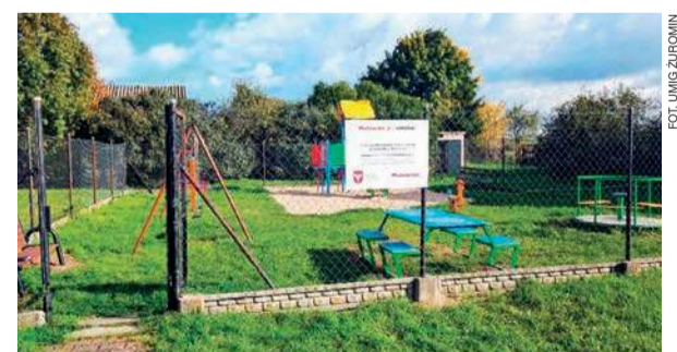
Zmodernizowany plac zabaw w Brudnicach

Koszty modernizacji w Brudnicach wyniosły 19,46 tys. zł, a dofinansowanie ze środków województwa 9,73 tys. zł. W.D.