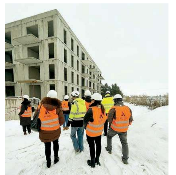
Trwa budowa bloków SIM w Baboszewie. Nadal są wolne lokale, a koszt partycypacji to 1.600 zł za mkw.

Baboszewo, Gliniojeck, miasto oraz gmina Płońsk, Pułtusk, Sierpc, Sońsk i Żaluszki, a do spółki przystąpiła również gmina Dzierżążnia. W Płońsku oddano już do użytku pierwszy blok SIM, gdzie przy ulicy Padlewskiego powstało 40 mieszkań. KO