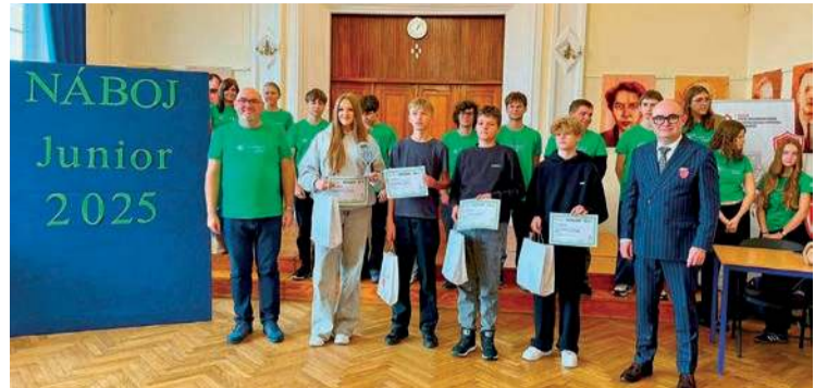
Laureaci Náboj Junior