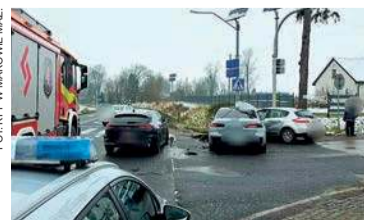
Zdarzenie w Karniewie