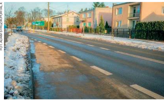
Remont drogi trwał ponad 3 lata

Zakres prac objął wymianę warstwy ścieralnej jezdni, wzmocnienie poboczy i miejscową wymianę konstrukcji drogi – szczególnie w miejscowościach Skierki i Dzbonie. Odnowiono także chodniki, m.in. na odcinku Skierki-Turowo oraz na fragmentach miejskich w Ciechanowie. Zmodernizowano elementy poprawiające bezpieczeństwo, w tym asyzy dla pieszych i oznakowanie. erem