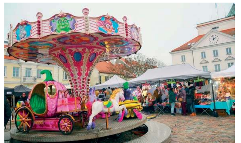
Magiczna karuzela stanowiła bezpłatną atrakcję dla dzieci

Drugiego dnia wszystko rozpoczęło się o godz. 12:00. Oprócz gastronomii i jarmarku, sobota obfitowała w atrakcje magiczne, m.in. wróżby,