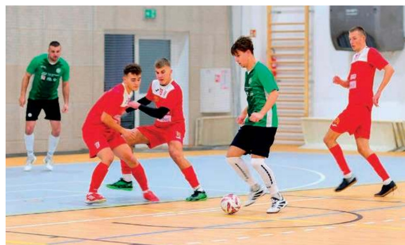
MKS Tymbarki (zielone stroje) wygrali pierwszy mecz ligowy w 3 lidze

W grupie A trzeciej ligi (grupy są trzy) występują jeszcze: Bug Wyszków Futsal, Konserzy FC Mława, Futsal Team Gostynin. erem