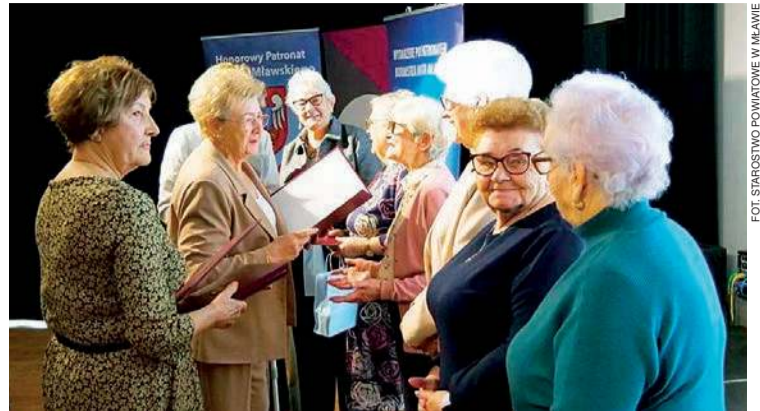
Grupa członków PZEiR na okolicznościowym spotkaniu w Mławie