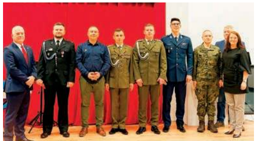
Uchonorowanie krwiodawcy ze służb mundurowych

Listę wszystkich odznaczonych można przeczytać na naszym portalu: www.tygodnik-ciechanowski.pl