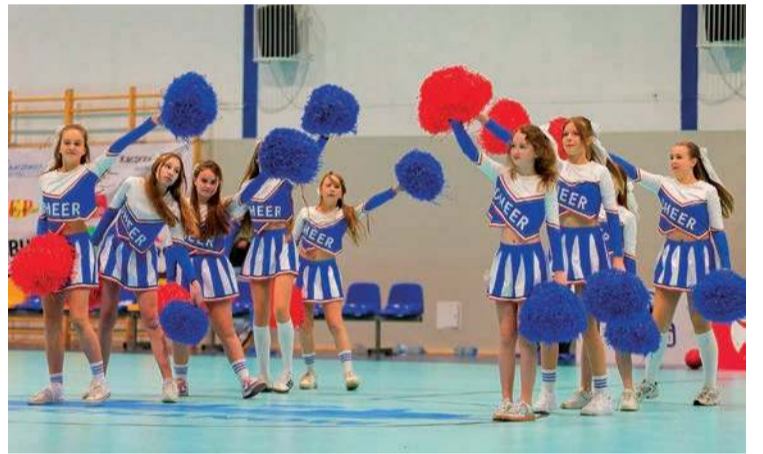
Cheerleaderki pojawiają się w przerwie każdego meczu w Ciechanowie