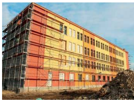
Nowa siedziba starostwa

W budynku pracować będzie blisko 100 osób. Na parterze zlokalizowany zostanie hol z miejscami do siedzenia. Tu znajdzie się także Wydział Komunikacji.