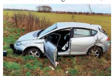
Dachowanie w Malechach

Policjanci wyjaśniają okoliczności i przyczynę zdarzenia drogowego, jakie miało miejsce 22 listopada po godz. 10:30 w Malechach (gm. Karniewo).