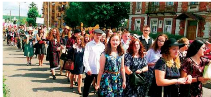
Mławski Korowód Dziejów, impreza zorganizowana w 2011 roku, w której uczestniczyło kilka tysięcy młodzieży. To jeden z przykładów na to, jak dużą wagę przywiązuje Mława do pielęgnowania tradycji

Mniejsza o to. Niektóre kartki opatrzone są napisem „Wesołych Świąt”. Ani jedna autorka nie wpadła na pomysł umieszczenia zwrotu „Wesołych Świąt Bożego Narodzenia”, dzięki czemu przekaz byłby bardziej zrozumiały. Jeśli miałbym szukać odpowiedzialnych za to i inne niedopowiedzenia, to nie wśród