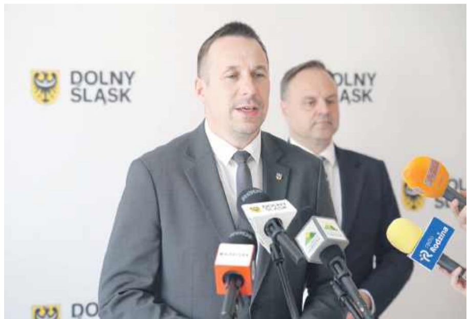
- Chcemy przygotować dolnośląskie firmy na wyzwania przyszłości i wzmacniać bezpieczeństwo regionalnej gospodarki - marszałek Paweł Gancarz

Inwestycyjna Pożyczka Obronnościowa ma charakter inwestycyjny. Maksymalna kwota wsparcia dla jednego przedsiębiorcy wynosi 4 mln zł. Finansowanie będzie dostęp-