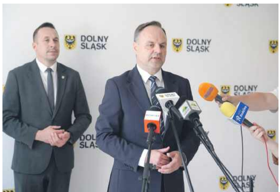
Operatorem programu jest Dolnośląski Fundusz Rozwoju