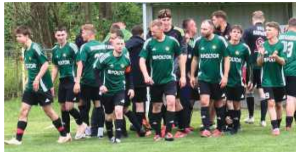
Zawodnicy UKS-u Karnków dopisali punkt na swoje konto