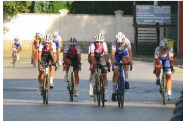
W Strzelinie odbędzie się kolejna impreza kolarska

bank Ślęza Tour Dolny Śląsk, który odbędzie się w dniach 11-14 czerwca. W strzeleńskim ratuszu podpisano umowę z organizatorami wydarzenia. Gmina Strzelin została partnerem wyścigu oraz