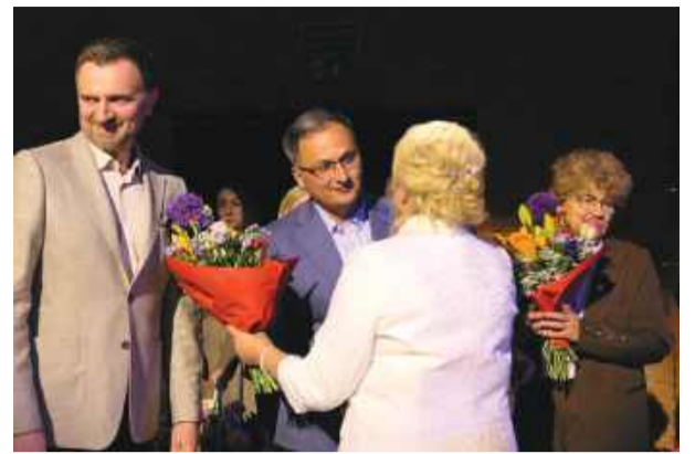
Jubileusz był doskonałą okazją do podziękowań za wieloletnią współpracę