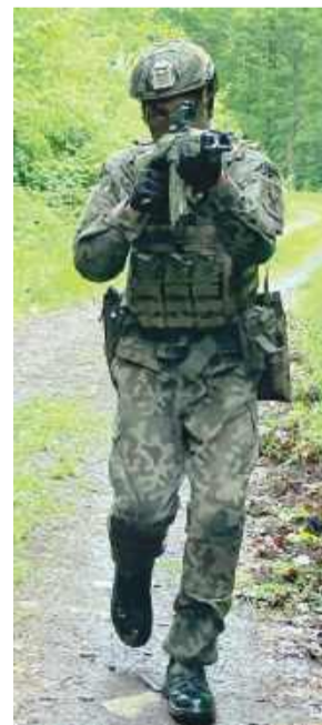
Strzelcy z Jednostki Strzeleckiej 4330 Strzelin zrealizowali szkolenie z zakresu tzw. zielonej taktyki.

Szkolenie było skierowane do członków Drużyny Szkolenia Unitarnego i miało służyć zarówno podnoszeniu poziomu wyszkolenia indywidualnego, jak i zgraniu całego zespołu.