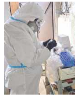
W Opatowicach CBŚP uderzyło w przestępczość narkotykową.

Akcję rozpoczęto w niedzielę po południu, 17 maja, i zakończono w poniedziałek. CBŚP na razie nie informuje o jej szczegółach.