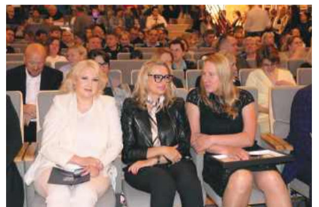
W wydarzeniu udział wzięło wielu zaproszonych gości