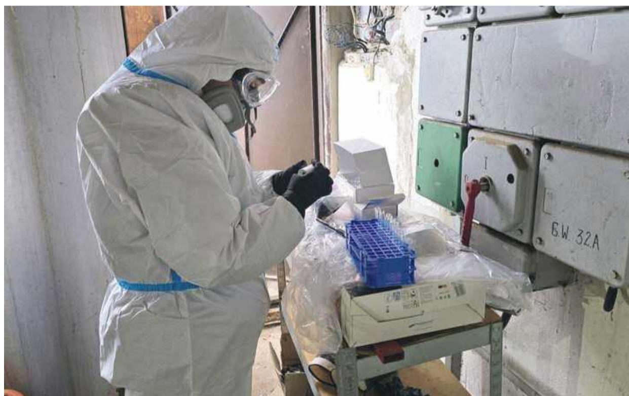
W Opatowicach CBŚP uderzyło w przestępczość narkotykową.

Wielka operacja Centralnego Biura Śledczego Policji (CBŚP) wraz z wrocławskimi kontrterrorystami. W Opatowicach koło Borowa przeprowadzono akcję wymierzoną w zwalczanie przestępczości narkotykowej.