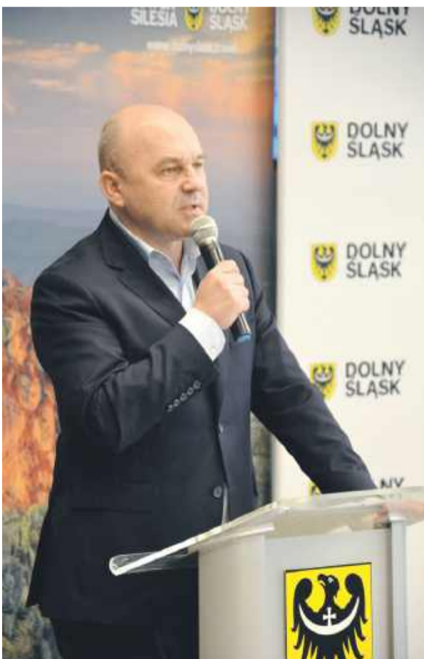
- Dzięki tej pożyczce przedsiębiorcy z powiatu strzezińskiego zwiększą swoją odporność na sytuacje kryzysowe - wicemarszałek Wojciech Bochnak