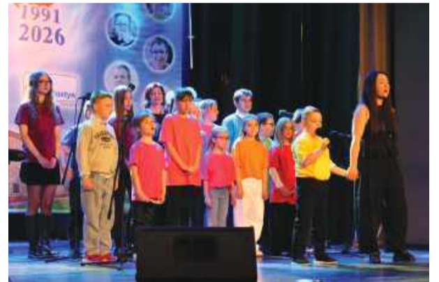
Część artystyczna w wykonaniu najmłodszych została nagrodzona gromkimi brawami