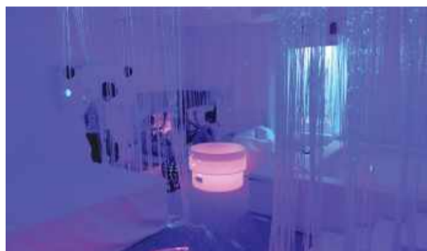
Salę Doświadczania Świata wyposażono m.in. w światłowodów i projektory, tworzące nastrojowe efekty świetlne