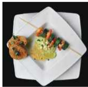
Potrawy z grilla mogą wyglądać jak z najlepszych restauracji.

Sezon komunijny i grillowy trwa. Jak więc zdecydować, jaki przepis zaprezentować? Tym razem postanowiłam, że pozwolę Wam wybrać, co wolicie. Jeśli jecie „oczami” to Karolina Hutnik z Borka