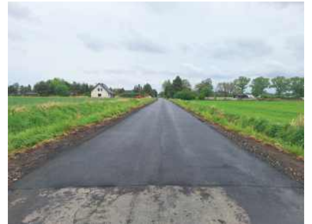
Powiatowy Zarząd Dróg położył asfalt na około 200-metrowym odcinku drogi