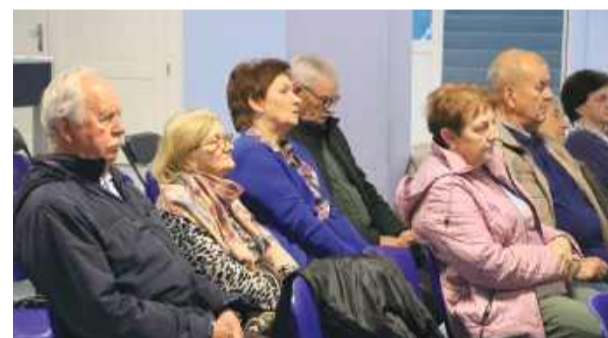
Po wykładzie odbyła się dyskusja z udziałem uczestników spotkania