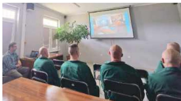
Program cieszył się zainteresowaniem. Uczestnicy z zaciekawieniem wysłuchali prelekcji, aktywnie włączając się do rozmowy oraz dzieląc się swoimi spostrzeżeniami.

niem wysłuchali prelekcji, aktywnie włączając się do rozmowy oraz dzieląc się swoimi spostrzeżeniami. Spotkanie przebiegało w atmosferze wzajemnego szacunku i otwartości. Tego rodzaju inicjatywy odgrywają ważną rolę w procesie readaptacji społecznej osób pozbawionych wolności – podkreśla Magdalena Sie-