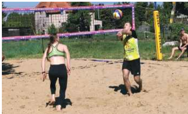
Rywalizacja była bardzo wyrównana

W dniach 9-10 maja w Ligocie Polskiej odbył się kolejny turniej siatkówki plażowej organizowany przez strzeleński klub UKS Sunrise.