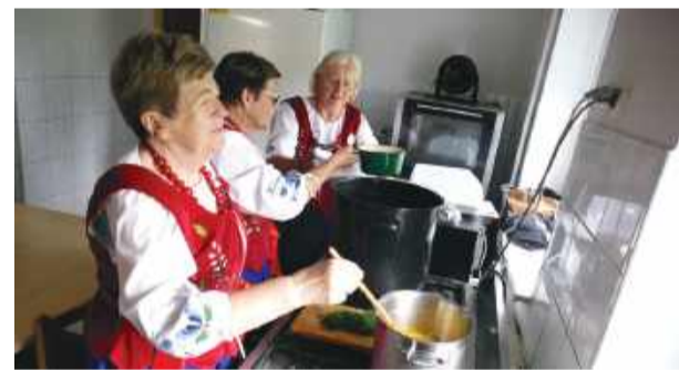
Panie z Koła Gospodyń Wiejskich w Przewornie przygotowywały dania wiele godzin przed spotkaniem

– My ze swej strony dołożymy wszelkich starań, aby Państwo byli zadowoleni i miło