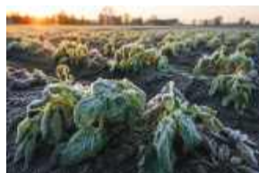
Wiosenne przymrozki spowodowały straty w uprawach także w gminie Przeworno