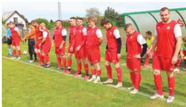
Piłkarze Ogniska przegrali po bramce straconej w doliczonym czasie gry

W dniach 16-17 maja rozegrano spotkania 21. kolejki grupy VI klasy B. Rozgrywki w tym sezonie zdominowały zespoły z powiatu strzelińskiego, które ponownie potwierdziły swoją siłę. Kibice nie mogli narzekać na brak emocji i goli – w kilku meczach padły dwucyfrowe wyniki.