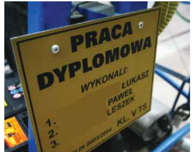
W latach 70. w szkołach technicznych organizowano wystawy konkursowe prac. Najlepsze trafiały na wystawę do Pałacu Kultury i Nauki w Warszawie

zawodowy. Nie musi to być, jak dawniej, żmudna praca dyplomowa. Wydaje się go na podstawie kwalifikacji i ukończenia szkoły – tłumaczy dyrektor.