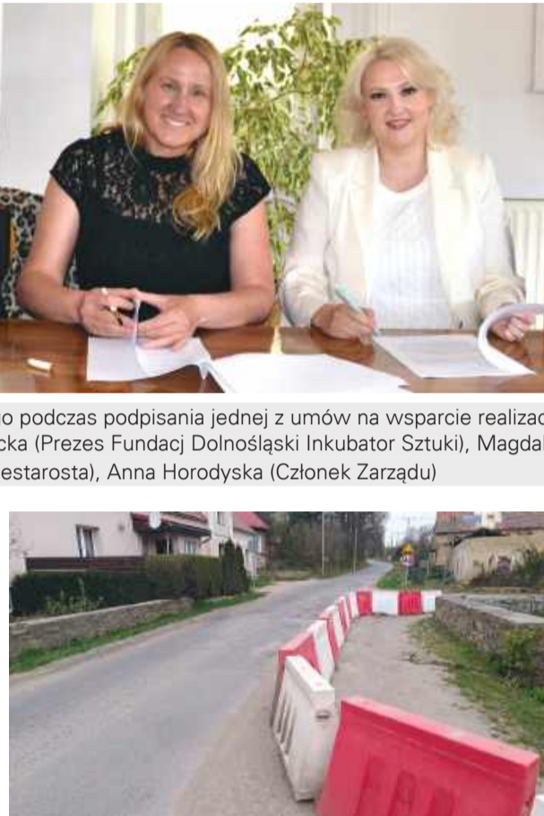
Dzięki dotacji pozyskanej przez Powiat Strzeliński, już wkrótce zostanie wyremontowany most w Cierpicach w gminie Przeworno.

darności Unii Europejskiej, do dolnośląskich samorządów trafi łącznie ponad 150 mln zł na usuwanie skutków powodzi z 2024 roku. Podczas uroczystego wręczenia promes przez Wojewodę Dolnośląską Annę Żabską,