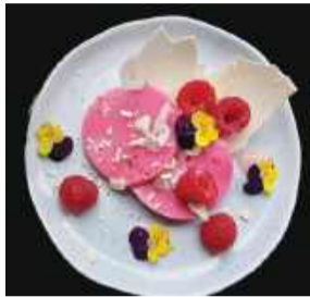
Potrawy Karoliny nie tylko wspaniale wyglądają, ale także smakują.

Sposób przygotowania: Krewetki osuszamy i przekładamy do miski. Dodajemy tarty imbir, łyżeczkę miodu, sosu chili i sojowego. Wszystko mieszamy. Na tace z dziurkami lub grillowej patelni roztopimy masło i wrzucamy krewetki wraz z cukinią pokrojoną w grube talarki. Grillujemy po ok. 3 minuty z każdej strony. Na rozgrzanej patelni kładzie-