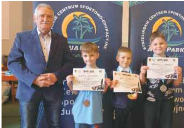
Najmłodszy szachiści z medalami

stół plastikowy, ogrodowy, składany. Cena do uzgodnienia. Tel. 602 450 170 (1-23)