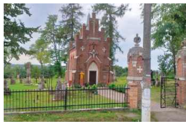
Cmentarz parafialny w Komarnie

Więcej informacji na profilu towarzystwa na Face-