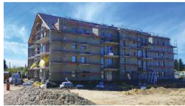
Wszystkie mieszkania w nowym budynku przy ul. Okulickiego znalazły już najemców.