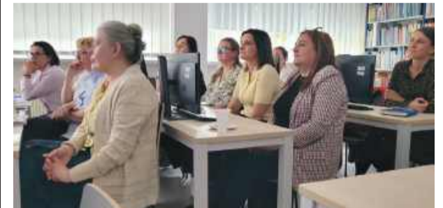
W szkoleniu wzięli udział bibliotekarze z całego powiatu strzeleńskiego.

skorzystaniem z nowoczesnych technologii stała się ważnym elementem dyskusji o warsztacie pracy współczesnego bibliotekarza. Szkolenie prze-