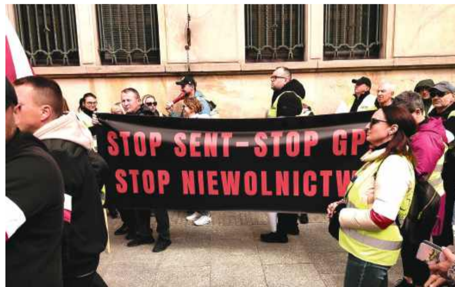
W środę, 13 maja, w Warszawie odbył się protest przedsiębiorców przeciwko systemowi SENT. Tego samego dnia weszły w życie nowe przepisy wyłączające część mikroprzedsiębiorców z obowiązku zgłaszania przewozu odzieży i obuwi.

gowisku, przewóz realizuje mikroprzedsiębiorca wpisany do CEIDG, masa przewożonej odzieży nie przekracza 500 kg, liczba przewożonych par butów nie przekracza 700 sztuk. Ponadto transport odbywa się pomiędzy miejscem prowadzenia działalności