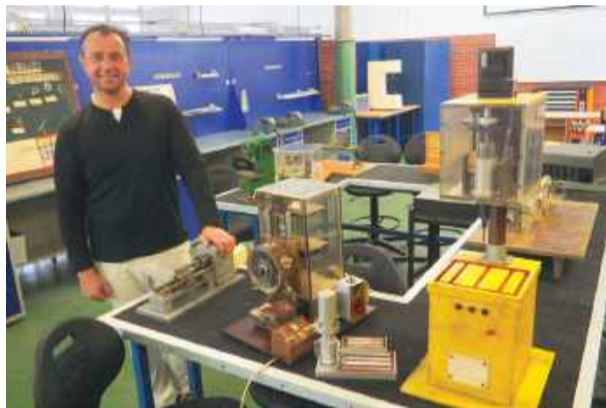
Dawne prace dyplomowe obejrzelśmy na warsztatach w strzeleńskim technikum

pochodzą z 2004 roku. Są też mniej zaawansowane projekty, np. tokarek, frezarek i innych urządzeń