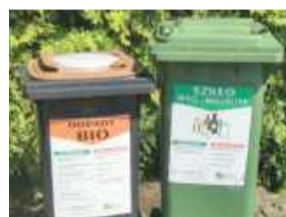
Pamiętajmy, aby uregulować sprawę obecnie używanych pojemników na śmieci

W związku ze zbliżającym się końcem obecnej umowy na odbiór odpadów mieszkańcy mają do