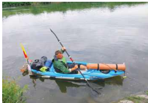
Na wyprawę po odrze w roku 2025 wyruszył jednoosobowym kajakiem. Był przygotowany znacznie lepiej niż na splot Wisłą

ciłem ważny element wyposażenia – wózek do przenoszenia kajaka. Zgubiłem go drugiego dnia. Na zakręcie wystawał, zahaczyłem o jakąś gałąź i wpadł do wody. Próbowałem wyciągnąć, ale było za głęboko, a przenoski były codziennością – służy, zapory, przeszkody naturalne – opisuje Wiązowianin.