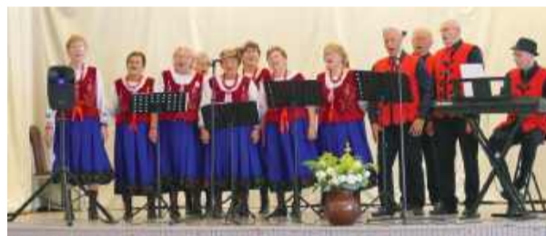
Podczas spotkania występował zespół „Przewornianie”