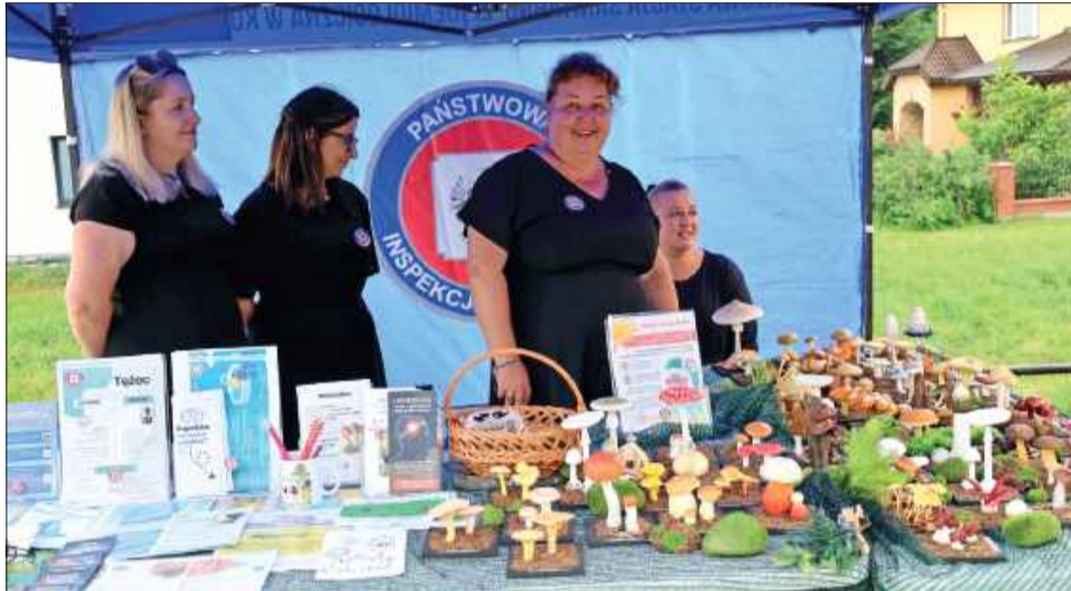
Na ważne tematy związane m.in. ze zdrowiem uczestnicy mogli porozmawiać z przedstawicielkami Powiatowej Stacji Sanitarno-Epidemiologicznej w Kolbuszowej.

Druszlak po raz kolejny udowodnił, że kultura Lasowiaków to nie tylko przeszłość – to żywa i pulsująca część naszej codzienności. A Kolbuszowa – jak co roku – potrafi zamienić jeden lipcowy dzień w prawdziwe święto korzeni. bp