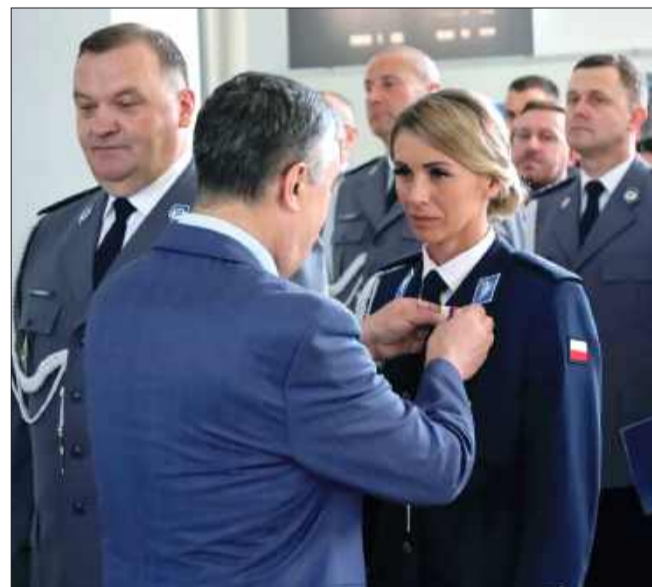
Policjanci zapamiętają ten dzień na długo.