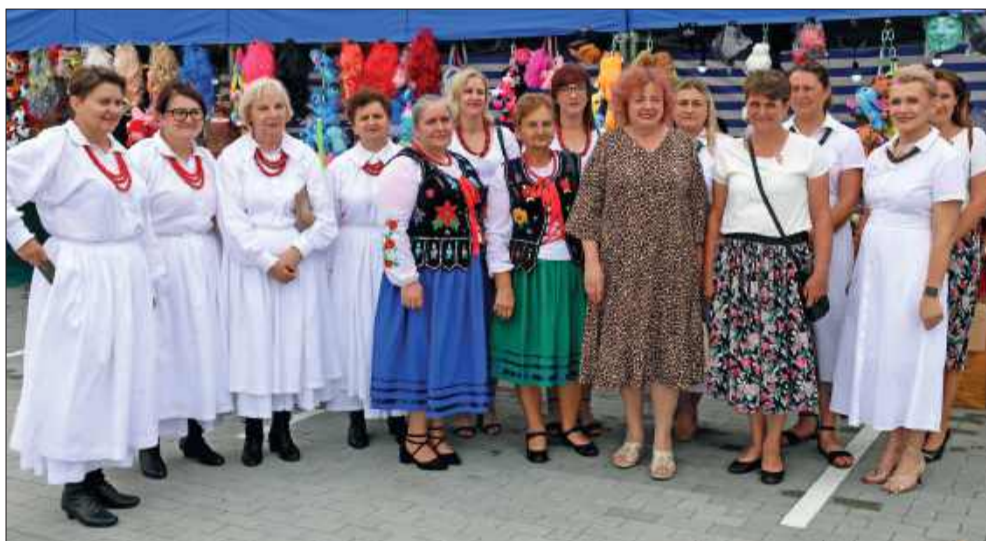
Podczas Dni Raniżowa nie mogło zabraknąć także gospodyń z KGW.