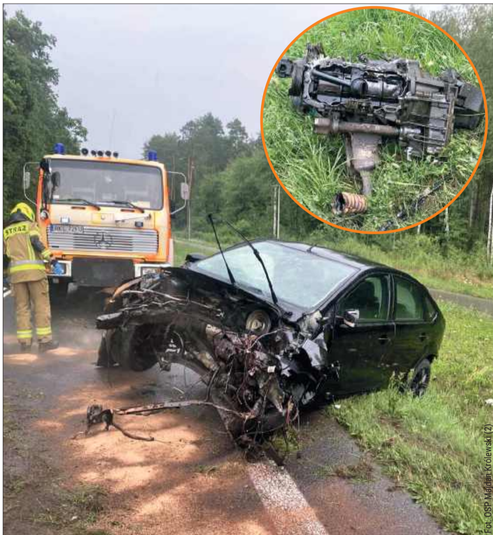
W Komorowie z osobowego forda wypadł silnik.