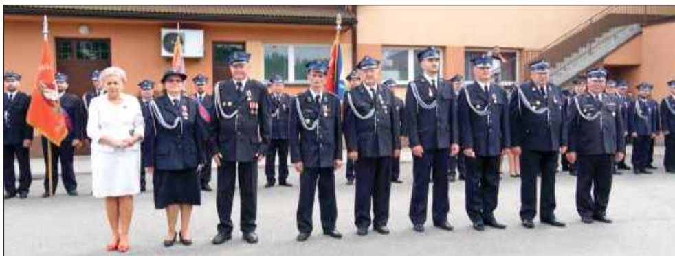
Uroczystość była szczególnym momentem dla strażaków i mieszkańców Siedlanki.