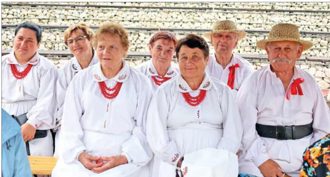
Podczas wydarzenia mogliśmy spotkać i podziwiać Zespół Ludowy Cmolosianie.