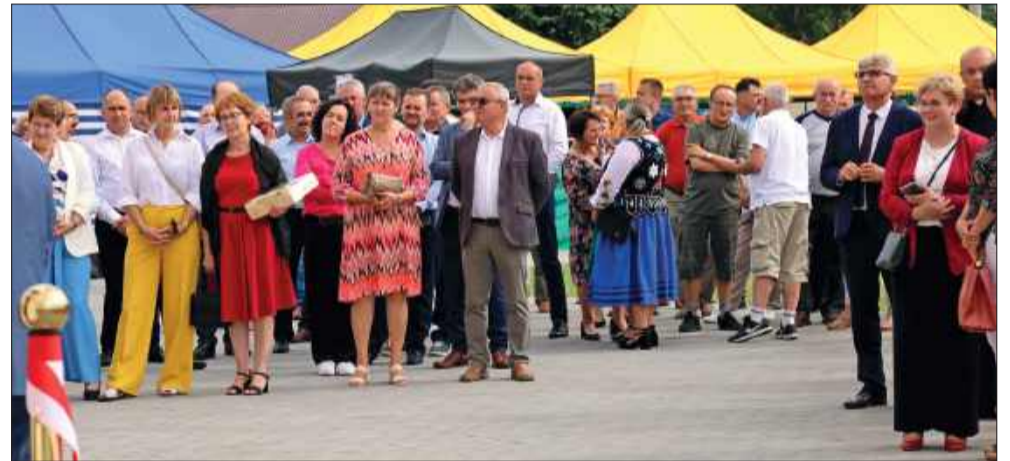
Dni Raniżowa, a szczególnie niedzielne uroczystości były idealną okazją do wspólnego świętowania.