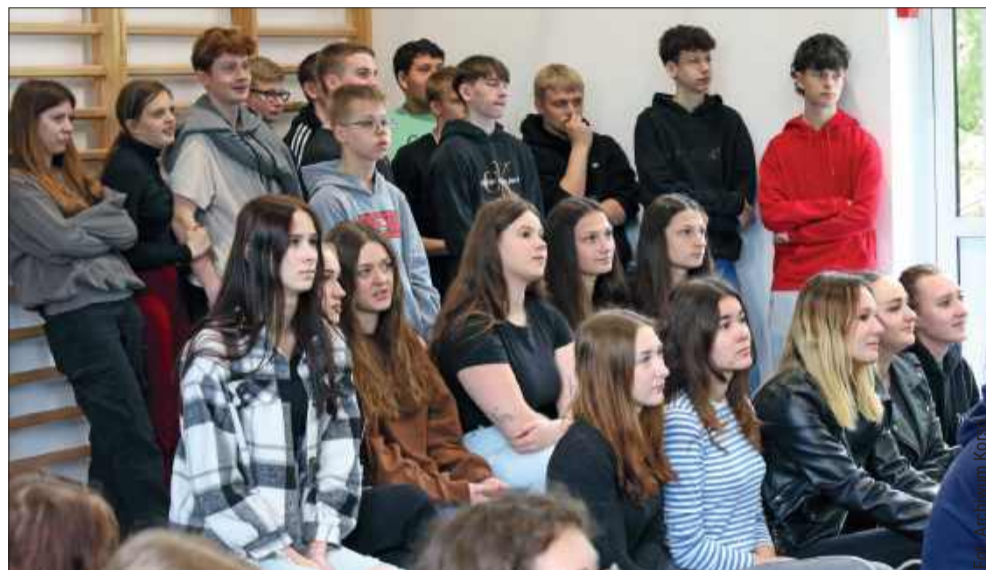
W powiecie kolbuszowskim kończy się rekrutacja do szkół średnich na rok szkolny 2025/2026.