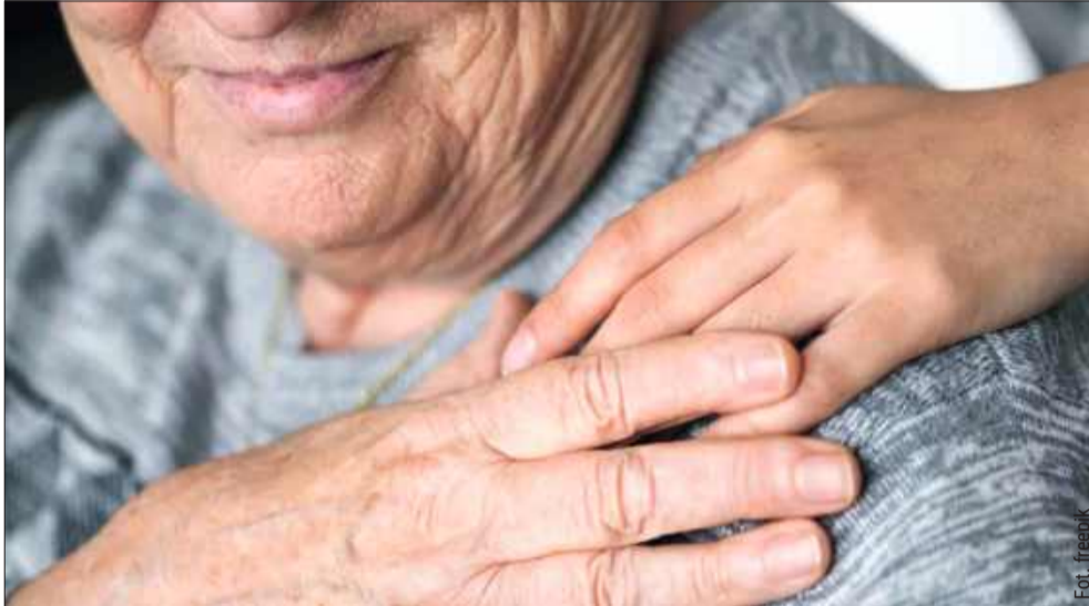
Nowy dodatek dla seniorów już od stycznia 2026! Nawet 2150 zł co miesiąc.

Wniosek o przyznanie bonu będzie mógł złożyć zstępny seniora, czyli osoba, na której ciąży obowiązek alimentacyjny – np. dziecko lub wnuk. Kluczowym warunkiem będzie aktywność zawodowa tej osoby – musi być zatrudniona na podstawie umowy o pracę, umowy cywilnoprawnej, prowadzić działalność gospodarczą lub osiągać dochody z rolnictwa.