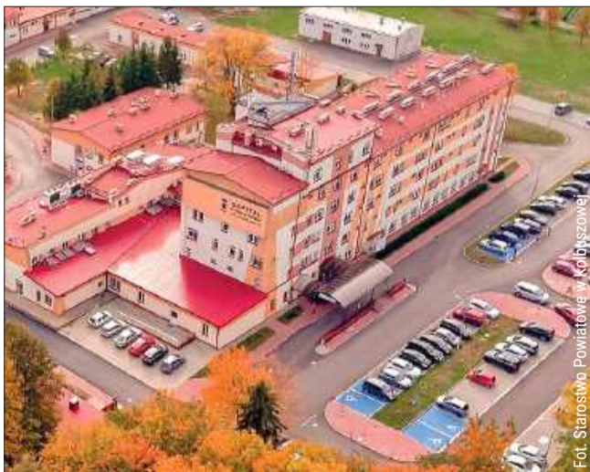
Milionowa inwestycja w szpitalu w Kolbuszowej. Pierwszy etap został zakończony.