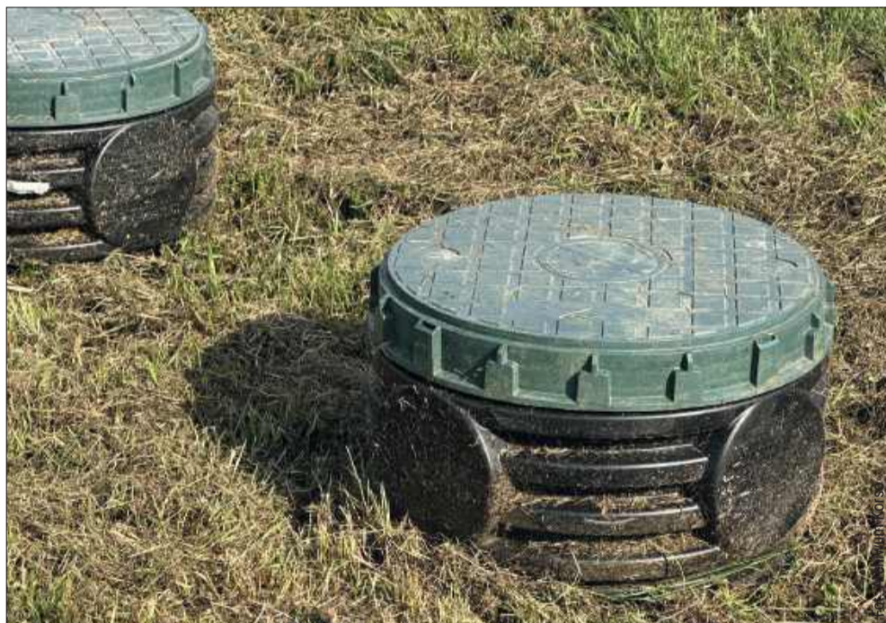
Zainteresowanie przydomowymi oczyszczalniami ścieków w gminie Kolbuszowa jest duże. Ile wniosków już wpłynęło?

Poprzednia edycja programu pokazuje, że warto próbować. Wtedy z 130 złożonych wniosków, aż 100 zostało zakwali-