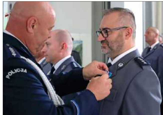
Wyróżnieni mundurowi otrzymali też medale.

Kolbuszowskie Święto Policji było nie tylko chwilą podsumowania dotychczasowej służby, ale też momentem refleksji nad jej społeczną rolą. Jak podkreślali uczestnicy, bezpieczeństwo lokalnej społeczności to efekt codziennej pracy i współpracy wielu osób – zarówno w mundurze, jak i poza nim.