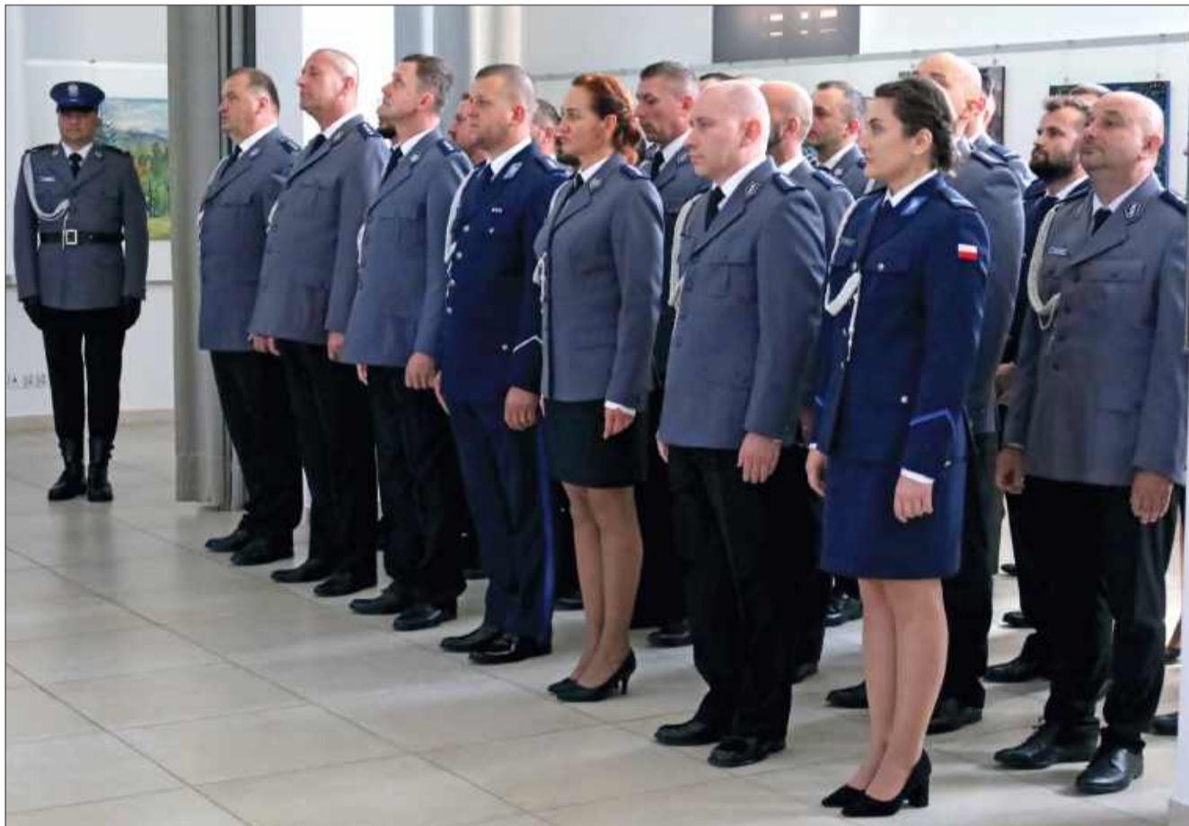
Policjanci z dumą wzięli udział w uroczystości.