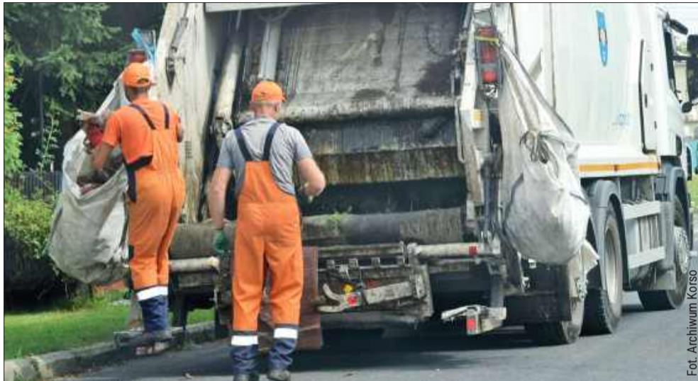
Czy w gminie Kolbuszowa opłaty za śmieci pójną w górę?

Zgodnie z przepisami prawa, właściciele nieruchomości muszą złożyć nową deklarację o wysokości opłaty za gospodarowanie odpadami komunalnymi w przypadku zmiany liczby osób w gospodarstwie domowym. Zmiana ta ma na celu zapewnienie prawidłowego naliczenia opłaty, a także utrzymanie porządku w systemie zarządzania odpadami w gminie.