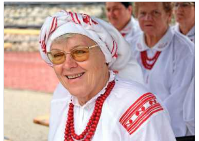
Korale, chusty na głowach i wyjątkowe wzory, tak przedstawia się lasowiacki ubiór.