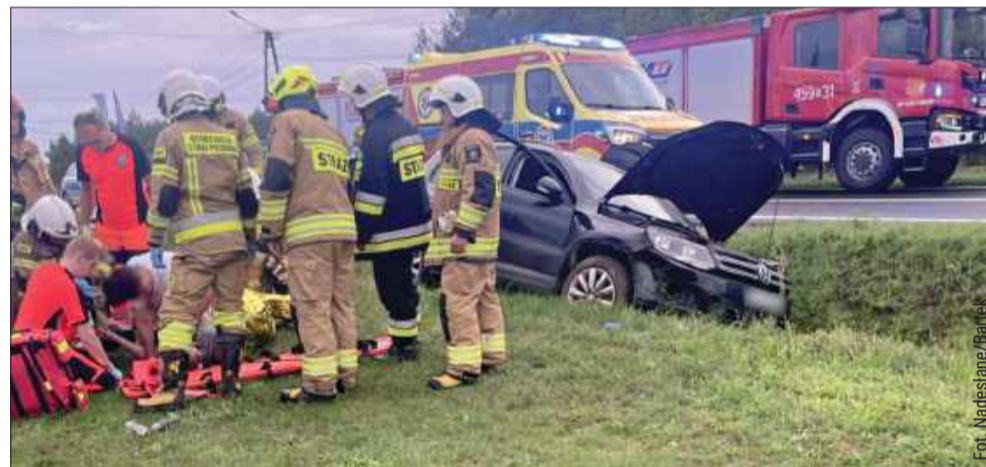
W Hadykówce mężczyzna zasnął za kierownicą.