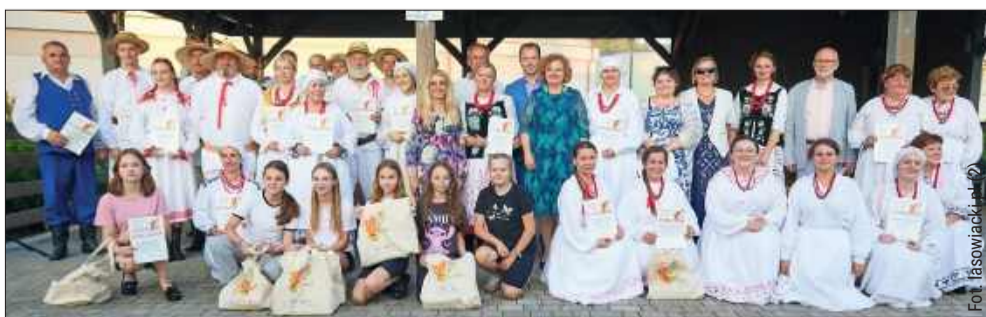
Konkurs cieszył się dużym zainteresowaniem.