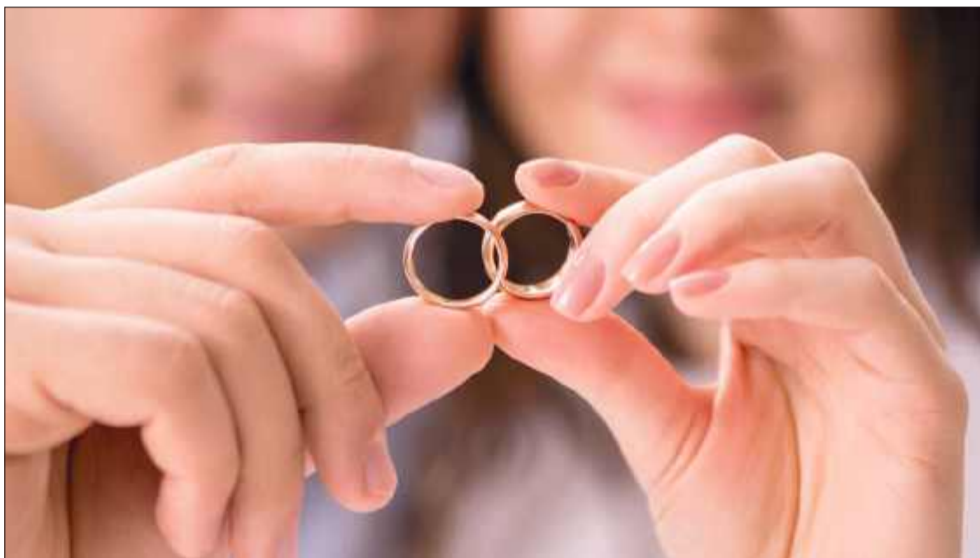
Komu i w jakiej wysokości przysługiwałoby świadczenie?

Podczas posiedzenia Senackiej Komisji Petycji, które odbyło się 10 czerwca 2025 roku, senatorowie zajęli się projektem ustawy, który przewiduje wypłatę specjalnego świadczenia dla małżeństw świętujących okrągłe rocznice wspólnego życia. Pomysł, zgłoszony w ramach petycji P10-11/23, zakłada wypłatę: 5000 zł za