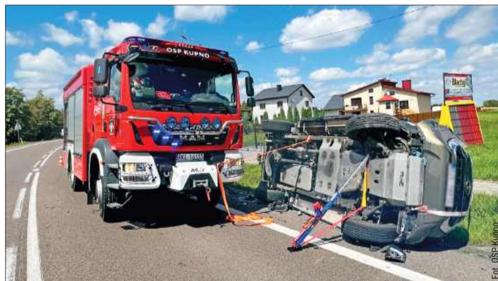
W Kupnie terenowa toyota wylądowała na boku.