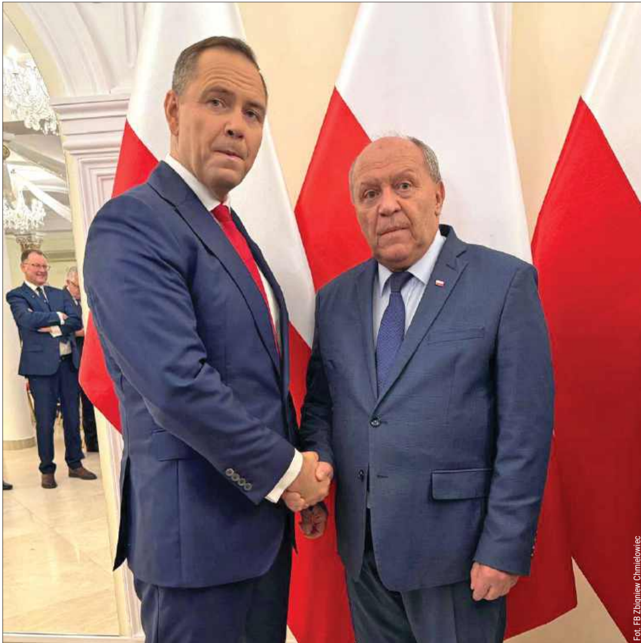
Zbigniew Chmielowiec, poseł na Sejm RP przekazał, że Karol Nawrocki planuje odwiedzić Kolbuszową w niedalekiej przyszłości.

Prezydent Karol Nawrocki uzyskał 50,89 proc. głosów w drugiej turze wyborów pre-