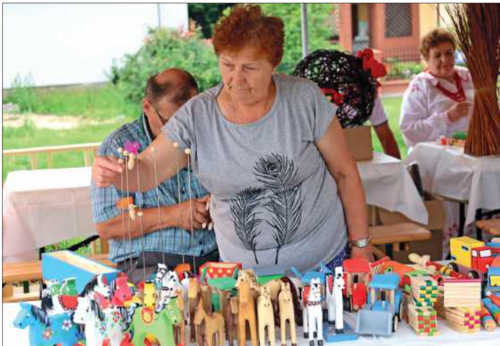
Podczas wydarzenia mogliśmy podziwiać przeróżne stoiska, m.in. z tradycyjnymi zabawkami.