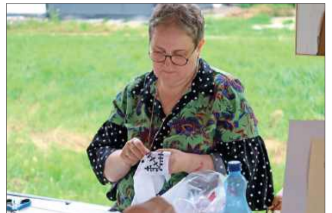
Tradycyjny haft to także jedna z dziedzin, którą mogli poznać uczestnicy festiwalu.