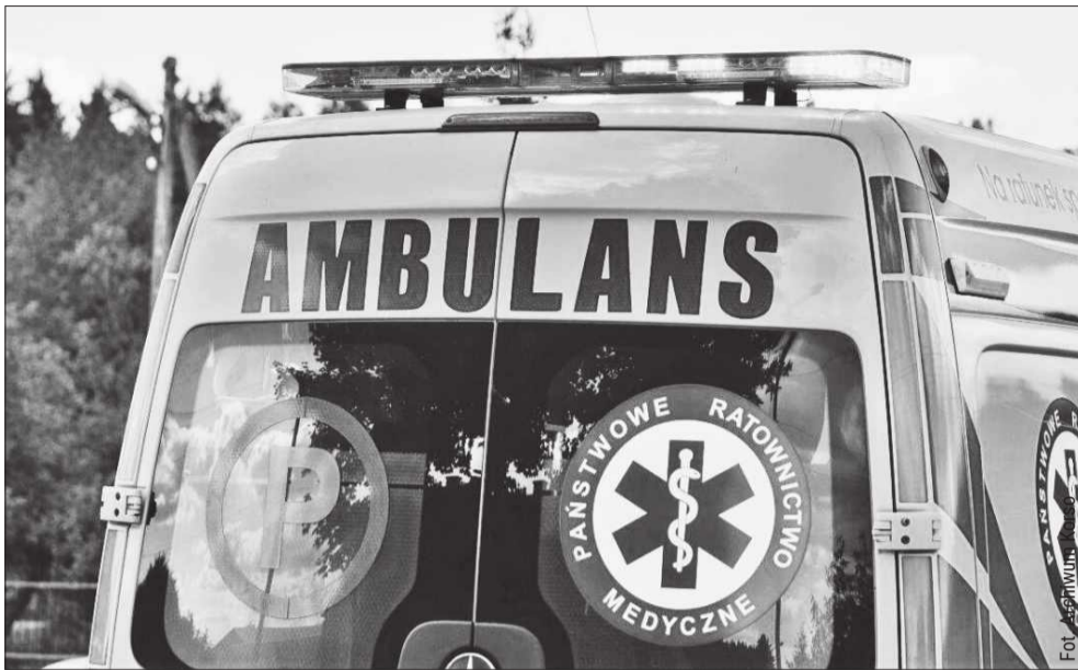
Interwencja w Weryni miała swój tragiczny finał.

Mężczyzna podkreślił również, że jego zdaniem nie doszło do porażenia prądem. Sam wszedł do łazienki w skarpet-