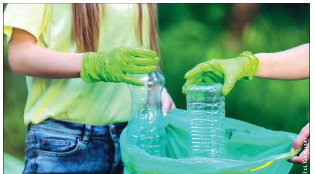
Już od 1 października 2025 roku w Polsce rusza system kaucyjny, który obejmie m.in. plastikowe butelki