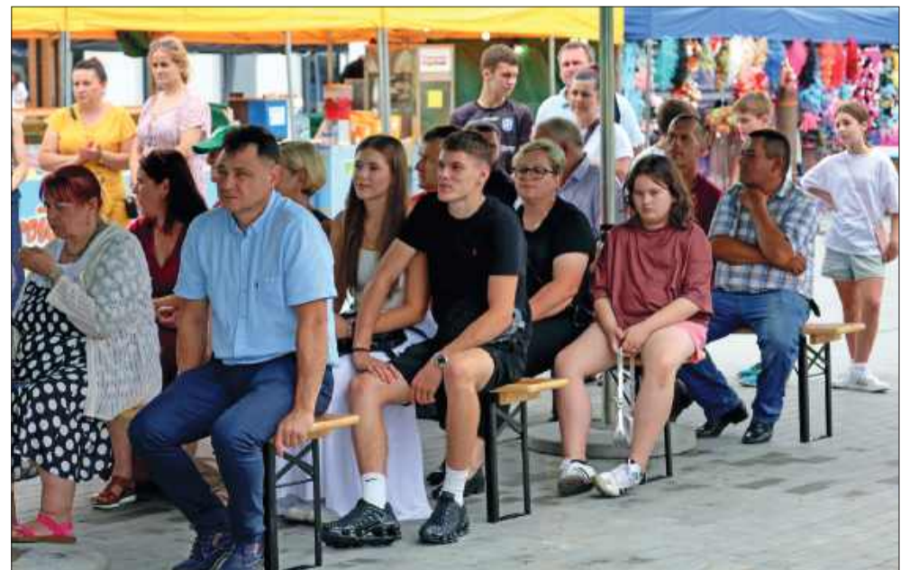
Mieszkańcy także przybyli obejrzeć nowy obiekt i wspólnie bawić się podczas tegorocznych Dni Raniżowa.