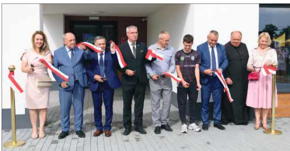
Samorządowcy i oficjele dokonali oficjalnego przecięcia wstęgi.