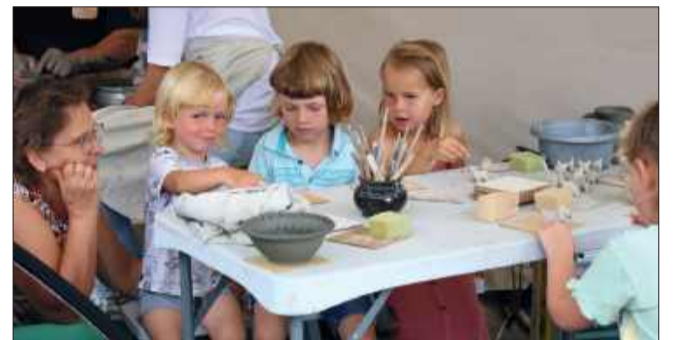
Na najmłodszych także czekało wiele atrakcji.