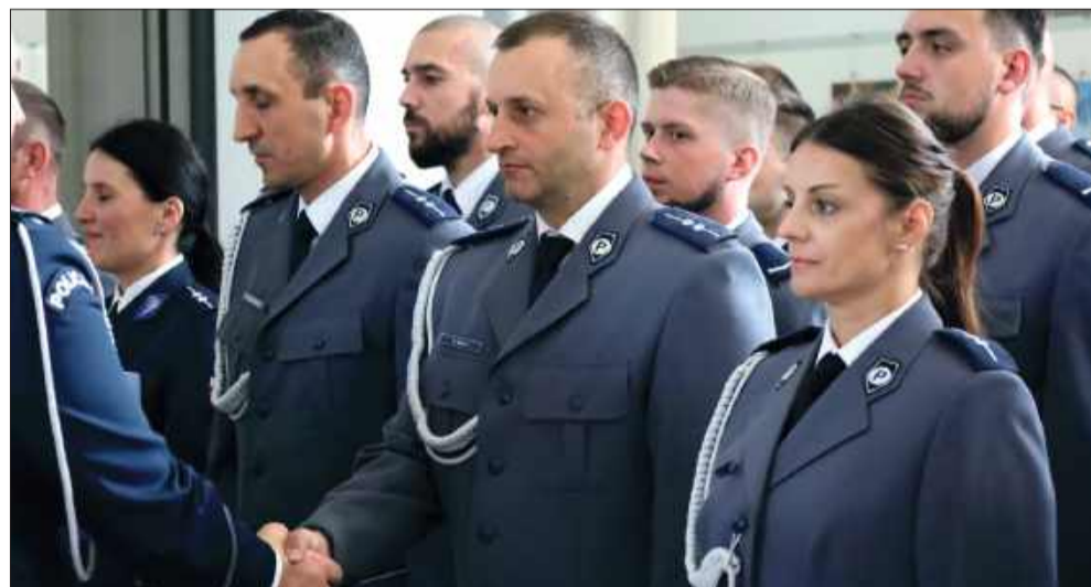
Policjanci odebrali gratulacje i awanse na wyższe stopnie.