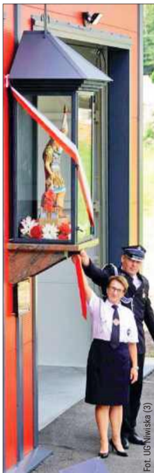
Figura św. Floriana została poświęcona i odsłonięta podczas uroczystości.