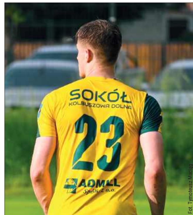
tm Historyczny sezon przed Sokołem. Po ile wejściówki i kiedy pierwszy mecz?

Zbliża się wielki moment dla kolbuszowskiej piłki. W piątek, 1 sierpnia o godz. 17:30 Sokół Kolbuszowa Dolna zagra swój pierwszy mecz w Betclic 3. Lidze. Mecz odbędzie się na Stadionie Miejskim przy ul. Wolskiej. Kibice są serdecznie zapraszani - to wydarzenie, które zapisze się w historii lokalnego sportu.