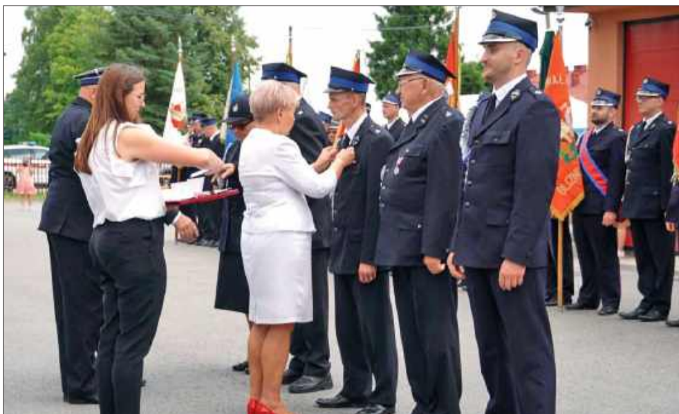
Druhowie otrzymali także odznaczenia.