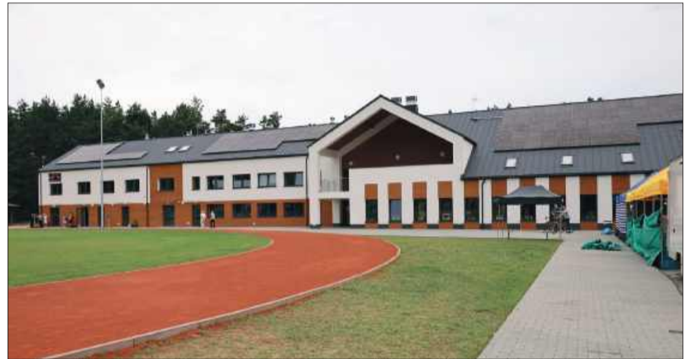
Tak prezentuje się nowy obiekt.