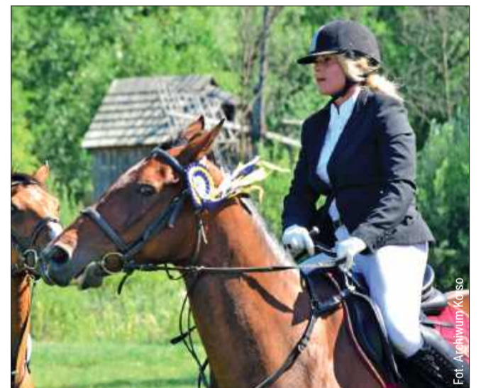
Ta impreza to prawdziwa gratka dla miłośników koni.

Jak przystało na imprezę w skansenie, nie zabraknie regionalnej kuchni. Panie z Kół Gospodyń Wiejskich z Domat-