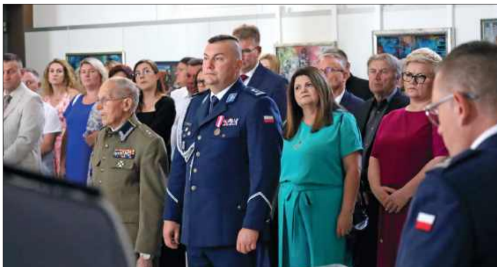
Na obchodach nie zabrakło władz z powiatu kolbuszowskiego.