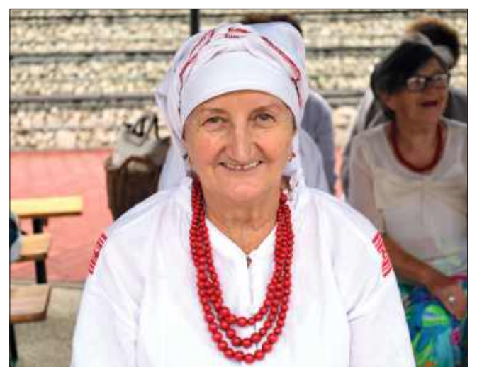
Tradycyjne lasowiackie stroje były nieodłącznym elementem wydarzenia.