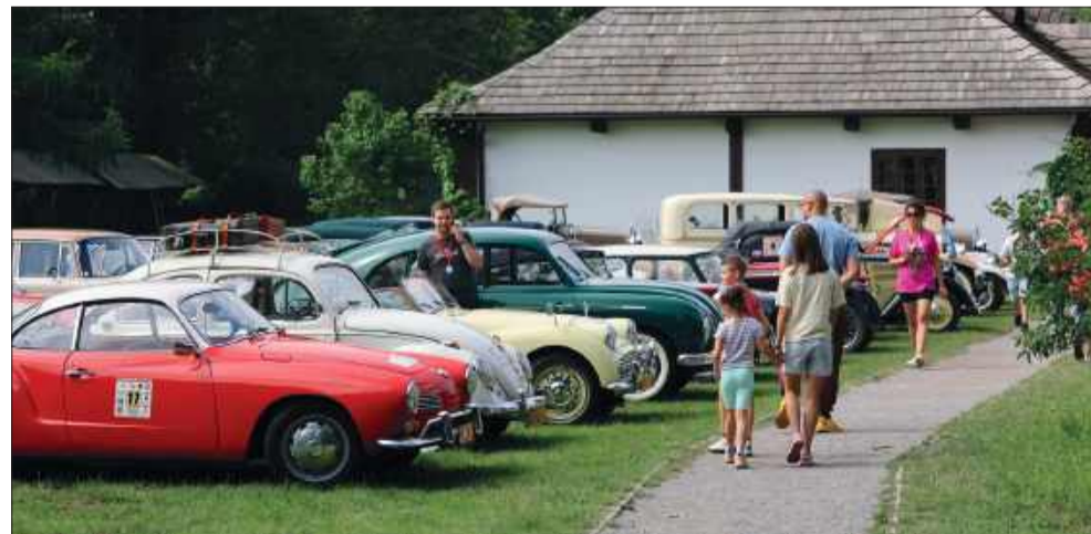
To była prawdziwa motoryzacyjna podróż w czasie.