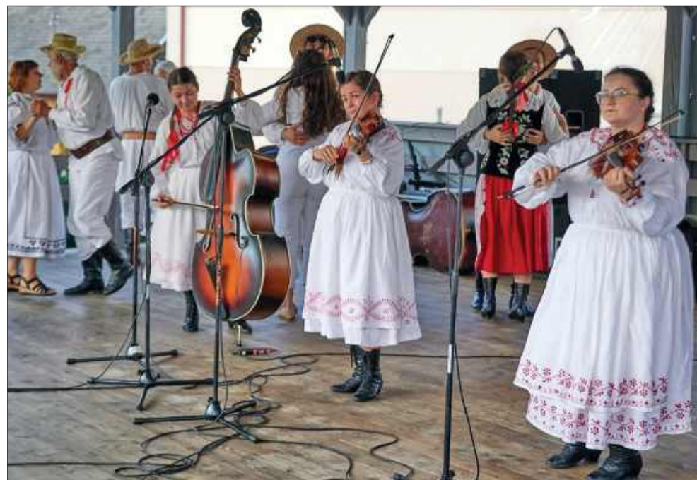
Jedną z głównych nagród zdobyły Lasowiackie Baby.