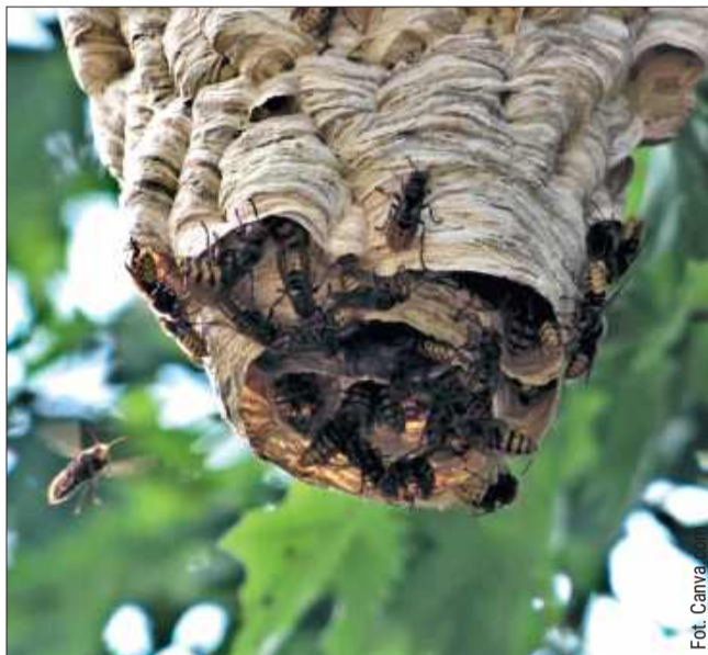
Szerszenie do jedne z najbardziej niebezpiecznych owadów, których użądlenie, zwłaszcza dla osoby uczulonej może nieść za sobą poważne skutki.

Jeśli zależy nam na uniknięciu szerszeni w ogrodzie, lepiej postawić na rośliny, które nie mają tak intensywnych zapachów, takie jak lawenda, czy