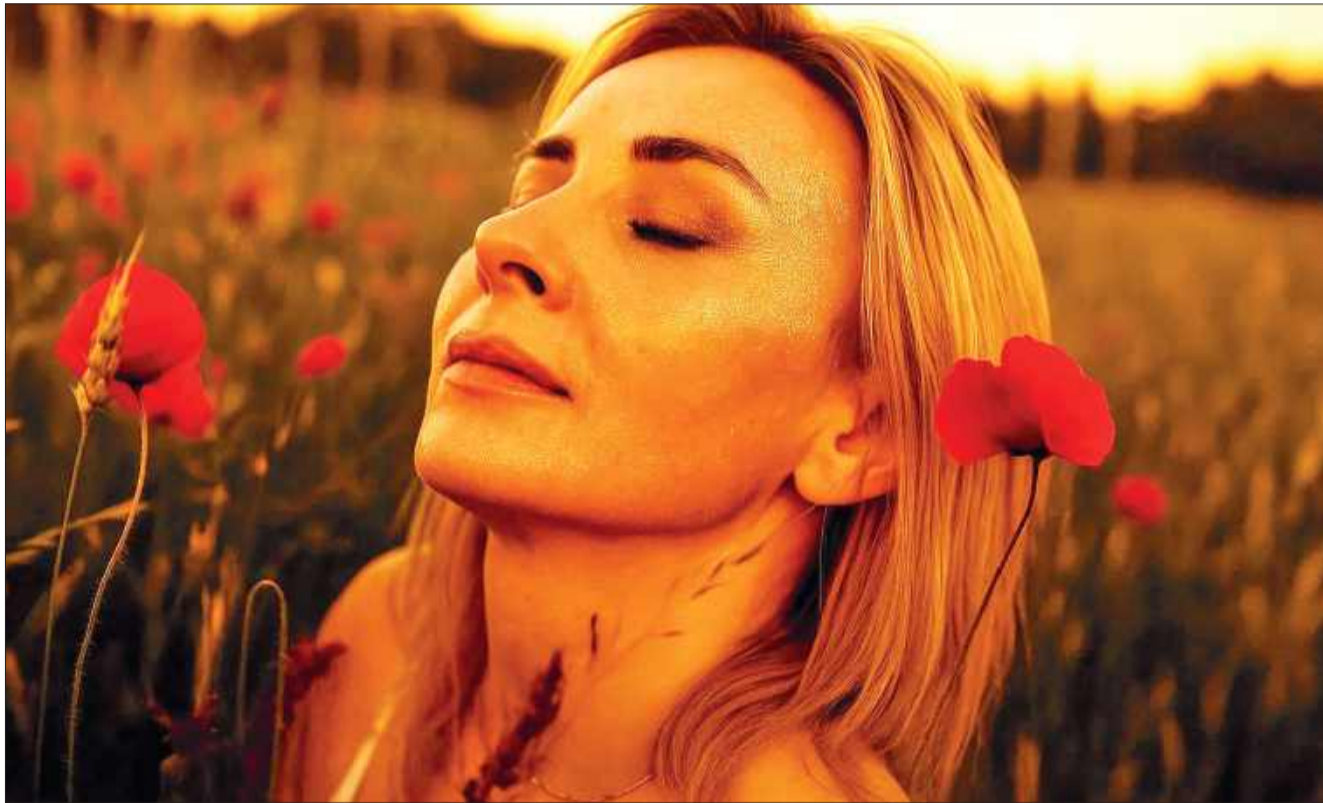
Co dzieje się z naszym organizmem i psychiką, gdy stres staje się chroniczny i nie potrafimy sobie z nim radzić?

Warto rozważyć sięgnięcie po pomoc terapeutyczną, zwłaszcza, kiedy takie stany utrzymują się ponad dwa tygodnie bez poprawy. Alarmujący jest stan depersonalizacji (czyli uczucie jakby się było obok siebie) oraz poczucie bezsensu i ciągłego zagrożenia. Zalecam szczególnie sięgnięcie po profesjonalną pomoc, gdy zauważymy objawy lękowe, ataki paniki lub przewlekłą bezsenność.