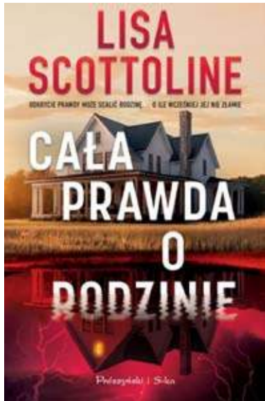
Cała prawda o rodzinie Lisa Scottoline Wydawnictwo Prószyński i S-ka

Najnowsza powieść bestsellerowej autorki „New York Timesa”.