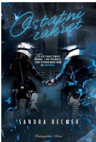
Ostatni zakręt Sandra Becmer Wydawnictwo Prószyński i S-ka

TJ postanawia wykorzystać tę sytuację, by udowodnić swoją wartość i ocalić dobre imię brata. Kolejne odkrycia wciągają go jednak w mroczną sieć oszustw, morderstw i sekretów, które mogą zagrozić jedności oraz nieskazitelnej reputacji rodziny Devlinów.