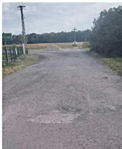
Planowany odcinek obejmuje niespełna 2 kilometry drogi pomiędzy miejscowościami Kawęczyn i Strych. To fragment, który od lat wymaga modernizacji i poprawy standardu