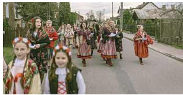
Po wielu latach przerwy na ulice Goćławia powróciła jedna z najpiękniejszych wielkanocnych tradycji