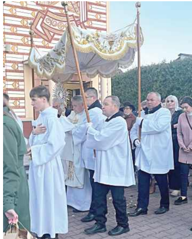
Niedziela Zmartwychwstania jest najważniejszym wydarzeniem w kalendarzu Kościoła katolickiego. Świętowanie Wielkiej Nocy rozpoczęło się od rezurekcji, czyli uroczystej mszy świętej, którą poprzedziła procesja (Parafia Matki Bożej Kodeńskiej w Pilawie)