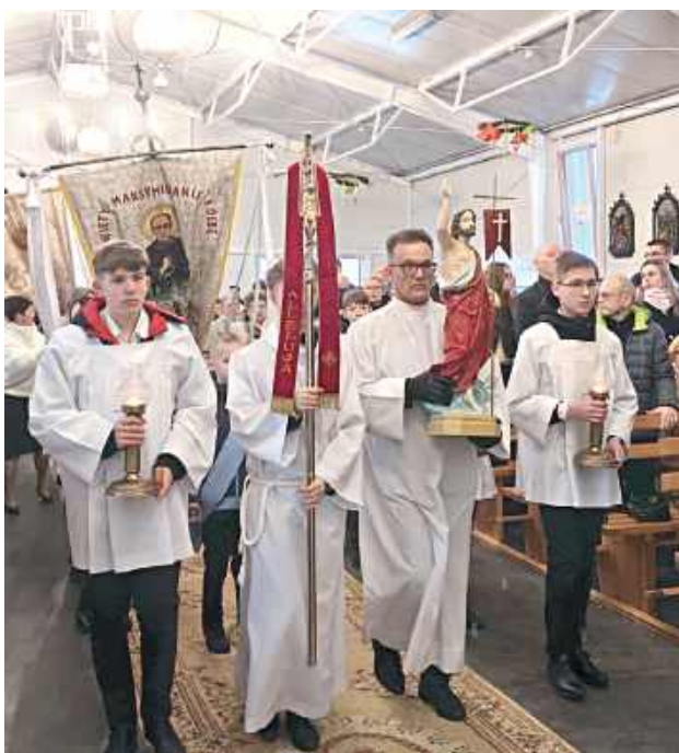
Z radością i wdzięcznością przeżyli wspólnie uroczystą Mszę Rezurekcyjną, która była sercem i najpiękniejszym momentem Świąt Wielkanocnych (Parafia Świętego Jana Pawła II w Sulbinach)