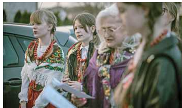
W Niedzielę Wielkanocną mieszkańcy mogli ponownie zobaczyć i usłyszeć dyngusiarzy, którzy z muzyką, śpiewem i życzeniami odwiedzali domy, przywracając dawny klimat świąt

To właśnie dzięki nim dawne pieśni znów wybrzmiały między domami, a mieszkańcy – otwierając drzwi – przyjęli dyngusiarzy z ogromną życzliwością.