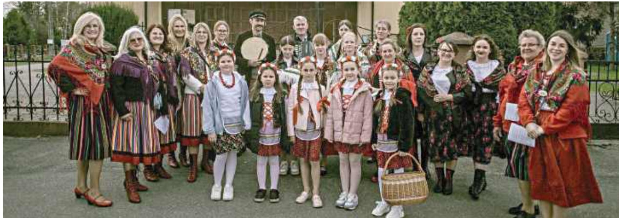
To wydarzenie szybko zamieniło się w prawdziwe święto lokalnej społeczności

Na Mazowszu były takie dni, kiedy ciszę wsi przerywał śpiew, śmiech i dźwięk akordeonu. W Niedzielę Wielkanocną ten klimat powrócił do Goćławia.