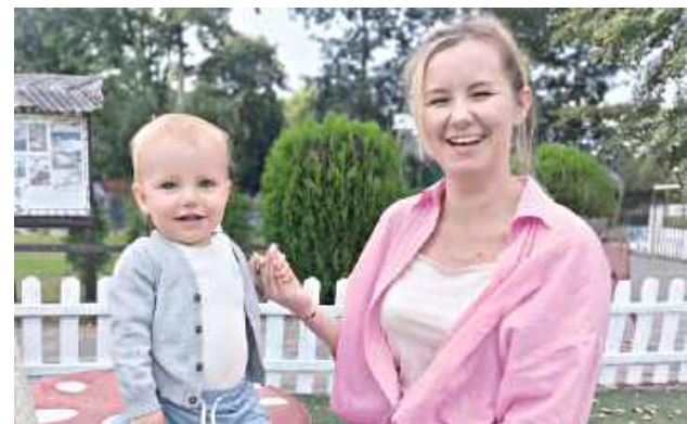
Nikt nie wie, co jest mu pisane, nie da się tego przewidzieć. Ale kiedy już cię to dotyka, przewartościowujesz całe swoje życie