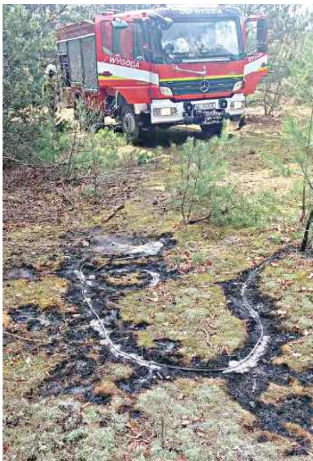
Zerwana linia energetyczna