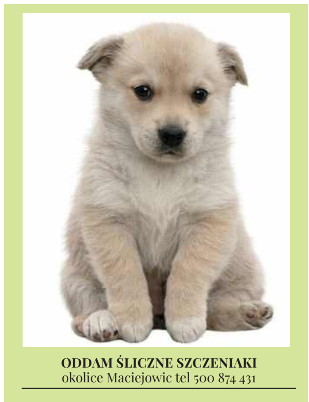
ODDAM ŚLICZNE SZCZENIAKI okolice Maciejowic tel 500 874 431

TUCZNIK w wadze 130 kg; cena 8,70/ kg; z możliwością uboju na miejscu; Sobolew; Tel. 504 637 577