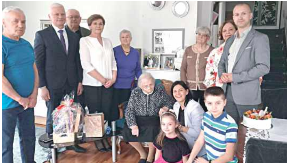
Jubilatka może pochwalić się imponującą rodziną