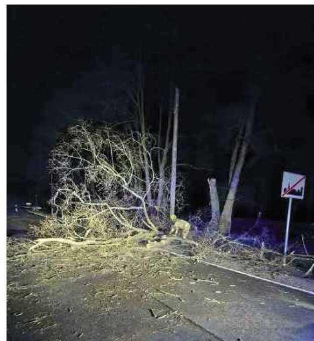
ok Najwięcej było powalonych drzew

Strażacy od wczesnych godzin porannych aż do kolejnego dnia nie mieli chwili wytchnienia, reagując na kolejne zgłoszenia