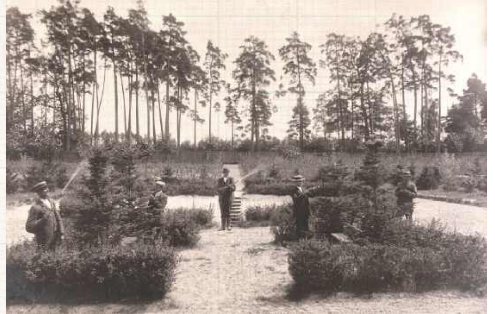
Roboty ogrodnicze w szkółkach handlowych w Podzamczu - początek XX wieku („Gazeta Leśna i Myśliwska” 3(13): 302; „Podzamcze”, Jakub Dolatowski, Polskie Towarzystwo Dendrologiczne z siedzibą we Wrocławiu)

Szkółki leśne maciejowickie należały w XIX wieku do rzędu najobszerniejszych na ziemiach polskich i najumiejtniej oraz najstarszej prowadzonych. Zyskały renomę w całym Imperium Rosyjskim. Odbływały się do nich wycieczki leśników, wśród których należy wyróżnić turnus krajoznawczy z roku 1885.