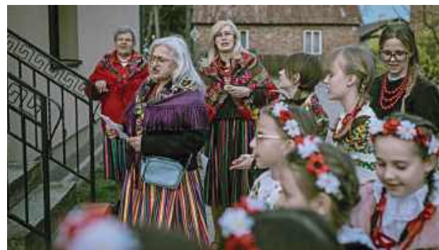
Tradycja dyngusiarzy, nazywana lokalnie „Dziękusem”, sięga dawnych czasów i była nieodłącznym elementem Świąt Wielkanocnych na Mazowszu