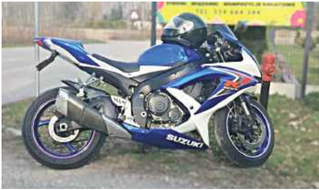
Funkcjonariusze ustalili, że 28-letni mężczyzna celowo doprowadził do utraty styczności jednego z kół z nawierzchnią

W niedzielę, 5 kwietnia tuż przed godziną 17 policjanci ruchu drogowego pełniący służbę na ul. Długiej w Sulbinach zatrzymali do kontroli kierującego motocyklem, który wykonywał niebezpieczny manewr jazdy na tylnym kole.