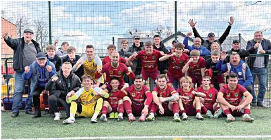
Gracze Orła wygrali w Węgrowie i awansowali na siódme miejsce w tabeli

Spotkanie miało wyrównany przebieg i długo zanosilo się na remis. Obie drużyny skupiały się przede wszystkim na defensywie, a kluczowe