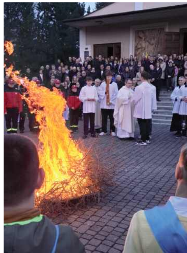
Wigilia Paschalna była najważniejszą nocą w roku liturgicznym. Nabożeństwo podzielone zostało na cztery części: Liturgię Światła, Liturgię Słowa Bożego, Liturgię Chrztelną i Liturgię Eucharystyczną (Parafia Świętego Izydora Oracza w Marianowie)