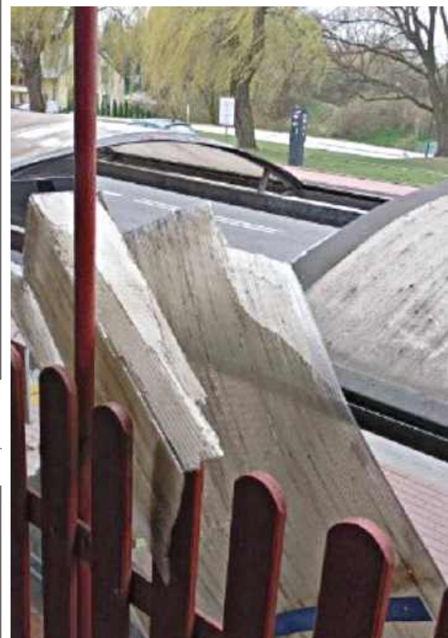
Mężczyzna wszedł na wiat autobusowy przy ulicy Traugutta. Konstrukcja nie wytrzymała obciążenia, w wyniku czego doszło do zarwania dachu

Funkcjonariusze z Komendy Powiatowej Policji w Sochaczewie zatrzymali 26-letniego obywatela Ukrainy podejrzanego o popełnienie kilku przestępstw.