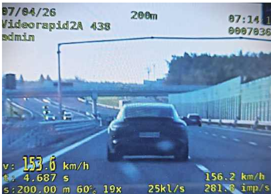
Rutynowa kontrola ujawniła, że lista jego wykroczeń jest znacznie dłuższa, niż mogło się początkowo wydawać

Do zdarzenia doszło 7 kwietnia 2026 roku w rejonie Michałówka. Funkcjonariusze płońskiej drogowki zatrzymali pojazd do kontroli. Jak ustalono, za kierownicą siedział 46-letni mieszkaniec Warszawy, który dopuścił się wykroczenia w warunkach recydywy. W ciągu ostatnich dwóch lat popełnił już podobne naruszenie przepisów