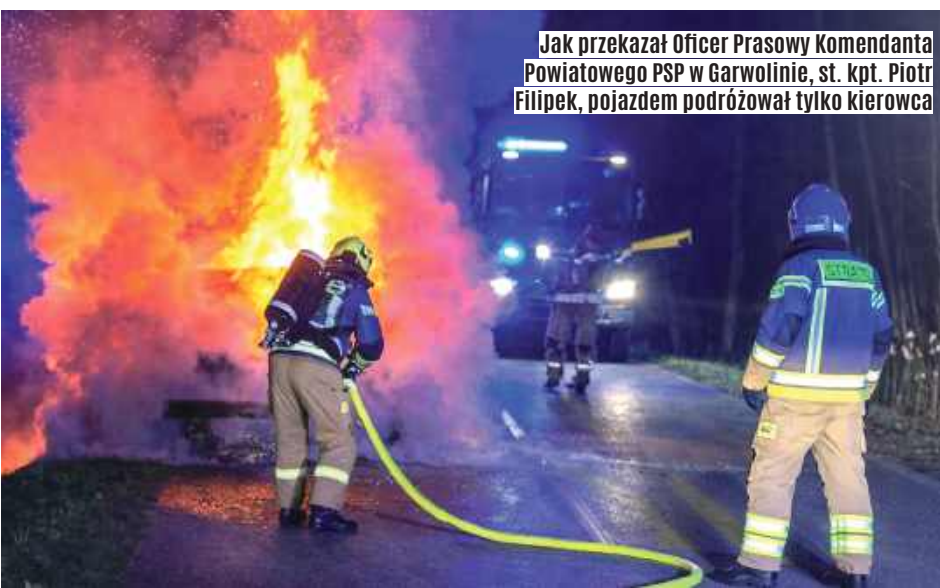
Auto w jednej chwili stanęło w płomieniach

Po dotarciu na miejsce strażacy zabezpieczyli teren oraz oświetlili miejsce zdarzenia. Następnie podali jeden prąd piany na palący