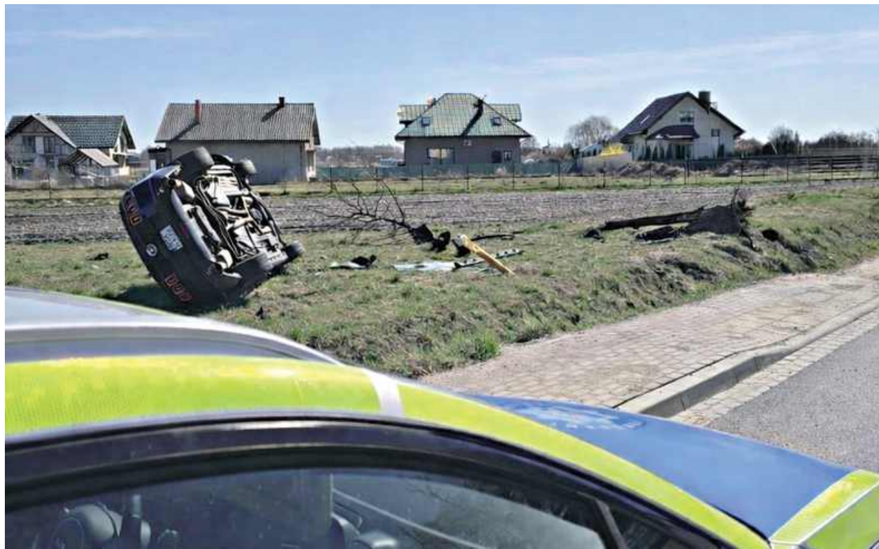
53-letni mężczyzna, mimo wcześniejszego zatrzymania przez policję, ponownie wsiadł za kierownicę, stwarzając poważne zagrożenie na drodze

pierwszy incydent z udziałem tego mężczyzny. Dzień wcześniej, 4 kwietnia, został on zatrzymany do kontroli w miejscowości Brzozów Kolonia. Wówczas badanie wykazało około 1,5 promila