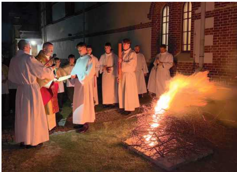
Podczas Wigilii Paschalnej celebrowano najradośniejszą, najbogatszą i najważniejszą Liturgię (Parafia Świętej Jadwigi Śląskiej w Samogoszczy)

Parafia Świętego Izydora Oracza w Marianowie: „Wigilia Paschalna jest najważniejszą nocą w roku liturgicznym. Nabożeństwo podzielone zostało na cztery części: Liturgię Światła, Liturgię Słowa Bożego, Liturgię Chrztelną i Liturgię Eucha-