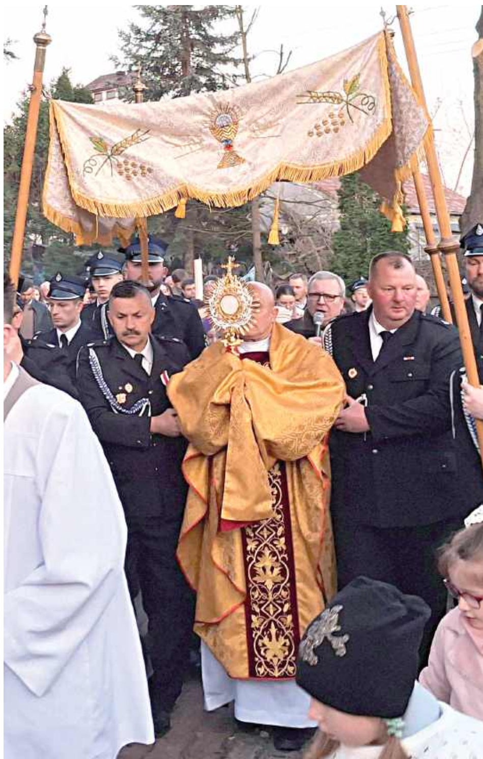
O świecie zgromadzili się, aby ogłosić światu radosną nowinę – Chrystus Zmartwychwstał! (Parafia Wniebowzięcia Najświętszej Maryi Panny w Wildze)