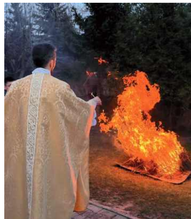
Podczas Wigilii Paschalnej uczczono zwycięstwo Jezusa nad śmiercią (Parafia WNMP w Wildze)