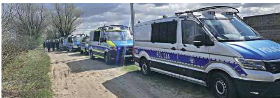
Każdego dnia kilkudziesięciu policjantów dokładnie sprawdzało tereny pól, łąk, lasów, pustostanów oraz rowów melioracyjnych

Poszukiwania 23-letniego mieszkańca Ciechanowa zakończyły się tragicznie. Ciało młodego mężczyzny zostało odnalezione po kilku dniach intensywnych działań poszukiwawczych prowadzonych przez policję.