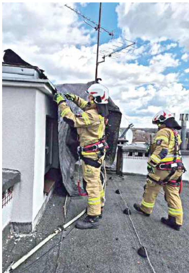
Strażacy z powiatu mieli pełne ręce roboty