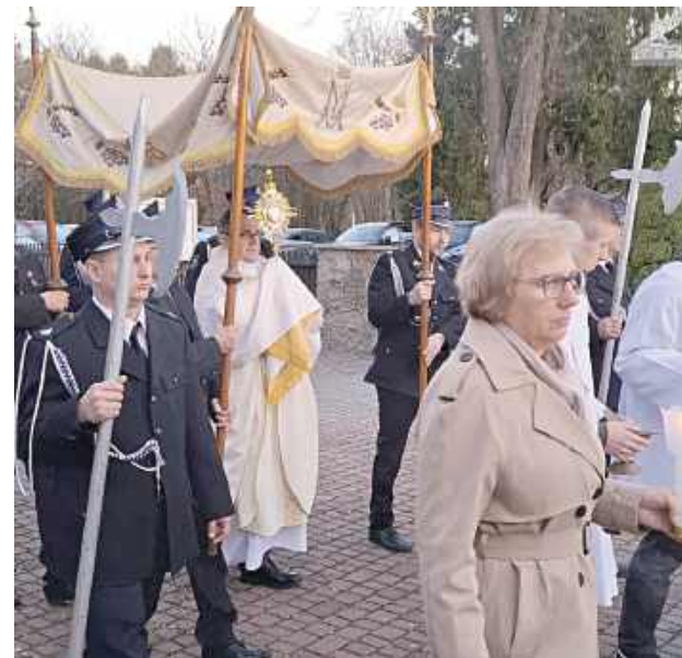
W Wielką Niedzielę rozpoczęły się uroczystości Wielkanocy od procesji rezurekcyjnej, po której została odprawiona uroczysta msza święta (Parafia Świętego Izydora Oracza w Marianowie)