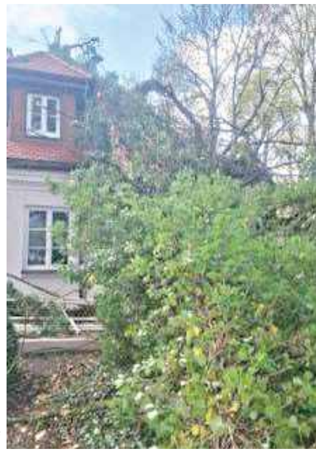
W Miętym drzewo runęło na zabytkowy dworek, powodując uszkodzenia obiektu.