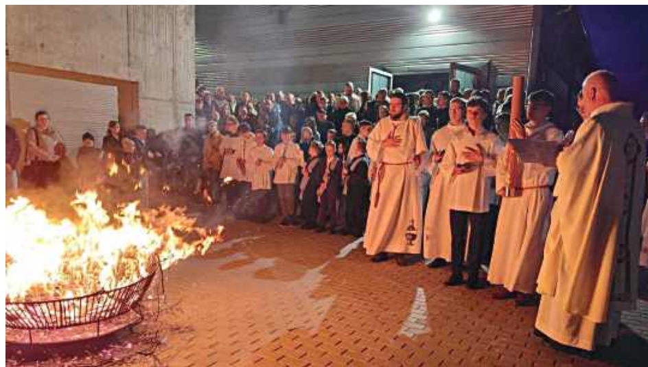
Płomień jednej świecy, paschału, rozświetlił panujący mrok (Parafia Świętego JPPI w Sulbinach)