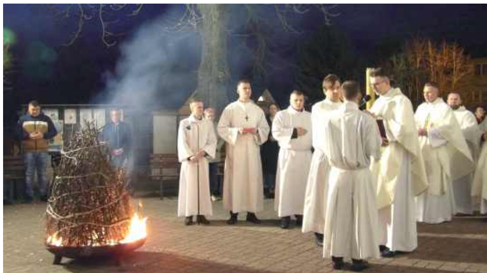
Wigilię Paschalną rozpoczęła Liturgia Światła – poświęcenie ognia i zapalenie Paschału, symbolu Chrystusa Zmartwychwstałego, który rozprasza ciemności (Parafia ZNMP w Żelechowie)