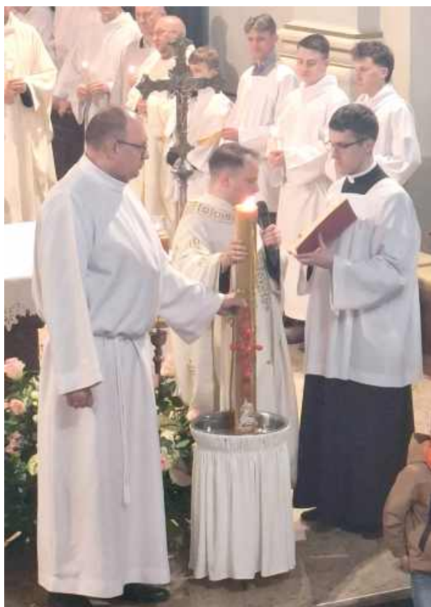
Kolegiata Przemienienia Pańskiego w Garwolinie: „Piękna wielkosobotnia liturgia dobiegła końca... Już wiemy, że ta noc zmieniła wszystko! Życie zwyciężyło śmierć! Alleluja!” (Kolegiata Przemienienia Pańskiego w Garwolinie)