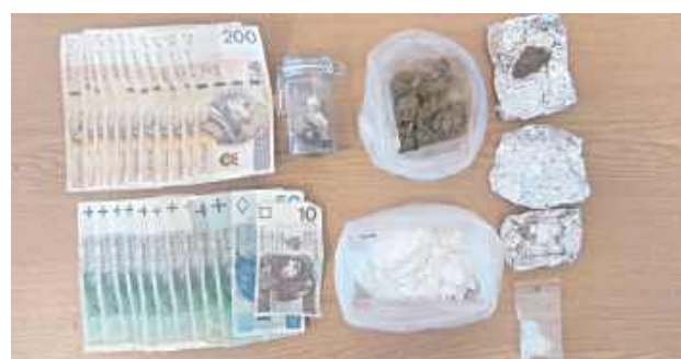
Do zatrzymań doszło na terenie gmin Pilawa i Garwolin

3 kwietnia policjanci zatrzymali 34-letniego mieszkańca powiatu garwolińskiego. W wyniku przeszukania jego pojazdu i zajmowanych przez niego pomieszczeń zabezpieczyli znaczne ilości środków odurzających i substancji psychotropowych. Analiza wykazała, że nielegalne substancje