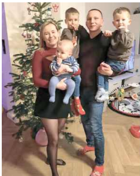
„Proszę, dołączcie do mojej walki i pomóżcie mi ją wygrać. Będę wdzięczna za każde wsparcie”