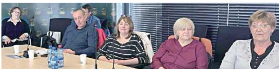
W Starostwie Powiatowym w Garwolinie odbyło się Walne Zgromadzenie Rejonowego Związku Spółek Wodnych

W Starostwie Powiatowym w Garwolinie odbyło się Walne Zgromadzenie Rejonowego Związku Spółek Wodnych. Spotkanie było okazją do podsumowania dotychczasowej działalności oraz omówienia najważniejszych wyzwań związanych z gospodarką wodną na terenie powiatu.