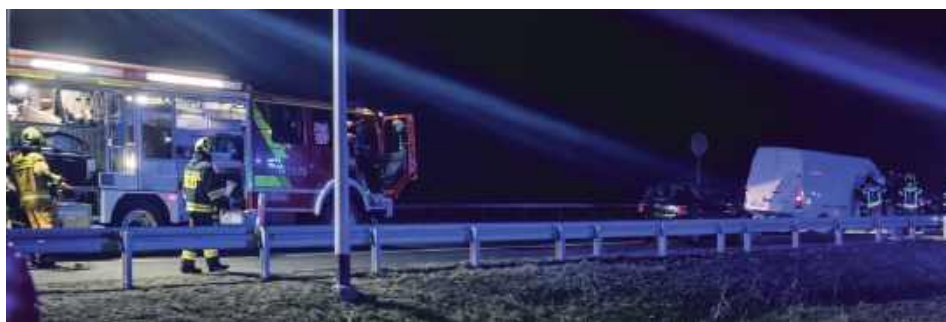
Mimo groźnie wyglądającego zdarzenia nie ma informacji o osobach poważnie poszkodowanych

Z informacji przekazanych przez policję wynika, że kierowca mercedesa sprintera nie dostosował prędkości do wa-