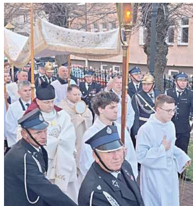
Kolegiata Przemienienia Pańskiego w Garwolinie: „Po wielkopostnych dniach, na nowo wybrzmiało radosne ALLELUJA podczas Mszy Świętej Rezurekcyjnej. Przyjmijmy dar pokoju od Zmartwychwstałego i nieśmy go wszędzie, dokąd idziemy” (Parafia Przemienienia Pańskiego w Garwolinie)