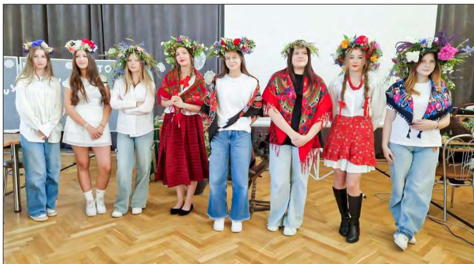
Podczas szkolnej imprezy królowały stroje i dekoracje nawiązujące do kultury ludowej