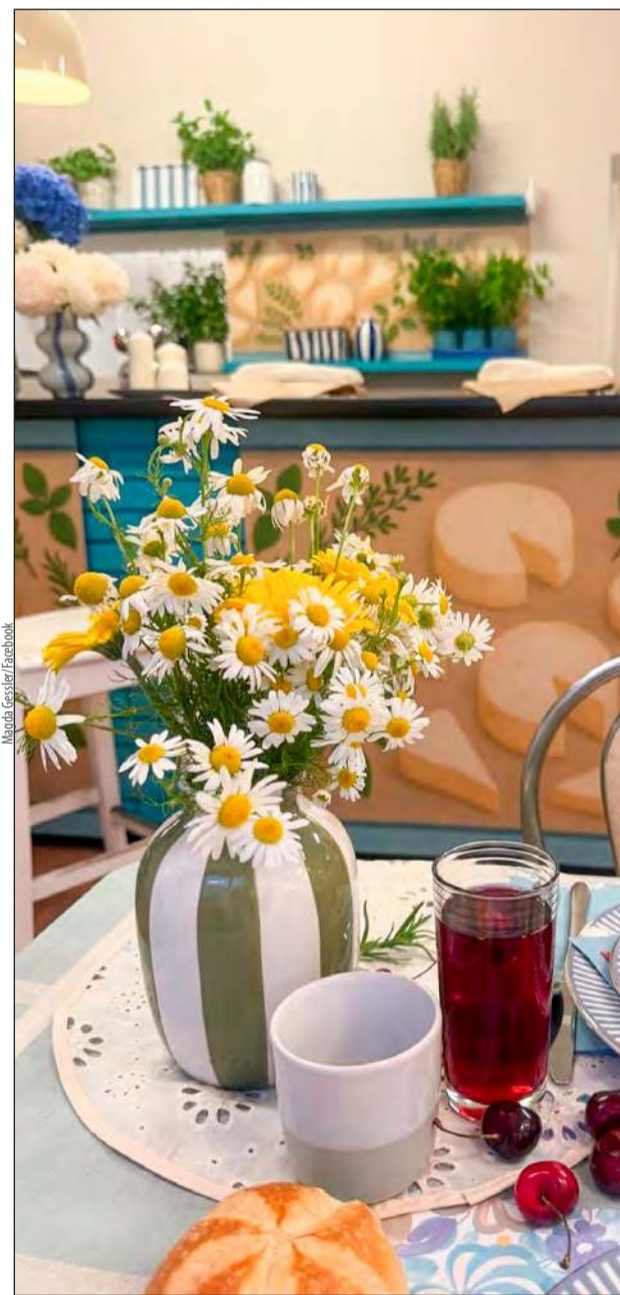
■ Magda Gessler uchyliła rąbka tajemnicy i pokazała kadr z wnętrza „Baru u Małgosi Świrk”

stanie wyemitowany jesienią na antenie stacji TVN.