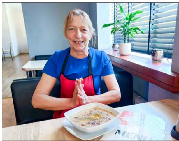
■ To właśnie przy tym stoliku we wtorek, 1 lipca, wieczorem siedziała Magda Gessler. Co zjadła „Pod Orłem” i czy jej smakowało? Dowiemy się jesienią w TVN