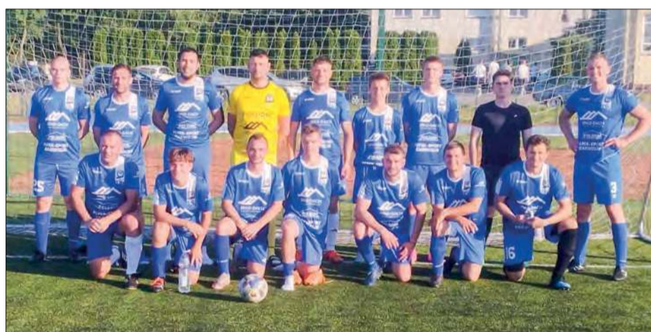
Hetman Sulbiny - wice mistrzowie I Ligi LZS w Garwolinie