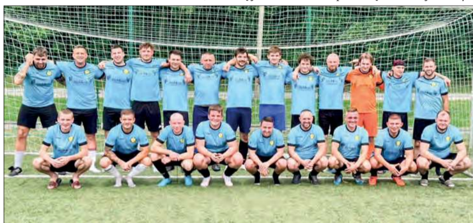
Wilk Wilkowyja - mistrzowie I Ligi LZS w Garwolinie