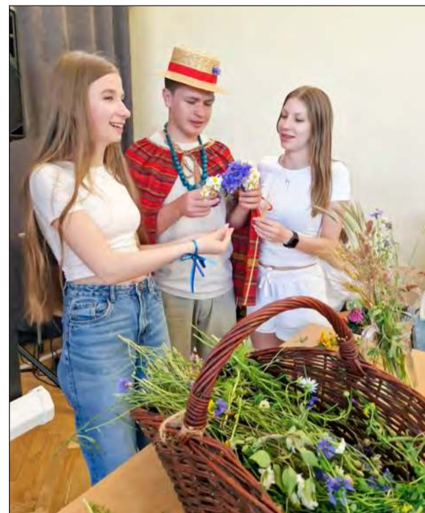
Uczniowie prezentowali m.in. pokaz wicia wianków z polnych kwiatów

- Dziękuję wszystkim zaangażowanym za pomysły i czas poświęcony na przygotowania: wychowawcom, nauczycielom przedmiotów i pracownikom niepedagogicznym za wspieranie