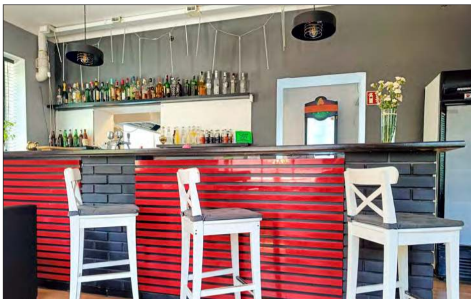
■ Tak było tuż przed rozpoczęciem spektakularnej przemiany restauracji „Pod Orłem”

Na początku nagrań restauracja próbowała funkcjonować, choć w ograniczonym zakresie. Gdy zadzwoniliśmy w środку