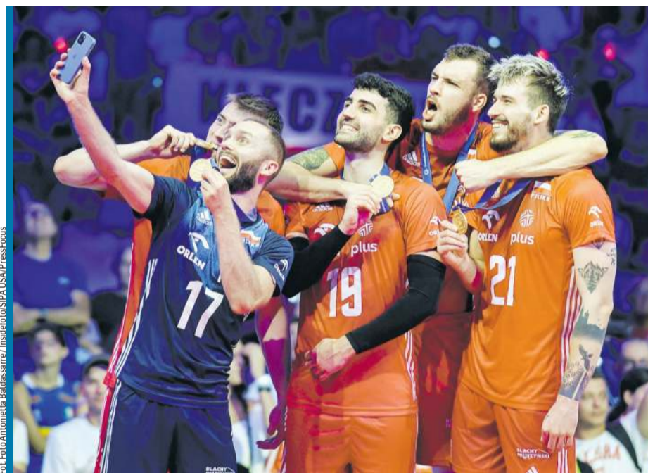
Paweł Zatorski z mediami społecznościowymi za pan brat. I z reprezentacyjnymi sukcesami też!