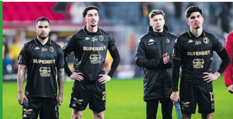
Takie humory towarzyszą piłkarzom, którzy są o krok od... liderowania ekstraklasie.

Jak to możliwe, że w ostatnich dziesięciu ligowych meczach Ja-