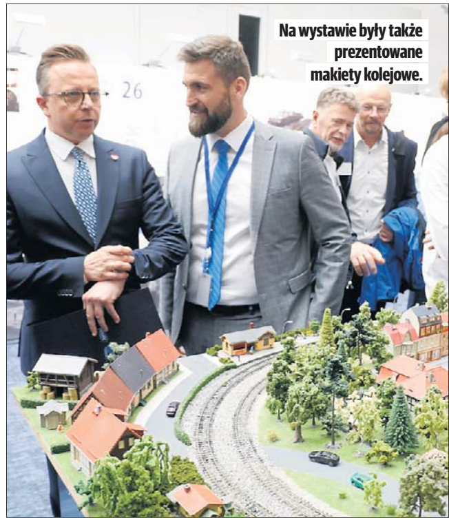
Na wystawie były także prezentowane makiety kolejowe.

- Jest już konkretny projekt na stole. Wchodzimy na jedną stronę, sprawdzamy rozkład jazdy i jeśli chcemy pojechać z Łodzi do Paryża, moglibyśmy kupić jeden bilet na całą trasę. Bez konieczności kupowania trzech czy czterech różnych biletów u różnych przewoźników - tłumaczył europoseł.