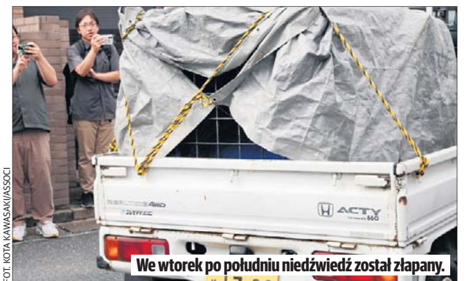
We wtorek po południu niedźwiedź został złapany.