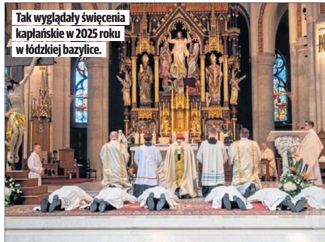
Tak wyglądały święcenia kapłańskie w 2025 roku w łódzkiej bazylice.