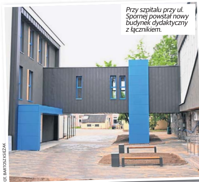
Przy szpitalu przy ul. Spornej powstał nowy budynek dydaktyczny z łącznikiem.

Ale przy Spornej sporo zmieni się też dla pacjentów. Od lipca działać będzie tu lądowisko dla helikopterów. Do tej pory dzieci przywożone były karetkami z lądowisk przy szpitalach Kopernika, Matce Polce czy CSK nr 2.