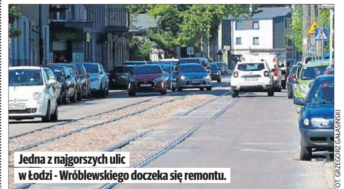
Jedna z najgorszych ulic w Łodzi - Wróblewskiego doczeka się remontu.

w ciągu al. Włókniarzy (przy dworcu Łódź Kaliska) rozpocznie się w połowie czerwca 2026 roku. Prace obejmą estakadę prowadzącą w kierunku al. Jana Pawła II (na południe). Estakada zostanie całkowicie zamknięta dla ruchu. Kierowcy będą poruszać się w obu kierunkach po estakadzie wschodniej. Dostępna będą także jezdnie dolne w obu kierunkach, choć mogą tam pojawiać się punktowe zamknięcia. Roboty potrwać łącznie około 18 miesięcy, uтрудnienia w tym rejonie mają zakończyć się pod koniec 2027 roku. Prace przygotowawcze i zmiany w organizacji ruchu wystartują już w drugiej połowie czerwca, a plac budowy zostanie przejęty przez wykonawców na przełomie czerwca i lipca.