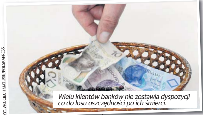
Wielu klientów banków nie zostawia dyspozycji co do losu oszczędności po ich śmierci.

Nie trzeba więc chodzić od banku do banku z dokumentami spadkowymi i pytać każdy z osobą, czy prowadził konto dla konkretnej osoby.