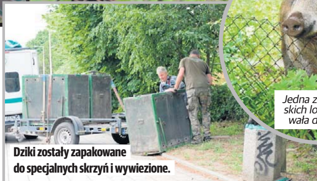
Jedna z widzewskich loch pozowała do zdjęć.

- Ja widuję je często. Co prawda przez okno - sama nie wychodzę, bo mam problemy ze