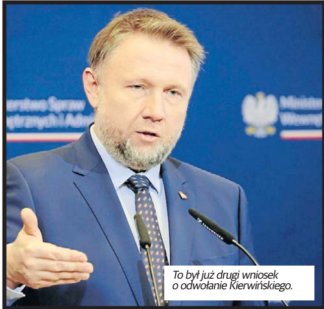
To był już drugi wniosek o odwołanie Kierwińskiego.