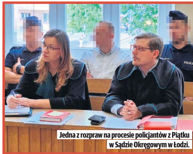
Jedna z rozpraw na procesie policjantów z Piątku w Sądzie Okręgowym w Łodzi.