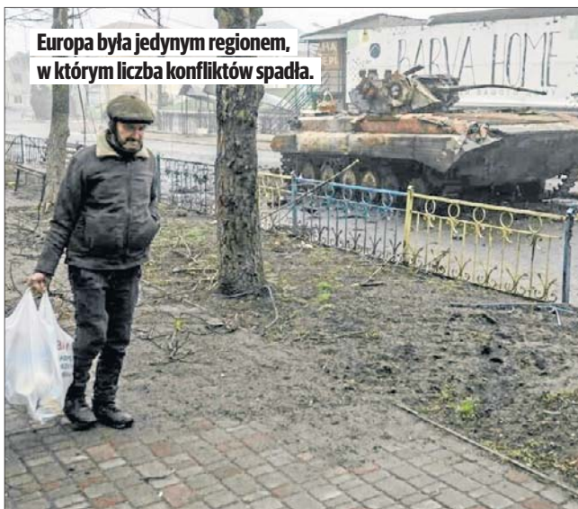
Europa była jedynym regionem, w którym liczba konfliktów spadła.

W raporcie „Trendy konfliktowe” wymieniono 65 starć, w które zaangażowane jest co najmniej jedno państwo. Wśród nich znajduje się osiem konfliktów międzypaństwowych. Oprócz rosyjskiej inwazji na Ukrainę badacze wymieniają tu starcia graniczne między In-