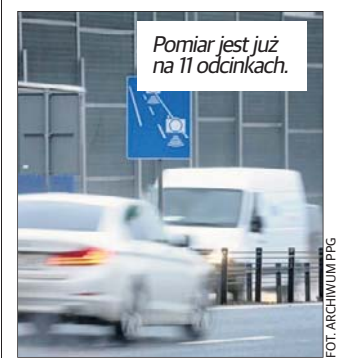
Pomiar jest już na 11 odcinkach.

rzy muszą stosować się do obowiązującego ograniczenia prędkości na całej długości monitorowanej trasy. Z doświadczeń CANARD wynika, że w miejscach objętych nadzorem z wykorzystaniem opp, następuje znaczący spadek liczby zdarzeń drogowych. Zmieniają się też zachowania kierowców - zdecydowana większość zdejmuję nogę z gazu. Nadzór nad odcinkami dróg, których infrastruktura umożliwia rozwijanie dużych prędkości, ma doprowadzić do ograniczenia występowania tragicznych w skutkach zdarzeń drogowych.