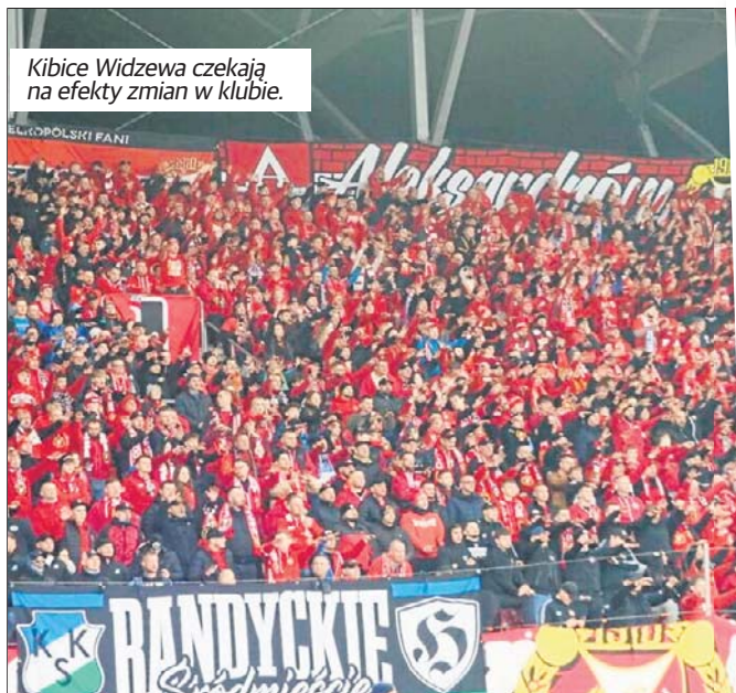
Kibice Widzewa czekają na efekty zmian w klubie.