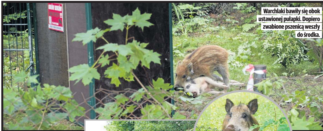
Warchlaki bawiły się obok ustawionej pułapki. Dopiero zwabione pszenicą weszły do środka.

Wczoraj wczesnym popołudniem przy ul. Dostojewskiego odłowiono żerujące tam od kilku miesięcy stadko dzików. Dwie lochy i kilka warchlaków złapano dzięki zastosowaniu specjalnej pułapki, zapakowano do specjalnych skrzyń i wywieziono autem Ośrodka Rehabilitacji Dzikich Zwierząt. Co dalej się z nimi stanie? Najprawdopodobniej zostaną uśpione, ubite, a potem zutylizowane.