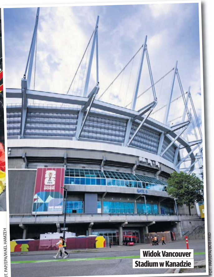
Widok Vancouver Stadium w Kanadzie

Faza grupowa potrwa od 11 do 28 czerwca. Następnie rozegrana zostanie 1/16 finału, 1/8 finału, ćwierćfinały, półfinały, mecz o trzecie miejsce i finał.