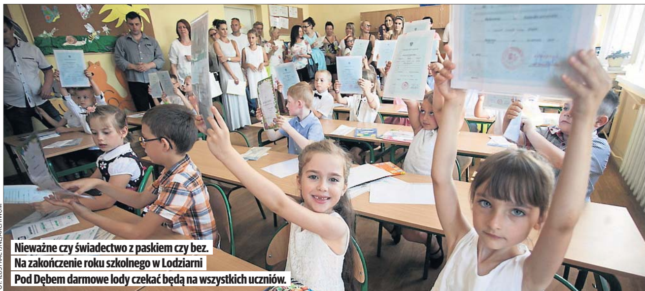
Nieważne czy świadectwo z paskiem czy bez. Na zakończenie roku szkolnego w Łodziarni Pod Dębem darmowe lody czekać będą na wszystkich uczniów.

Wszystko zaczęło się od emocjonalnego wpisu, ja-