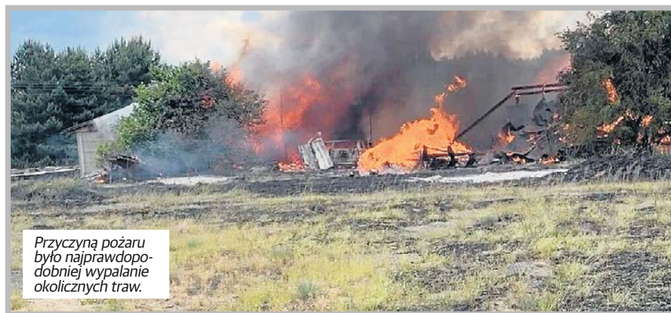
Przyczyną pożaru było najprawdopodobniej wypalanie okolicznych traw.

Jak ustalili strażacy, przyczyną pożaru było najprawdopodobniej wypalanie okolicznych traw.