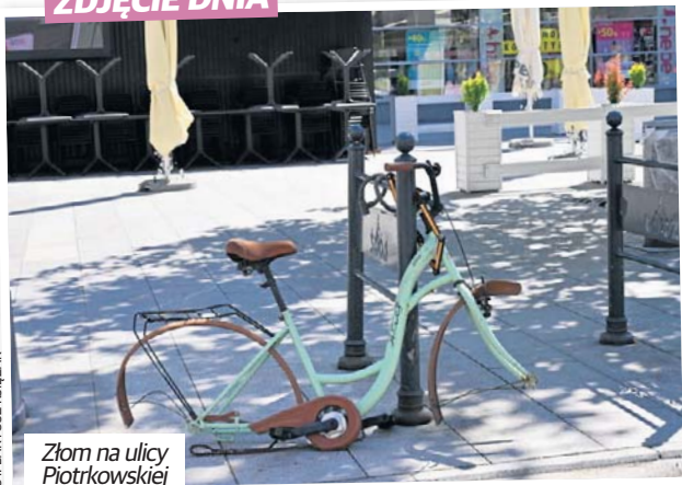
Złom na ulicy Piotrkowskiej