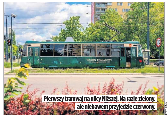
Pierwszy tramwaj na ulicy Niższej. Na razie zielony, ale niebawem przyjedzie czerwony.

- W wakacje nowy odcinek torów będzie już wykorzystywany przez tramwaje linii 13 - mówi wiceprezydent Łodzi, Tomasz Piotrowski.