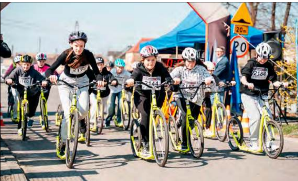
Młodzież poznała czym jest duch rywalizacji.

Pierwszy dzień wiosny w gminie Walce upłynął pod znakiem sportowej rywalizacji i aktywności fizycznej. 21 marca uczniowie szkół podstawowych postanowili uczcić nadejście nowej pory roku w sposób pełen energii - biorąc udział w ekscytującym wyścigu na hulajnogach. To wyjątkowe wydarzenie odbyło się w ramach Dni Partnerstwa i stanowiło doskonałą alternatywę dla tradycyjnego Dnia Wagarowicza.