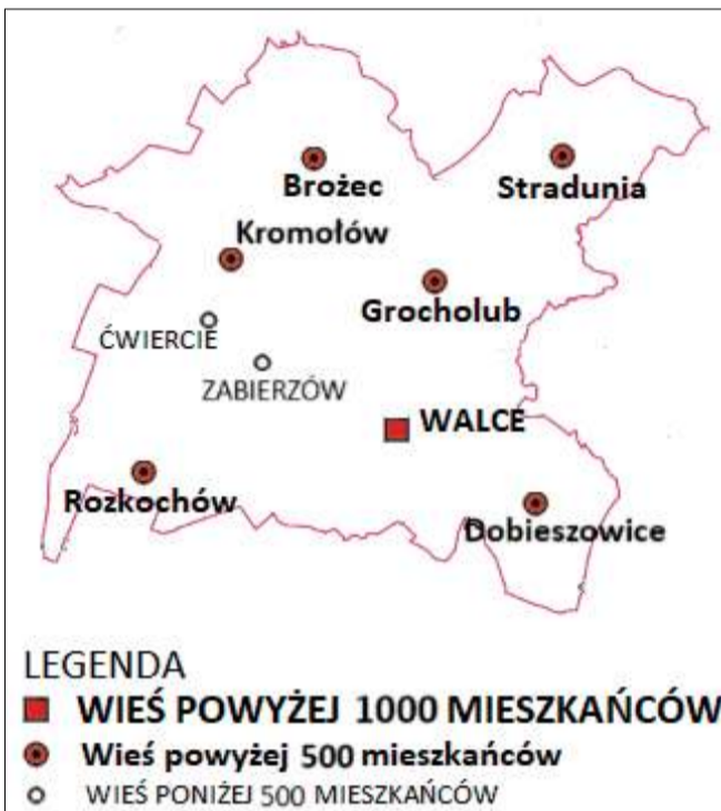
Liczba ludności sołectw gminy Walce w 1885 roku.

Niespełna półtorej wieku temu wydany został Leksykon Gmin Prowincji Śląskiej. Zawiera on dane dotyczące śląskich miast i wsi, zebrane podczas spisu powszechnego, jaki odbył się w Cesarstwie Niemieckim 1 grudnia 1885 roku. Dzięki niemu możemy między innymi dokładnie odtworzyć, jak duże były wówczas miejscowości dzisiejszej gminy Walce.