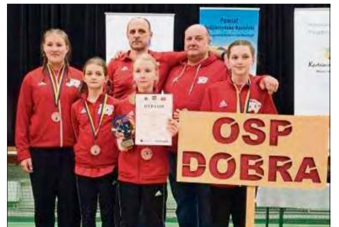
Drużyna chłopców MDP Dobra została okrzyknięta mianem wicemistrzów Opolszczyzny.

Podczas zawodów chłopcy z MDP Zielina zajęli 20.