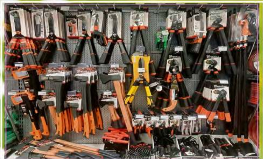
Ręczne i akumulatorowe narzędzia ogrodnicze