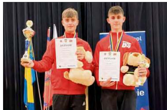
Były też indywidualne sukcesy młodych mieszkańców gminy Strzeleczyński.