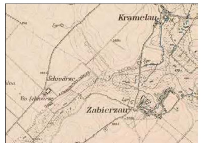
Zabierzów, Ćwiercie i część Kromolowa na mapie z 1883 roku.

Ćwiercie z Brzezina liczyły 36 budynków, w tym 15 we wsi i 21 w majątku. Domów mieszkalnych było 19, z czego 13 na terenie wiejskim i 2 na obszarze dworskim. Miejscowość zajmowała powierzchnię 218 hektarów, z czego 192 hektary przypadały na majątek, a 26 hektarów na wieś. 197 hektarów zajmowały pola