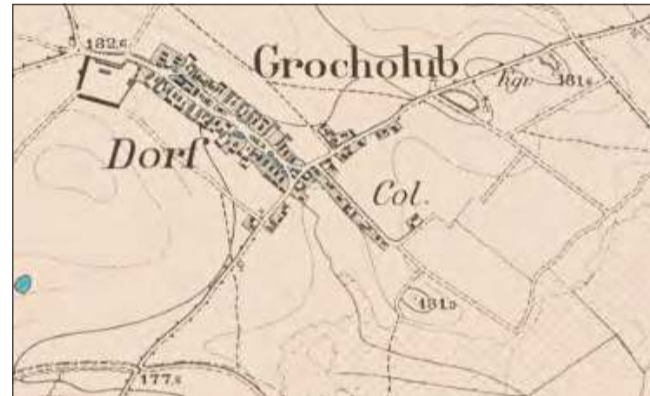
Mapa Grocholubia z 1883 roku.

mi przypadkami tego typu. Prawie cała miejscowa populacja była katolicka, gdyż lokalna wspólnota liczyła 538