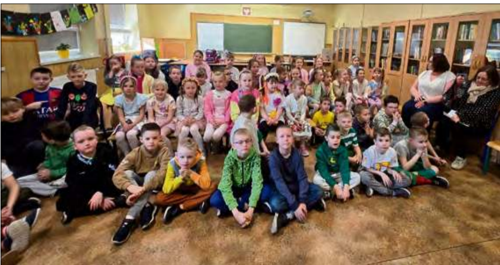
W Szkole Podstawowej w Strzeleczyńsku z przytupem powitano wiosnę.

W Szkole Podstawowej w Strzeleczyńsku z przytupem powitano wiosnę. Dzieci i młodzież miały wiele pomysłów, jak skutecznie przegonić surową zimę.