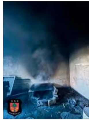
Do zadymienia doszło w tym samym miejscu co tydzień wcześniej.

Jednostki straży pożarnej wyjechały do pożaru, do którego po raz kolejny doszło w zrujnowanych pomieszczeniach pałacu w Kujawach. Podobne zdarzenie miało miejsce tydzień wcześniej.