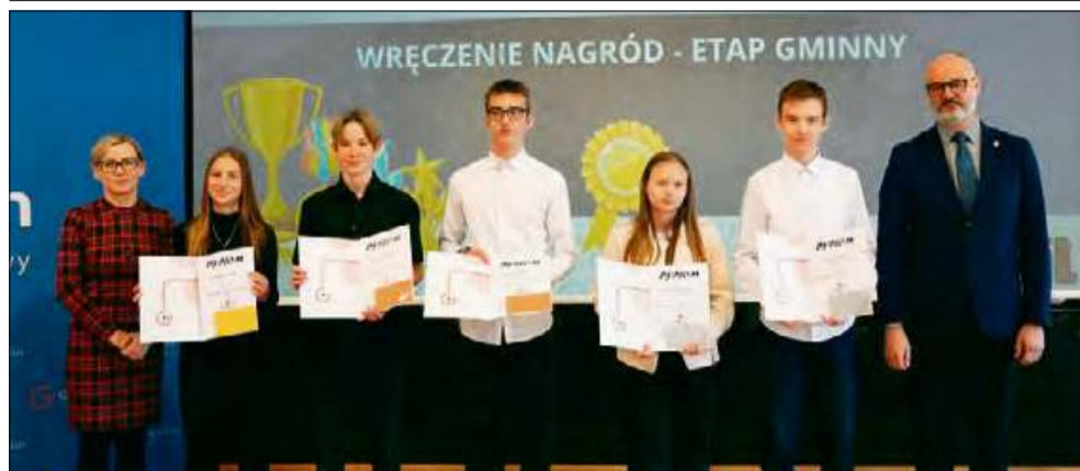
Młodych talentów w gminie Gogolin nie brakuje.

W Gminnym Centrum Kultury w Gogolinie odbyło się uroczyste wręczenie nagród dla uczniów, którzy osiągnęli najwyższe wyniki w wojewódzkich konkursach przedmiotowych na szczeblu gminnym. Wydarzenie miało miejsce w środę 19 marca.