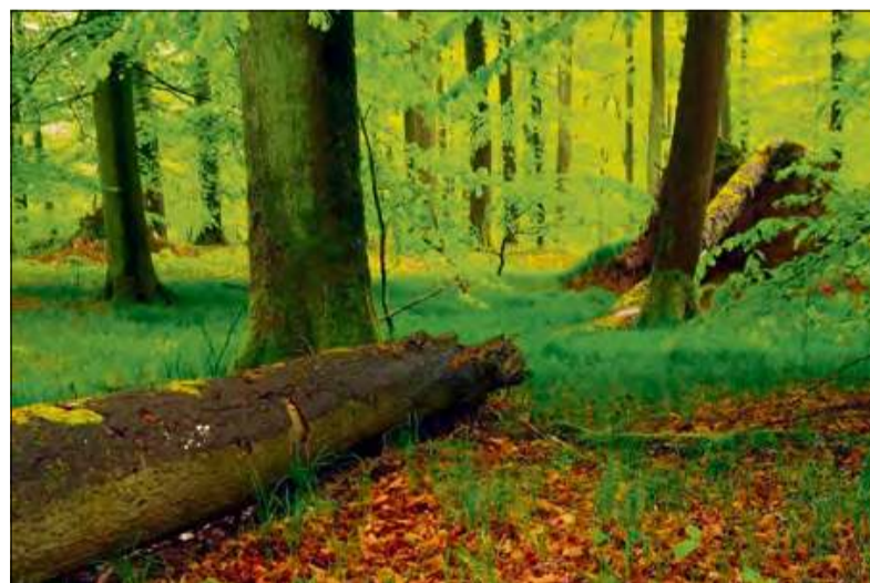
Martwe drzewa pozytywnie wpływają na bioróżnorodność.

Drzewa te, ze względu na swoje właściwości, mają szczególne znaczenie dla flory i fauny i nazywane są drzewami biotopowymi. Stanowią one ważne siedlisko dla wielu specjalistycznych gatunków zwierząt i roślin. W lasach naszych żyje około 11 000 gatunków, w tym porosty, mchy, grzyby, chrząszcze, ślimaki, ptaki i ssaki. Od 20 do 50% tych gatunków zależy od obecności martwego drzewa, które jest kluczowym czynnikiem wpływającym na skład gatunkowy i