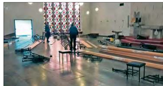
Ławki pochodzą z kościoła w Nordstemmen w Niemczech.

W dniach od 13 do 15 marca grupa osób z Parafii Rzymskokatolickiej św. Anny i św. Joachima w Gogolinie-Karłubcu udała się do Nordstemmen w Niem-