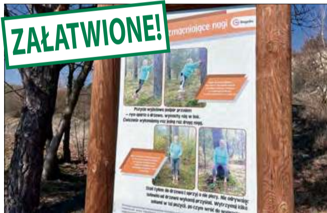
Tablice zostały wyczyszczone.

Bazgroły nikomu nie przeszkadzały przez dobrych kilka tygodni. Sytuacja diametralnie zmieniła się po publikacji materiału na ten temat w naszej gazecie. Po nagłośnieniu sprawy tablice zostały wyczyszczone. Po malowidłach nie ma ani śladu.