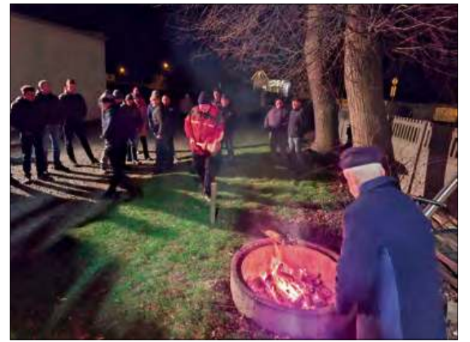
W Strzeleczyńsku mężczyźni zgromadzili się wokół ognia.

Dodajmy, że dzień świętego Józefa miał również miejsce w Raclawiczkach. Obchody odbyły się w so-