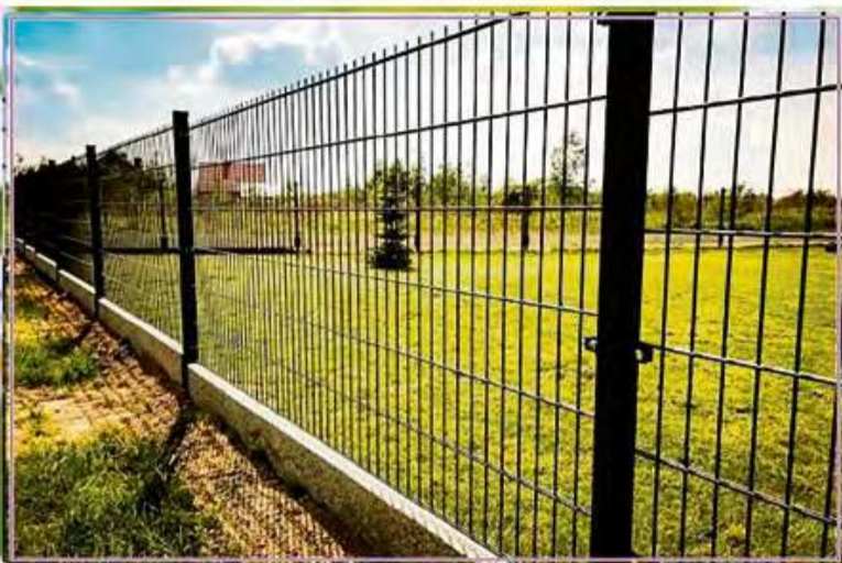
System paneli ogrodzeniowych