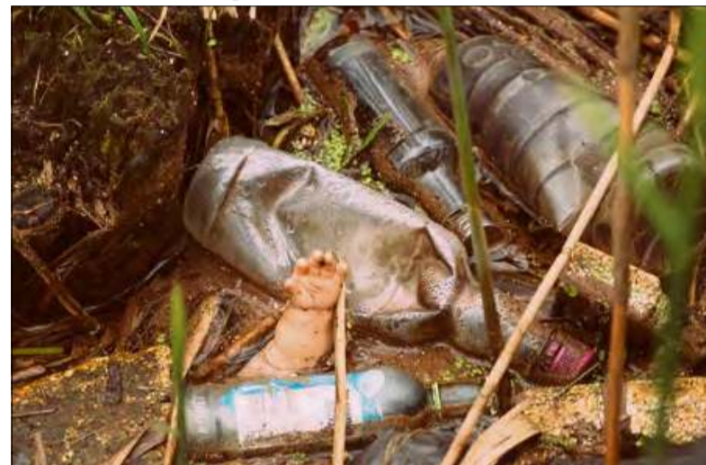
Jednorazowe puszkę, butelki plastikowe i szklane (szczególnie po alkoholach, piwie i wódkach!) to plaga rzek, plaż i wydm.

i Bałtyk przed zaśmieceniem, takich jak Recykling Rejsów, Akcja Czysta Odra czy Akcja Czysta Wisła - organizowanych w ramach kampanii #MniejPlastiku. Wspólnie z Oponeo.pl zainicjował Kręci Nas Recykling