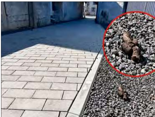
Właściciele psów powinni sprzątać po swoich pupilkach.

Mieszkańcy Gogolina skarżą się, że wyremontowana ulica Ciemna stała się miejscem, które w żaden sposób nie spełnia podstawowych standardów czystości. „Psie odchody są na każdym kroku. Mam wrażenie, że wchodzę na pole minowe” - interweniuje nasz czytelnik.