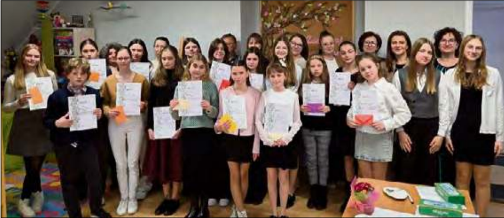
Każdy uczestnik otrzymał pamiątkowy dyplom.

W Strzeleczyńsku odbył się Gminny Konkurs Recytatorski. To była już XIV edycja tego wydarzenia.