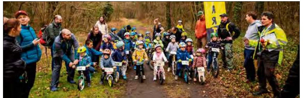
Mistrzostwa rozpoczęły się od startu dzieci.

W sercu Opolszczyzny odbyła się druga edycja Mistrzostw OKR MTB CX. W zawodach wzięło udział ponad 200 miłośników kolarstwa górskiego - zarówno doświadczeni zawodnicy, jak i amatorzy spragnieni sportowych wyzwań. Trasa poprowadzona po terenie lasu wokół otmęckiego stadionu obfitowała w techniczne podjazdy, błotniste odcinki i piaszczyste fragmenty, które wymagały od uczestników pełnego zaangażowania i determinacji.