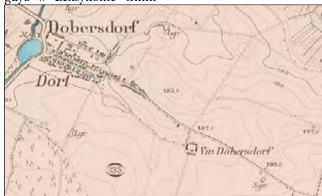
Dobieszowice na mapie z 1883 roku.

Na szóstym miejscu w naszym zestawieniu znalazł się Kromolów. W tym przypadku mamy do czynienia z wyjątkowo prostą sytuacją, gdyż w Leksykonie Gmin