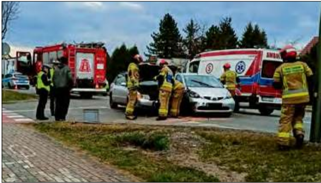
Na szczęście nikt nie ucierpiał, jednak sprawczynie otrzymała mandat.

W niedzielę rano na ulicy Krapkowickiej w Gogolinie doszło do kolizji dwóch pojazdów. 70-letnia kierująca toyotą wymusiła pierwszeństwo, doprowadzając do zderzenia z audi prowadzonym przez 23-latkę. Na szczęście nikt nie ucierpiał, jednak sprawczynie otrzymała mandat.