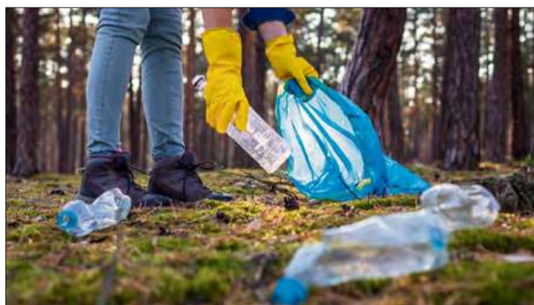
Statystyczny mieszkaniec naszego kraju wytwarza ich aż 355 kg śmieci rocznie.

Najlepiej codziennie. I nie chodzi tylko o niezaśmiecanie