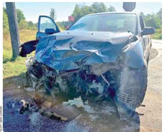
Kierowca Mazdy nie ustąpił pierwszeństwa przejazdu DAF-owi