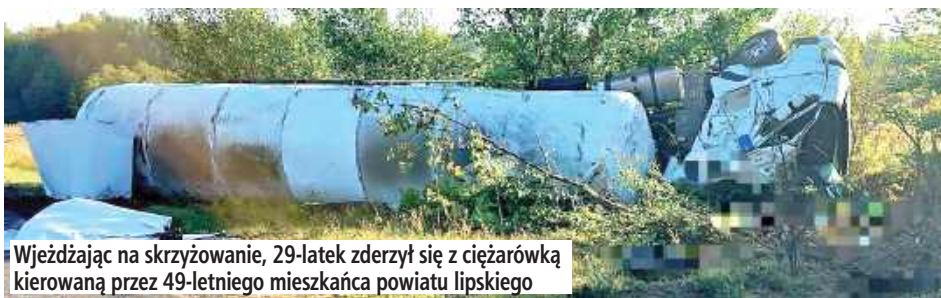
Wjeżdżając na skrzyżowanie, 29-latek zderzył się z ciężarówką kierowaną przez 49-letniego mieszkańca powiatu lipskiego

Kierujący Mazdą 29-letni mieszkaniec powiatu opolskiego, wyjeżdżając z drogi podporządkowanej, nie ustąpił pierwszeństwa przejazdu i uderzył w bok naczepy samochodu ciężarowego marki DAF.