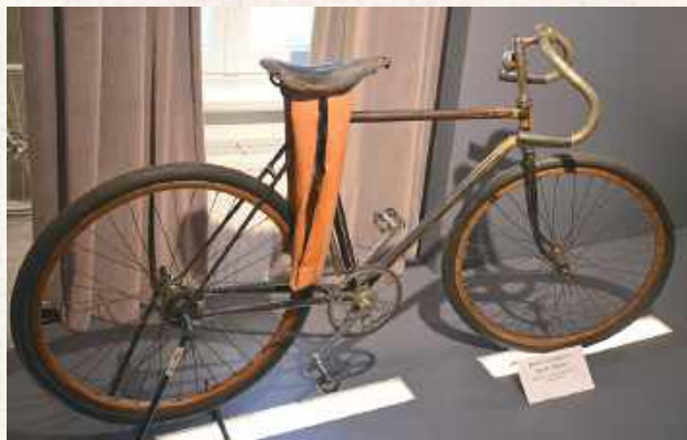
Rower wystawiany w Muzeum Augusta Zamoyskiego w Jabłoni, na którym artysta przejechał z Paryża do Zakopanego, ale pochodzi z tej samej firmy i nieznacznie się od niego różni

August Zamoyski każdą okazję do wykazania się tężyzną fizyczną, narobienia wokół siebie dużo zamieszania i dobrej zabawy wital z wielkim entuzjazmem.