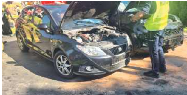
Jedna kierująca nie ustąpiła pierwszeństwa drugiej

- 77-latką kierującą Seatem nie ustąpiła pierwszeństwa