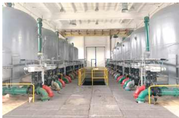
Stacja Uzdatniania Wody w Łęcznej

W mieście realizowana będzie inwestycja za ponad 40 mln zł w system uzdatniania wody. Wszystko dzięki wysoko ocenionemu wnioskowi, który otrzymał najwyższe dofinansowanie w województwie lubelskim i zajął 7. miejsce w Polsce.