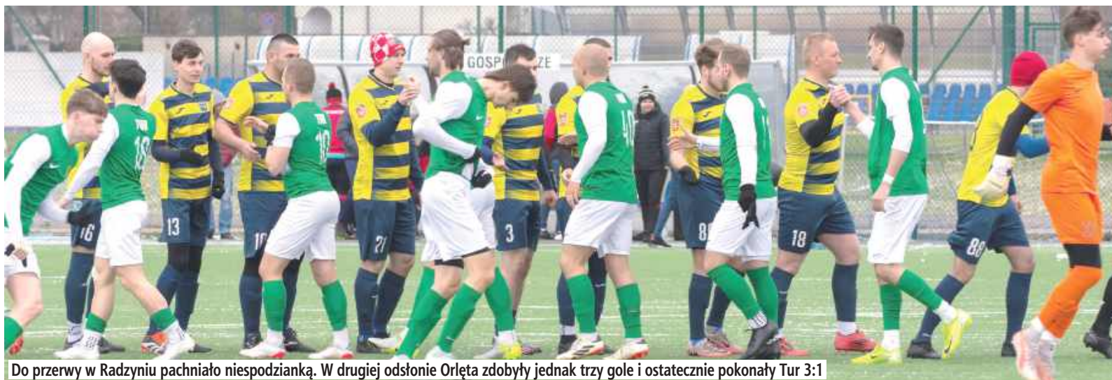
Do przerwy w Radzynie pachniało niespodzianką. W drugiej odsłonie Orleńscy zdobyli jednak trzy gole i ostatecznie pokonali Tur 3:1

Do przerwy w Radzynie pachniało niespodzianką. W drugiej odsłonie Orleńscy zdobyli jednak trzy gole i ostatecznie pokonali Tur 3:1.