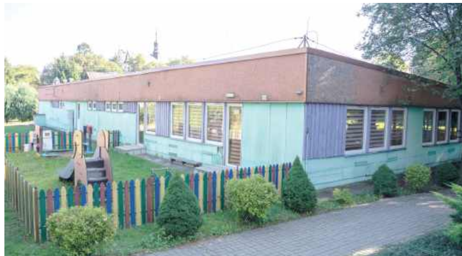
Przedszkole przed rozbiorą