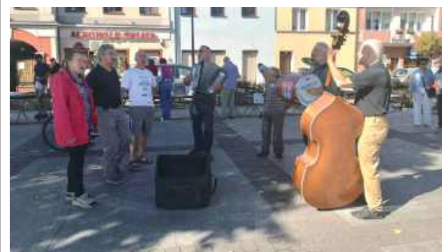
Lewartowianie przygrywali na giełdzie staroci w sobotę

Na sobotniej giełdzie pojawiła się nowość - wystawcom i oglądającym przygrywała kapela Lewartowianie. Jak zwykle można było obejrzeć lub kupić antyki - stare obrazy, zdjęcia, pocztówki, książki, monety, znaczki pocz-