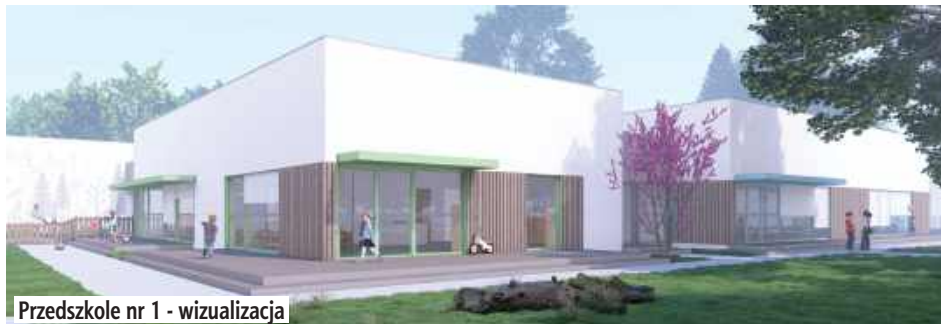
Przedszkole nr 1 - wizualizacja