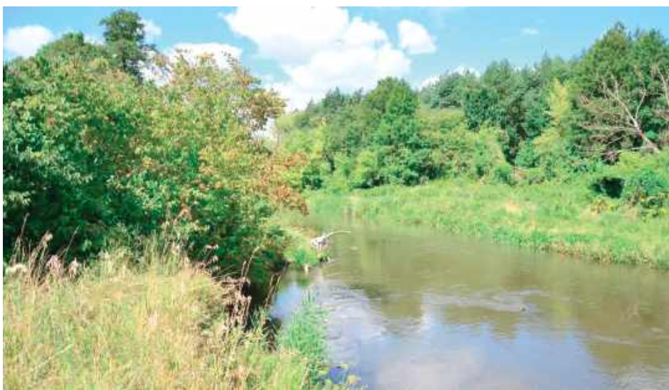
Rezerwat Zakrzów w gminie Łęczna stanowi znaczący dodatek do sieci chronionych terenów w Polsce – zarówno pod względem ekologicznym, jak i w kontekście zachowania rzadkich gatunków

Nowe obszary to „Kahiza” w Nadleśnictwie Parczew, „Starodrzew Sosnowy” w Nadleśnictwie Chełm oraz „Zakrzów” w Nadleśnictwie Świdnik. Ten ostatni znajduje się w gminie Łęczna. Rezerwat Zakrzów obej-