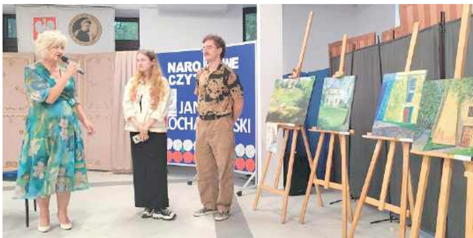
Spotkanie literatury, muzyki i sztuki stało się świętem słowa i dowodem, że klasyka potrafi poruszać także współczesne serca

Po części literackiej przyszedł czas na sztuki plastyczne. Odbył się wernisaż poplenerowej wystawy studentów Wydziału Sztuk Pięknych Uniwersytetu Mikołaja Kopernika w Toruniu. Zestawienie malarstwa i poezji stworzyło spójną przestrzeń refleksji i rozmów, którą dopełnił wspólny uczestunek.