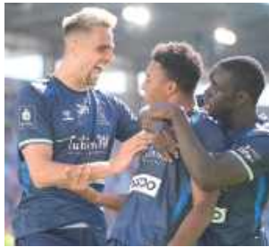
Radość Motoru z gola na 1:2

Spotkanie nie rozpoczęło się dobrze dla defensywy Motoru. Już w 6. minucie rywale otworzyli bowiem wynik, po tym, jak