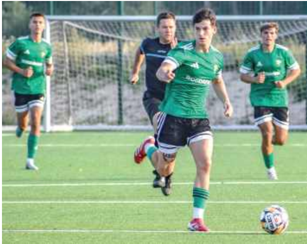
Górnik II Łęczna nie pozostawił Wisłę Puławy złudzeń. Rywale mieli nadzieję na punkty tylko przez pierwsze 45 minut

W drugim z czterech spotkań w roli gościa zielono-czarnym rękawice chciała rzucić Wisła Puławy. Zasłużony klub trapiący problemami finansowymi notuje twarde zderzenie z realiami ligi okręgowej i po czterech kolejkach z zerem „oczek” na koncie oku-