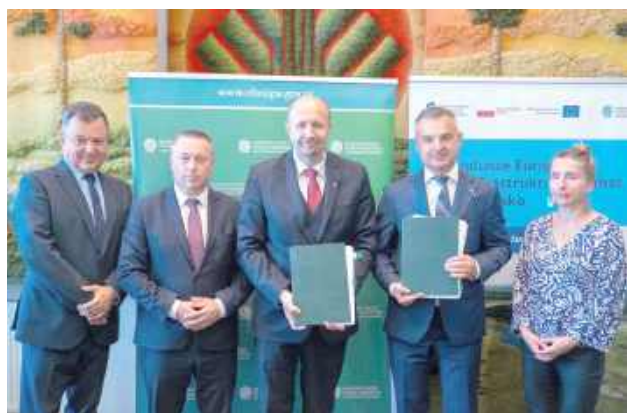
Podpisanie umowy - stacja uzdatniania Łęczna