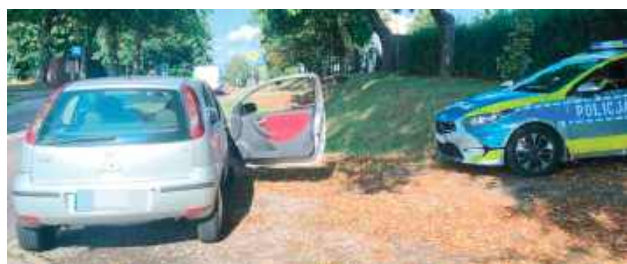
Kierowca Opla przełożył tablice rejestracyjne z innego pojazdu. Będzie za to odpowiadał przed sądem

Mieszkaniec powiatu puławskiego wpadł w ręce policji w miniony piątek, 12 września, gdy jechał Oplem w obszarze