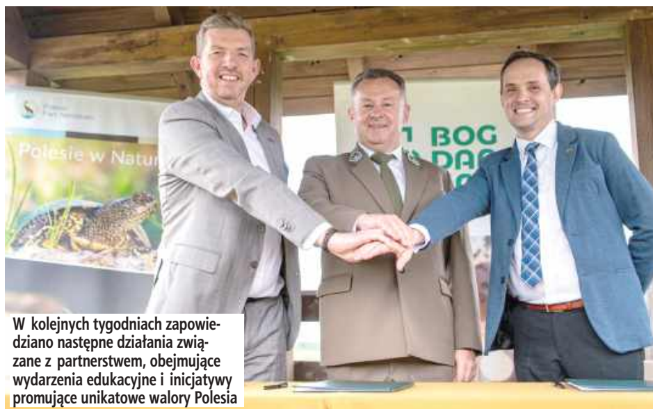
W kolejnych tygodniach zapowiedziano następne działania związane z partnerstwem, obejmujące wydarzenia edukacyjne i inicjatywy promujące unikatowe walory Polesia

Podczas meczu zrealizowano symboliczny punkt projektu – drużyna Górnika wystąpiła w specjalnych strojach, na których jednym