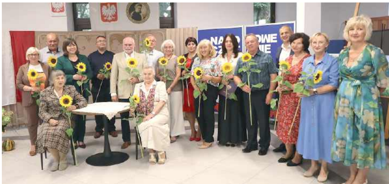
Utwory Jana Kochanowskiego mimo upływu wieków wciąż niosą aktualne przesłanie