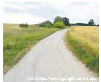
O gruntowną poprawę stanu technicznego drogi, a przede wszystkim utwardzoną nawierzchnię mieszkańcy gminy Siedliszcze apelują od lat.

- Obecnie nieregulowany pozostaje stan prawny działek, na których zlokalizowana jest droga powiatowa. W takiej sytuacji nie ma możliwości ogłoszenia przetargu na opracowanie dokumentacji technicznej niezbędnej do realizacji inwestycji drogowej. Po uregulowaniu stanu prawnego działek oraz zapewnieniu odpowiednich środków finansowych