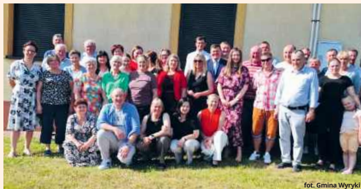
fol. Gmina Wyryki

– Dziękuję Radzie Gminy Wyryki za udzielenie mi wo-