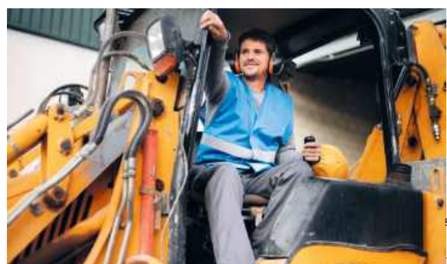
Gmina Dubienka chciałaby pozyskać dofinansowanie na gruntowną modernizację ul. Kościelnej. W tym celu radni podjęli uchwałę w sprawie zmiany statusu tej drogi.

Uchwała wejdzie w życie po upływie 14 dni od dnia ogłoszenia w Dzienniku Urzędowym Województwa Lubelskiego. Dla mieszkańców oznacza to pierwszy formalny etap przygotowań do przebudowy drogi, która - jeśli gmina pozyska rządowe dofinansowanie - ma zostać gruntownie zmodernizowana. RC