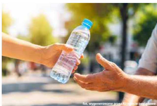
fol. wygenerowane przez AI/zdjęcie poglądowe

● GM. IZBICA W związku z trwającą falą intensywnych upałów mieszkańcy miasta i gminy Izbica mogą skorzystać z bezpłatnej wody pitnej. Samorząd uruchomił punkty dystrybucji i apeluje o zachowanie szczególnej ostrożności podczas gorących dni.