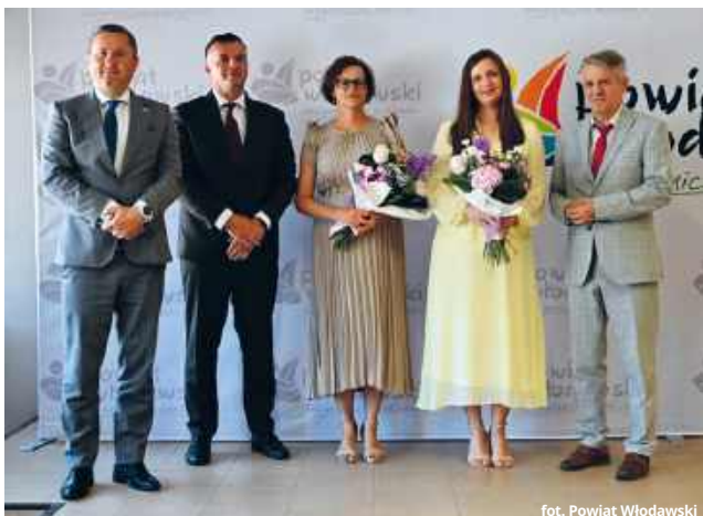
fol. Powiat Włodawski

Przed głosowaniem przedstawiono projekt uchwały absolutoryjnej, opinie komisji oraz wnioski Komisji Rewizyjnej. Radni zapoznali się również z uchwałą Składu Orzekającego Regionalnej Izby Obrachunkowej w Lublinie z 20 maja