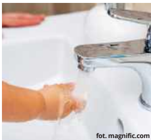
Mieszkańcy Rejowca Fabrycznego z niecierpliwością oczekują na poprawę jakości wody w miejskiej sieci wodociągowej.

W ostatnich dniach mieszkańców miasta zaniepokoił kolor płynącej z kranów wody. Nigdy nie była kryształicznie czysta, ale tym razem - jak poinformował nas jeden z Czytelników - uległa zmętnieniu i przybrała ciemną, rdzawą barwę. Mieszkańcy obawiają się, czy można z niej bezpiecznie korzystać. - Raczej trudno wyobrazić sobie, że powstanie z niej zupa albo zostaną w niej wyprane ubrania - podkreśla nasz rozmówca. Zakład Wodociągów i Kanalizacji uspokaja, że problem ma charakter techniczny i jest związany z rekordowym poborem wody.