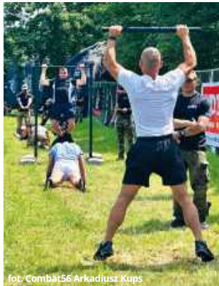
cy, analizując relacje z poprzednich edycji i budując zarówno formę fizyczną, jak i odporność psychiczną.

Zdaniem instruktorów współczesna młodzież często trenuje świadomie i systematycznie. Wielu kandydatów przygotowywało się do tego wydarzenia przez wiele miesięcy.