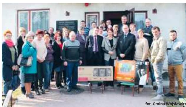
Uroczyste otwarcie świetlicy wiejskiej w Hucie miało miejsce w 2015 roku.

Zakres inwestycji obejmuje termomodernizację budynku, w tym ocieplenie ścian zewnętrznych oraz stropu sali świetlicowej, wykonanie nowego sufitu spełniającego wymagania przeciwpożarowe, odświeżenie wnętrza poprzez malowanie po-