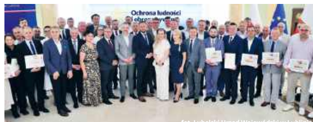
Rozdysponowano kolejną pulę środków na działania związane z ochroną ludności i obroną cywilną.

Jednym z największych beneficjentów programu zostało Starostwo Powiatowe w Chełmie. Samorząd otrzymał 792 589 zł, które zostaną przeznaczone na budowę magazynu obrony cy-