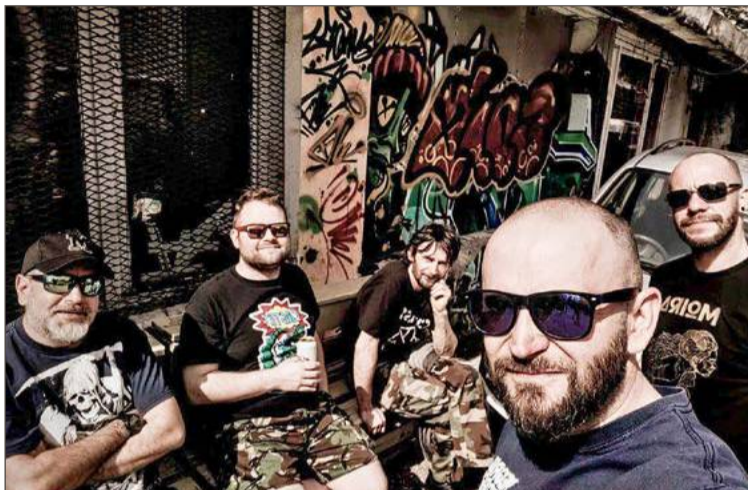
W zeszłym roku zespół koncertował m.in. w stolicy Bułgarii.

Trasę rozpoczynają 30 października koncertem w Krakowie. 21 listopada natomiast usłyszeć ich będzie mogła lokalna publiczność, bo w końcu wystąpią w Dębicy, ale o tej imprezie więcej napiszemy