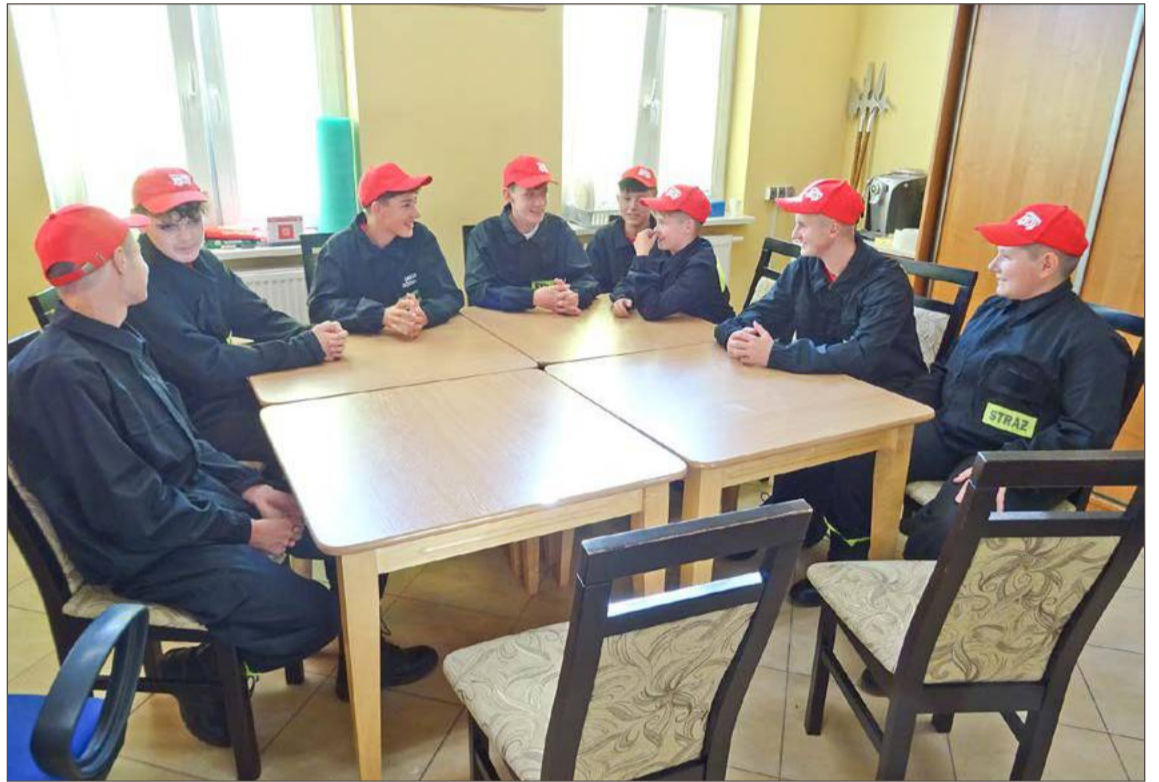
Nagrany przez członków MDP w Chotowej filmik o zmianach klimatu zajął pierwsze miejsce w konkursie.

Z kolei przed dwoma laty, po tym jak wichura przeszła nad gminą Czarna, najwięcej wyjazdów miała właśnie OSP Chotowa. Dla porównania w roku, kiedy tego zdarzenia