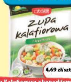
Zupa Kalafiorowa z koperkiem 450 g Spółem (10,42 zł/kg)