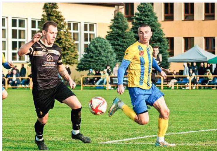
Derby gminy Czarna zakończyły się remisem.

Pozostałe wyniki: Victoria Czermin – Radomyślanka 0:6, Smoczanka Mielec – Dromader Chrzastów