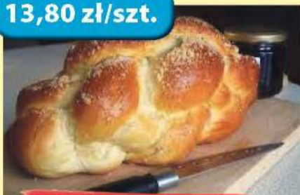
Chlebka 500 g Spółem - (27,60 zł/kg)