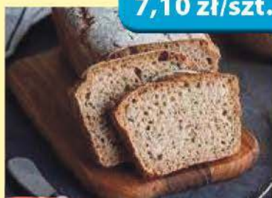
Chleb orkiszowy 450 g Spółem (15,78 zł/kg)