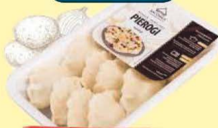
Pierogi ruskie 400 g Bacówka (41,23 zł/kg)