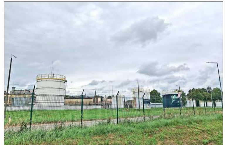
Zakład w Dębicy ma być zlikwidowany do końca 2026 roku.