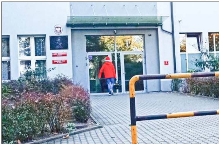
W ZS nr 2 w Dębicy edukacji zdrowotnej uczyć się będzie 13 uczniów.

Dębica może pochwalić się najwyższym odsetkiem uczniów, którzy zdecydowali się na EZ. Przedmiot ten wybrało 665 osób spośród 2383. Nie jest to może imponująca liczba, ale stanowi 27,9% tych, którzy mogliby uczyć się tego przedmiotu. Najwięcej chętnych było w SP nr 2 (61 uczniów – 49,6%), następnie: SP 12 (55 – 41,4%), SP nr 11 (107 – 34,3%), SP nr 6 (53 – 32,3%), SP nr 5 (183 – 32,2%), SP nr 10 (73 – 29,7%), SP nr 4 (50 – 24,9%), SP nr 8 (15 – 17%), SP nr 9 (57 – 15%). Najwięcej osób zrezygnowało z EZ w SP nr 3. Tam