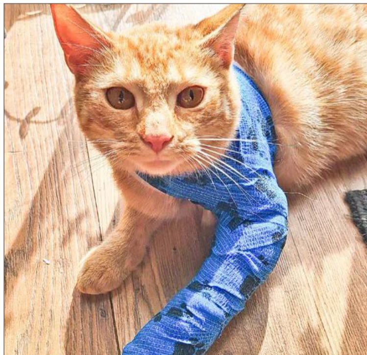
Kotka miała przestrzeloną jedną łapę i uszkodzoną drugą.

Sprawa oczywiście została zgłoszona na policję, co potwierdza