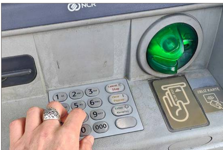
Kobieta wypłaciła z banku wszystkie pieniądze.

W przeciwieństwie do 65-latki, także mieszkanki miasta. Kobieta wypłaciła wszystkie pieniądze