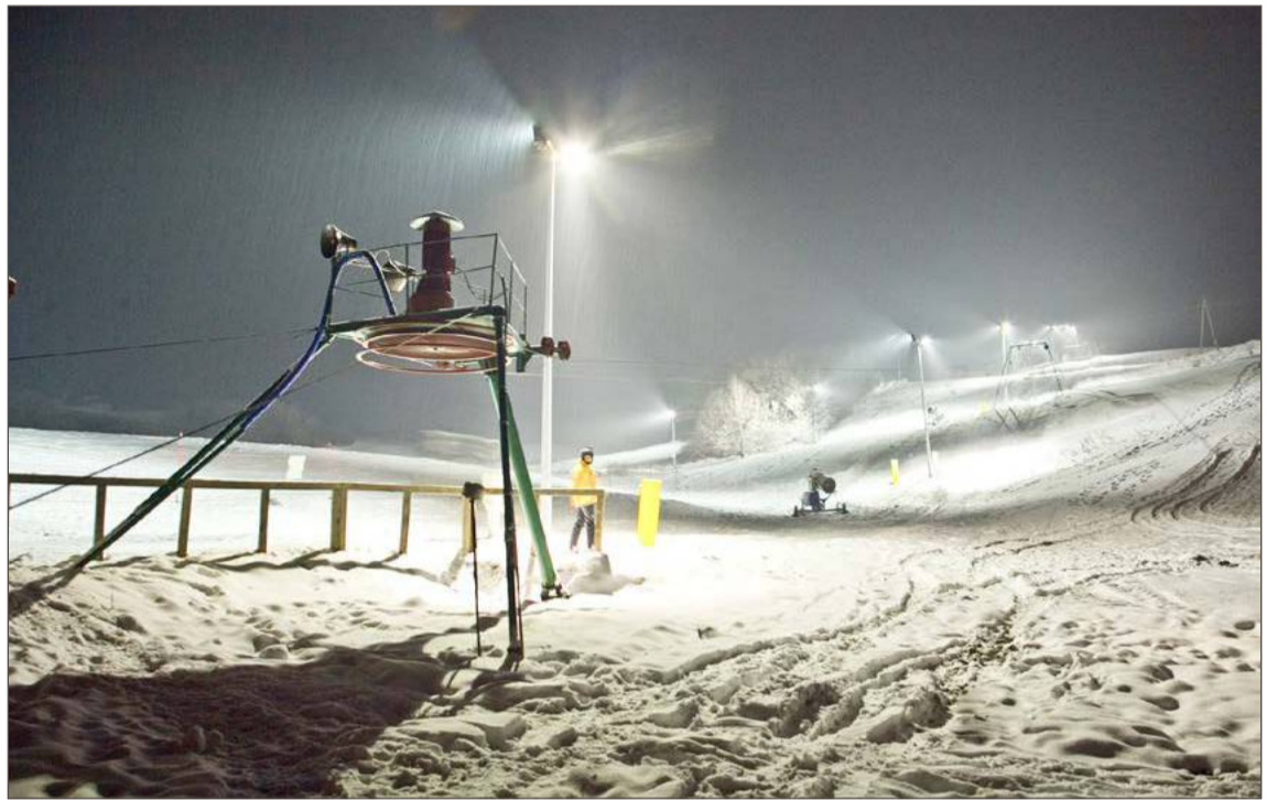
Taki śnieg na stoku narciarskim w Stobiernej to już niestety zamierzchnia przeszłość.

Urzednicy chcieliby poza tym, by działały tam: plac zabaw, ścieżki te-