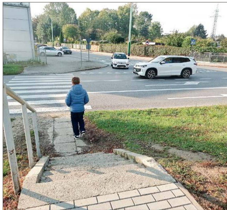
Mieszkańcom chodzi przede wszystkim o bezpieczeństwo dzieci.

Tymczasem za pieniądze z tego programu powiat chciałby całkowicie przebudować i doświetlić to przejście. Dyrektor deklaruje, że wiosną, bo wtedy jest nabór, po raz trzeci złoży wniosek o przyznanie rządowego wsparcia i jeśli się uda, to przejście zostanie przebudowa-