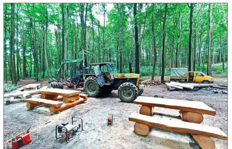
Na placu w lesie na Wolicy już stoi nowe wyposażenie.