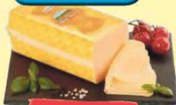
Ser Złoty Mazur