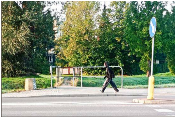
Z tej kładki korzystać nie można. Ale na rozbiórkę trzeba jeszcze poczekać.

Szef wydziału rozczaruje również tych, którzy liczyli, że u zbiegu Konarskiego, Staszica i Głowackiego, w miejsce starego, powstanie nowe przejście nad Potokiem Kawęckim.