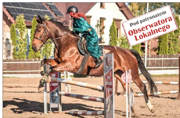
Memoriał odbędzie się w Ranczu Huculek.