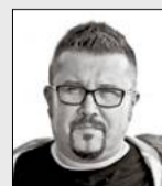
ratuszniak@ol.com.pl tel. 14 670 27 80