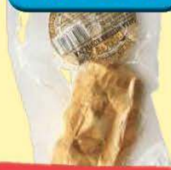
Gałka wędzona 180 g Balsar (66,61 zł/kg)