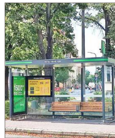
(nan) Takie same wiatki są w Krośnie.

Nowe budki na przystankach wykonane zostaną z bezpiecznych, klejonych szyb o grubości 8 mm. Będą wyposażone w duże, czytelne rozkłady jazdy oraz ławki z oparciami. W każdej wiacie z boku umieszczona zostanie dwustronna podświetlana gablota reklamowa. Na płaskim dachu zamontowany będzie panel fotowoltaiczny, od frontu umieszczona zostanie nazwa przystanku, ona również będzie podświetlona.