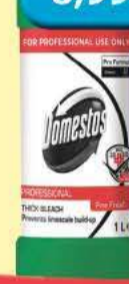
Płyn Domestos 1 l