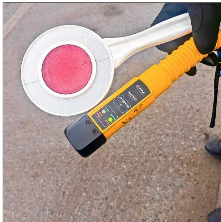
Dla mieszkanki Bobrowej to będzie kolejna wizyta w sądzie.