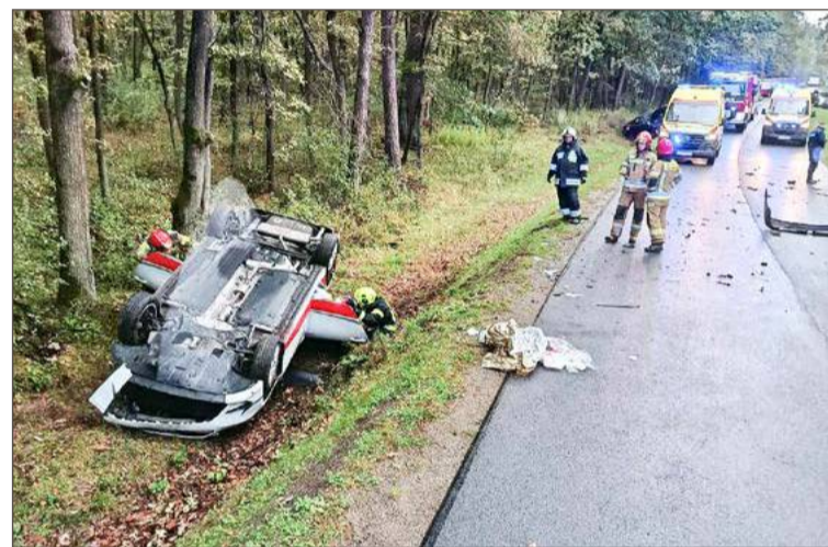
Kierująca kią została zabrana do szpitala.