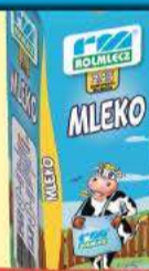
Mleko wiejskie 2% 1 l Rolmlecz