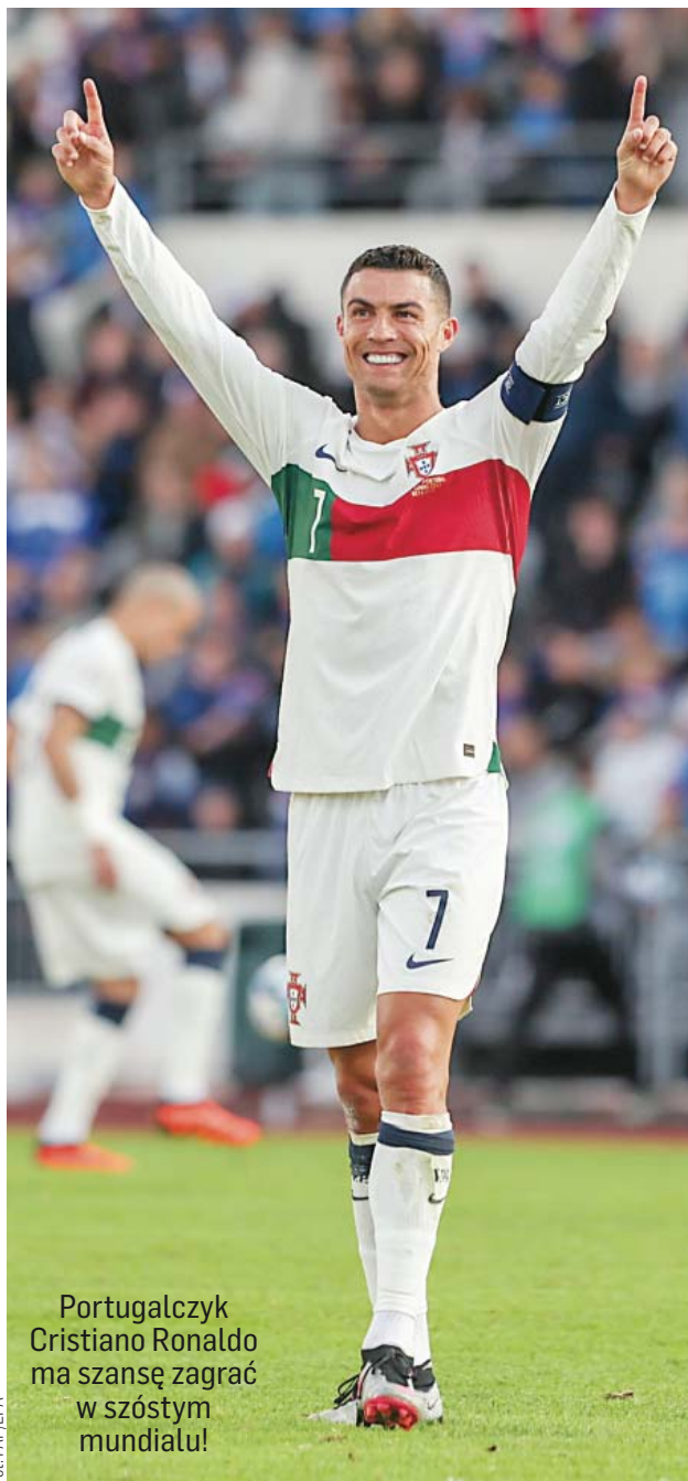
Portugalczyk Cristiano Ronaldo ma szansę zagrać w szóstym mundialu!

PIŁKA NOŻNA \\ Rekordowa liczba 48 drużyn i 104 meczów w ciągu 39 dni - w czwartek rozpoczyna się bezprecedensowa edycja mistrzostw świata w USA, Kanadzie i Meksyku. Olbrzymie są nie tylko oczekiwania i kaliber turnieju, ale też kontrowersje.