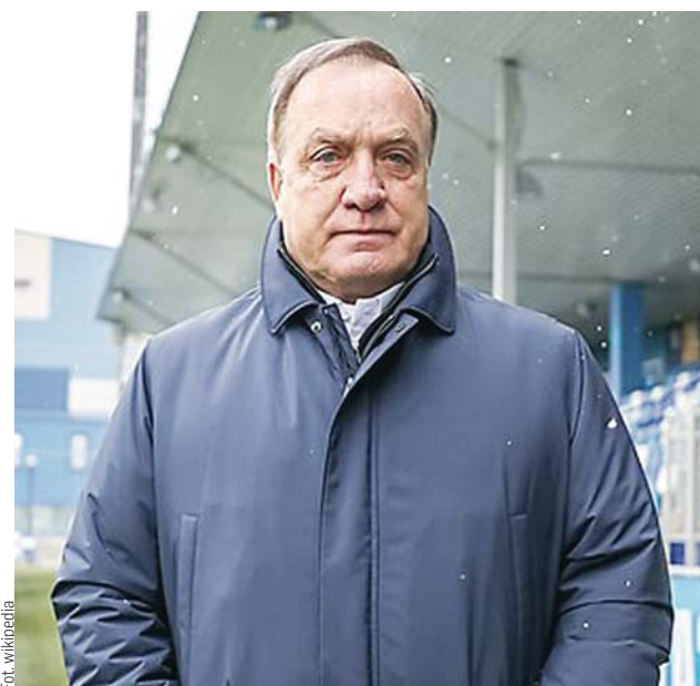
Karaibskich piłkarzy prowadzi Holender Dick Advocaat

Drużyna stała się reprezentacją wielopokoleniowej migracji: wyspy, jej potomków w Europie i zawodników, którzy w mundialu zobaczyli szansę na opowiedzenie własnej historii. Skalę zaskoczenia awansem Curaçao dobrze oddaje fakt, że rolę kibicowskiego hymnu przejęła „Mama Wa” („Mamo, patrz!”),