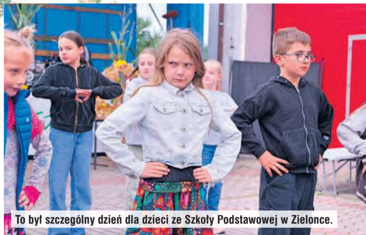
To był szczególny dzień dla dzieci ze Szkoły Podstawowej w Zielonce.