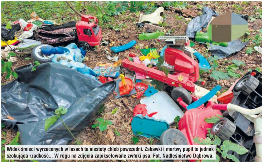
Widok śmieci wyrzuconych w lasach to niestety chleb powszedni. Zabawki i martwy pupil to jednak szokująca rzadkość... W rogu na zdjęciu zapikselowane zwłoki psa.