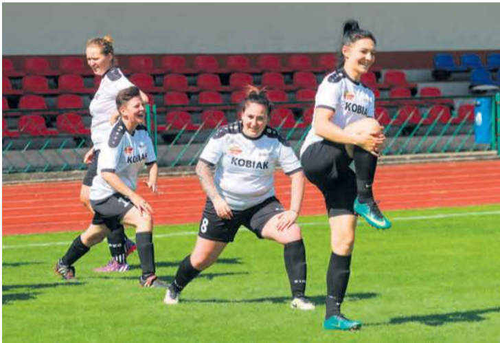
Rozgrzewka wywołała żarty, że już w tym momencie lekko nie jest, a trzeba przecieć rozegrać cały mecz.