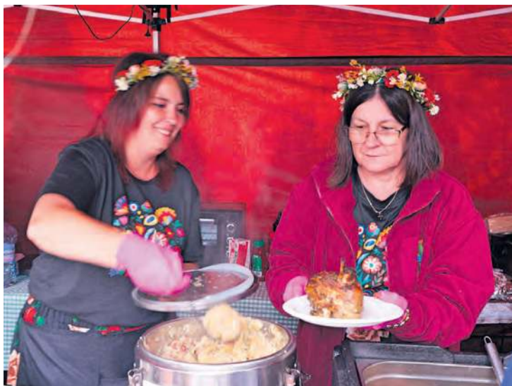
Ogromne golonki były warte spore pieniądze. Ale nie tym razem! Do stanowiska KGW Zdroje ustawiła się niekończąca się kolejka.

cyjny młody tancerz pochodzący z Zielonki), Świetlicowe Babeczki (grupa teatralna).