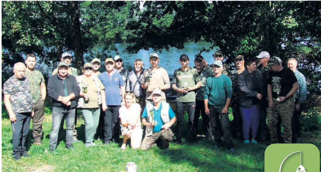
Choć wędkowanie to samotny sport, zawody integrują tę brać.