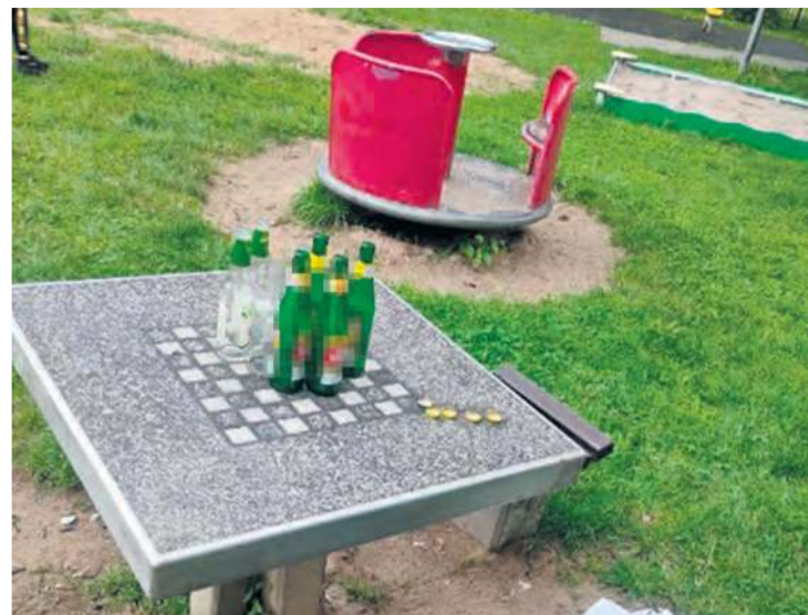
Butelki po alkoholu to standard na placu zabaw, który mieści się między ul. Dworcową a Garbary. Stał się on jest regularnym miejscem spotkań.

Zajrzeliśmy na osiedle Leśne. Prace porządkowe prowadziła akurat firma Sekwoja. Na tym bardzo przestronnym placu jest siedem elementów, głównie dla starszych dzieci i trzy stanowiska siłowni plenerowej. Z pewnością