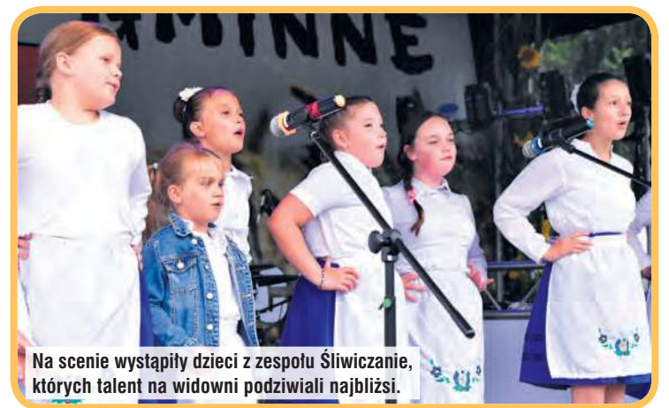
Na scenie wystąpiły dzieci z zespołu Śliwiczanie, których talent na widowni podziwiali najbliżsi.