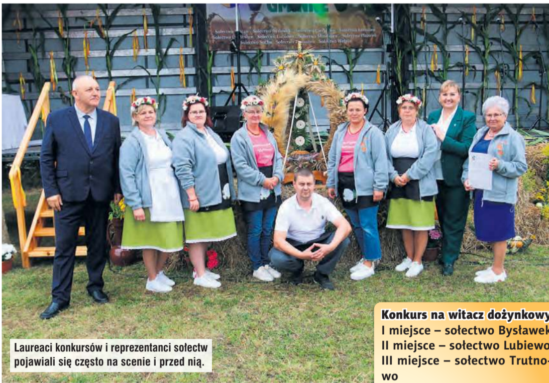
Laureaci konkursów i reprezentanci sołectw pojawiali się często na scenie i przed nią.