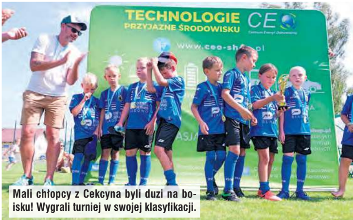
Mali chłopcy z Cękycyna byli duzi na boisku! Wygrali turniej w swojej klasyfikacji.

Warto podkreślić, że jubileusz rozpoczął się już w piątek (15 sierpnia) turniejem Kids Cup. Jak sama nazwa wskazuje, na boisko wybiegły młodzieńskie drużyny z roczników 2016/2017. Liczba ekip i klubów robiła duże wrażenie. Gdyby policzyć za-