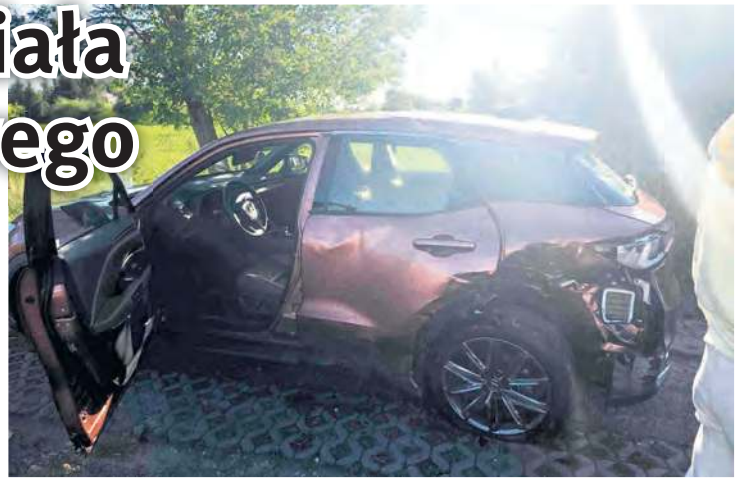
Z samochodem osobowym, który zaczął skręcać w lewo, zderzył się motocykl.