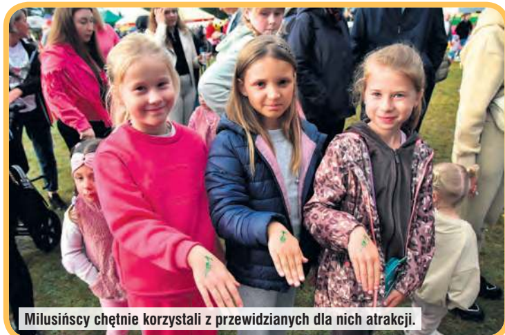
Milusińscy chętnie korzystali z przewidzianych dla nich atrakcji.