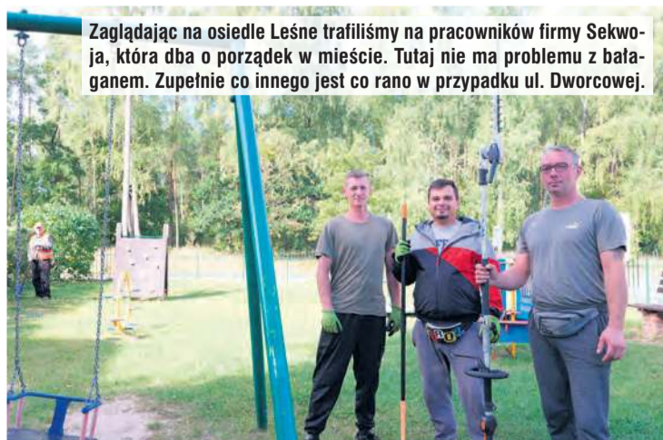
Zaglądną na osiedle Leśne trafiliśmy na pracowników firmy Sekwoja, która dba o porządek w mieście. Tutaj nie ma problemu z bałaganem. Zupełnie co innego jest co rano w przypadku ul. Dworcowej.

Projekt w ramach Lokalnej Strategii Rozwoju na lata 2023-2029 „Chochla do borowiackiej grapy”, wdrażanej przez Partnerstwo „Lokalna Grupa Działania Bory Tucholskie”