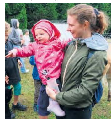
Alpaki cieszyły się zainteresowaniem najmłodszych. Przyciągały jak magnes.

też brokatowe tatuaże i plectenie warkoczyczków. Dzięki tej różnorodności nie miał prawa sprawdzić się znany cytat z piosenki, że w czasie deszczu dzieci się nudzą. Jeśli mowa o najmłodszych, warto zwrócić