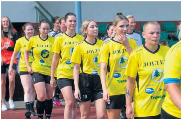
Wiele dziewcząt czekało na ponowne spotkanie. Tego dnia żyły wspomnieniami.

dziś żony, matki – przyjechały z bardzo daleka, by uściskać się i wspomnieć czas własnej, sportowej chwały.