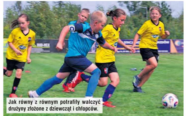
Jak równy z równym potrafiły walczyć drużyny złożone z dziewcząt i chłopców.

bo dzieciaki grające mecze dawały z siebie wszystko. Wśród młodszych dochodziło nawet do meczów derbowych, jak np. małych gospodarzy z Rawysa i szybko rozwijającej się młodzieżowej kadry Cisa Cękycyn. Całe raciąskie zawody na Stadionie Leśnym okazały się wyrównane, bo o ostatecznych klasyfikacjach decydowały różnice bramek czy bezpośrednio meczów. Najważniejsza, dla piłkarzy i piłkarek w takim wieku,