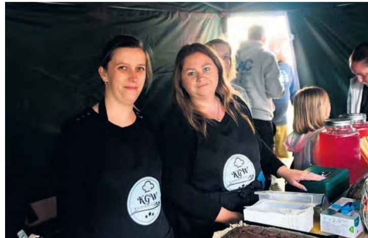
O to, żeby z dożynek nikt nie wyszedł głodny, dbały panie z trzech KGW: Kamienicy, Przyrowy oraz Gostycyna .