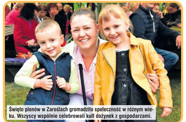
Święto plonów w Zaroślach gromadziło społeczność w różnym wieku. Wszyscy wspólnie celebrowali kult dożynek z gospodarzami.