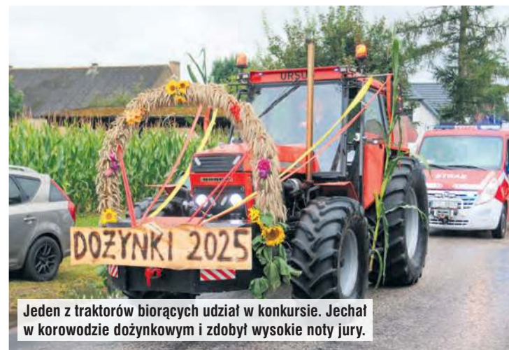
Jeden z traktorów biorących udział w konkursie. Jechał w korowodzie dożynkowym i zdobył wysokie noty jury.

Nie tylko o koniach mechanicznych można mówić w związku z dożynkami. Dzieci wyrażające chęć jazdy na koniu gnały rodziców na łączkę przy parkingu, gdzie