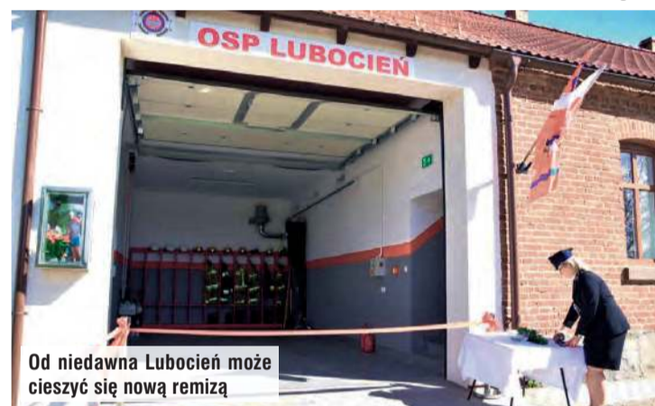
Od niedawna Lubocień może cieszyć się nową remizą