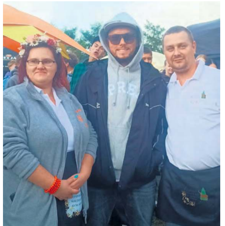
Gospodarze dożynek, którzy doskonale znają się na kulinariach, z przyjemnością pozowali do zdjęć z niespodziewanym gościem, który zdobył popularność w internecie właśnie kulinarnymi recenzjami.

Wizyta takiego człowieka na dożynkach gminnych sprawiła, że wszystkie KGW poczuły się jeszcze bardziej w centrum uwagi niż zwykle. Odwiedziny youtubera nie pozostały niezauważone. Wielu ludzi stawało do zdjęć z gościem, a ten niejednokrotnie podchodził do stoisk gospodyń i smakował ich wyrobów. Książuło, wedle potwierdzonych