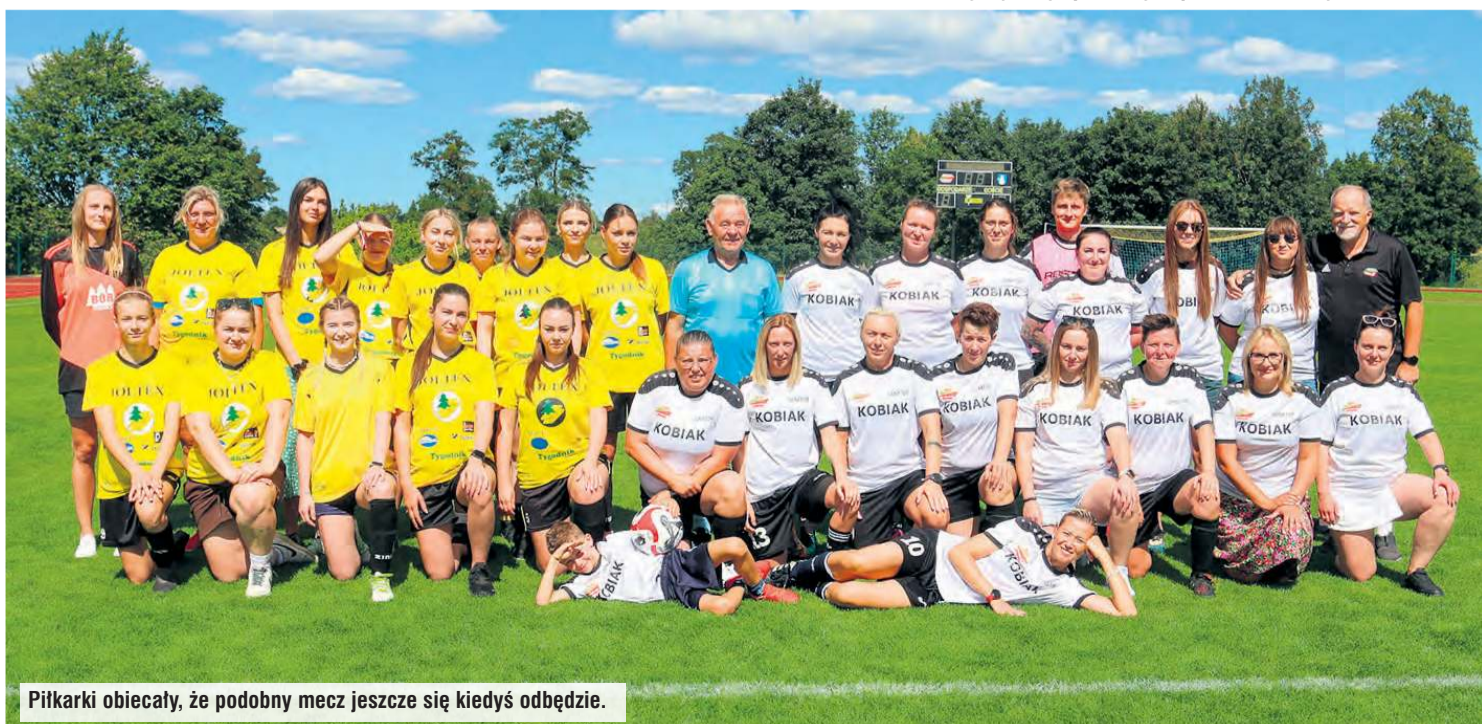
Piłkarki obiecały, że podobny mecz jeszcze się kiedyś odbędzie.