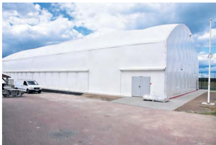
Wydaje się, że prace w Lińsku dobiegają końca.