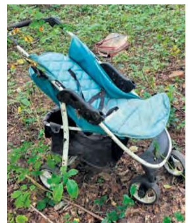
Wśród wyrzuconych śmieci nie tylko zabawki, ale i dziecięcy wózek.