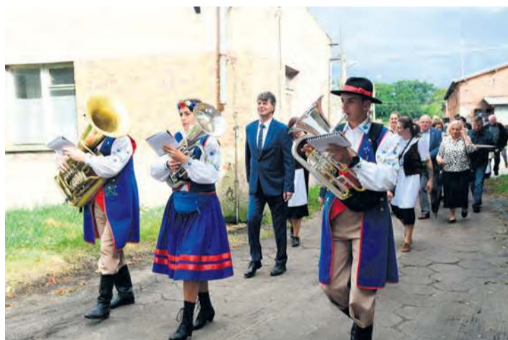
Kapela Kaszubska Tuba Band najpierw wzięła udział w pochodzie, potem wystąpiła na scenie.