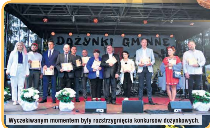
Wyczekiwany moment były rozstrzygnięcia konkursów dożynkowych.

dzą 30-hektarowe gospodarstwo rolne, nastawione na produkcję zwierzęcą. Następnie wódarz, wraz z małżeństwem i sołtysami wsi organizujących dożynki, podzielił chleb upieczony z tegorocznych ziaren. Pieczywo powędrowało do każdej chętej osoby.