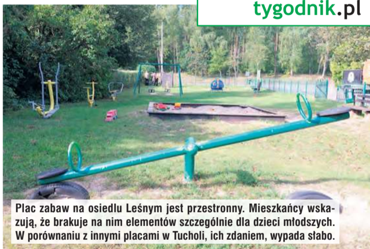
Plac zabaw na osiedlu Leśnym jest przestronny. Mieszkańcy wskazują, że brakuje na nim elementów szczególnie dla dzieci młodszych. W porównaniu z innymi placami w Tucholi, ich zdaniem, wypada słabo.

W ostatnich dniach na tapetę trafił też plac zabaw na osiedlu Leśnym, który mieści się na rogu ul. Leśnej i Rogali. Okaza