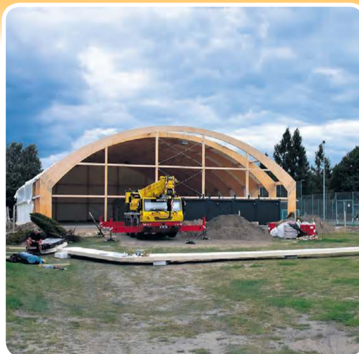
Według docierających do nas informacji prace w Śliwicach prowadzone były nawet w ostatnią niedzielę – 24 sierpnia.

Podobny zakres działań dotyczy inwestycji przy Szkole Podstawowej w Śliwicach. Dodatkowo, według specyfikacji warunków zamówienia dołączonej do ogłoszenia przetargowego, wykonawca ma tam za zadanie budowę