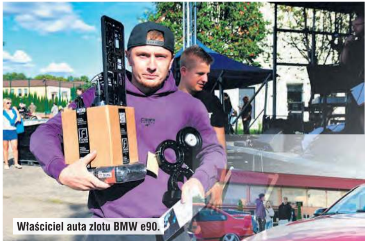
Właściciel auta zlotu BMW e90.