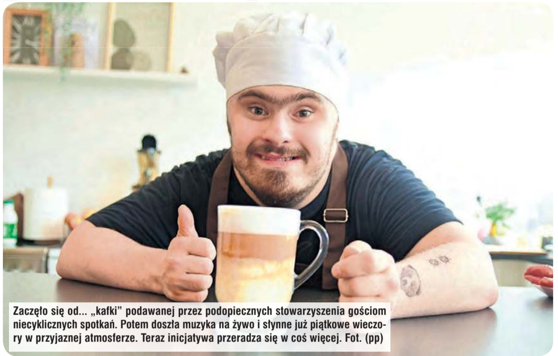
Zaczął się od... „kafki” podawanej przez podopiecznych stowarzyszenia gościom niecyklicznych spotkań. Potem doszła muzyka na żywo i słynne już piątkowe wieczory w przyjaznej atmosferze. Teraz inicjatywa przeradza się w coś więcej.

Pieniądze chcemy przeznaczyć na zakup działki pod budowę siedziby naszego stowarzyszenia, bo takowej na razie nie posiadamy, a mamy pewne konkretne plany. Potrzebne jest nam takie miejsce. W siedzibie można byłoby prowadzić między innymi opiekę wytchnieniową dla rodziców – wyjaśnia w rozmowie z „Tygodnikiem