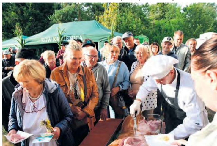
Kulinarnej niespodzianki wystarczyło dla każdego.

Pogoda w poprzedni weekend nie rozpieszczała i nie da się ukryć, że w pochodzie nie wzięło udziału zbyt wiele osób. Za to przed pałacem frekwencja była już dużo lepsza. Część mieszkańców wybrała się od razu na główny plac, część