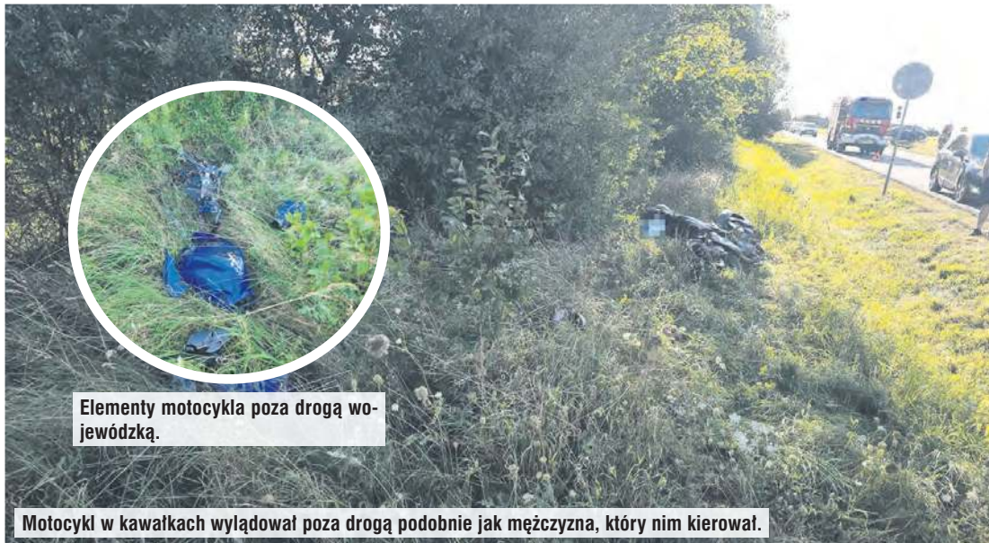
Elementy motocykla poza drogą wojewódzką.