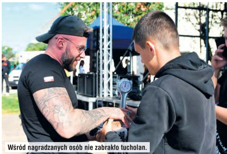
Wśród nagradzanych osób nie zabrakło tucholan.