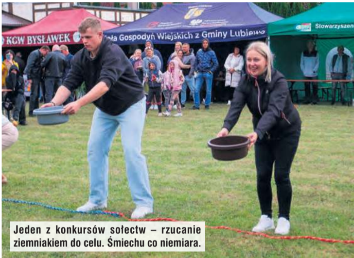
Jeden z konkursów sołectw – rzucanie ziemniakiem do celu. Śmiechu co niemiara.

pełnie rozrywkowe i wywołujące salwy śmiechu podczas kibicowania. W trakcie obchodów dożynek rozwiązano konkurs na witacz i ciągnik ozdobny. Po odczytaniu wyników zapraszano laureatów na scenę i nikt nie schodził z niej z pustymi rękami. Nagrodzeni przewijali się na scenie i pozowali do zdjęć, ale to nie wszystko. Zanim DJ Budzik dał sygnał do zabawy tanecznej, organizatorzy przeprowadzili pięć konkursów dla