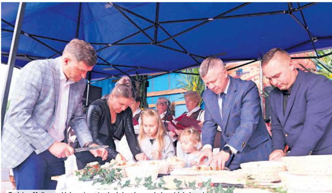
Rodzina Maliszewskich – starostowie dożynek – z władzami lokalnymi przygotowuje się do dzielenia chleba wśród uczestników święta plonów.

– Na szczególną uwagę zasługują wyniki produkcyjne w uprawie kukurydzy, ponieważ często