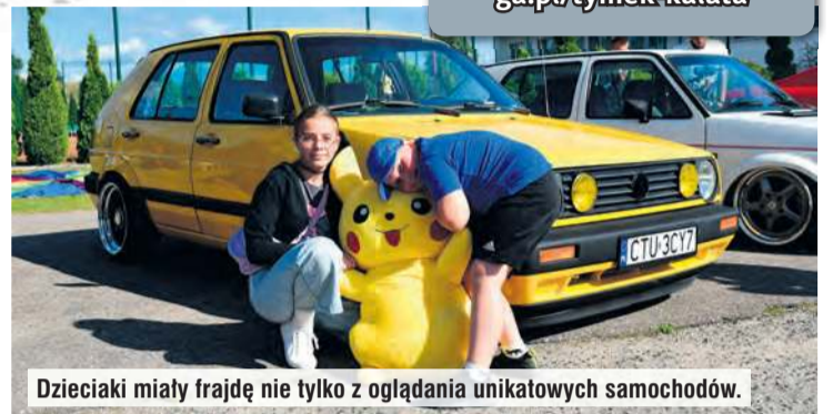
Dzieciaki miały frajdę nie tylko z oglądania unikatowych samochodów.