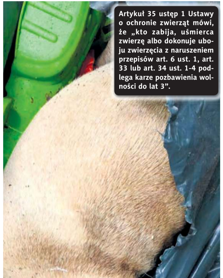
Leśnicy opublikowali fragment sierści martwego czworonoga licząc, że osoby czytające post, skojarzą zaginięcie psa o takiej maści, jak na zdjęciu.

Artykuł 35 ustęp 1 Ustawy o ochronie zwierząt mówi, że „kto zabija, uśmierca zwierzę albo dokonuje uboju zwierzęcia z naruszeniem przepisów art. 6 ust. 1, art. 33 lub art. 34 ust. 1-4 podlega karze pozbawienia wolności do lat 3”.