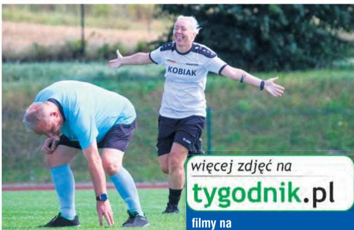
Satysfakcja po голу wciąż taka sama.