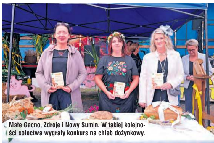
Małe Gacno, Zdroje i Nowy Sumin. W takiej kolejności sołectwa wygrały konkurs na chleb dożynkowy.