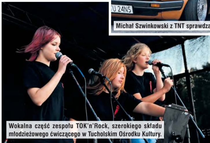
Wokalna część zespołu TOK'n'Rock, szerokiego składu młodzieżowego ćwiczącego w Tucholskim Ośrodku Kultury.