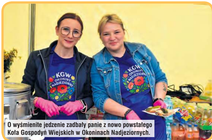
O wysmienite jedzenie zadbały panie z nowo powstałego Koła Gospodyń Wiejskich w Okoninach Nadjeziornych.