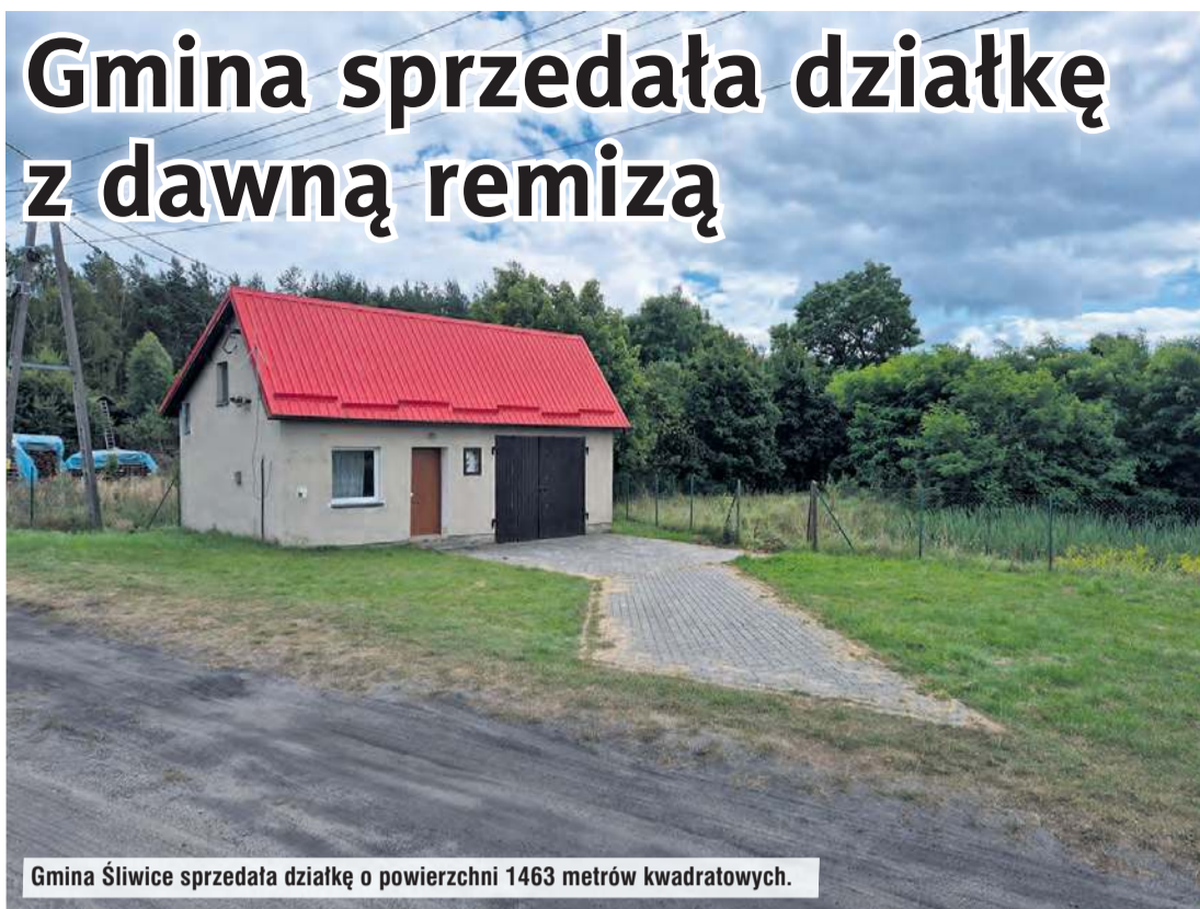
Gmina Śliwice sprzedała działkę o powierzchni 1463 metrów kwadratowych.

Chodzi o działkę zabudowaną budynkiem dawnej remizy Ochotniczej Straży Pożarnej w Lubocieniu. Było dwóch chętnych do jej zakupu.