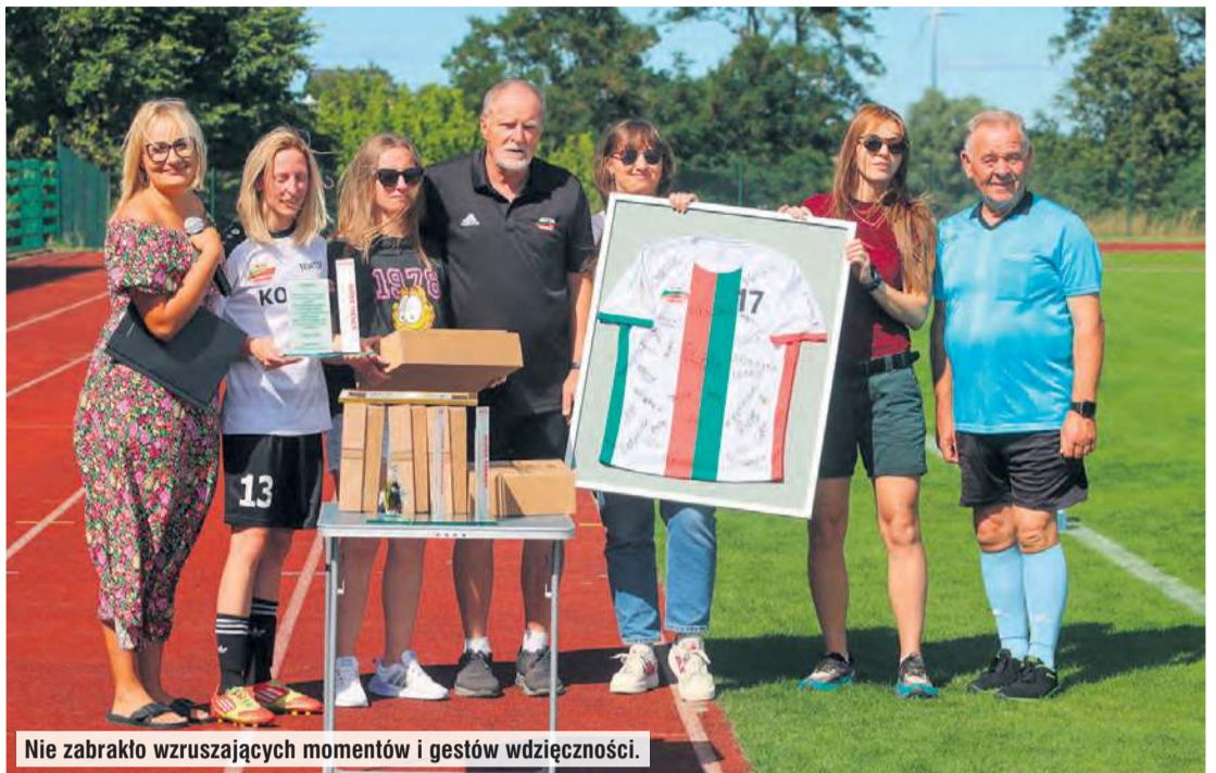
Nie zabrakło wzruszających momentów i gestów wdzięczności.