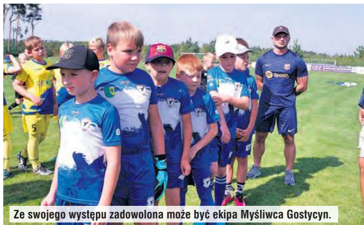
Ze swojego występu zadowolona może być ekipa Myśliwca Gostycyn.

wodniczki i zawodników, przez cały piątek grało ich na Stadionie Leśnym ok. 300! Za drużynami przybyli rodzice/kibice, a cała impreza miała charakter bardzo sympatycznego pikniku. W jego programie znalazła się sprzedaż losów na loterię, które szły jak burza. Poczęstunek